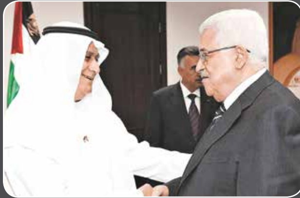
الرئيس الفلسطيني محمود عباس مصافحاً المغفور له احمد يوسف بهبهاني

العربية، وحصل على شهادة ليسانس الآداب - قسم التاريخ عام 1970.