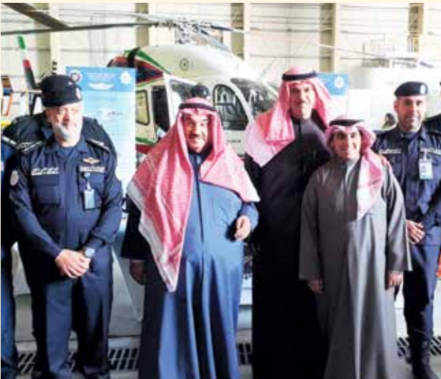
سمو الشيخ ناصر المحمد والشيخ سلمان الحمود وناصر أحمد ناصر المحمد الصباح والعقيد ابراهيم الخليل والعقيد احمد خان