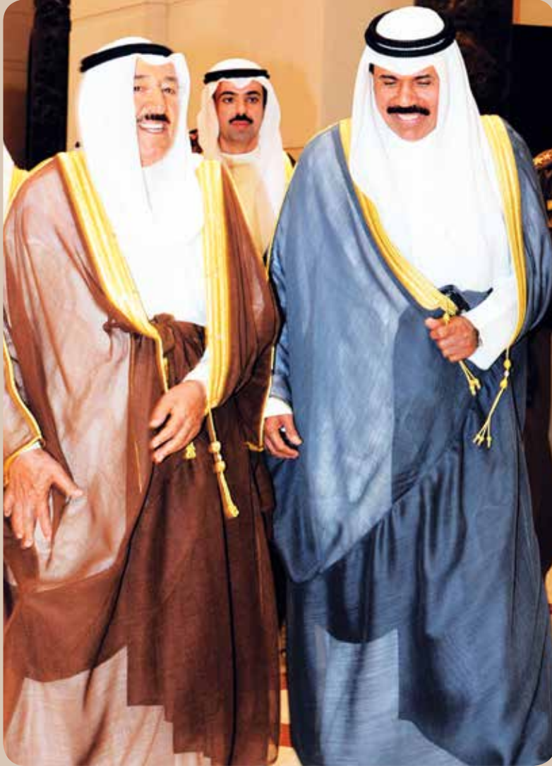
صاحب السمو الأمير الشيخ صباح الأحمد وسمو ولي العهد الشيخ نواف الأحمد

سمو الأمير : مسيرة سمو ولي العهد حافلة بالتفاني والعطاء الدائم في خدمة وطننا الغالي وشعبنا الكريم