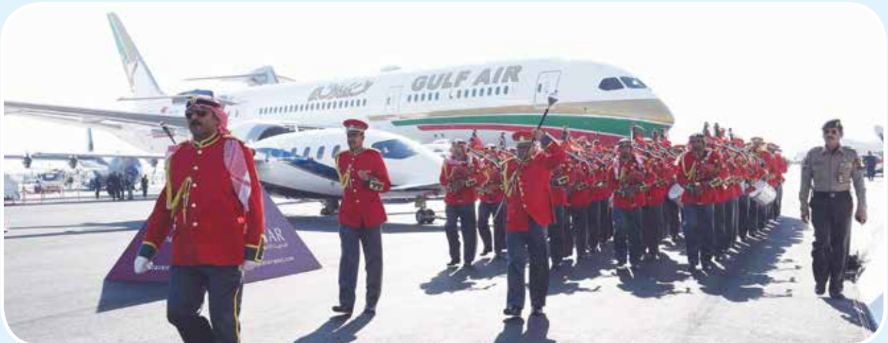
مشاركة متميزة لطيران الخليج

وأضاف المحميد أن هذه التحديثات تأتي بالتوافق مع السياسات والإرشادات العالمية المعتمدة من اتحاد النقل الجوي الدولي (IATA) والمنظمة الدولية للنقل الجوي (ISAGO)، وبما يسهم في تطوير وتعزيز مكانة الشركة على المستوى المحلي والإقليمي. وأشار المحميد أن استراتيجية (باس) تتلائم مع توجه الحكومة لتحقيق نمو الاقتصاد الوطني، وبما يتوافق مع أهداف رؤية البحرين الاقتصادية 2030، خصوصا أن التركيز مع بداية العام الجديد 2020 سيكون على افتتاح مشروع تحديث مطار البحرين الدولي والبعد العالمي والتموي له بما يعزز مكانة البحرين العالمية. يذكر أن شركة خدمات مطار البحرين (باس) ومنذ تأسيسها عام 1977، تمتلك سجلا حافلا من العطاء المتواصل، وهي المشغل الوحيد للخدمات الأرضية في مطار البحرين الدولي منذ إنشائه.