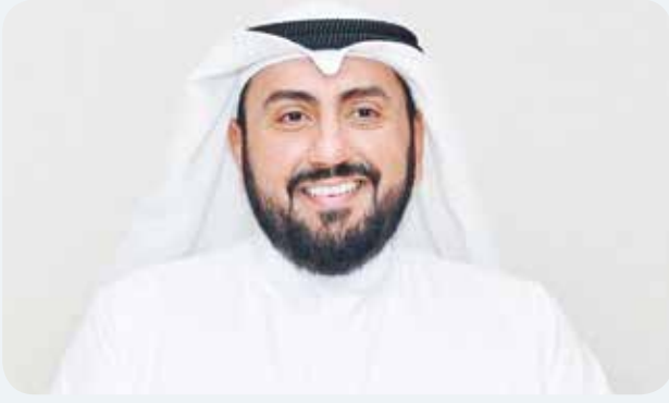
وزير الصحة الشيخ د. باسل الصباح

كما عادت الحركة لشوارع العاصمة الكويت بعد ركود خلال الفترة السابقة، وإن لم تصل إلى حالتها الطبيعية والازدحام المعتاد وأكدت مصادر في وزارة الصحة وجود لجنة مختصة بمتابعة تطبيق الاشتراطات الصحية الوقائية لفيروس كورونا، في الجهات الحكومية والقطاع الخاص التي استأنفت أعمالها خلال المرحلة الثانية من مراحل العودة إلى الحياة الطبيعية تدريجياً، وبنسبة 30% من طاقتها، بهدف رصد مدى التزام تلك الجهات بالاشتراطات على ارض الواقع، ولضمان عدم انتقال العدوى بين صفوف الموظفين او مراجعيها.