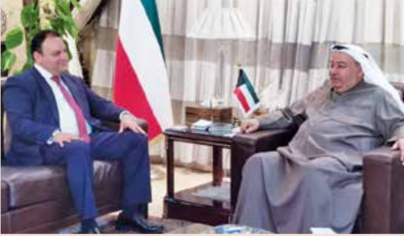
السفير محمد صالح الذويخ مستقبلا المستشار أحمد الأنصاري أمين رئاسة الجمهورية في مصر

استقبل سفير الكويت لدى جمهورية مصر العربية السفير محمد صالح الذويخ المستشار أحمد الأنصاري، أمين رئاسة الجمهورية في مصر الذي نقل تهنئة الرئيس المصري عبدالفتاح السيسي إلى صاحب السمو الأمير الشيخ صباح الأحمد، وحكومة وشعب الكويت بمناسبة الأعياد الوطنية والاحتفالات بالذكرى 59 للاستقلال والذكرى 29 للتحريك.