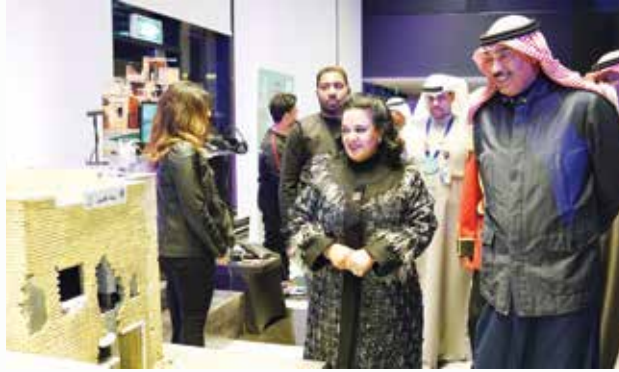
سمو الشيخ صباح الخالد امام مجسم لبيت القرين بحضور فاطمة الأمير