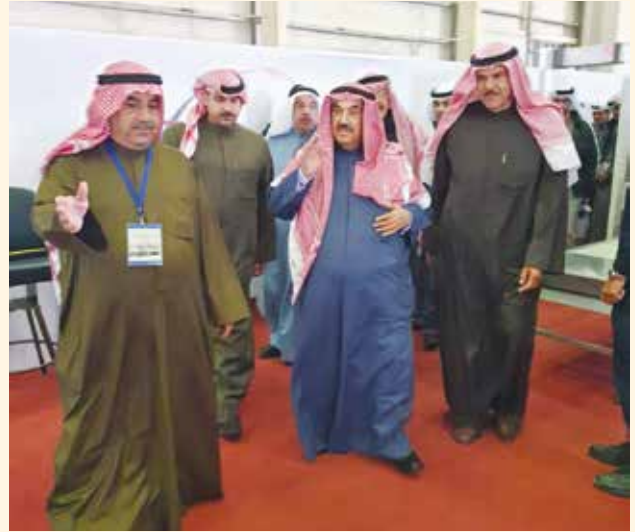
سمو الشيخ ناصر المحمد و الشيخ سلمان الحمود وأحمد اسماعيل بهبهاني