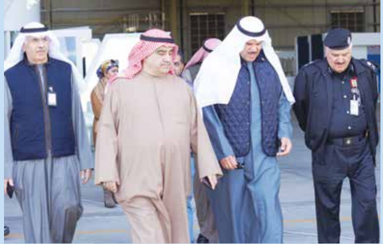
رئيس الطيران المدني الشيخ سلمان الحمود يتوسط وكيل وزارة الداخلية المساعد لشؤون أمن المنافذ اللواء منصور العوضي ورئيس اللجنة المنظمة أحمد اسماعيل بهبهاني وعزت العريان