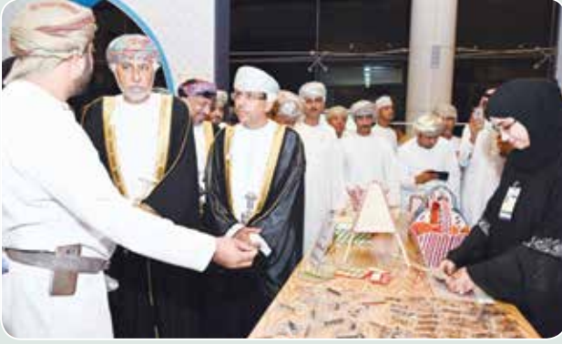
صاحب السمو شهاب بن طارق ود.عبدالمنعم الحسني امام أحد الأجنحة المشاركة