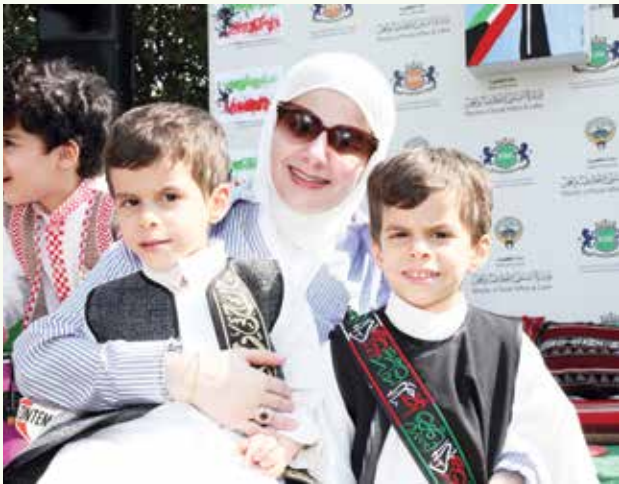
مشاركة الأمهات فرحة الاعياد الوطنية

احتفلت مجموعة الملكية البريطانية للتعليم (حضانة الملكية البريطانية للتعليم المبكر وحضانة الملكية البريطانية لذوي الاحتياجات الخاصة) بالعيد الوطني وذكرى التحرير حيث أقامت الحضانة العديد من الأنشطة الهادفة والممنوعة والتي تعزز انتماء الأطفال لوطنهم وتعرفهم على تراث الكويت العريق.