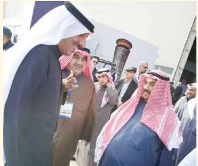
سمو الشيخ ناصر المحمد ومرزوق الخرافي وأحمد اسماعيل بهبهاني وناصر أحمد ناصر المحمد الصباح