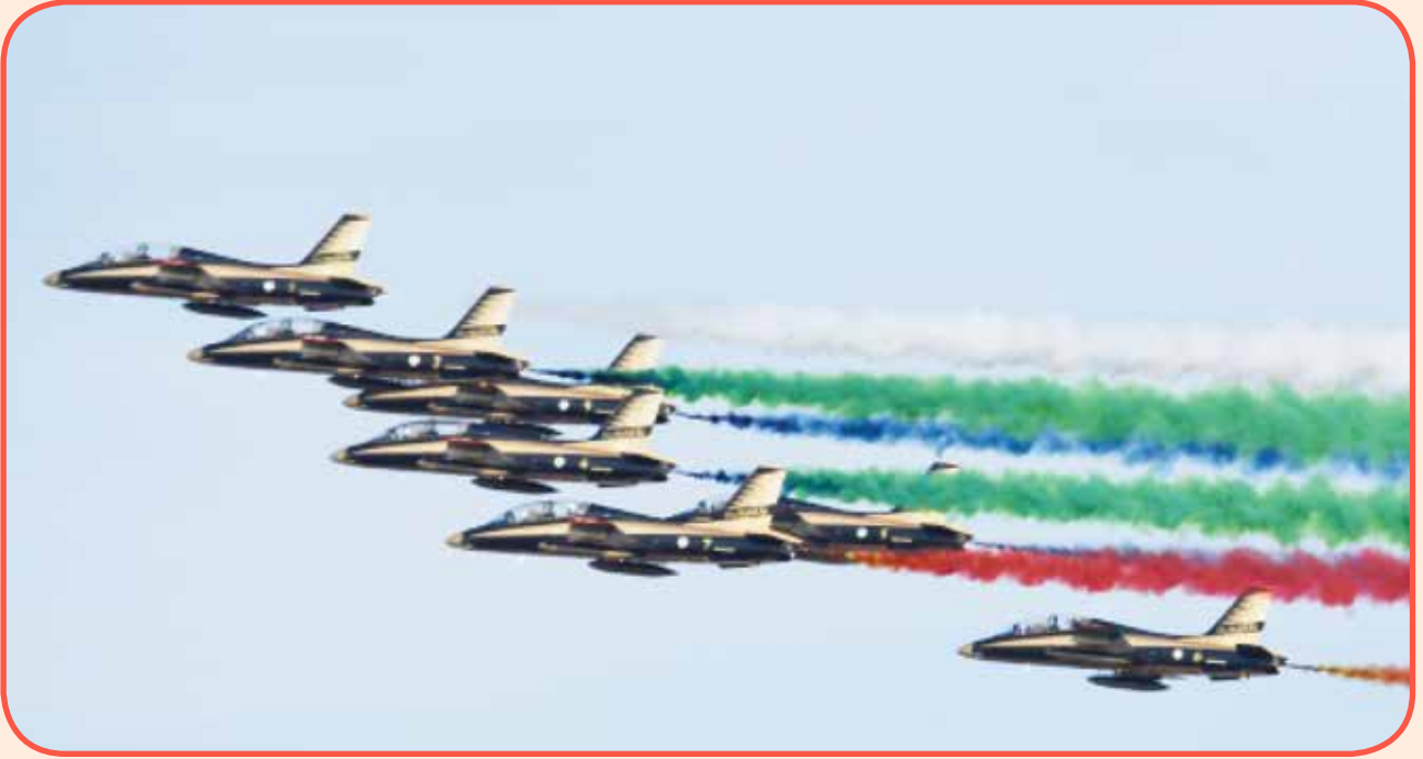
عروض رائعة لفريق فرسان الامارات