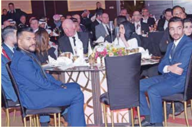
وفد مجموعة الزياتي