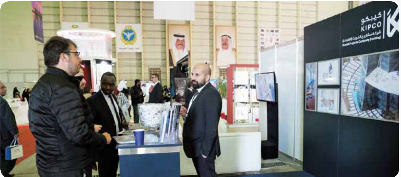
جناح شركة «كيبكو» بالمعرض

** الربيعي: «برقان» ملتزم بدعم المبادرات الوطنية التي تدعم رؤية كويت جديدة 2035