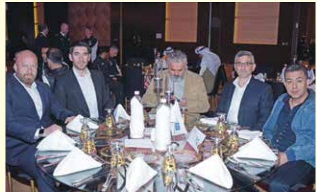
وفد شركة لماك بلس