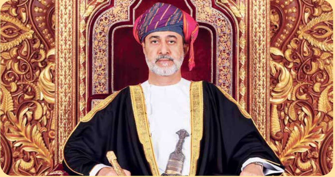
صاحب الجلالة السلطان هيثم بن طارق