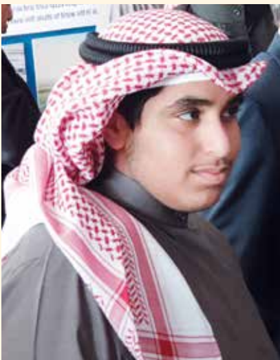
ناصر أحمد ناصر المحمد الصباح