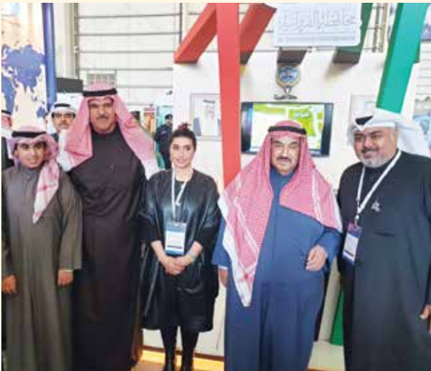
سمو الشيخ ناصر المحمد و الشيخ سلمان الحمود وناصر أحمد ناصر المحمد الصباح وم. علي عيسى أكبر ودلال القطان في جناح محافظة الفروانية