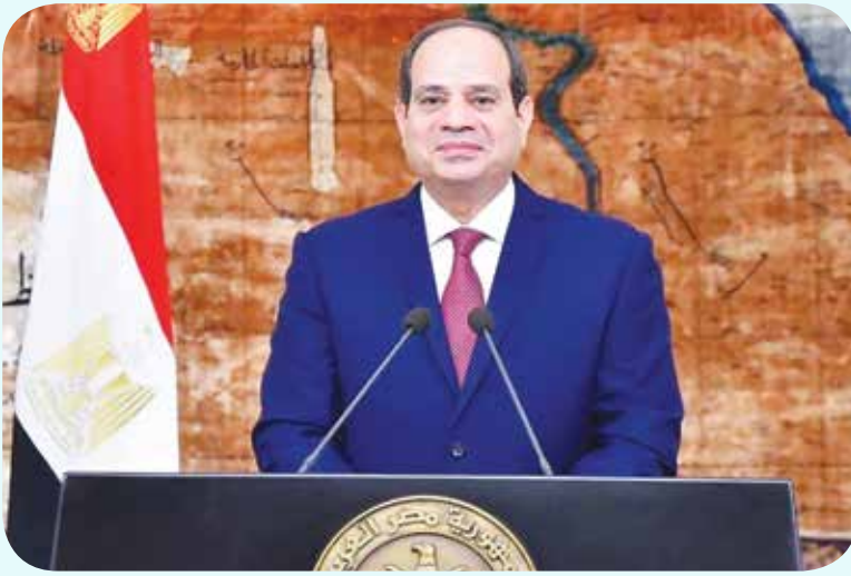
الرئيس المصري عبدالفتاح السيسي

** ماضون علمه عهدنا نحمي وطننا ونجدد عهدنا بأننا لن نفرط فيه حق من حقوقه