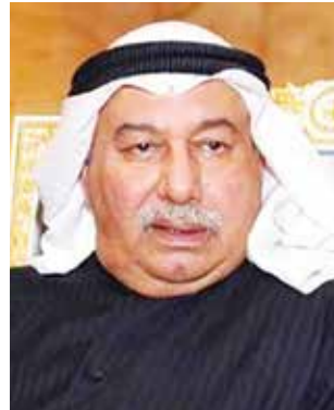
السفير محمد صالح الذويخ