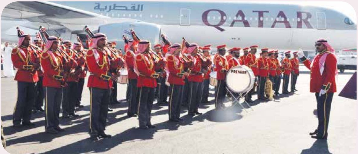
عرض موسيقي لفرقة الجيش الكويتي الموسيقية

وفيما يتعلق بخسائر «القطرية» نتيجة الحصار الحالي المفروض عليها، أكد الباكر أن الشركة أعلنت العام الماضي عن خسائر بواقع 634 مليون دولار، وهو المبلغ الذي يعادل نصف الخسائر المتوقعة آنذاك، مضيفا