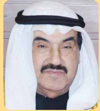
سمو الشيخ ناصر المحمد