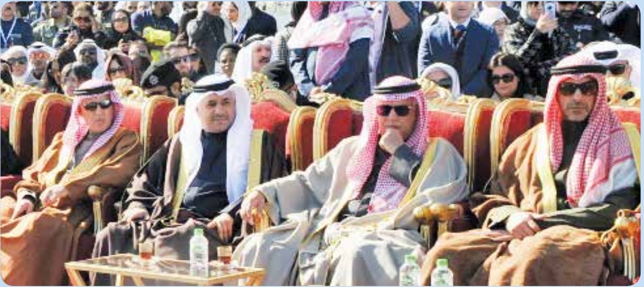
ممثل صاحب السمو نائب وزير شؤون الديوان الأميري الشيخ محمد العبدالله، ووزير الدولة لشؤون الخدمات وزير الدولة لشؤون مجلس الأمة مبارك الحريص ووزير المواصلات والاتصالات البحريني كمال بن أحمد محمد ووزير الصناعة والتجارة والسياحة البحريني زايد الزباني

الطيران المدني والعسكري في المنطقة بشكل خاص وفي العالم بشكل عام.