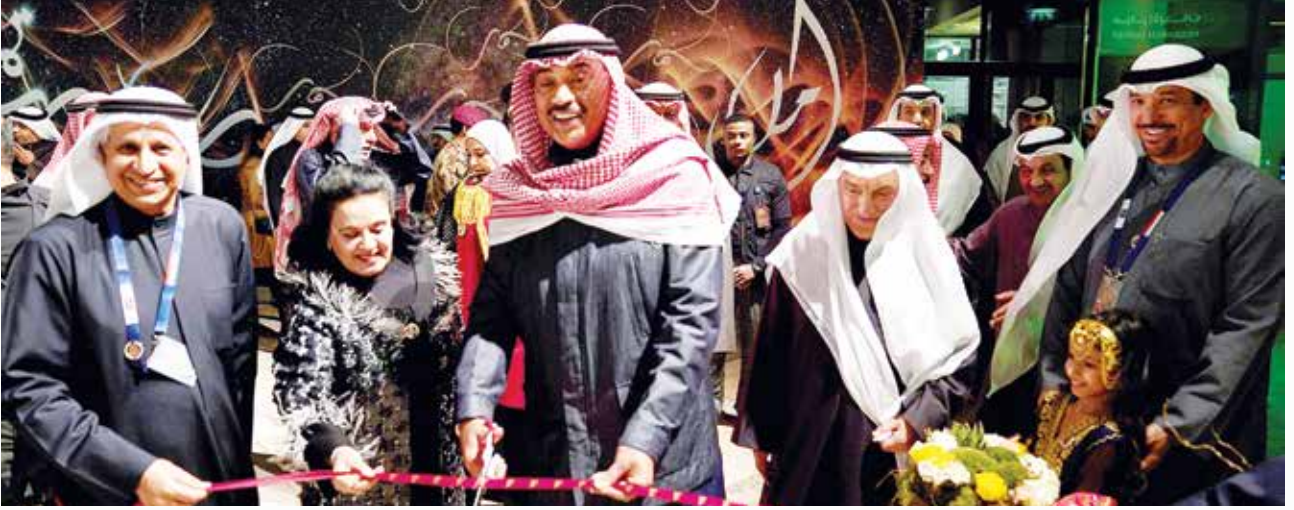
سمو الشيخ صباح الخالد خلال افتتاح مهرجان «حنا لها» بحضور فاطمة الأمير والمستشار محمد أبو الحسن وصلاح العوفان