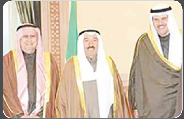
صاحب السمو الشيخ صباح الأحمد يتوسط وزير الاعلام السابق الشيخ سلمان الحمد والمغفور له احمد يوسف بهبهاني