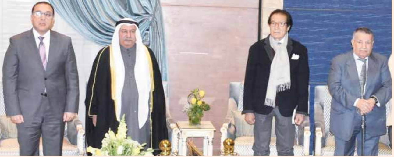
رئيس مجلس الوزراء المصري د. مصطفى مدبولي والسفير محمد صالح الذويخ ووزير الثقافة الأسبق الفنان فاروق حسنى ورئيس غرفة تجارة وصناعة الكويت السابق علي الغانم