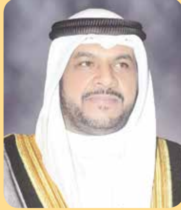
الشيخ أحمد المنصور