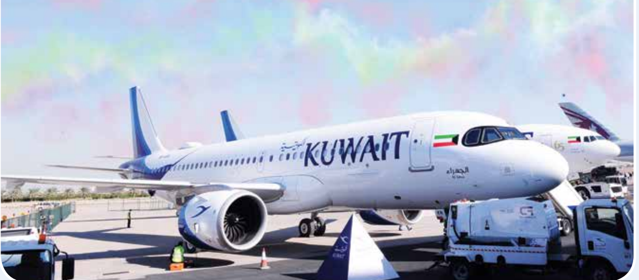
طائرة البوينغ B777-300ER خلال المعرض