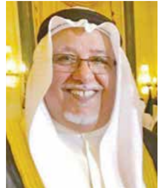
الشيخ علي الجراح

الصحافة، حيث عبروا عن اعتزازهم بطرحها الموضوعي للقضايا التي تهم الناس بعيداً عن الإثارة وبأسلوب حيادي، مشيرين إلى أن ما يميز «الخليج» أنها تحرص على إعلاء مصالح الوطن والدفاع عن قضايا الكويت، وتكرس قيم العدالة والحرية والديموقراطية، وفيما يلي يسطر معجبو مجلة «الخليج» كلماتهم: