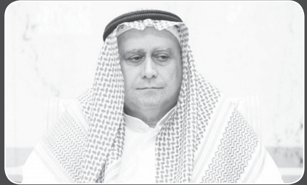
المغفور له احمد يوسف بهبهاني

بعد مسيرة مهنية حافلة فقدت الكويت أحد رواد الإعلام والاقتصاد ، أحمد يوسف بهبهاني، عن عمر يناهز 79 عاما ، تقلد خلالها العديد من المناصب وكانت له بصماته الواضحة في القطاع المصرفي ومجال الإعلام حيث كان - رحمه الله - أول كويتي وخليجي يتراأس اتحاد الصحفيين العرب، كما شغل منصب رئاسة جمعية الصحفيين لأكثر من 29 عاما ، وعرف عن الراحل تواضعه وبساطته وعطائه ، ولم يعرف عنه الدخول في معارك أو مهارات سياسية بالمطلق، ولم يدخل في سجلات أو ردود مع أحد حتى الذين يهاجمونه يبتعد عنهم ترفعا منه .