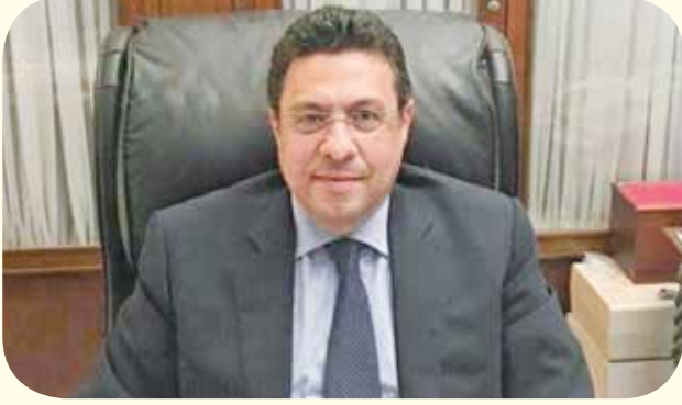
السفير المصري طارق القونني

العاصمة الإدارية، والقضاء على العشوائيات، وزيادة الرقعة الزراعية بمئات الآلاف من الأقدنة، والاهتمام بتعمير سيناء وربطها بشبكة من الأنفاق، وتطوير المنطقة الاقتصادية لقناة السويس، مع معالجة مشكلات الطاقة ونقص إمدادات الكهرباء والغاز الطبيعي، بل وتحقيق فوائض بهما والتوجه لتصدير الطاقة.