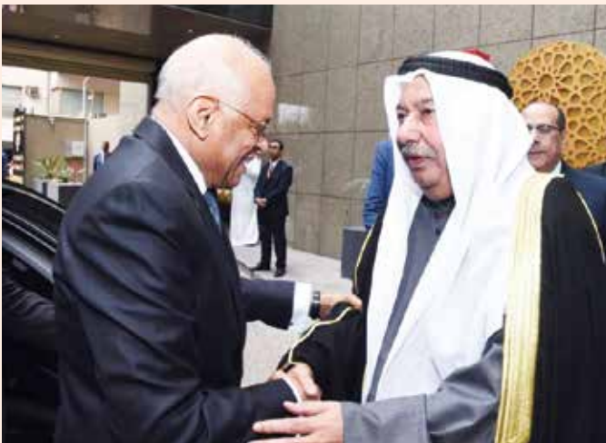
السفير محمد صالح الذويخ مرحبا برئيس مجلس النواب المصري د. علي عبدالعال

أقام سفير الكويت لدى جمهورية مصر العربية محمد صالح الذويخ حفل استقبال بمقر السفارة احتفالاً بالعيد الوطني الـ 59 والذكرى الـ 29 للتحرير والذكرى الـ 14 لتولي صاحب السمو الأمير الشيخ صباح الاحمد مقاليد الحكم، وشارك في الاحتفال رئيس مجلس الوزراء المصري د مصطفى مدبولي ورئيس مجلس النواب المصري د.علي عبدالعال ووزير الدولة للإنتاج الحربي د. محمد العصار، ووزير البترول والثروة المعدنية د. طارق الملا ووزيرة التضامن