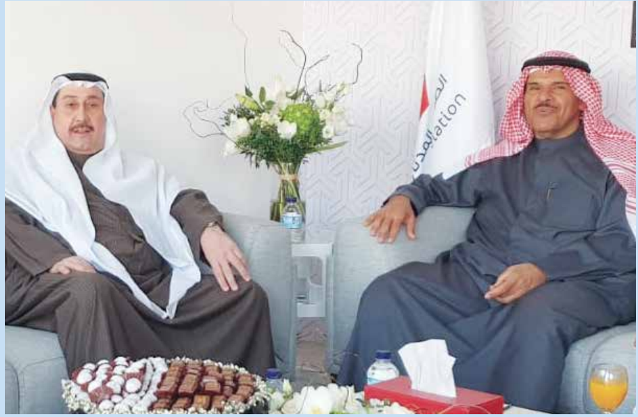
رئيس الطيران المدني الشيخ سلمان الحمود والشيخ فيصل الحمود