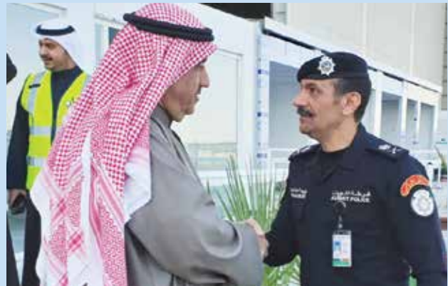
اللواء وليد أحمد الصالح ورئيس اللجنة المنظمة أحمد اسماعيل بهبهاني

وفي الختام قال: لا يسعنا في هذه المناسبة الا ان نتقدم بجزيل الشكر وعظيم الامتنان لمعالي نائب وزير الديوان الاميري الشيخ محمد عبدالله المبارك الصباح على حضوره نيابة عن سمو الأمير وللجهود الكبيرة التي بذلها المسؤولين في الديوان الأميري ودعمهم اللامحدود لهذا الحدث الهام كما لا ننسى أن نشكر دور وجهود الجهات الحكومية الممثلة في اللجنة العليا على تفانيهم خلال الـ 10 شهور الماضية والتي أثمرت عن نجاح الاستعدادات ونخص بالذكر وزارة الداخلية ووزارة الدفاع ووزارة المالية ووزارة الاعلام ووزارة الصحة وبلدية الكويت والإدارة العامة للإطفاء والإدارة العامة للجمارك وهيئة تشجيع الاستثمار وشركة نفط الكويت. كما لا ننسى الجهود الكبيرة لرئيس وأعضاء الشركة المنظمة وجميع الزملاء والزميلات في الطيران المدني المشاركين في اللجان