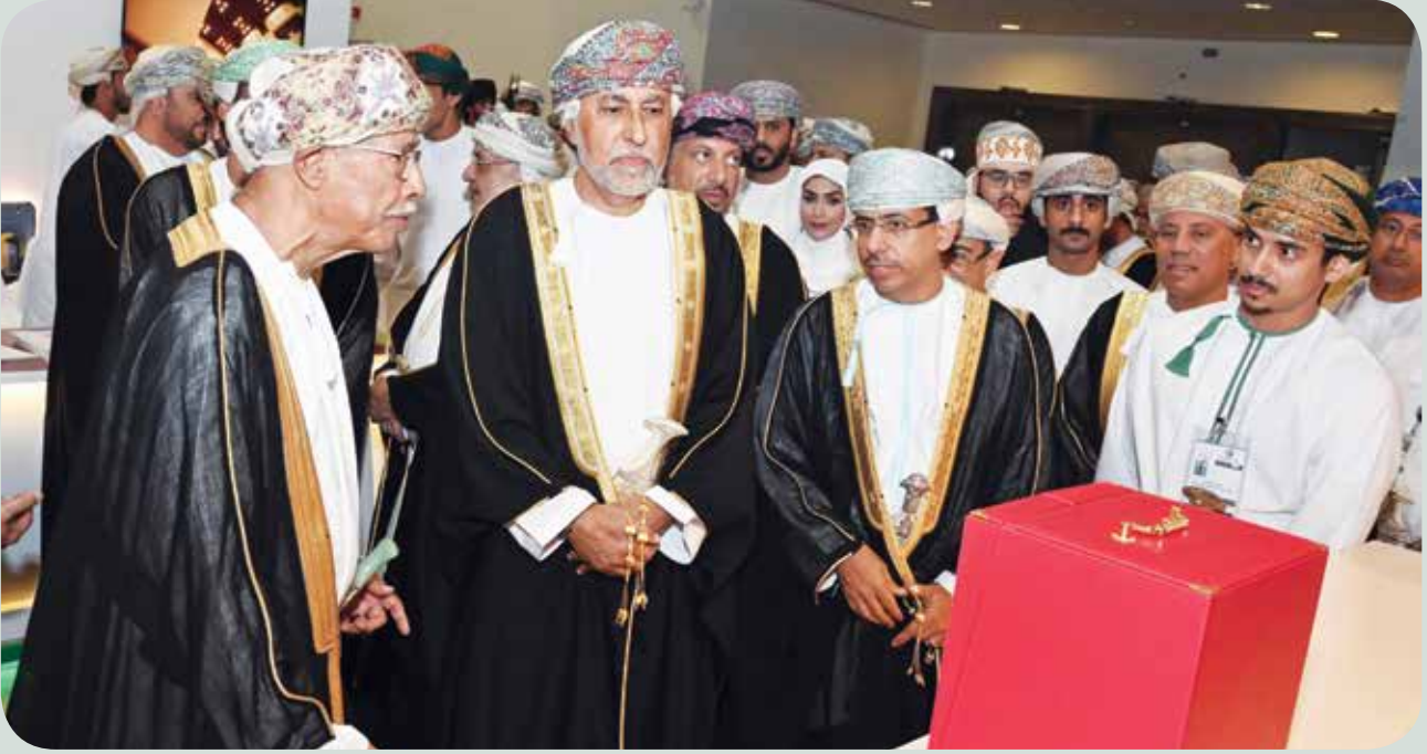
صاحب السمو شهاب بن طارق و مستشار السلطان للشؤون الثقافية عبدالعزيز الرواس ووزير الإعلام د.عبدالمنعم الحسني اثناء تدشين موسوعة تاريخ عمان عبر الزمان