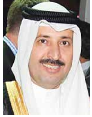
القنصل العام ذياب الرشيدى

الأمر الشيخ صباح الأحمد الصباح حفظه الله ورعاه خدمة لأهل الكويت حكومة وشعباً. وتفضلوا بقبول وافر التقدير والاحترام.