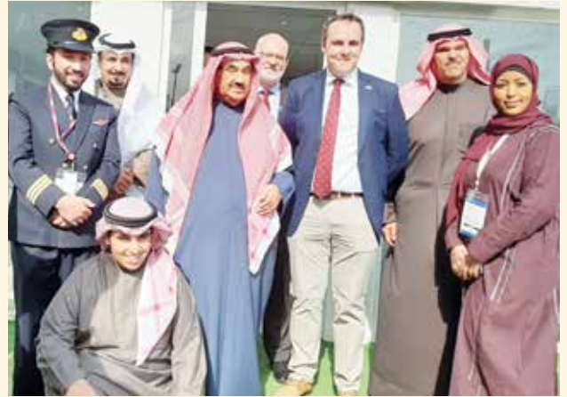
سمو الشيخ ناصر المحمد و الشيخ سلمان الحمود وروب بريكو وسامون فليتش وم. عماد الجلوي وناصر أحمد ناصر المحمد الصباح وحياء ابراهيم في شاليه BAE Systems البريطانية