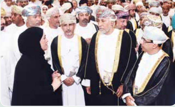
صاحب السمو شهاب بن طارق ود.عبدالمنعم الحسني وحديث مع احدي المشاركين