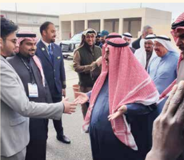
سمو الشيخ ناصر المحمد مصافحا د. يوسف أحمد بهبهاني وجابر أحمد بهبهاني