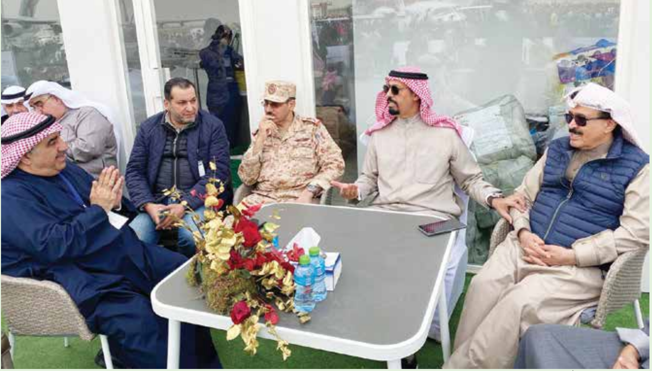
العميد أحمد الجارالله والسفير الشيخ علي الخالد واللواء عدنان الفضلي ومحمد العنزي وأحمد اسماعيل بهبهاني