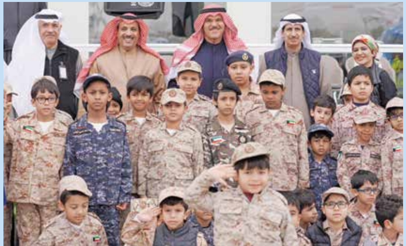
رئيس الطيران المدني الشيخ سلمان الحمود يتوسط م. دعيج العتيبي وعزت العريان وم. صالح الفداغي وم. سعد العتيبي ومنال مقصيد