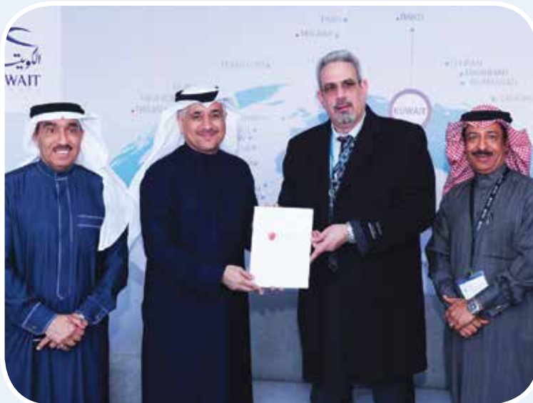
كامل العوضي مستقبلاً معالي وزير المواصلات و الاتصالات في مملكة البحرين كمال بن أحمد محمد وسلمان المحميد ويوسف محمود

** العوضي: «الكويتية» لاتزال إحدى أهم شركات الطيران في المنطقة