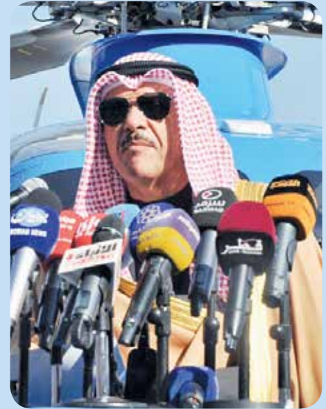
رئيس الطيران المدني الشيخ سلمان الحمود يلقي كلمته

طائرة مدنية وعسكرية و وحضور أكثر من 60 ألف زائر طوال أيامه الأربعة .