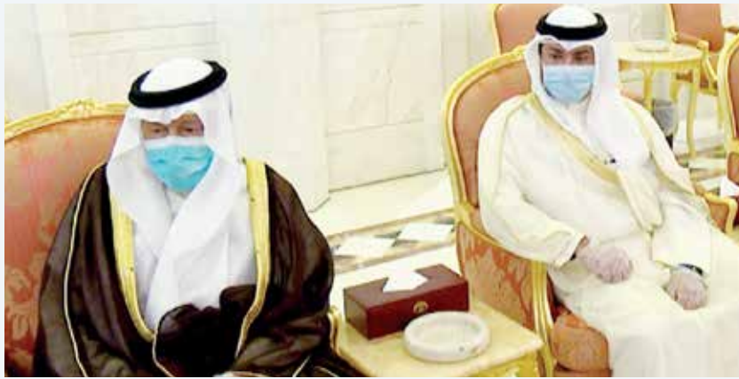
الشيخ خالد عبدالله وأحمد فهد الفهد

أطلقتها، وتوجت بتوقيع سموك عليها، الإخوة من الزملاء السابقين يشكرون على جهودهم في تأسيس الهيئة وانطلاقها، وقد عملوا على استصدار اللائحة التنفيذية للهيئة، وعلى إعداد الإستراتيجية الوطنية، طال عمرك تفعيل نصوص القانون، شمل جميع القياديين، تم حصر جميع القياديين اللي يخضعون لقانون نزاهة، وعدددهم 13 ألف طال عمرك، وتم تقديم إقرار الذمة المالية 16 ألفاً، و51 مقرر، بين إقرار أولي، أو تحديث قرار طال عمرك، أو بمناسبة انتهاء أعمال مسؤولياتهم، وأيضاً الهيئة تلقت 280 بلاغ قضايا فساد، وبادرت من ذاتها للتحقيق في مواضيع أثيرت بـ59 موضوعاً. طال عمرك، أحيل 38 موضوعاً للنياحة العامة، وحفظ 97 موضوعاً، وجار استكمال الباقي. كل هذا الجهد بدعم سموك المتواصل للهيئة ودورها، وأنا متأكد أن إخواني في مجلس الأمانة من الكفاءة والنزاهة، بحيث ينهضون بالهيئة إلى آفاق أرحب. وشكراً طال عمرك».