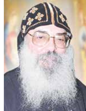
القمص بيجول الانبا بيشوي