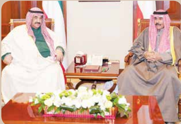
سمو ولي العهد الشيخ نواف الأحمد وسمو الشيخ ناصر المحمد

الناس سواسية تحت القانون والكويت مسؤولة الجميع