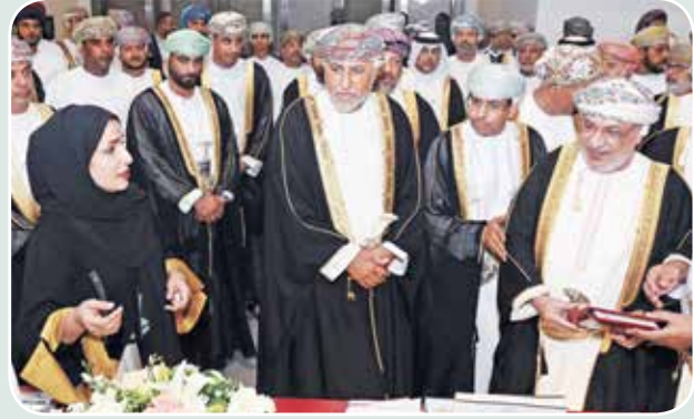
صاحب السمو شهاب بن طارق ود.عبدالمنعم الحسني خلال جولة في أجنحة المعرض