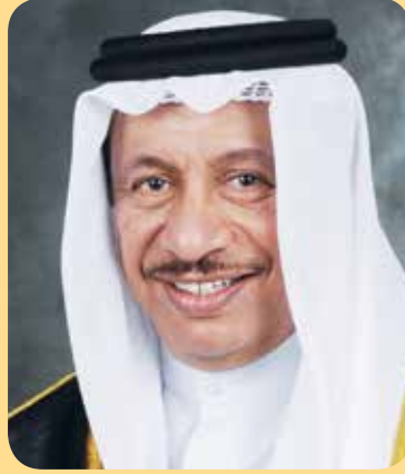
سمو الشيخ جابر المبارك