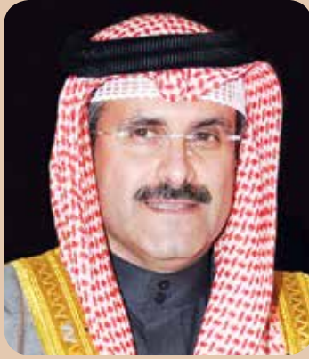
الشيخ مبارك الدعيج

لمتطلبات الجميع والوقوف على مشاكلهم متحلياً بالهدوء والمرونة وسعة الصدر والسعي إلى توطيد الروابط مع مختلف الاتجاهات. ووصف الدعيج سمو الشيخ نواف الأحمد بأنه صاحب رؤية ثاقبة وبصيرة نافذة سابقة لعصرها