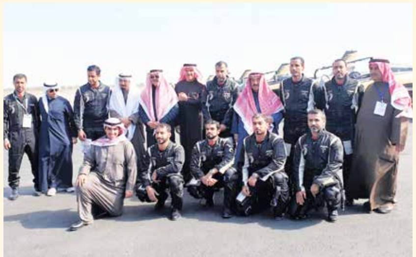
سمو الشيخ ناصر المحمد و الشيخ سلمان الحمود ويوسف الجاسم وم. عماد الجلوي والشيخ ناصر مبارك الصباح وأحمد اسماعيل بهبهاني وناصر أحمد ناصر المحمد الصباح مع فريق فرسان الامارات