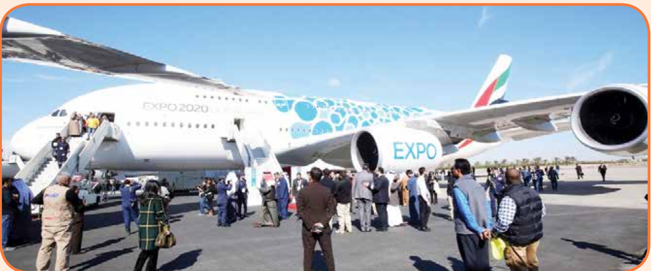
إيرباص A380 طيران الإمارات

وتعتبر طيران الإمارات أكبر مشغل لطائرات A380، حيث يضم أسطولها الآن 115 طائرة من هذا الطراز تخدم 53 وجهة حول العالم. وسافر على هذه الطائرة منذ دخولها الخدمة ضمن أسطول الناقل في 2008 أكثر من 143 مليون راكب، وقطعت هذه الطائرات ما يزيد على 2,2 مليار كيلومتر في أكثر من 163 ألف رحلة ذهابا وإيابا.