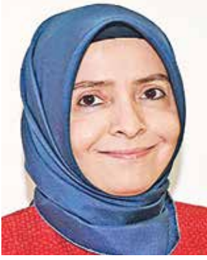
السفيرة عائشة هلال كويتاك