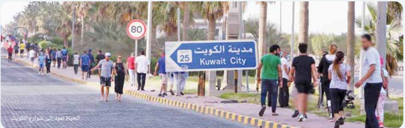
الحياة تعود إلى شوارع الكويت

واستقبل العاملون رواد بعض الأسواق بالتصفيق والأهازيج، معبرين عن فرحتهم باستئناف العمل وعودة الحياة إلى طبيعتها.