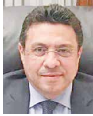
السفير طارق القوني