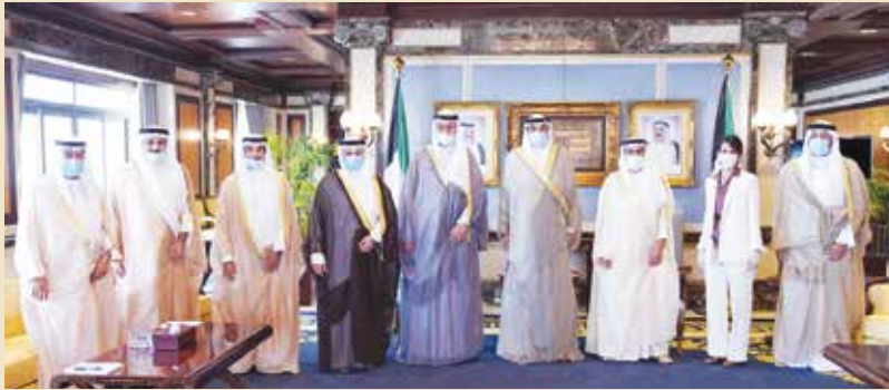
سمو رئيس مجلس الوزراء يستقبل رئيس وأعضاء الهيئة العامة لمكافحة الفساد (نزاهة)

نسأل الله تعالى أن يعينكم ويأخذ بأيديكم لما فيه خير الوطن الغالي ورفعته. والسلام عليكم ورحمة الله وبركاته. وحضر أداء اليمين القانونية وزير شؤون الديوان الأميري الشيخ علي الجراح ووزير العدل ووزير الأوقاف والشؤون الإسلامية المستشار د.فهد العفاسي. وجرى خلال لقاء صاحب السمو مع رئيس وأعضاء هيئة مكافحة الفساد