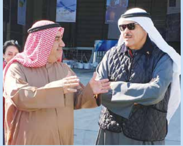
رئيس الطيران المدني الشيخ سلمان الحمود وحديث مع رئيس اللجنة المنظمة أحمد اسماعيل بهبهاني