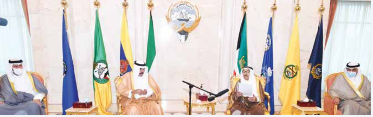
صاحب السمو الأمير الشيخ صباح الأحمد وسمو ولي العهد الشيخ نواف الأحمد وسمو رئيس الوزراء الشيخ صباح الخالد ووزير العدل المستشار د.فهد العفاسي

أهل الكويت. طويل العمر التوجيه المباشر من سموكم للحكومة والهيئة حملنا مسؤولية وأمانة. طويل العمر، التوجيه كان واضحا بحماية المال العام ومكافحة الفساد