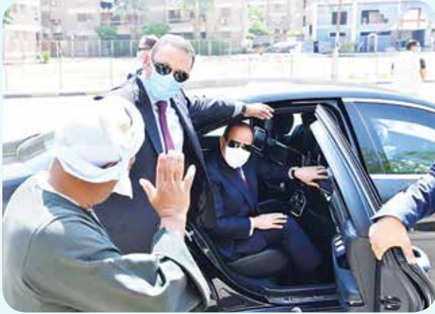
الرئيس عبد الفتاح السيسي وحوار مع أحد الباعة الجائلين أثناء تفقده لعدد من مشروعات الطرق والكباري بمدينة نصر

محطات الوقود بالمحاور الرئيسية، وشدد على ضرورة أن تكون تلك المحطات مراكز خدمية متكاملة للمواطنين، وأثناء الجولة توقف سيادته مع أحد الباعة الجائلين، حيث أدار الرئيس حوارًا معه للاطمئنان على أحواله المعيشية والاستماع لمطالبه.