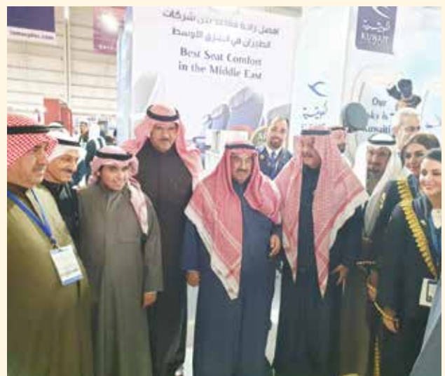
سمو الشيخ ناصر المحمد والشيخ سلمان الحمود ويوسف الجاسم وناصر أحمد ناصر المحمد الصباح وأحمد اسماعيل بهبهاني في جناح الخطوط الجوية الكويتية