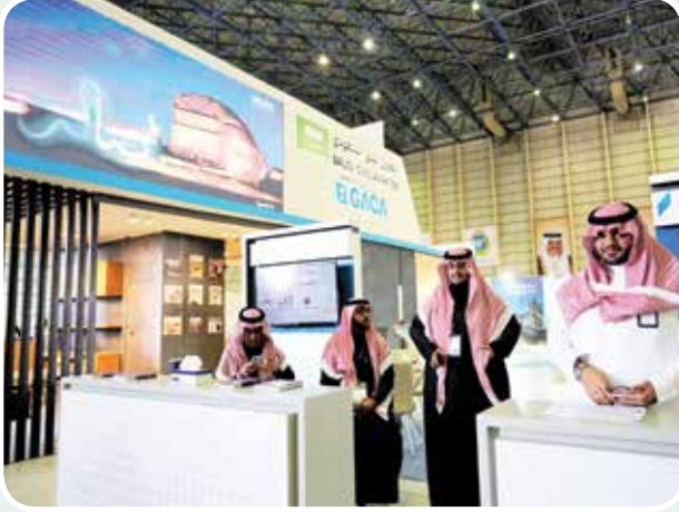
جناح الهيئة العامة للطيران المدني السعودي