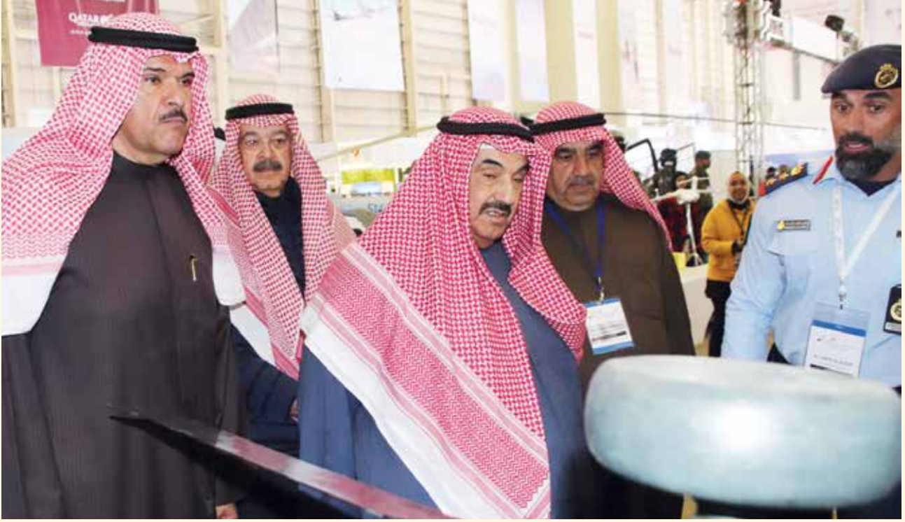
سمو الشيخ ناصر المحمد و الشيخ سلمان الحمود ويوسف الجاسم وأحمد اسماعيل بهبهاني

سموه اطلع عليه أحدث ما توصلت إليه مصانع الطائرات