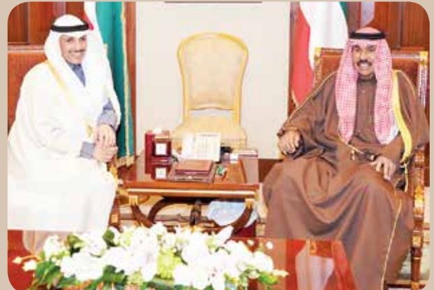
سمو ولي العهد الشيخ نواف الأحمد ورئيس مجلس الأمة مرزوق الغانم