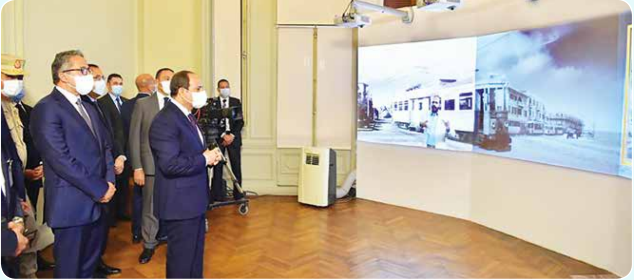
الرئيس عبد الفتاح السيسي يفتتح قصر البارون بعد ترميمه