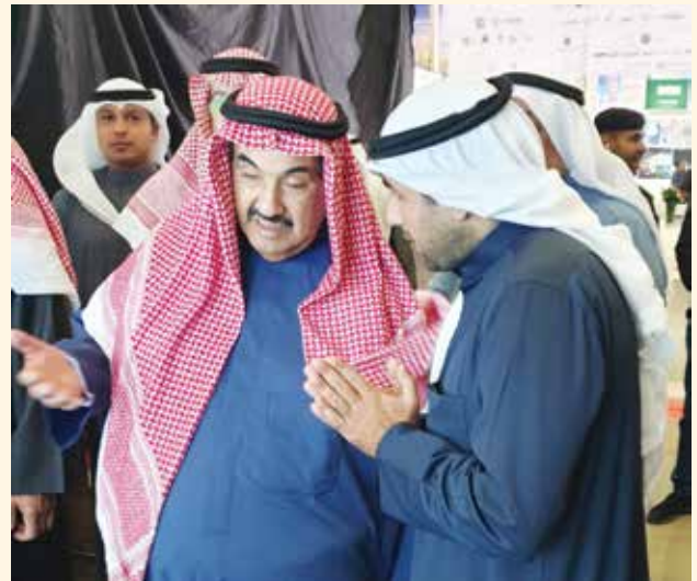
سمو الشيخ ناصر المحمد وحديث مع الشيخ ناصر مبارك الصباح