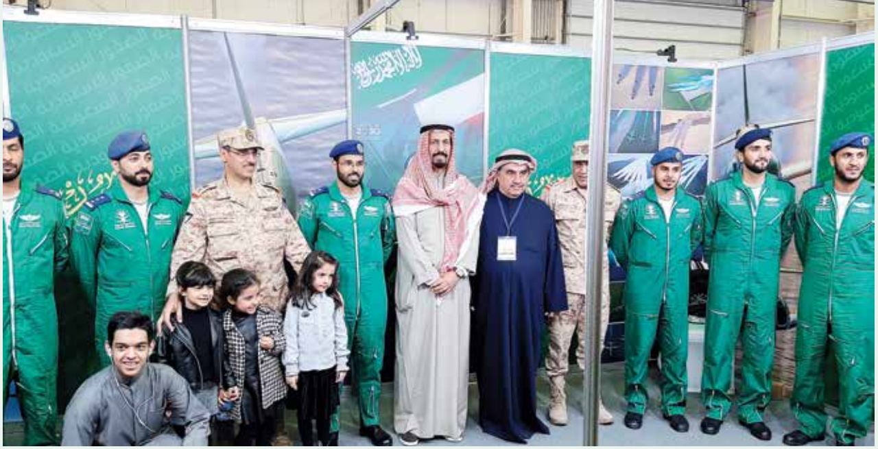
سفير دولة الكويت لدى السعودية الشيخ علي الخالد وأمير القوة الجوية اللواء عدنان الفضلي ورئيس اللجنة المنظمة أحمد اسماعيل بهباني مع فريق الصقور السعودية