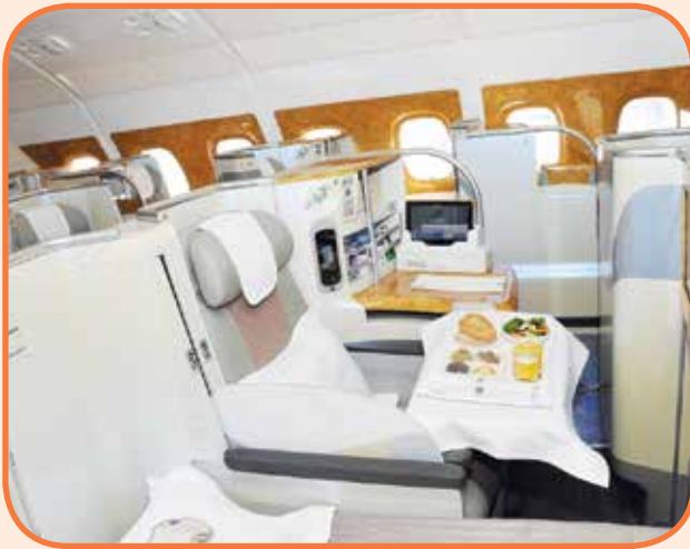
درجة رجال الاعمال