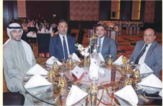
وفد بنك الكويت الدولي