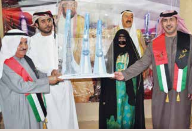
المستشار محمد ضيف الله شرار يتلقى درعا تذكارية من السفير صقر الريسي