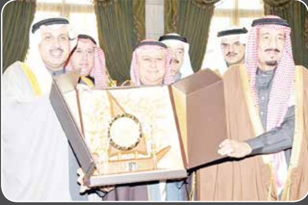
خادم الحرمين الشريفين الملك سلمان بن عبدالعزيز يتسلم درعا تذكارية من المغفور له احمد يوسف بهبهاني بحضور سفير الكويت السابق لدي السعودية الشيخ حمد جابر العلي