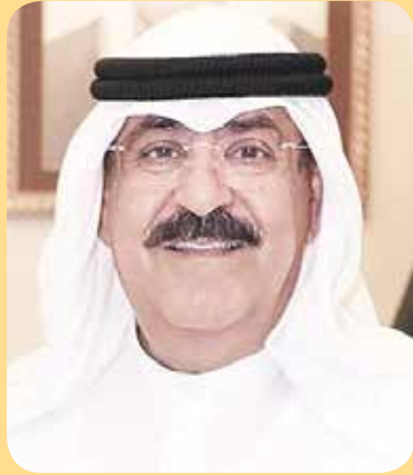
الشيخ مشعل الأحمد

أكد نائب رئيس الحرس الوطني الشيخ مشعل الأحمد، أن سمو ولي العهد الشيخ نواف الأحمد يمثل ركيزة أساسية في النقلة الحضارية التي شهدتها الكويت خلال السنوات الأخيرة، مشيراً إلى أن سموه كان السند الدائم والعضد القوي والداعم الكبير لكل الخطوات والإنجازات التي تحققت في عهد سمو أمير البلاد. وقال الشيخ مشعل الأحمد في بيان أمس بمناسبة الذكرى الرابعة عشرة لأداء سمو الشيخ نواف الأحمد اليمين الدستورية أمام مجلس الأمة ولياً للعهد، التي تصادف اليوم الخميس، إن أبناء الكويت جميعاً يذكرون بالتقدير والعرفان رحلة العطاء الممتدة لسمو الشيخ نواف الأحمد، وجهوده الكبيرة وتضحياته العديدة التي قدمها من أجل الكويت وشعبها العزيز. وأضاف أن سمو ولي العهد يعد أحد رجال الكويت البارزين وقياداتها الحكيمة، الذين تفرسوا في العمل وخاضوا تجارب عديدة واكتسبوا خبرات واسعة، مهدت لهم الطريق إلى النجاح وتحقيق الكثير من الإنجازات التي كانت بداية انطلاق مسيرة النهضة والبناء وإقامة الدولة الحديثة. وأكد الشيخ مشعل الأحمد أن التاريخ سيسجل بأحرف بارزة، كثيراً من المحطات المهمة في مسيرة سمو الشيخ نواف الأحمد، وبصماته الخالدة في العديد من المواقع والمناصب التي تحمل مسؤوليتها. وذكر أن النجاح كان حليفاً لسمو الشيخ نواف الأحمد في كل عمل تحمل مسؤوليته، موضحاً أن سموه اهتم ببناء المواطن وإعداده وتأهيله وتنمية قدراته واستثمار طاقاته، إدراكاً منه بأن الإنسان الكويتي هو الثروة الحقيقية للوطن، وهو الحصن المنيع للحفاظ على أمنه واستقراره وسيادته. وبين أن سموه