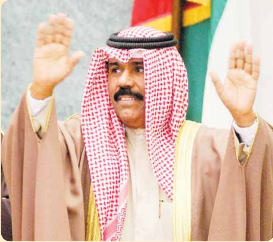
سمو ولي العهد الشيخ نواف الأحمد في مجلس الأمة

** سموه يحرص على تعزيز الفضائل والقيم والإيمان بأهمية وحدة وتكاتف أبناء الكويت جميعا