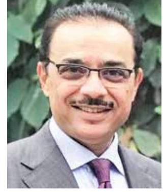
السفير بدر التيب