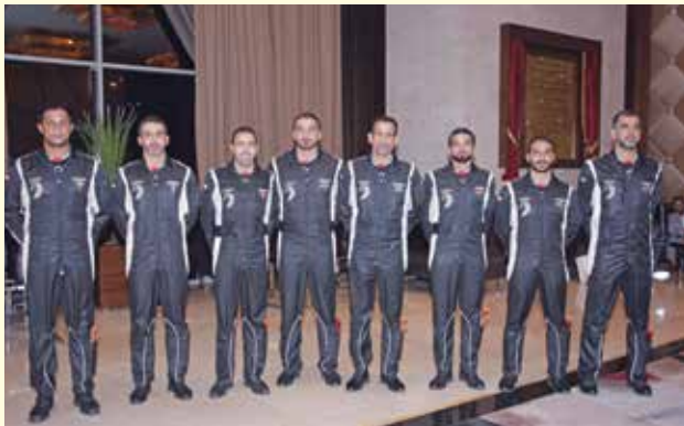
فريق فرسان الامارات