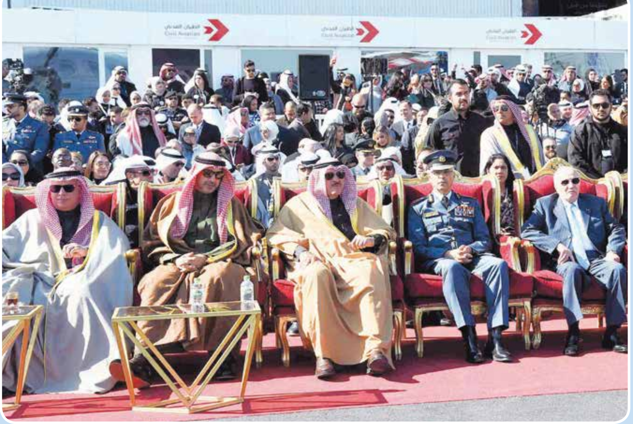
ممثل صاحب السمو نائب وزير شؤون الديوان الأميري الشيخ محمد العبدالله ورئيس الطيران المدني الشيخ سلمان الحمود ووزير الدولة لشؤون الخدمات وزير الدولة لشؤون مجلس الأمة مبارك الحريص وقائد سلاح الجو الملكي البحريني اللواء ركن طيار الشيخ حمد بن عبدالله آل خليفة ووزير الدولة للإنتاج الحربي المصري الراحل د. محمد سعيد العصار في مقدمة الحضور اثناء حفل افتتاح معرض الكويت للطيران 2020