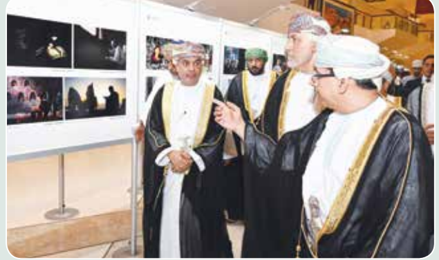
صاحب السمو شهاب بن طارق وشرح من د.عبدالمنعم الحسني عن معرض فني

بيت الزبير اقيمت ندوة السمات الشخصية والبعد الثقافي في مسيرة السلطان قابوس- طيب الله ثراه- . وللفن كان اه فعاليات خاصة خلال أيام المعرض من خلال العديد من الأركان، حيث أقيم ركن كتابي حياتي وركن دار الفنون وركن المسرح وركن العلوم والفضاء وركن إبداعي تخطى حدود الإعاقة، وكان الأطفال وأسرههم على موعد في ركن كتابي حياتي مع فعالية «طفولتي حقي» والتي نظمتها اللجنة العمانية لحقوق الإنسان وفعالية مختبر المرح قدمها مطر السناني وفي ركن الفنون نفذت أيضا اللجنة الوطنية لحقوق الإنسان فعالية حقوق الطفل.