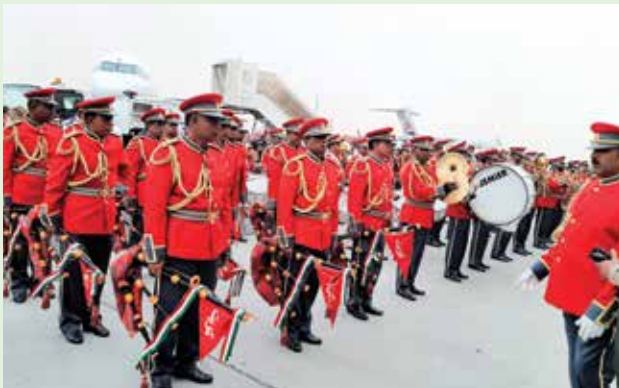
فرقة الجيش الكويتي الموسيقية