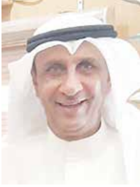
اللواء م فيصل الجراف