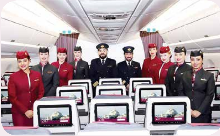
طاقم طائرة القطرية