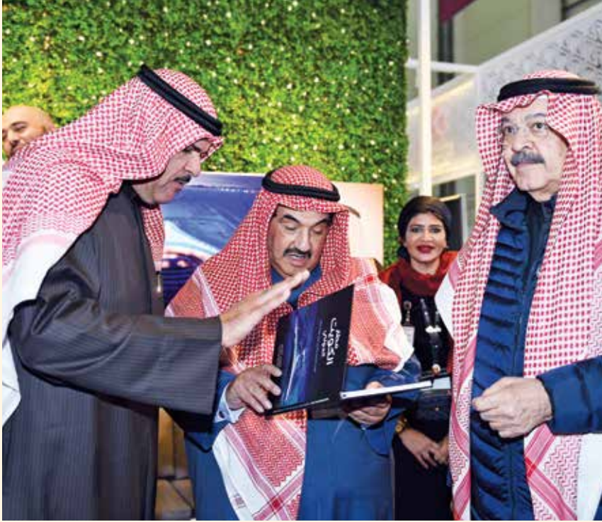
سمو الشيخ ناصر المحمد و الشيخ سلمان الحمود ويوسف الجاسم

قام سمو الشيخ ناصر المحمد بزيارة الى معرض الكويت للطيران الثاني 2020 الذي اقيم تحت رعاية سمو الأمير الشيخ صباح الأحمد خلال الفترة من 15 لغاية 18 يناير الماضي بمشاركة الهيئات الحكومية والمنظمات الدولية والشركات العالمية المتخصصة في مجال الطيران المدني والعسكري.