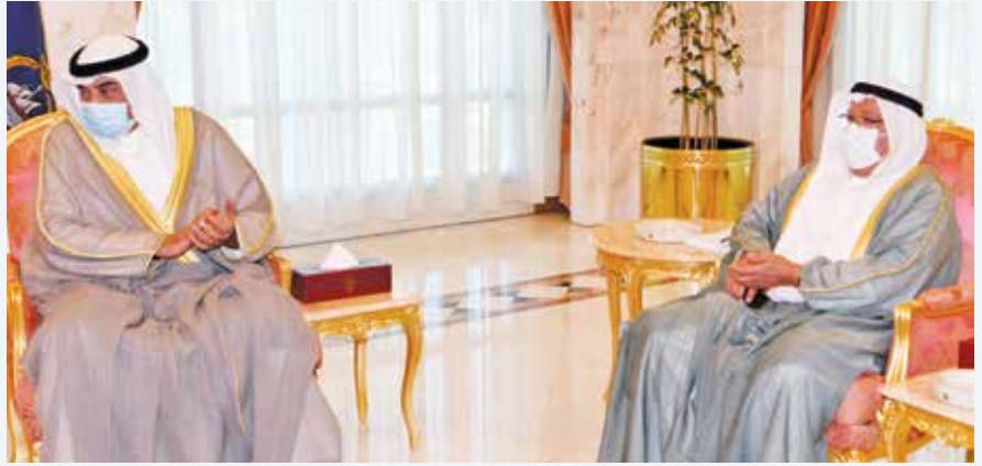
الشيخ علي الجراح وسمو الشيخ صباح الخالد