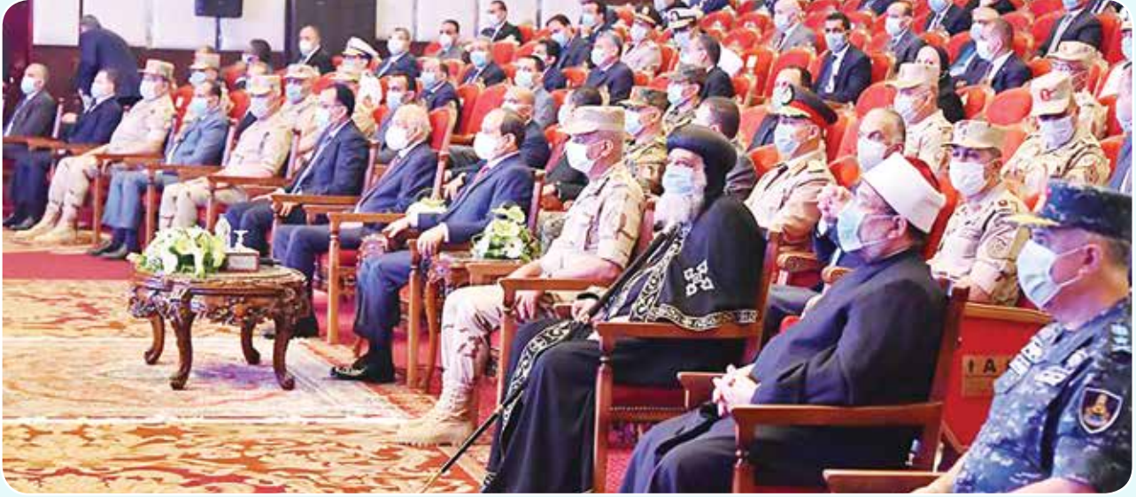
الرئيس عبد الفتاح السيسي اثناء افتتاح مشروعات تطوير منطقة شرق القاهرة

مؤسسات دولته التي تسعى جاهدة لتحقيق التوازن بين حماية المواطنين من خطر الفيروس واستمرار عملية الإنتاج والتنمية. وأشار السيسي، إلى أن مستقبل الأوطان لا تصنعه الأمانى البراقة والشعارات الرنانة، مؤكداً أن أمن مصر القومي يرتبط ارتباطاً وثيقاً بأمن محيطها الإقليمي فهو لا ينتهي عند حدود مصر السياسية بل يمتد إلى كل نقطة ممكن أن تؤثر سلباً على حقوق مصر التاريخية. وتابع الرئيس: «ولا يخفى على أحد أننا نعيش وسط منطقة شديدة الاضطراب وأن التشابكات والتوازنات في المصالح الدولية والإقليمية في هذه المنطقة تجعل من الصعوبة أن تتعزل أى دولة داخل حدودها تنتظر ما يسوقه إليها الظروف المحيطة بها ومن هنا كان استشراف مصر لحجم التحديات التي ربما تصل لتهديدات فعلية تتطلب التصدي لها بكل حزم على نحو يحفظ لمصر وشعبها الأمن والاستقرار ورغم امتلاك مصر لقدره شاملة ومؤثرة في محيطها الإقليمي ولكنها دائماً تجنح للسلم وأنه ايديها ممدودة للجميع بالخير، لا تعدى على أحد ولا تتدخل في شؤون أحد ولكنها في الوقت نفسه تتخذ ما يلزم لحفظ أمنها القومي، هذه هي سياسة مصر التي تتأسس على شرف في تعاملاتها دون التهاون في حقوقها».