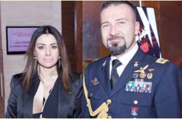
الملحق العسكري الايطالي وحرمة