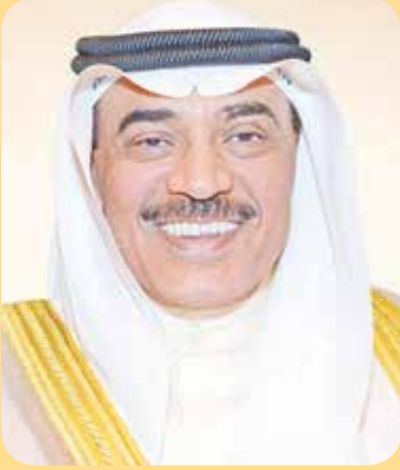
سمو الشيخ صباح الخالد