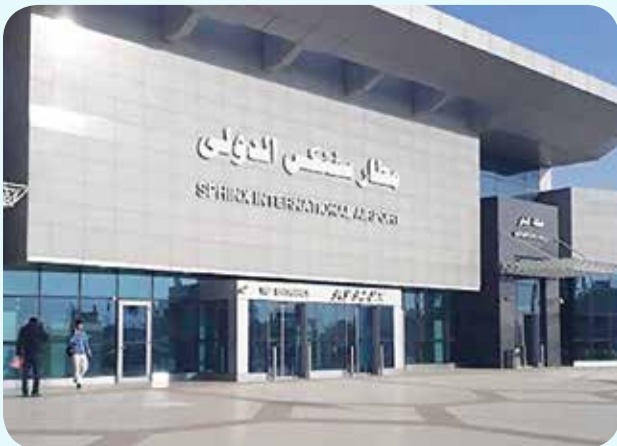
مطار سفنكس الدولي

وأكد على ضرورة مراعاة وتطبيق كافة التدابير الاحترازية حفاظاً على سلامة وصحة العاملين بتلك المشروعات، كما تفقد عدداً من