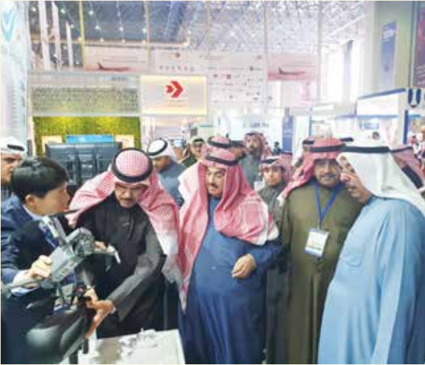
سمو الشيخ ناصر المحمد وشرح من الشيخ سلمان الحمود عن احدى الشركات المشاركة بحضور أحمد اسماعيل بهبهاني وناصر أحمد ناصر المحمد الصباح