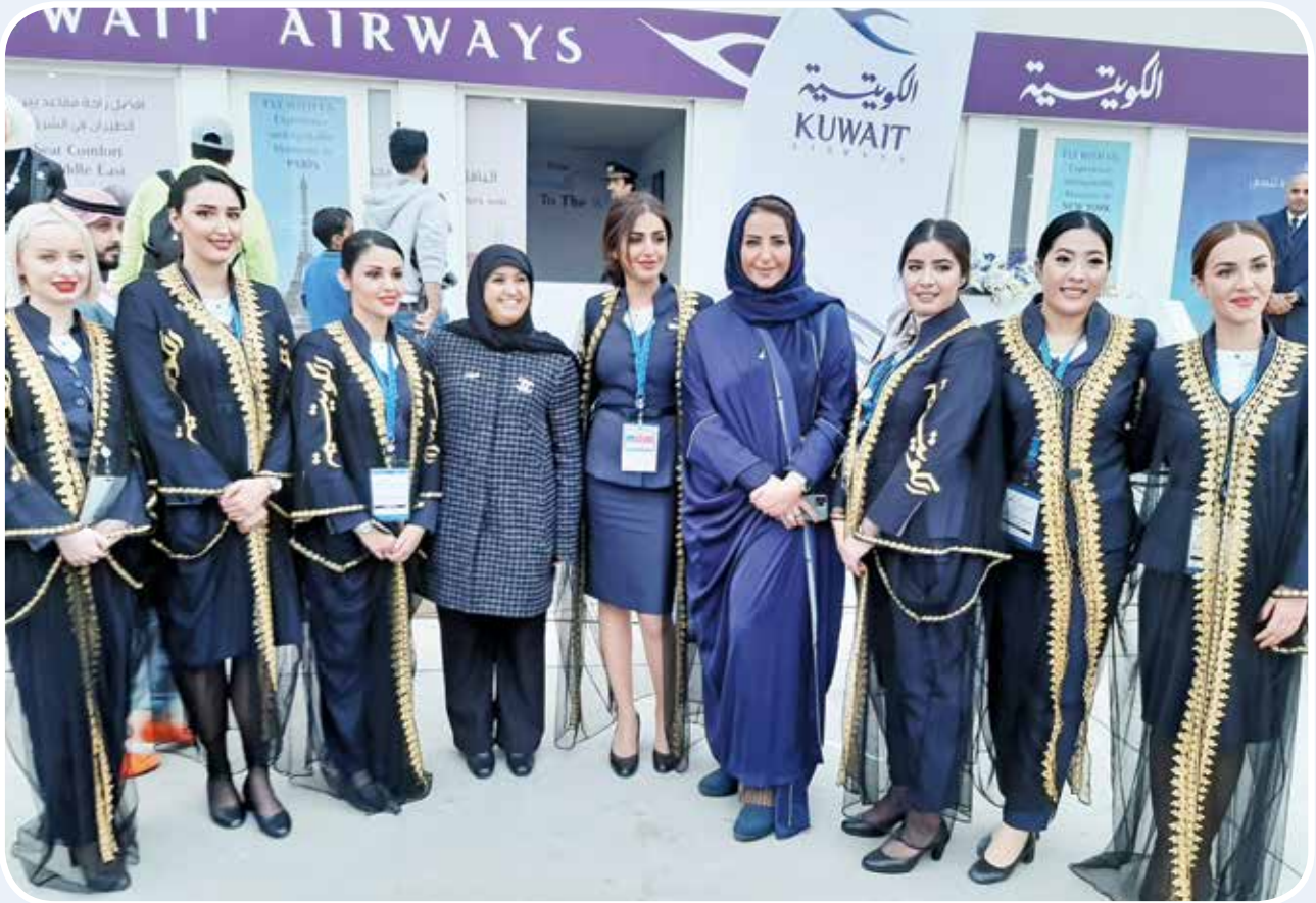
الشيخة سهيلة سالم الصباح والأميرة هند بنت عبد الرحمن آل سعود وعدد من مضيفات «الكويتية»

الركاب رقم 4 في 2018 المخصص لرحلات الخطوط الجوية الكويتية، ونمو عدد رحلاتها لتتحلق طائراتها فوق العديد من دول العالم، كذلك تعمل شركة الخطوط الجوية الكويتية على تحديث وتطوير أسطولها بما يتناسب مع راحة ركابها والمتطلبات العالمية والمحلية في مجال النقل الجوي».