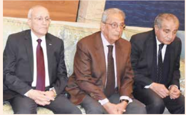
وزير التموين والتجارة الداخلية د. علي مصيلحي وأمين عام جامعة الدول العربية الأسبق عمرو موسى وزير الدولة للإنتاج الحربي الراحل د. محمد العصار

وأكد الذويخ، على ان العلاقات الكويتية - المصرية تعد علاقات تاريخية متجذرة بناء أخوية وقائمة على تفاهات كبيرة ونسق متحد من خلال تناولهم لكل القضايا التي تهم البلدين. حضر اللقاء عدد من أركان السفارة.