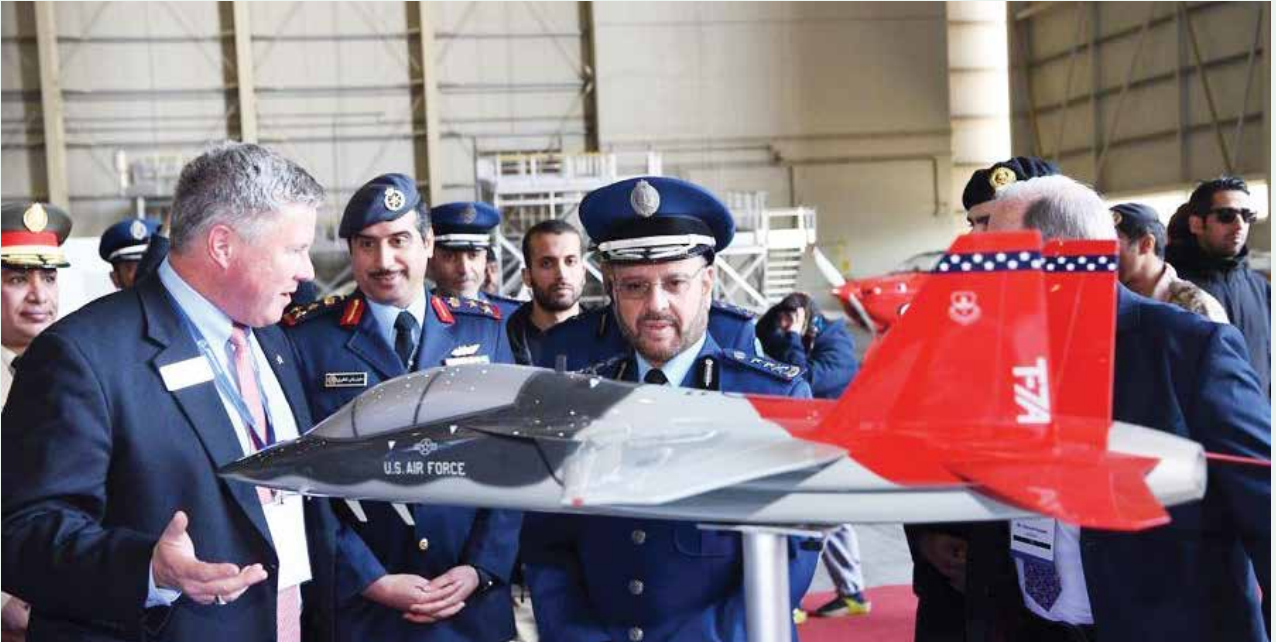
رئيس هيئة الأركان العامة السعودية الفريق الأول الركن فياض الرويلي يطالع احدى المجسمات لطائرة معروضة بالمعرض

زار رئيس هيئة الأركان العامة السعودية الفريق الأول الركن فياض بن حامد الرويلي يرافقه عدد من كبار ضباط القوات المسلحة فعاليات معرض الكويت الدولي للطيران 2020 بدولة الكويت بمشاركة الهيئات الحكومية والمنظمات الدولية وكبرى الشركات المتخصصة في صناعة الطيران.