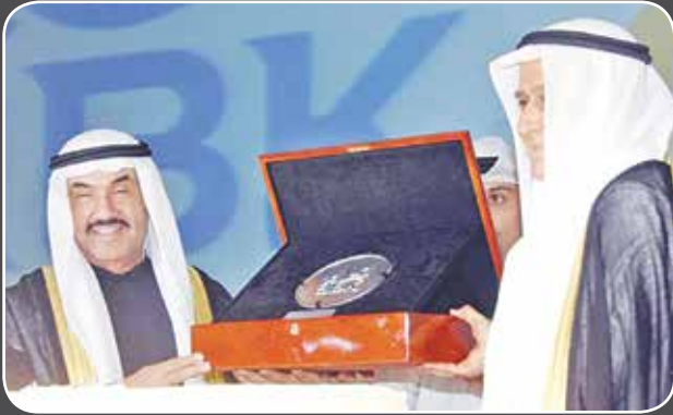
سمو الشيخ ناصر المحمد والمغفور له احمد يوسف بهبهاني في ذكرى تأسيس البنك الأهلي الكويتي