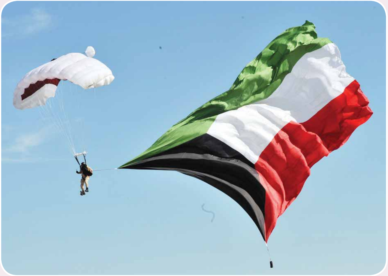
عروض متميزة لفريق لجنة قطر للرياضات الجوية