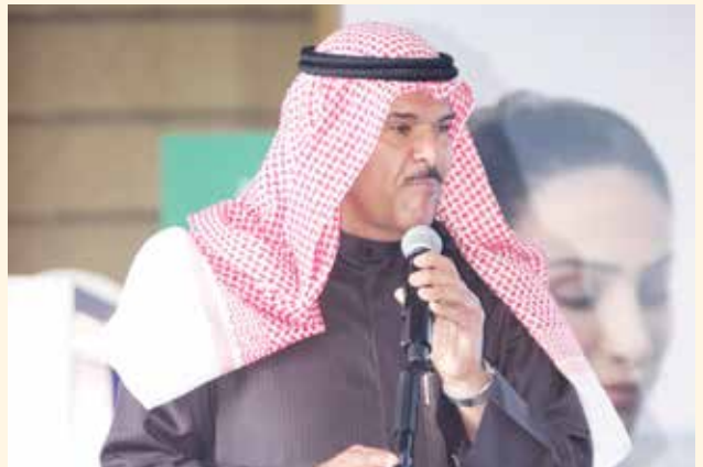
الشيخ سلمان الحمود يلقي كلمته