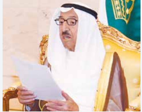
صاحب السمو الأمير الشيخ صباح الأحمد يلقي كلمته

** الكويت دولة مؤسسات ودستور يكفل للجميع حق اللجوء إلى القضاء فيه مواجهة شبهات الفساد أو التجاوز والتجاوز على المال العام