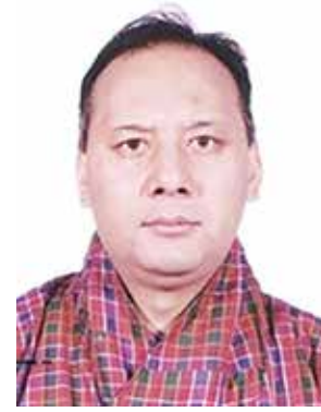
السفير تسيرنج جيلتشن بنجور

لأشرككم هذه المناسبة الطيبة لأعبر من خلالها عن مدى إعجابنا واعتزازنا بما حققته وقدمته مجلتكم الغراء خلال مشوارها من إنجازات عظيمة ومكانة سامية.