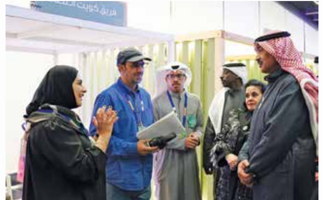
سمو الشيخ صباح الخالد وحديث مع فريق كويت العطاء بحضور فاطمة الأمير

كما شاركنا مركز الشيخ صباح الاحمد للمبدعين الاطفال في تقديم العديد من البرامج واختتام حفل اليوم الاول من هذه المناسبة بإحياء احتفالية للفنون الشعبية، قدمت العرضة بجميع انواعها البحرية والحربية والنجدية والتي مزجت عروضها بعروض مرثية جسدت روح التلاحم والترابط بين اهل الكويت مع المحافظة على تراث كل منها بروح وطنية.