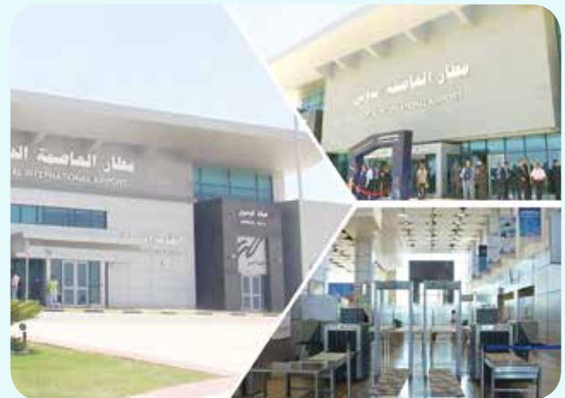
مطار العاصمة الدولي