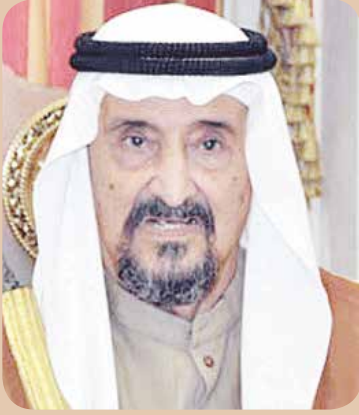
سمو الشيخ سالم العلي

في شتى المجالات وعلى كل الأصعدة المحلية والإقليمية والدولية عمت أرجاء البلاد وجعلت الكويت نموذجا يحتذى ومناورة للإنسانية يهتدى بها، مؤكداً ان هذه الإنجازات كانت وما زالت ثمرة توجيهات سمو أمير البلاد وبمؤازرة سموه نحو الوصول بوطننا الحبيب الى ارقى مكانة بين الدول. وقد بعث سمو ولي العهد إلى الشيخ سالم العلي رسالة شكر جوابية.