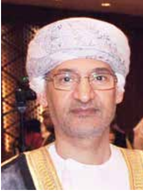
الوزير المفوض هلال الشنفرى