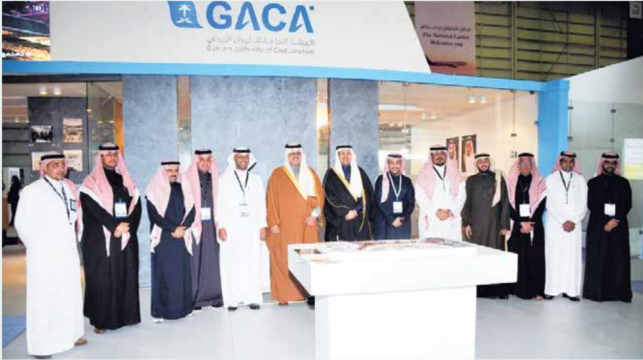
سفير المملكة لدى الكويت الأمير سلطان بن سعد بن خالد ورئيس هيئة الطيران المدني السعودي عبدالهادي المنصوري في جناح الهيئة العامة للطيران المدني السعودي

التطورات الكبيرة التي وصل إليها قطاع الطيران المدني في المملكة، وعرض مشاريع قطاع الطيران المدني في بناء وتطوير وتحسين المطارات بالمملكة والبالغ عددها 28 مطارا، إضافة إلى اطلاع الزوار على استعداد الهيئة للمرحلة النوعية المقبلة على مستوى صناعة الطيران بعد فتح التأشيرة السياحية بالمطارات وبدء استقبال المملكة للوفود الزائرة بغرض السياحة.