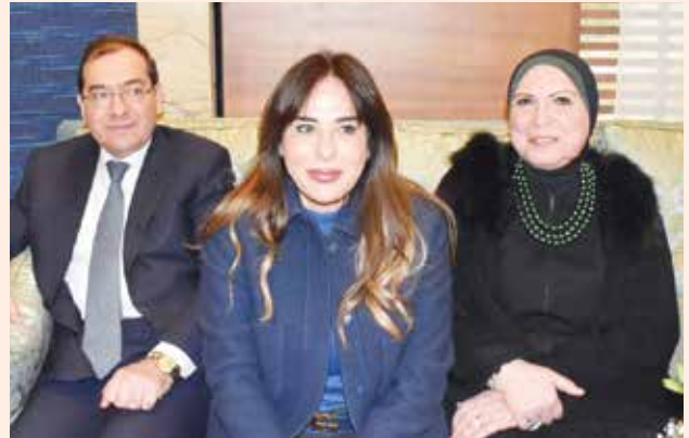
وزيرة الصناعة والتجارة الخارجية نيفين جامع وم. رندا المنشاوي ووزير البترول والثروة المعدنية د. طارق الملا