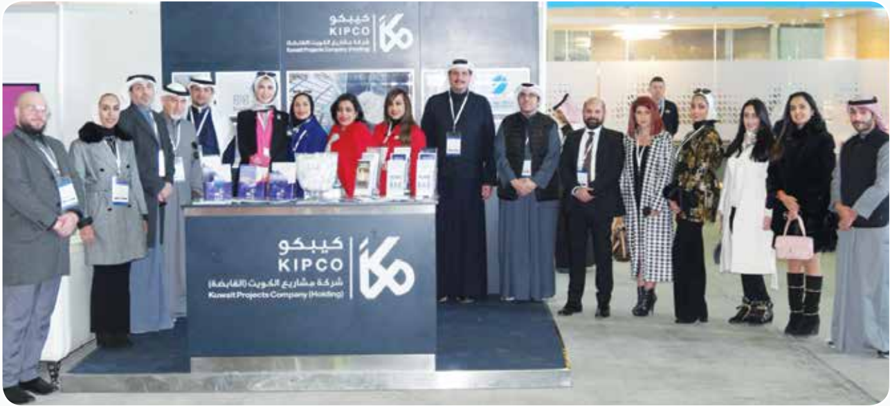
ممثلو مجموعة كيبكو خلال مشاركتهم في معرض الطيران