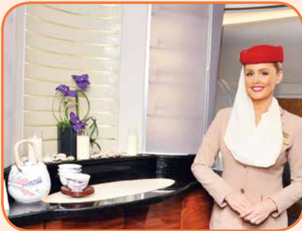
مضيفة طيران الإمارات

يذكر أن طيران الإمارات بدأت خدمة الكويت منذ 30 عاما، وتشغل الآن 6 رحلات يوميا بين الكويت ودبي، ما يوفر للمسافرين من رجال الأعمال والسياح إمكانية الاختيار ومواصلة السفر بسهولة ويسر من وإلى أكثر من 150 وجهة عالمية.