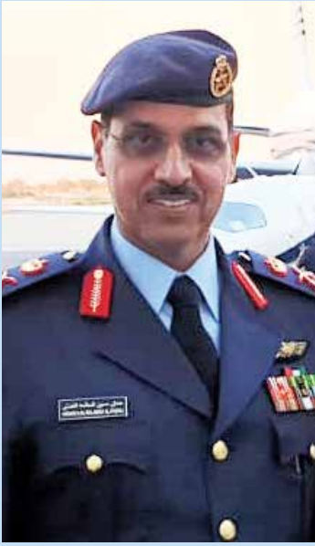
أمر القوة الجوية اللواء عدنان الفضلي