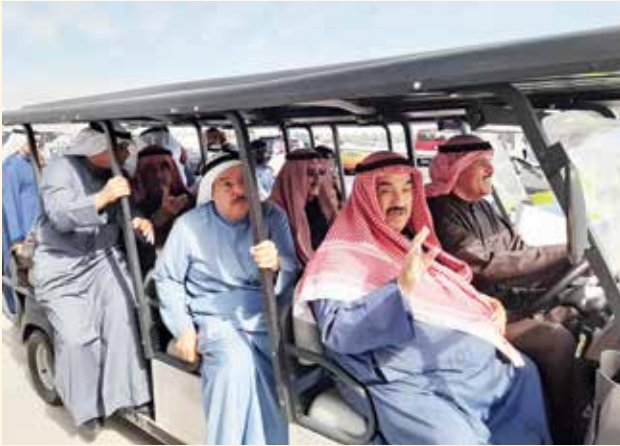
سمو الشيخ ناصر المحمد و الشيخ سلمان الحمود ويوسف الجاسم وأنور الرفاعي وأحمد اسماعيل بهباني