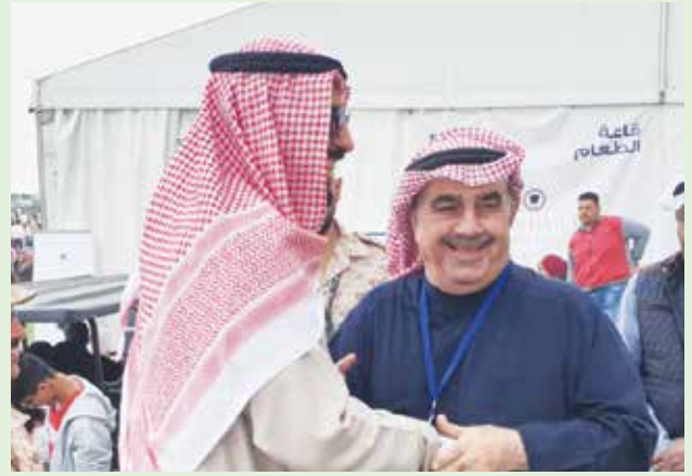
أحمد اسماعيل بهبهاني والسفير الشيخ علي الخالد