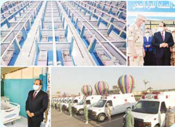
مجمع مستشفيات القوات المسلحة للعزل الصحي بأرض المعارض

وقال الرئيس: «وهو الأمر الذى يستوجب منا بلا شك التوقف أمامه باعتباره شاهداً على تفرد وصلابة الشعب المصري وقدرة