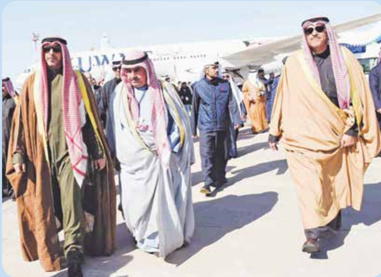
ممثل صاحب السمو نائب وزير شؤون الديوان الأميري الشيخ محمد العبدالله ورئيس الطيران المدني الشيخ سلمان الحمود ورئيس اللجنة المنظمة أحمد اسماعيل بهبهاني