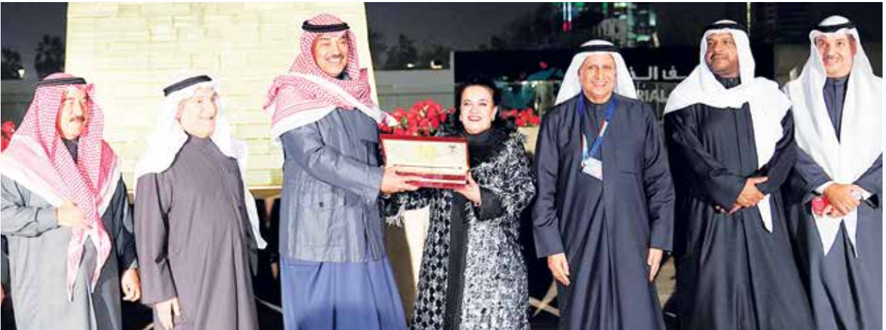
سمو الشيخ صباح الخالد يتلقى درعا تذكارية من فاطمة الأمير بحضور الشيخ أحمد المنصور الشيخ د. سالم الجابر والشيخ مشعل جابر العبد الله والمستشار محمد أبو الحسن وصلاح العوفان

هذا، وافتتح سموه جدارية شهداء الكويت التي تم تجديدها من قبل مكتب الشهيد، كما اطلع سموه على أعمال حرفية لأشبال مركز