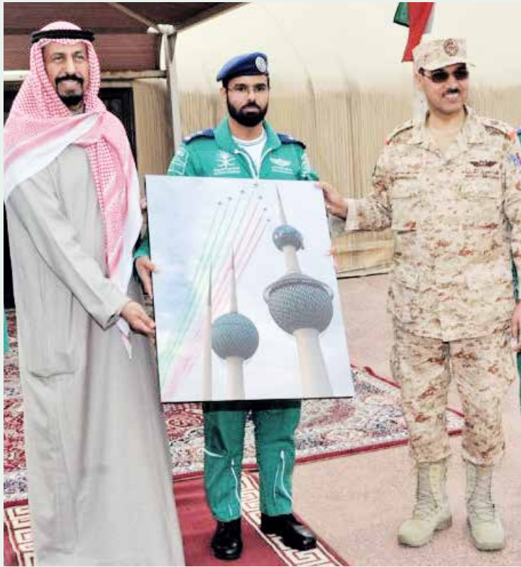
سفير دولة الكويت لدى السعودية الشيخ علي الخالد يتلقى اهداء من المقدم الطيار عبدالرؤوف السلمي قائد فريق الصقور السعودية بحضور أمير القوة الجوية اللواء عدنان الفضلي

اشاد سفير دولة الكويت لدى المملكة الشيخ علي الخالد الجابر الصباح بمشاركة القوات الجوية الملكية السعودية ممثلة بفريق الصقور السعودية المشارك في معرض (الكويت للطيان 2020)