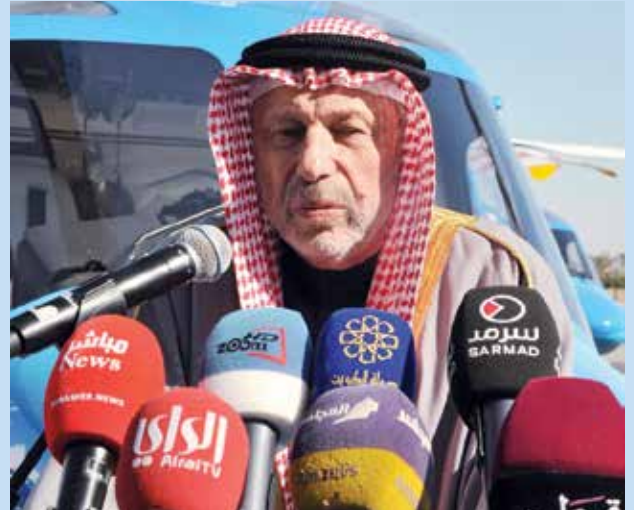
الشيخ أحمد الطرابلسي