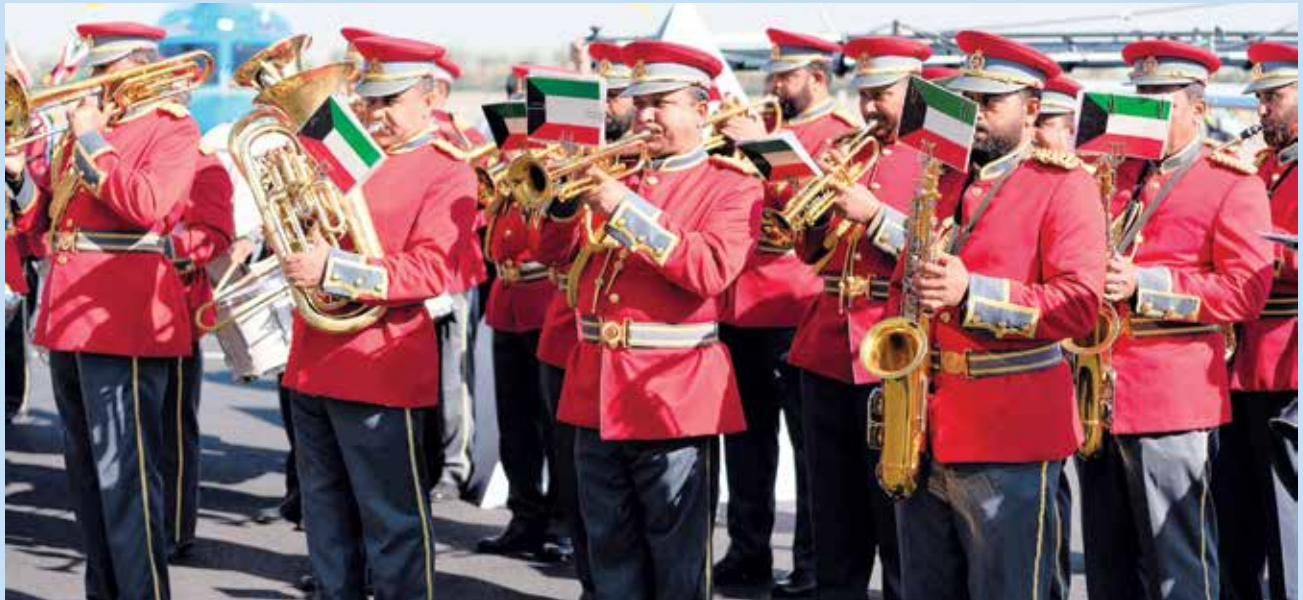
فرقة الجيش الكويتي الموسيقية

وأكد بهبهاني أن معرض الكويت للطيران 2020، من الفعاليات المهمة التي انعشت السوق المحلي والاقتصاد، خصوصاً في القطاع اللوجستي من ناحية الخدمات للفنادق والمواصلات،