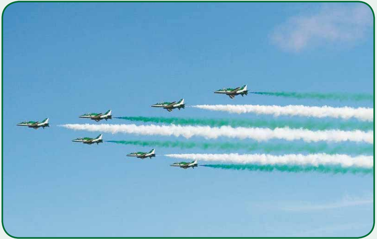
عروض متميزة لفريق الصقور السعودية