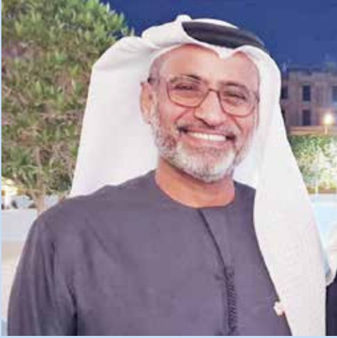
مدير عام الهيئة العامة للطيران المدني الاماراتية سيف السويدي