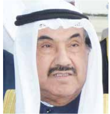
سمو الشيخ ناصرالمحمد