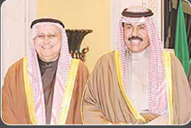
سمو ولي العهد الشيخ نواف الاحمد مع المغفور له احمد يوسف بهبهاني