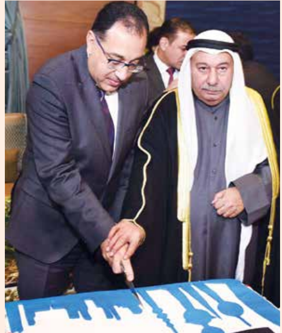
رئيس مجلس الوزراء المصري د. مصطفى والسفير محمد صالح الذويخ اثناء قطع كيكة الحفل

أقام سفير الكويت لدى جمهورية مصر العربية محمد صالح الذويخ حفل استقبال بمقر السفارة احتفالاً بالعيد الوطني الـ 59 والذكرى الـ 29 للتحرير والذكرى الـ 14 لتولي صاحب السمو الأمير الشيخ صباح الاحمد مقاليد الحكم، وشارك في الاحتفال رئيس مجلس الوزراء المصري د مصطفى مدبولي ورئيس مجلس النواب المصري د.علي عبدالعال ووزير الدولة للإنتاج الحربي د. محمد العصار، ووزير البترول والثروة المعدنية د. طارق الملا ووزيرة التضامن