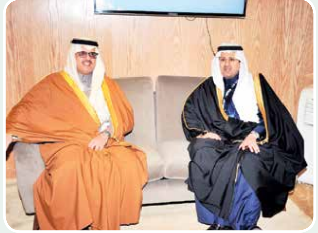
سفير المملكة لدى الكويت الأمير سلطان بن سعد بن خالد ورئيس هيئة الطيران المدني السعودي عبدالهادي المنصوري