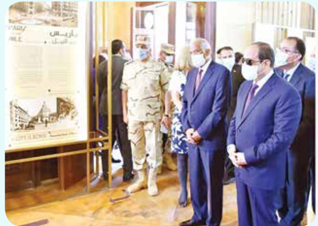
الرئيس عبد الفتاح السيسي ود . على عبد العال رئيس مجلس النواب ود . مصطفى مدبولى رئيس الوزراء اثناء افتتاح قصر البارون بعد ترميمه