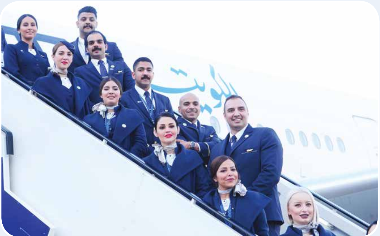
طاقم ضيافة «الكويتية»

الأحمد الجابر الصباح حفظه الله ورعاه، حيث قامت الشركة باستعراض أحدث الطرازات من طائراتها خلال المعرض كطائرة إيرباص A320neo والتي تسلمتها مؤخراً في الربع الأخير من العام 2019 ، وطائرة بوينغ 300er-B777 ، علاوة على ذلك قامت الشركة بالسماح للزوار بالتجول داخل الطائرتين واطلاعهم على ما توفرانه من خدمات سواء تكنولوجية أو حسن الاستقبال أو تجربة راحة المقاعد. ونالت الطائرتان إعجاب الزوار بما وصلت إليه من تطور وأداء مميز، خصوصاً في الفترة الأخيرة.