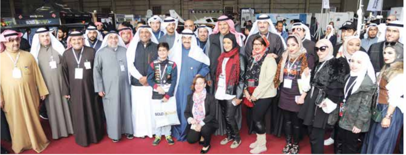
سمو الشيخ ناصر المحمد بتوسط الشيخ سلمان الحمود وسيف السويدي مدير عام الهيئة العامة للطيران الاماراتي وم يوسف الفوزان وم. فهد الوقيان ود. فلاح مهاوش والكابتن عبدالحليم زيدان وأحمد اسماعيل بهبهاني وفايز الغنزي