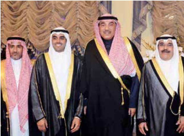
الشيخ صباح الخالد مباركا

بحضور ومباركة صاحب السمو الأمير الشيخ صباح الأحمد وسمو ولي العهد الشيخ نواف الأحمد، احتفل الشيخ فيصل خليفة المالك الصباح بزفاف نجله خليفة على كريمة مازن بن عبدالمحسن الطويل، وحضر الحفل أيضا جمع من الشيوخ والشخصيات والأهل والأصدقاء الذين قدموا المباركة والتنهاني بالمناسبة السعيدة. ألف مبروك.