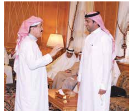
السفير القطري بندر العطية والعميد أحمد الجارالله