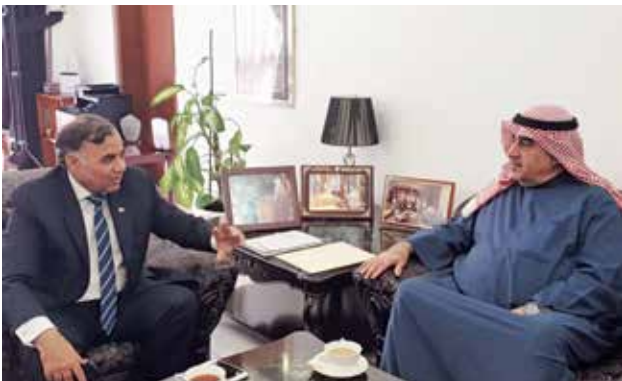
أحمد اسماعيل بهبهاني و السفير الباكستاني غلام دستجير

عدنان الانصاري بمكتبه بسفارة سلطنة عمان ، كما التقى بهبهاني سفير جمهورية مصر العربية لدي دولة الكويت السفير طارق القوني وسفير جمهورية العراق لدي دولة الكويت السفير علاء الهاشمي وسفير المملكة الأردنية الهاشمية لدي دولة الكويت السفير صقر ابو شتال وسفير باكستان لدي دولة الكويت السفير غلام دستجير وسفير جمهورية الهند لدي دولة الكويت السفير جيفا ساغار والمستشار محمد جاسم السيت القائم بأعمال سفارة مملكة البحرين لدي دولة الكويت في سفارة مملكة البحرين ، كما التقى بهبهاني رئيس مجلس إدارة شركة ألافكو لتمويل شراء و تأجير الطائرات أحمد عبد الله الزين ، حيث سلم السفراء دعوات لمشاركة بلادهم في معرض الكويت للطيران 2020 ، والذي سيقام في الفترة من 18- 15 يناير 2020 بمطار الكويت الدولي .