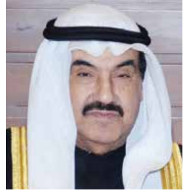
سمو الشيخ ناصرالمحمد