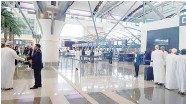
مطار مسقط الدولي

ويعتبر المجلس العالمي للمطارات مظلة تضم تحتها سلطات المطارات في العالم وتم إنشاؤه في عام 1991 ليقوم بمهام إشرافية وتنسيقية في جوانب الأمن والطاقة والسلامة والتكنولوجيا والبيئة لهذا القطاع الحيوي الاقتصادي المهم في العالم. ويقع المقر الرئيسي للمجلس في العاصمة الكندية مونتريال فيما تتوزع مقر مجالسه الإقليمية في آسيا والمحيط الهادئ وشمال وجنوب أمريكا وإفريقيا وأوروبا. ويهدف المجلس للنهوض بالمطارات وتعزيز التميز المهني في إدارة المطارات وتشغيلها ويسعى عن طريق تعزيز التعاون بين المطارات ومنظمات الطيران العالمية وشركاء الأعمال إلى توفير أنظمة نقل جوي آمنة وعلى درجة عالية من الكفاءة. يضم المجلس 597 عضوا يديرون أكثر من 1679 مطارا في 177 دولة حول العالم.