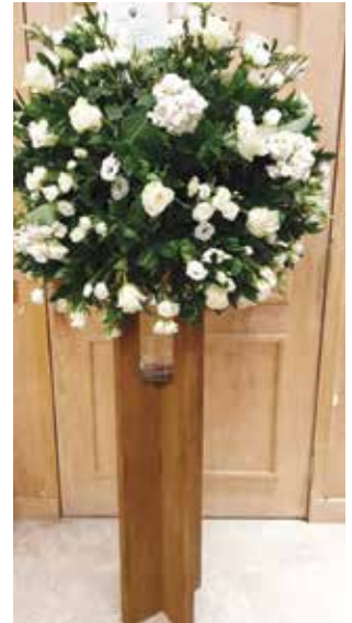
ورود من نائب رئيس مجلس الوزراء وزير الداخلية الفريق متقاعد الشيخ خالد الجراح