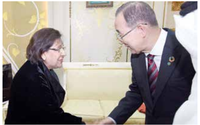
الأمين العام السابق للأمم المتحدة بان كي مون مصافحا د. موضي الحمود