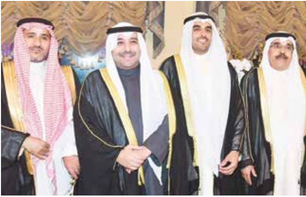
الشيخ صباح ناصر الصباح مباركاً