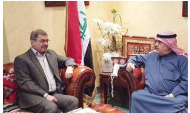
أحمد اسماعيل بهبهاني و السفير العراقي علاء الهاشمي