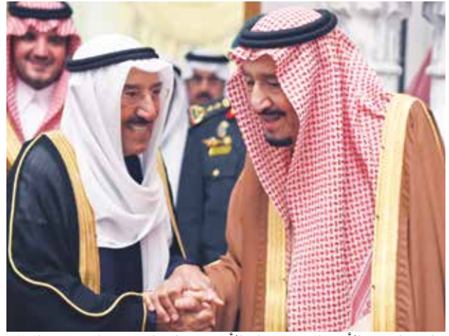
صاحب السمو الأمير الشيخ صباح الأحمد وخدام الحرمين الشريفين الملك سلمان بن عبدالعزيز