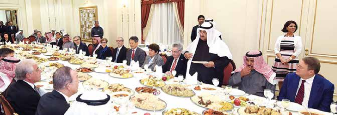
سمو الشيخ ناصر المحمد ملقيا كلمته على هامش مأدبة الغداء