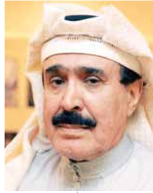
العميد أحمد الجارالله