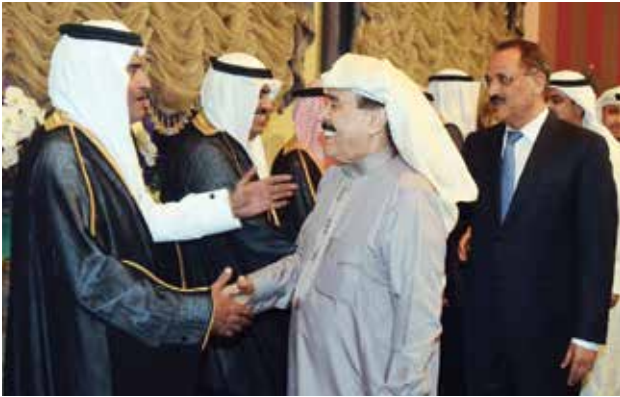
العميد أحمد الجارالله مهنتاً