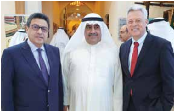
السفير الالمانى كارلفريد برغينير وأحمد اسماعيل بهباني والسفير المصري طارق القوني

أكد وزير الإعلام وزير الدولة لشؤون الشباب رئيس المجلس الوطني للثقافة والفنون والآداب محمد الجبري أن «المتحف العلمي التربوي» في بيت العثمان سيشكل إضافة جديدة ذات قيمة كبيرة للمشاهد الثقافي والتعليمي في الكويت. وأثنى الجبري في تصريح على هامش افتتاحه المرحلة الثالثة لمتحف بيت العثمان «المتحف العلمي التربوي» على هذا الانجاز الجديد، وأضاف ان المتحف يحكي تاريخ الكويت عبر الاجيال، بما يضم بين جنباته من موروثات مادية متمثلة بالمعروضات والمقتنيات التاريخية التي تعطي صورة شاملة ومعبرة عما يحمله تاريخ الكويت من مضامين ثقافية وحضارية تعبر عن أصالة الشعب الكويتي وعشقه لأرضه الطيبة الطاهرة. وذكر الجبري أن هذا العمل جاء نتيجة جهود مثمرة بقيادة رئيسة مركز العمل التطوعي الشيخة أمثال الاحمد التي لم تأل جهدا في سبيل اخراج هذا المعلم الحضاري الى النور، والدور البارز لرئيس فريق الموروث الشعبي أنور الرفاعي، مشيدا بمسؤولي وزارة التربية ومنتسبي مركز العمل التطوعي على جهودهم المقدرة.