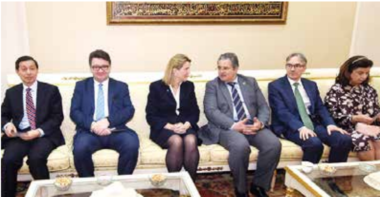
جانبا من الحضور