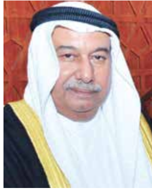
السفير محمد صالح الذويح