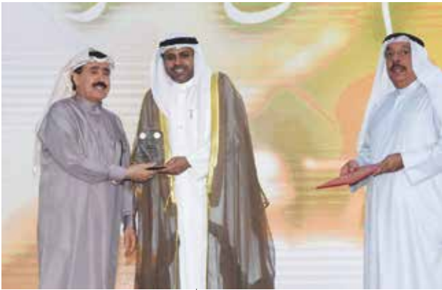
محمد الجبري مكرما العميد أحمد الجارالله بحضور أنور الرفاعي

أكد وزير الإعلام وزير الدولة لشؤون الشباب رئيس المجلس الوطني للثقافة والفنون والآداب محمد الجبري أن «المتحف العلمي التربوي» في بيت العثمان سيشكل إضافة جديدة ذات قيمة كبيرة للمشاهد الثقافي والتعليمي في الكويت. وأثنى الجبري في تصريح على هامش افتتاحه المرحلة الثالثة لمتحف بيت العثمان «المتحف العلمي التربوي» على هذا الانجاز الجديد، وأضاف ان المتحف يحكي تاريخ الكويت عبر الاجيال، بما يضم بين جنباته من موروثات مادية متمثلة بالمعروضات والمقتنيات التاريخية التي تعطي صورة شاملة ومعبرة عما يحمله تاريخ الكويت من مضامين ثقافية وحضارية تعبر عن أصالة الشعب الكويتي وعشقه لأرضه الطيبة الطاهرة. وذكر الجبري أن هذا العمل جاء نتيجة جهود مثمرة بقيادة رئيسة مركز العمل التطوعي الشيخة أمثال الاحمد التي لم تأل جهدا في سبيل اخراج هذا المعلم الحضاري الى النور، والدور البارز لرئيس فريق الموروث الشعبي أنور الرفاعي، مشيدا بمسؤولي وزارة التربية ومنتسبي مركز العمل التطوعي على جهودهم المقدرة.