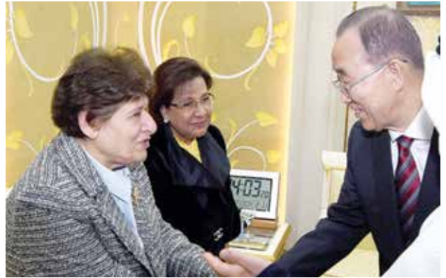
الأمين العام السابق للأمم المتحدة بان كي مون مصافحا الشيخة د. رشا الصباح