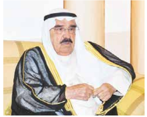
الشيخ فيصل السعود