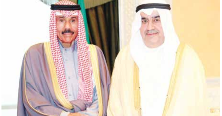
سمو ولي العهد الشيخ نواف الأحمد وأحمد اسماعيل بهبهاني

استقبل سمو ولي العهد الشيخ نواف الأحمد الجابر الصباح حفظه الله بقصر السيف، رئيس اللجنة المنظمة لمعرض الكويت للطيران 2020 أحمد اسماعيل بهبهاني، حيث اطلع سموه على الاستعدادات لمعرض الكويت للطيران 2020 والذي سيقام في الفترة من 18-15 يناير 2020 بمطار الكويت الدولي، تماشياً مع الرغبة السامية لصاحب السمو الشيخ صباح الأحمد الجابر الصباح حفظه الله و رعاه بتحويل الكويت إلى مركز مالي وتجاري ورؤية الكويت 2035.