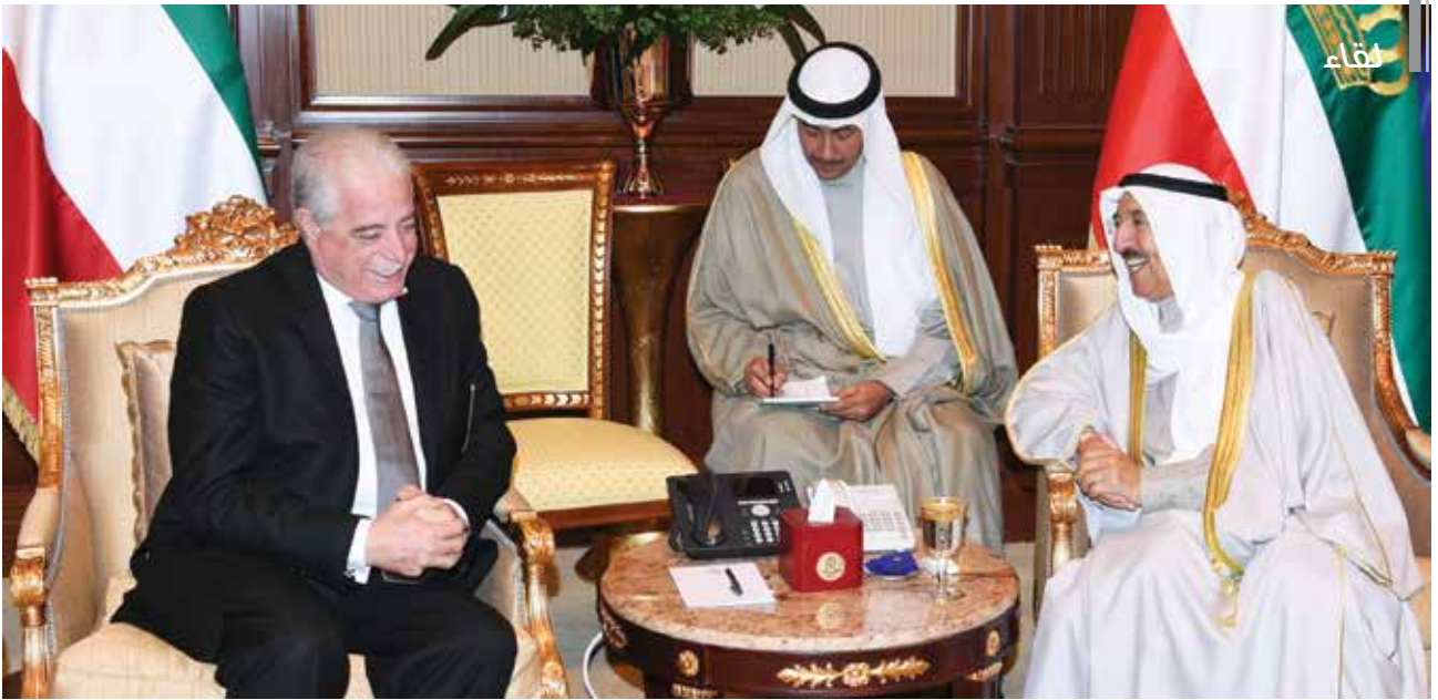
صاحب السمو الأمير الشيخ صباح الأحمد مستقبلاً محافظ جنوب سيناء بجمهورية مصر العربية اللواء خالد فودة