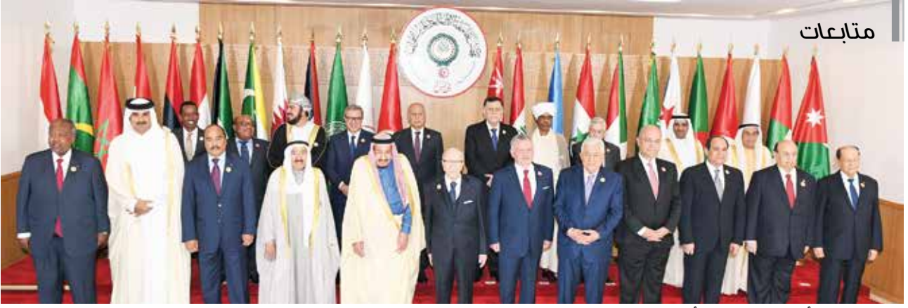
صاحب السمو الأمير الشيخ صباح الأحمد في لقطة جماعية مع قادة وممثلي الدول العربية قبل انعقاد القمة في تونس