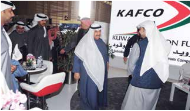
سمو الشيخ ناصر المحمد يستمع لشرح في جناح شركة KAFCO