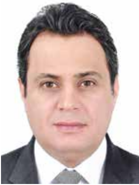
السفير عبدالعزيز البشر