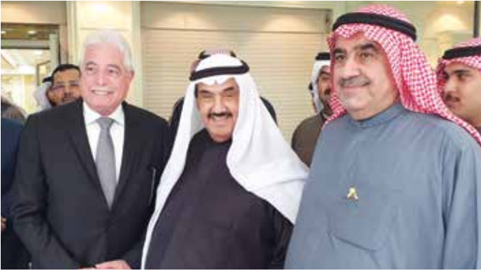
سمو الشيخ ناصر المحمد ومحافظ جنوب سيناء اللواء خالد فودة وأحمد اسماعيل بهباني

استقبل سمو الشيخ ناصر المحمد، في قصر الشويخ، الأمين العام السابق للأمم المتحدة والرئيس المشارك لمركز بان كي مون للمواطنة العالمية بان كي مون، والرئيس السابق لجمهورية النمسا الفيدرالية الدكتور هاينز فيشر ومحافظ جنوب سيناء بجمهورية مصر العربية الشقيقة اللواء خالد فودة، والوفد المرافق لهم بمناسبة زيارتهم للبلاد وعقب الاستقبال اقام سموه مأدبة غداء على شرف الضيوف والوفد المرافق لهم