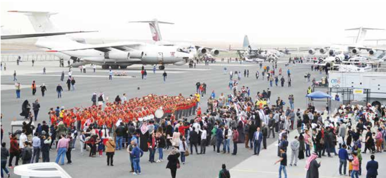
حضور كبير من الجمهور والزائرين