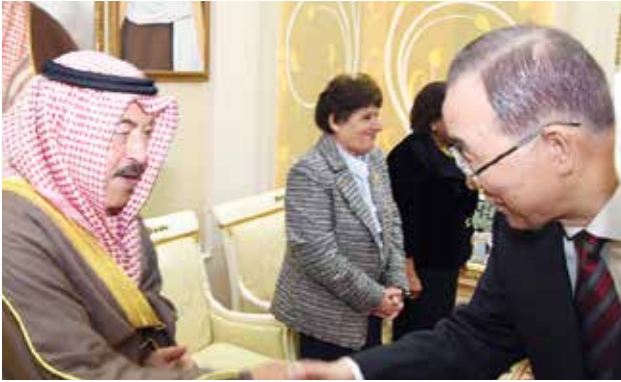
الأمين العام السابق للأمم المتحدة بان كي مون مصافحا الشيخ د. سالم جابر الأحمد