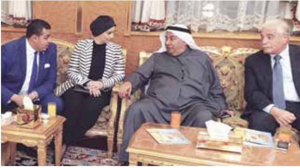
اللواء خالد فودة والسفير محمد صالح الذويخ والمستشار بالسفارة المصرية لدى الكويت نازلي الفيومي والمستشار أيمن مشهور - ديوان الغنام