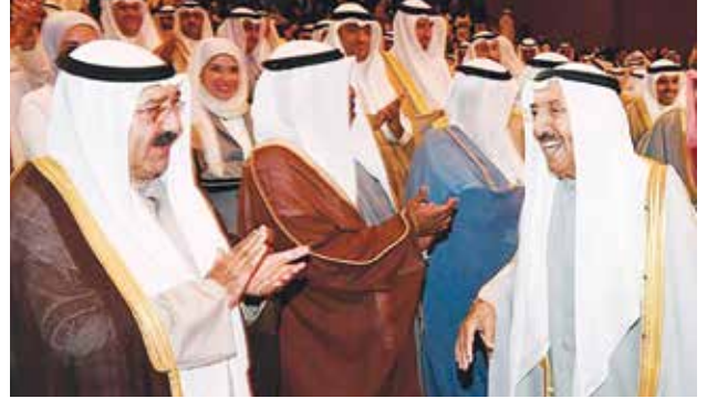
صاحب السمو الأمير الشيخ صباح الأحمد محييا الحضور ويبدو الشيخ ناصر صباح الأحمد