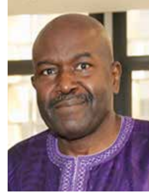
السفير عبد الاحد امباكي

التحرير على هذا التميز لمجلة «الخليج» والتي قدمت نموذجا رائعا للصحافة التي تتيح لقرائها متابعة أهم وأبرز الأحداث المحلية والإقليمية والدولية، وإلقاء الضوء عليها بالتحليل والتعليق، وإثراء قارئها بالمعلومات والأفكار القيمة بحرية ومسؤولية وكلمة مصونة من خلال الطرح الموضوعي بعيدا عن التجريح والإساءة، فهي تحرص دائما على ثوابت المجتمع الكويتي، وبها يحقق المصلحة الوطنية العليا للكويت ووحدتها الوطنية، ويساهم في توثيق الروابط الأخوية بين الشعوب.