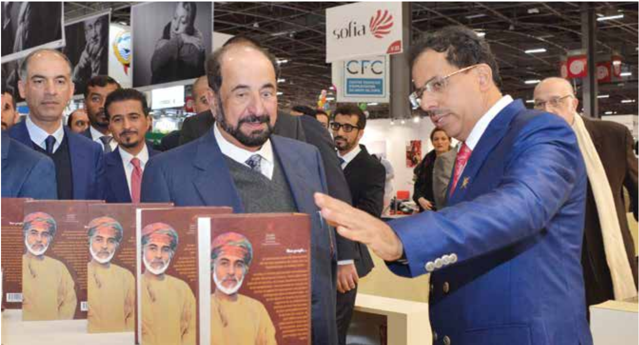
الشيخ الدكتور سلطان بن محمد القاسمي عضو المجلس الأعلى حاكم الشارقة يزور جناح سلطنة عمان بحضور د. عبدالمنعم بن منصور الحسني وزير الإعلام العماني