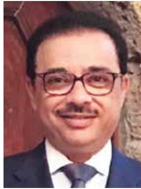
السفير بدر التيب