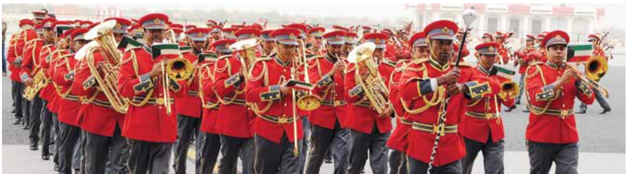
فرقة الجيش الكويتي الموسيقية

ويذكر أن معرض الكويت للطيران 2018 الذي اقيم لأول مرة بالكويت تحت برعاية سامية من حضرة صاحب السمو الشيخ صباح الأحمد الجابر الصباح أمير دولة الكويت قد حقق نجاحا كبيرا حيث أكد قدرة الطيران المدني الكويتي على استقبال مثل هذه الفعاليات التي تساهم في تلاقح جميع المهتمين بالطيران بجميع انواعه تحت سقف واحد .