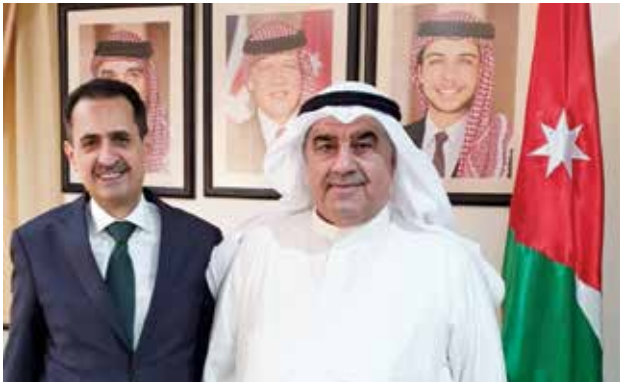
أحمد اسماعيل بهبهاني و السفير الاردني صقر ابو شتال