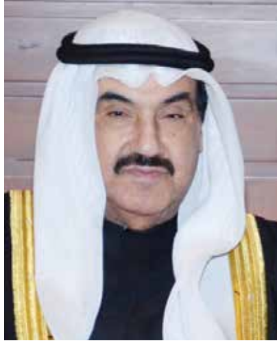
سمو الشيخ ناصر المحمد

** المبارك: سجل سموه حافل بالإنجازات فيه العمل الإنساني