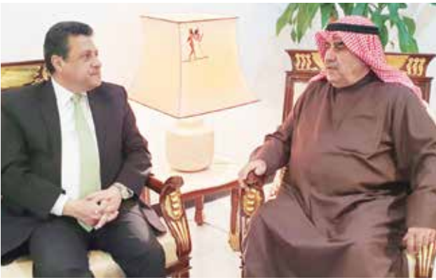
أحمد اسماعيل بهبهاني و السفير المصري طارق القوني