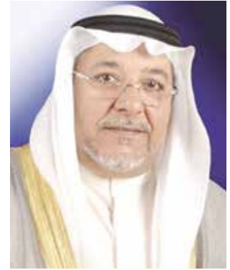
الشيخ علي الجراح

وأشاد المهنتون بحرص «الخليج» على زيادة الوعي السياسي والثقافي والاجتماعي لدى عموم القراء باطروحاتها الموضوعية والقيمة ذات المهنية الراقية في التعامل مع الاحداث. مثنين اهتمام «الخليج» بالشأن الخليجي والعربي مما يوثق العلاقات الاخوية بين شعوب دولنا من خلال الطرح الإعلامي الهادف.