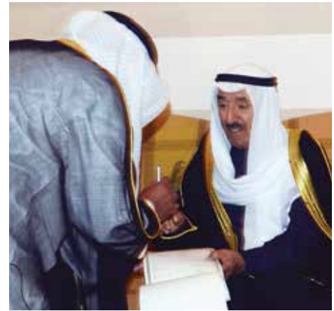
صاحب السمو الأمير الشيخ صباح الأحمد شاهدا على عقد القران