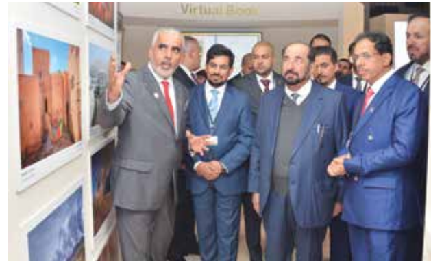
الشيخ الدكتور سلطان بن محمد القاسمي عضو المجلس الأعلى حاكم الشارقة ود. عبدالمنعم بن منصور الحسني وزير الإعلام العماني في معرض الصور العمانية