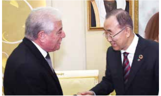
الأمين العام السابق للأمم المتحدة بان كي مون مصافحا اللواء خالد فودة