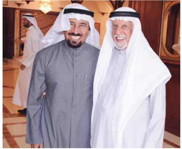
عبد العزيز الغنم والشيخ علي الجابر