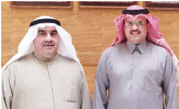
سفير خادم الحرمين الشريفين الامير سلطان بن سعد آل سعود وأحمد اسماعيل بهبهاني

سفراء الولايات المتحدة الأمريكية والسعودية والمملكة المتحدة وروسيا والمانيا وكندا وسلطنة عمان و مصر والعراق والاردن و باكستان و الهند يستقبلون رئيس اللجنة المنظمة