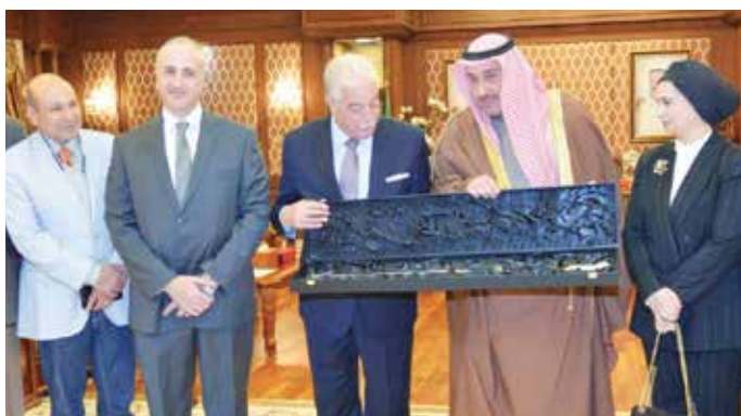
الشيخ فيصل الحمود يهدي «سينا» إلى محافظ جنوب سيناء اللواء خالد فودة بحضور المستشار بالسفارة المصرية لدى الكويت نازلي الفيومي والمستشار وليد السباعي وم. كرم معوض

استقبل محافظ الفروانية الشيخ فيصل الحمود محافظ جنوب سيناء بجمهورية مصر العربية اللواء خالد فودة والوفد المرافق له، على أرض مطار الكويت الدولي اثناء زيارتهم للبلاد.