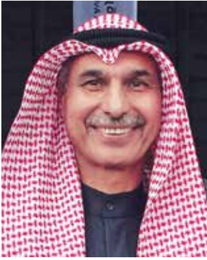
السفير مجدي الظفيري