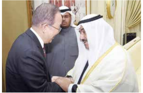
سمو الشيخ ناصر المحمد مرحبا بالأمين العام السابق للأمم المتحدة بان كي مون