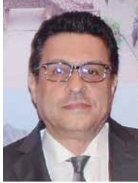
السفير طارق القوني