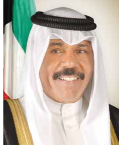
سمو ولي العهد الشيخ نواف الأحمد

وقال الغانم ان سياسة التدخل الانساني التي انتهجها سمو الامير في اكثر من ملف اضافة الى سياسات الدعم التنموي للعديد من دول العالم النامية عبر