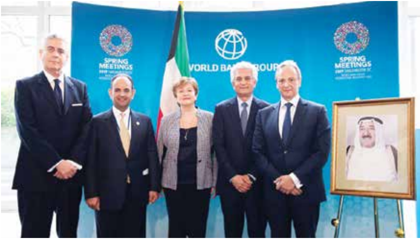
وزير المالية د. نايف الحجرف والسفير الشيخ سالم الصباح وقيادات البنك الدولي خلال حفل تكريم البنك لسمو الأمير

** المحمد: تكريم مستحق يعكس مكانة دولية مرموقة