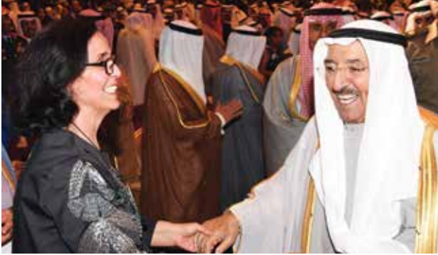
صاحب السمو الأمير الشيخ صباح الأحمد والشيخة أمثال الأحمد

صاحب السمو الأمير الشيخ صباح الأحمد وسمو ولي العهد الشيخ نواف الأحمد ورئيس مجلس الأمة مرزوق الغانم والشيخ جابر العبدالله والشيخ فيصل السعود وسمو الشيخ ناصر المحمد وسمو الشيخ جابر المبارك والشيخ علي العبدالله والشيخ ناصر صباح الأحمد ووزيرة الدفاع الإيطالية والشيخ د. إبراهيم الدعيح والشيخ علي الجراح وخالد العيسى والشيخ د. سالم الجابر وعبدالعزیز الغنم في مقدمة الحضور