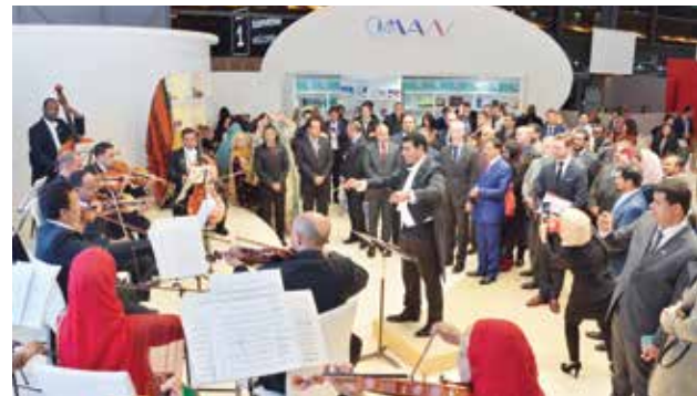
أمسية موسيقية للأوركسترا السلطانية العمانية