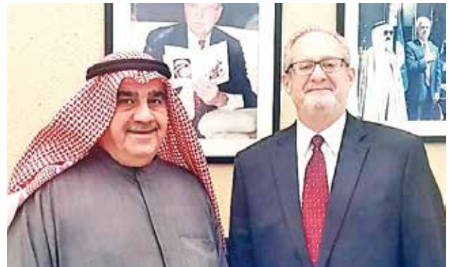
سفير الولايات المتحدة الأمريكية السفير لورانس سيلفرمان وأحمد اسماعيل بهبهاني

والتقى بهبهاني سفير روسيا الاتحادية لدى دولة الكويت السفير نيكولاي ماكاروف بمكتبه بسفارة روسيا الاتحادية ، كما التقى بهبهاني سفير جمهورية ألمانيا الاتحادية لدى دولة الكويت السفير كارلفريد بيرغندر بمكتبه في سفارة المانيا الاتحادية وسفير كندا لدى دولة الكويت السفير لويس بيير إيمون بمكتبه في سفارة كندا، والتقى بهبهاني سفير سلطنة عمان لدي دولة الكويت السفير الدكتور