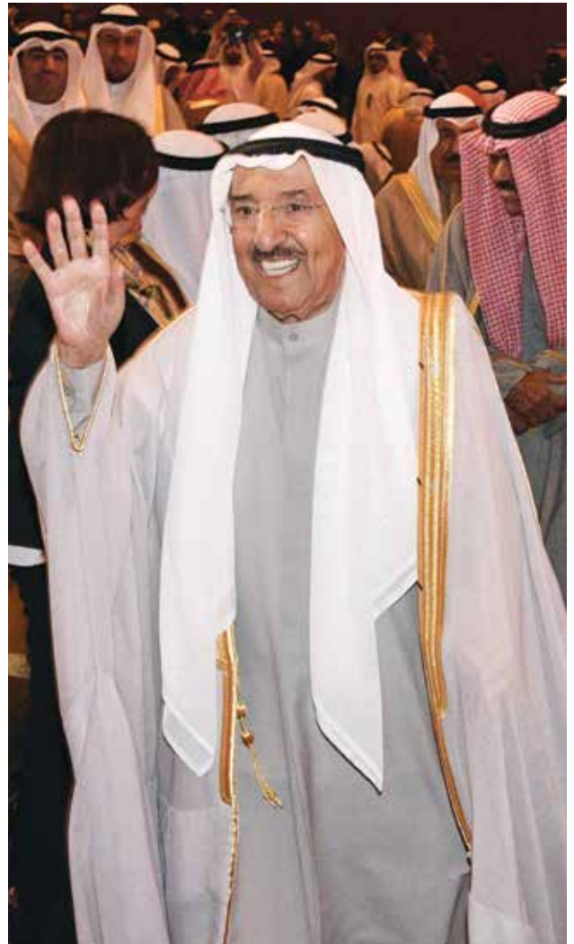
صاحب السمو الأمير الشيخ صباح الأحمد محييا الحضور

وأوضح ان الأوبريت الذي قامت بالإشراف عليه أمين سر اللجنة الدائمة للاحتفال بالأعياد والمناسبات الوطنية الشيخة أمثال الأحمد يأتي ثمرة للتعاون والتنسيق المستمرين بين وزارتي الإعلام والتربية كل عام، كما أنه يأتي أيضاً تجسيدا