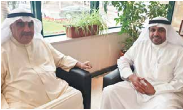
وزير الاعلام ووزير الدولة لشؤون الشباب محمد الجبري وأحمد اسماعيل بهبهاني

الجبري بمكتبه رئيس اللجنة المنظمة لمعرض الكويت للطيران 2020 أحمد اسماعيل بهبهاني ، حيث اطلعه على الاستعدادات لمعرض الكويت للطيران 2020 والذي سيقام في الفترة من 18- 15 يناير 2020 بمطار الكويت الدولي ، وذلك تماشياً مع الرغبة السامية لصاحب السمو أمير دولة الكويت الشيخ صباح الأحمد الجابر الصباح حفظه الله و رعاه بتحويل الكويت إلى مركز مالي وتجاري ورؤية الكويت 2035 .