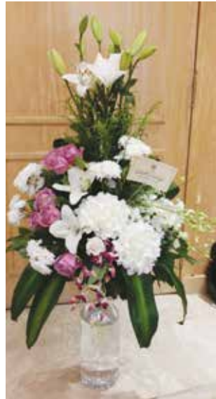
ورود من وكيل وزارة الإعلام منيرة الهويدي