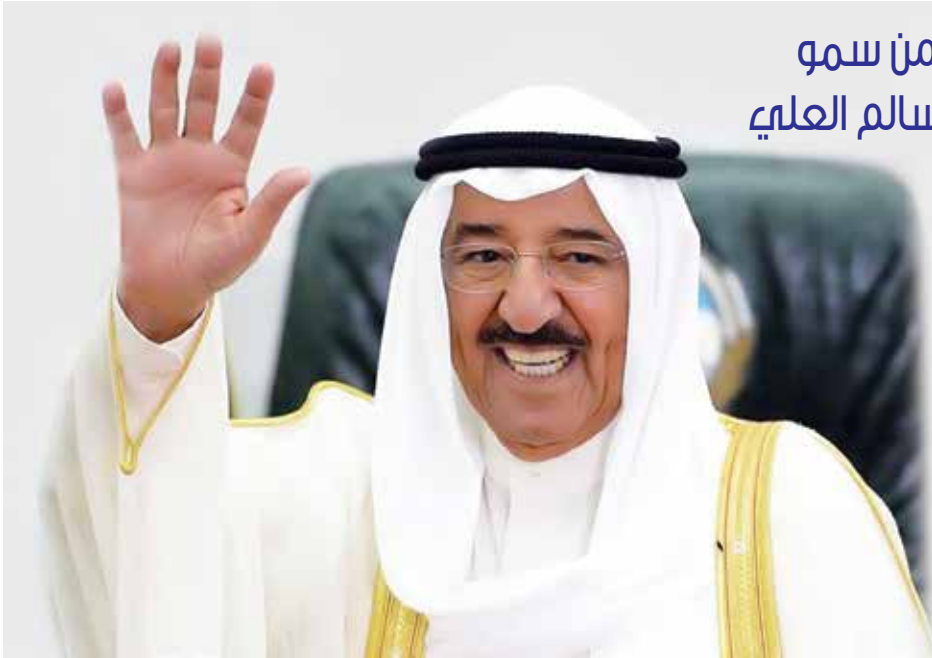
سمو الأمير الشيخ صباح الأحمد