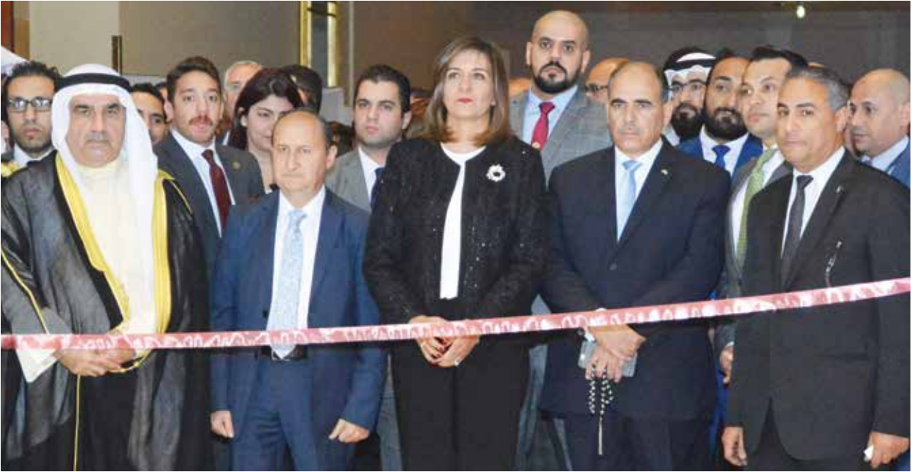
ممثل معالي رئيس الوزراء وزير التجارة والصناعة م. عمرو نصار والسفيرة نبيلة مكرم وزيرة الهجرة وشؤون المصريين بالخارج وأحمد اسماعيل بهبهاني أثناء افتتاح الاسبوع الكويتي الحادي عشر في مصر 4 ديسمبر 2018 بفندق النيل ريتز كارلتون - القاهرة

يقام برعاية رئيس الوزراء المصري في الفترة من 5 إلى 7 نوفمبر المقبل بفندق النيل ريتز كارلتون القاهرة