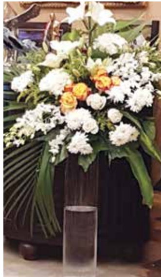
ورود من وزير الإعلام ووزير الدولة لشؤون الشباب محمد الجبري