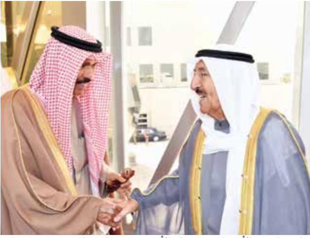
صاحب السمو الأمير الشيخ صباح الأحمد لدى مغادرته إلى تونس وفي وداعه سمو ولي العهد الشيخ نواف الاحمد