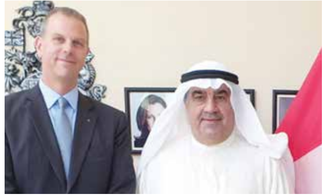
أحمد اسماعيل بهبهاني والسفير الكندي لويس بيير إيمون