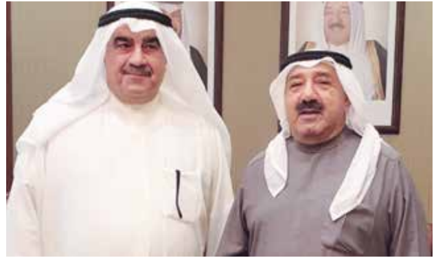
النائب الأول لرئيس مجلس الوزراء وزير الدفاع الشيخ ناصر صباح الأحمد وأحمد اسماعيل بهبهاني

الجبري بمكتبه رئيس اللجنة المنظمة لمعرض الكويت للطيران 2020 أحمد اسماعيل بهبهاني ، حيث اطلعه على الاستعدادات لمعرض الكويت للطيران 2020 والذي سيقام في الفترة من 18- 15 يناير 2020 بمطار الكويت الدولي ، وذلك تماشياً مع الرغبة السامية لصاحب السمو أمير دولة الكويت الشيخ صباح الأحمد الجابر الصباح حفظه الله و رعاه بتحويل الكويت إلى مركز مالي وتجاري ورؤية الكويت 2035 .