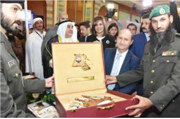
م. عمرو نصار وزير التجارة والصناعة المصري يتلقي درعا تذكارية من وزارة الدفاع الكويتية