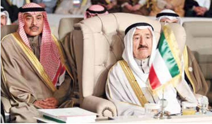
صاحب السمو الأمير الشيخ صباح الأحمد مترئسا وفد الكويت في القمة ويبدو الشيخ صباح الخالد

شدد سمو الأمير الشيخ صباح الأحمد على ضرورة توحيد المواقف العربية وتعزيز التماسك وتجاوز الخلافات لمواجهة التحديات التي تتعرض لها الأمة، داعياً سموه العالم أجمع إلى إشاعة قيم التسامح وتغليب الحوار والقبول بالطرف الآخر، كما أكد صاحب السمو أن استقرار الأمن في العالم لن يتحقق ما لم يتم تحقيق التسوية العادلة للقضية الفلسطينية، معرباً عن أسفه ورفضه الاعتراف الأميركي بسيادة إسرائيل على الجولان.