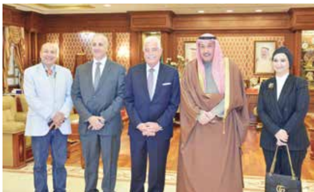
الشيخ فيصل الحمود ومحافظ جنوب سيناء اللواء خالد فودة يتوسطان المستشار بالسفارة المصرية لدى الكويت نازلي الفيومي والمستشار وليد السباعي وم. كرم معوض

وقد كرم الشيخ فيصل الحمود محافظ جنوب سيناء بإهدائه «درعا تذكارية» و«سيف» أثناء استقباله بمكتبه، وأكد المحافظ خلال اللقاء على عمق العلاقات التاريخية التي تربط بين البلدين والشعبين الشقيقين، معتبرا أنها نموذجا متميزا ورائدا للعلاقات التي يجب ان تجمع بين الدول العربية في جميع الظروف باعتبارها ضمانا للأمن والاستقرار في تلك الدول وصمام الامان لشعوبها، ومن ثم أقام المحافظ مأدبة غداء بديوان المحافظة على شرف اللواء فودة والوفد المرافق له.