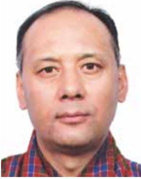
السفير تسيرنج جيلتشن بنجور