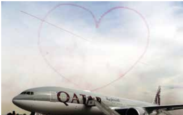
عرض جوي مميز

لبنة إلى بنيان الكويت الشامخ ، والذي نحلم جميعا بأن يزداد قوة وشموخا .