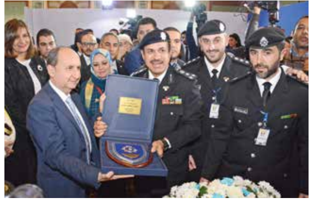
م. عمرو نصار وزير التجارة والصناعة المصري يتلقي درعا تذكارية من العميد توحيد الكندري مدير عام العلاقات والإعلام الأمني بالإنابة في وزارة الداخلية الكويتية