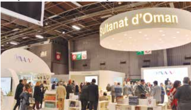
أقبال كبير على جناح سلطنة عمان

وقال ساسة أوروبيون بينهم وزراء سابقون في الخارجية والدفاع إن فرنسا، بالتحديد، تأكدت الآن من قدرة السياسة العمانية في تقديم صورة أكثر عقلانية وأكثر حكمة عن المنطقة وفي قدرتها استشراف المستقبل من خلال بناء مواقفها في وسط عالم مزدحم بالأحداث والمتغيرات.