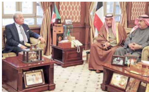
احمد اسماعيل بهباني والشيخ فيصل الحمود ومحافظ جنوب سيناء اللواء خالد فودة