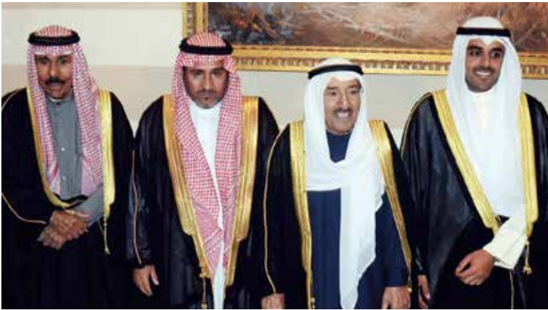
صاحب السمو الأمير الشيخ صباح الأحمد وسمو ولي العهد الشيخ نواف الأحمد يباركان