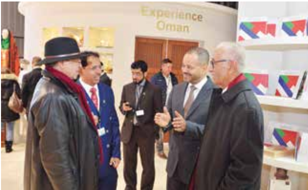
السيد بدر بن حمد بن حمود البوسعيدي أمين عام وزارة الخارجية العمانية وحديث مع د. عبدالمنعم بن منصور الحسني وزير الإعلام العماني وجانب من الحضور