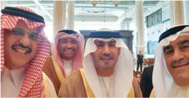
أحمد اسماعيل بهبهاني والسفير الاماراتي صقر الريسي والمستشار البحريني محمد جاسم السبت والسفير السعودي الامير سلطان بن سعد آل سعود

فيها الأصالة والمعاصرة لتقدم للعالم صورة مشرقة لكويت الأمس واليوم والغد .