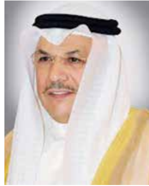
الشيخ خالد الجراح