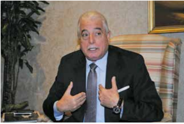
اللواء خالد فودة متحدثا خلال اللقاء

الدورات لمدة اسبوع تشمل التدريب والاقامة والاعاشة وغيرها، وقمنا بجولة شاملة داخل المعهد والقاعات الحضارية به، وايضا