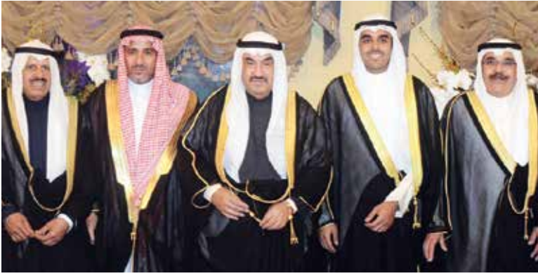
سمو الشيخ ناصر المحمد مهنتاً الشيخ فيصل المالك والمعرس خليفة المالك ووالد العروس مازن الطويل والشيخ دعيح المالك