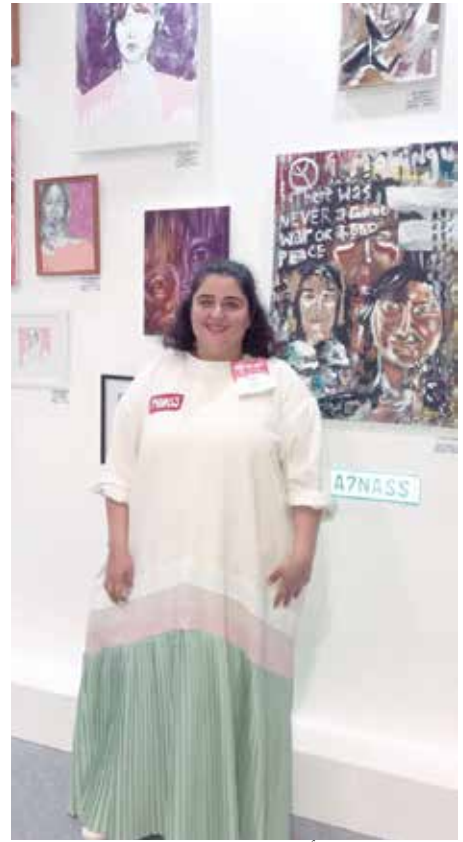
الفنانة التشكيلية أنوار بهبهاني