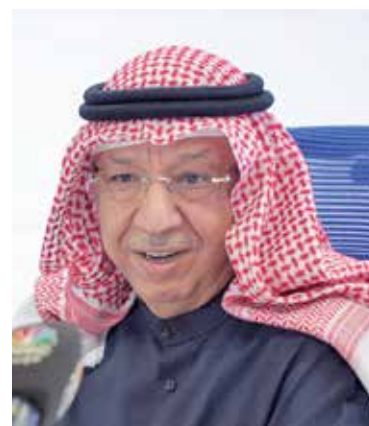
الشيخ محمد جراح الصباح

** النتائج المتميزة تأتي بفضل دعم وتوجيهات مجلس الإدارة