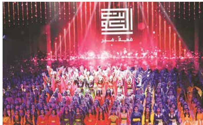
لوحات الأوبريت تؤكد العطاء الإنساني لدولة الكويت وتعزز الولاء والانتماء لدى أبنائها

العمل الوطني والشركة المنتجة. كما أعرب عن تمنياته بأن تكفل جميع الجهود لما فيه خير ورفعة ونماء الكويت الغالية في ظل القيادة الحكيمة لصاحب السمو الأمير الشيخ صباح الأحمد، وسمو ولي العهد الشيخ نواف الأحمد، وسمو رئيس مجلس الوزراء الشيخ جابر المبارك.