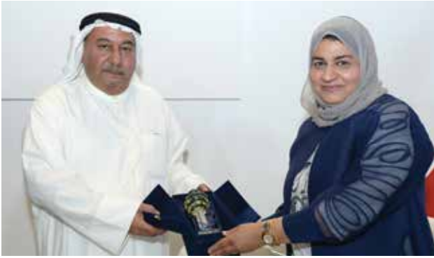
السفير محمد صالح الذويخ يتلقي درعا تذكارية من منى البلوشي في جناح الادارة العامة للطيران المدني

الراسخة القائمة بين الكويت ومصر في كل المجالات».