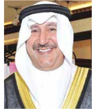
الشيخ فهد جابر الأحمد

أمير البلاد المفدى الشيخ صباح الأحمد الجابر الصباح ، وسمو ولي العهد الأمين الشيخ نواف الأحمد الجابر الصباح ، وسمو الشيخ جابر المبارك الحمد الصباح رئيس مجلس الوزراء حفظهم الله ورعاهم مع اطيب التمنيات.