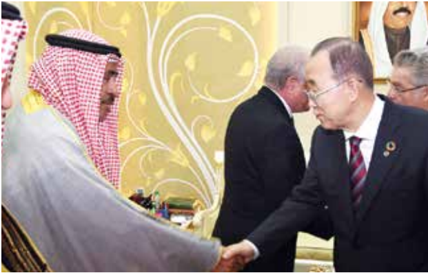
الأمين العام السابق للأمم المتحدة بان كي مون مصافحا المستشار فيصل الحجري