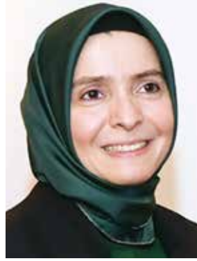
السفيرة عائشة هلال كويتاك