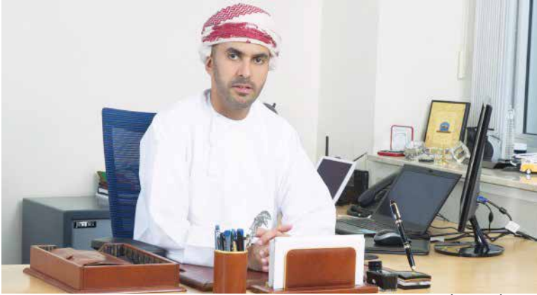
الشيخ أيمن بن أحمد بن سلطان الحوسني

** الحوسني أول عربي يتقلد هذا المنصب الكبير