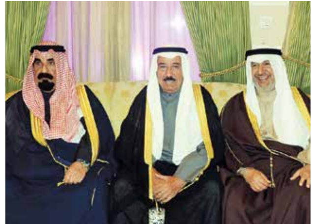
الشيخ فهد الجابر والشيخ مبارك الجابر والشيخ أحمد الخليفة