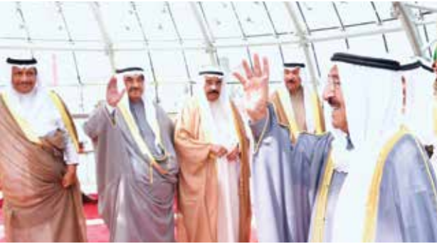
صاحب السمو الأمير الشيخ صباح الأحمد لدى مغادرته إلى تونس وفي وداعه الشيخ جابر العبد الله والشيخ فيصل السعود وسمو الشيخ ناصر المحمد وسمو الشيخ جابر المبارك

الفلسطينية على رأس اهتمامات المملكة حتى يحصل الشعب الفلسطيني على جميع حقوقه المشروعة، وعلى رأسها إقامة دولته المستقلة على حدود عام 1967م وعاصمتها القدس الشرقية، استناداً إلى القرارات الشرعية الدولية ومبادرة السلام العربية. وأضاف خدام الحرمين: نجدد التأكيد على رفضنا القاطع لأي إجراءات من شأنها المساس بالسيادة السورية على الجولان، ونؤكد أهمية التوصل إلى حل سياسي للأزمة السورية يضمن أمن سورية ووحدتها وسيادتها، ومنع التدخل الأجنبي، وذلك وفقاً لإعلان جنيف (1) وقرار مجلس الأمن (2254).