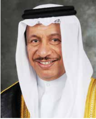
سمو الشيخ جابر المبارك