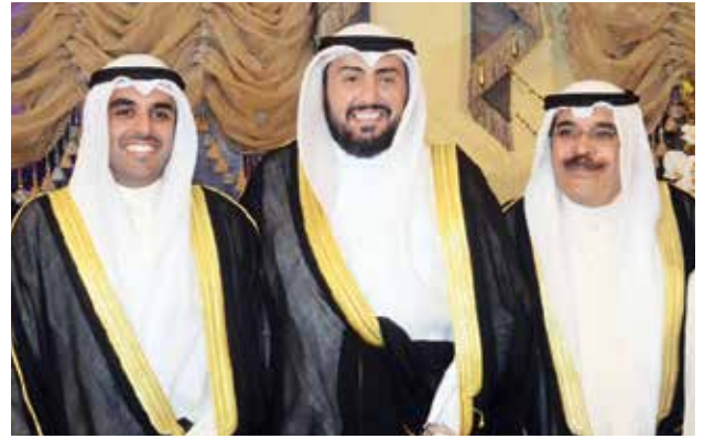
الشيخ د. باسل الصباح مباركاً