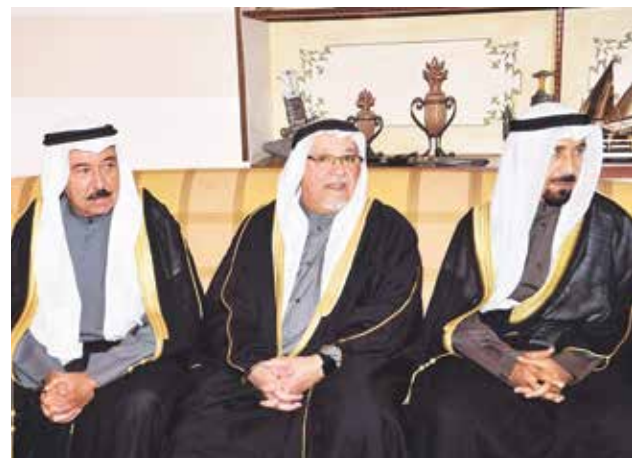
الشيخ علي الجابر والشيخ علي الجراح والشيخ مبارك الجابر