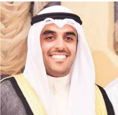
المعرس الشيخ خليفة فيصل الصباح