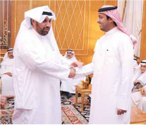
الشيخ حمد جابر العلي مرحباً بالسفير القطري بندر العطية

أقام عبد العزيز الغنم وإخوانه مأدبة غداء في ديوان الغنم بضاحية عبدالله السالم، تكريماً للسفير القطري بندرين محمد العطية، وذلك بمناسبة تسلمه مهام عمله الدبلوماسية في الكويت، حضرها الشيخ علي الجابر وعدد من الشخصيات الرسمية ورجال الأعمال. ورحب الغنم بالضيف متمنياً له التوفيق في محطته الجديدة الكويت.