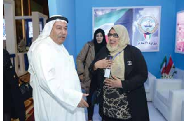
السفير محمد صالح الذويخ وهناء العصفور في جناح وزارة الاعلام