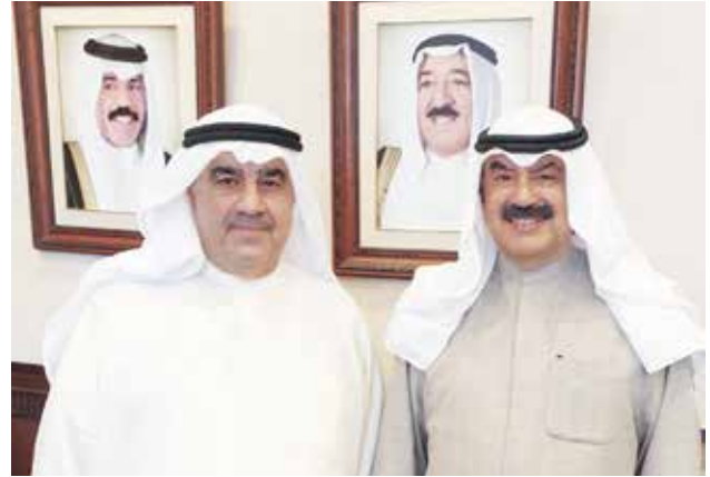
نائب وزير الخارجية السفير خالد الجار الله وأحمد اسماعيل بهبهاني