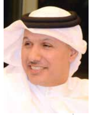
الوزير المفوض مشعل مصطفى الشمالي عيد الرشيدى