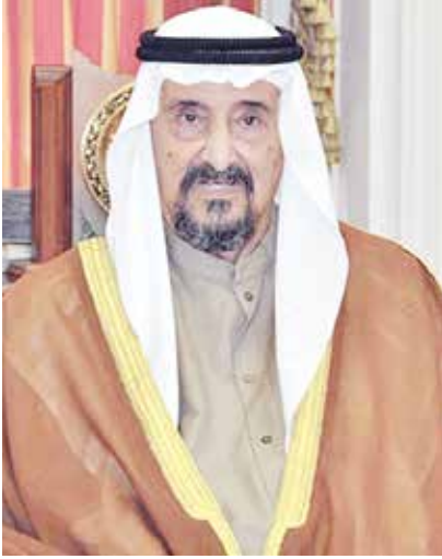
سمو الشيخ سالم العلي