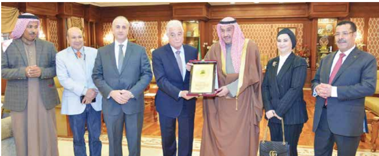
الشيخ فيصل الحمود يهدي «درعا تذكارية» إلى محافظ جنوب سيناء اللواء خالد فودة بحضور المستشار بالسفارة المصرية لدى الكويت نازلي الفيومي والمستشار وليد السباعي وم. كرم معوض وعبد المحسن ابو الحسن