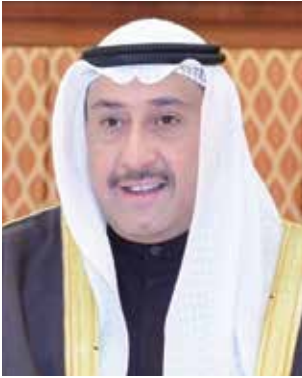
الشيخ فيصل الحمود