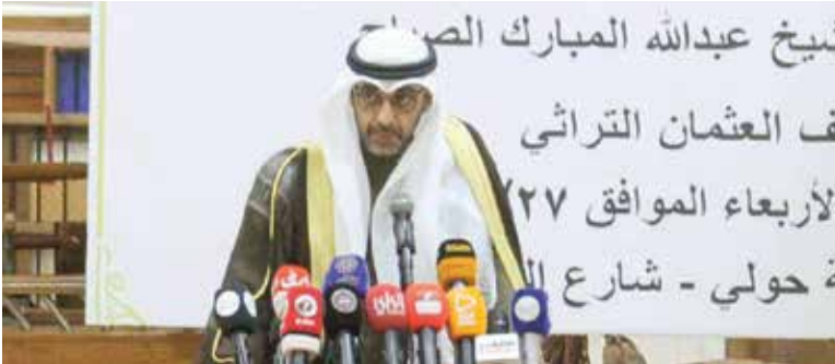
الشيخ محمد العبد الله يلقي كلمته