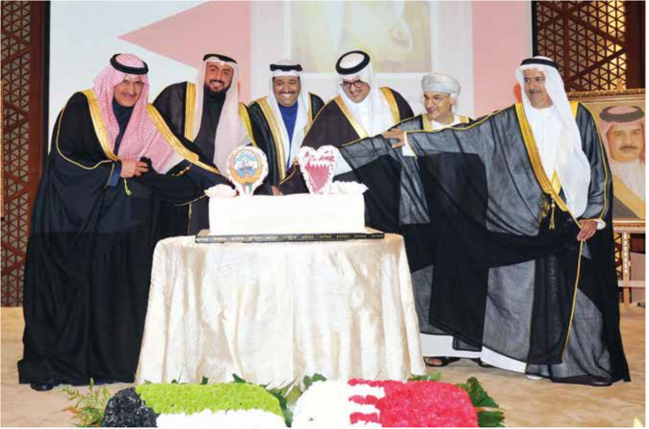
الشيخ د. باسل الصباح والسفير ضاري العجران والسفير السعودي الأمير سلطان بن سعد والقائم بالأعمال البحريني محمد جاسم السبت والقائم بالأعمال العماني هلال الشنفري خلال قطع كيكة الاحتفال