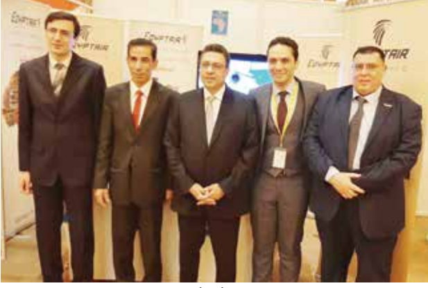
السفير المصري طارق القوني وسكرتير أول أحمد ابو المجد وايهاب جودة في جناح شركة مصر للطيران