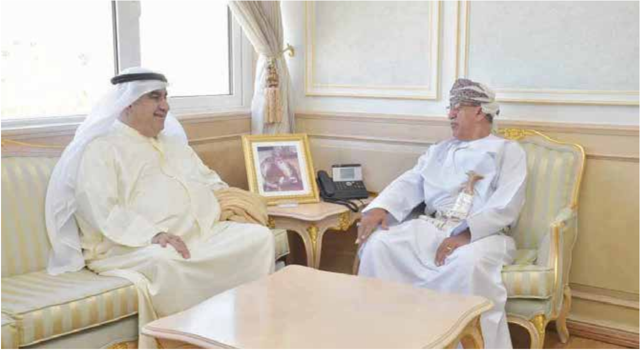
د. أحمد السعيد مستقبلاً أحمد اسماعيل بهبهاني

استقبل الدكتور أحمد السعيد وزير الصحة في سلطنة عمان بمكتبه في ديوان عام الوزارة أحمد اسماعيل بهبهاني رئيس تحرير جريدة الخليج الكويتية ، وذلك بمناسبة زيارته إلى سلطنة عمان حيث قدم بهبهاني التهنئة لوزير الصحة بمناسبة احتفال سلطنة عمان بالعيد الوطني التاسع والأربعين.