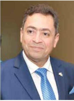
اللواء سامح لطفي مدير العلاقات الدولية بمجلس النواب المصري