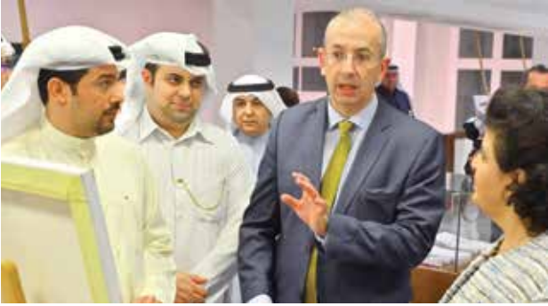
السفير البريطاني مايكل دافنبورت والشيخة هالة بدر المحمد وجابر الهندال ود. عيسى دشتي بالمعرض

وقد استعرض المصور الكويتي جابر الهندال بعدسته أبرز وأشهر معالم المملكة المتحدة في من خلال 30 صورة تضمنت مجموعة من معالم بريطانيا المختلفة.