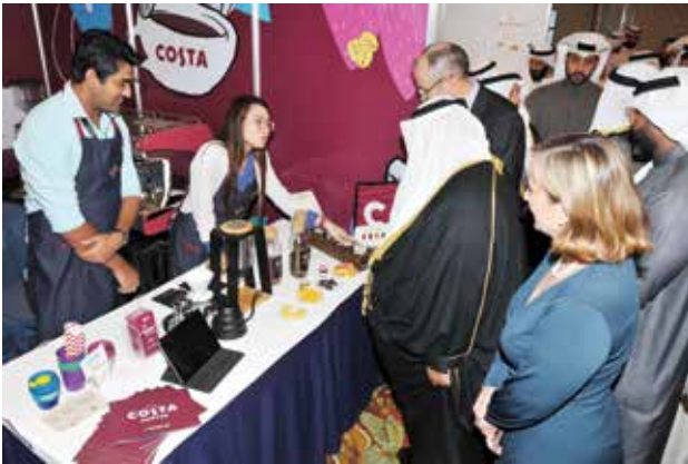
سمو الشيخ ناصر المحمد والسفير مايكل دافنبورت وايميلي كونها في جناح costa coffee