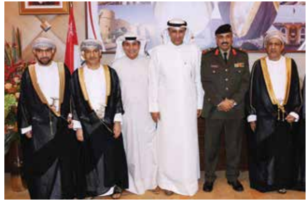
اللواء م. فيصل الجزاف واللواء م. نادر شعبان يقدمان التهاني