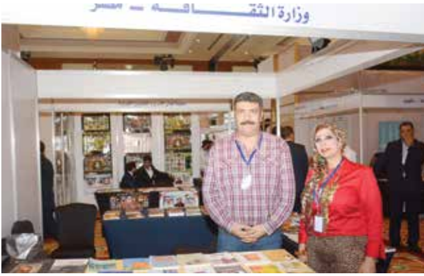
جناح وزارة الثقافة المصرية