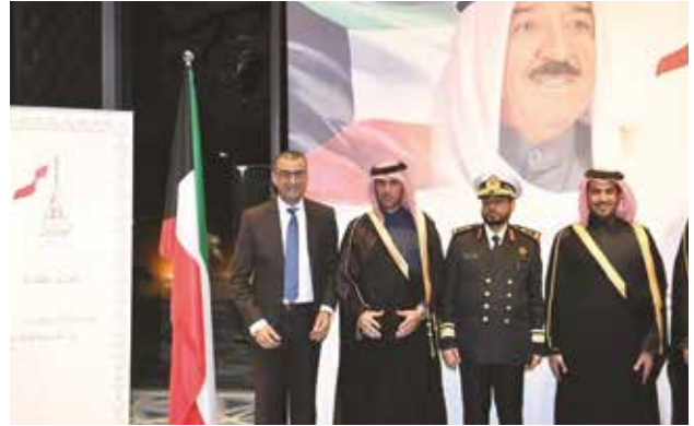
السفير التونسي أحمد بن صغير مباركا