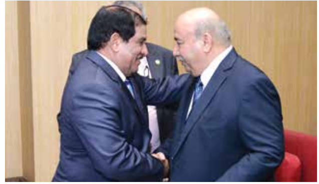
السفير الكويتي محمد صالح الذويخ والنائب حمدي سليمان رئيس لجنة الصداقة المصرية الكويتية

واكد السفير الذويخ ان الكويت احتلت مكانة كبيرة في مجال