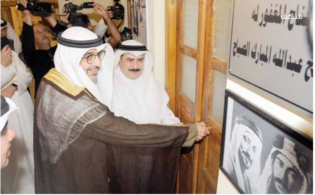
الشيخ محمد العبد الله وكامل العبد الجليل يفتتحان جناح المغفور له الشيخ عبد الله المبارك الصباح