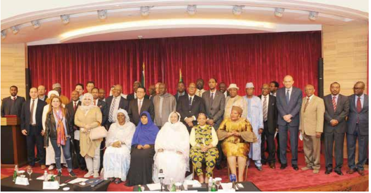
عميد السلك الدبلوماسي السفير السنغالي عبدالاحد امباكي والسفير المصري طارق القوني يتوسطان الحضور من السفراء والدبلوماسيين

الاحتفال الثقافة الافريقية والعادات والتقاليد إضافة الى الامكانيات الاستثمارية والسياحية في القارة السمراء، معربا عن سعادته للمشاركة الرسمية من الجانب الكويتي، لافتا الى أن مصر ترأس الاتحاد الافريقي وحرصنا على المشاركة بفعالية سواء بالمعروضات المصرية او من خلال مشاركة مصر للطيران.