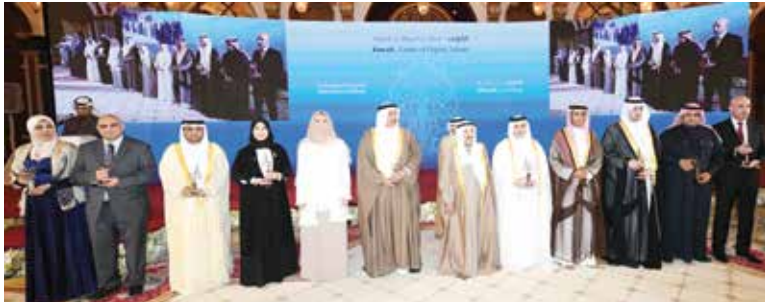
صاحب السمو الأمير الشيخ صباح الأحمد والشيخة عايدة سالم العلي مع الفائزين