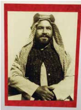
صورة الشيخ احمد الجابر على متن السفينة أثناء توجهه إلى بريطانيا

السفير البريطاني مايكل دافنبورت والشيخة هالة بدر المحمد والمستشار محمد أبو الحسن ود. عادل حسين عبدالرزاق ود. عيسى دشتي خلال قص شريط الافتتاح