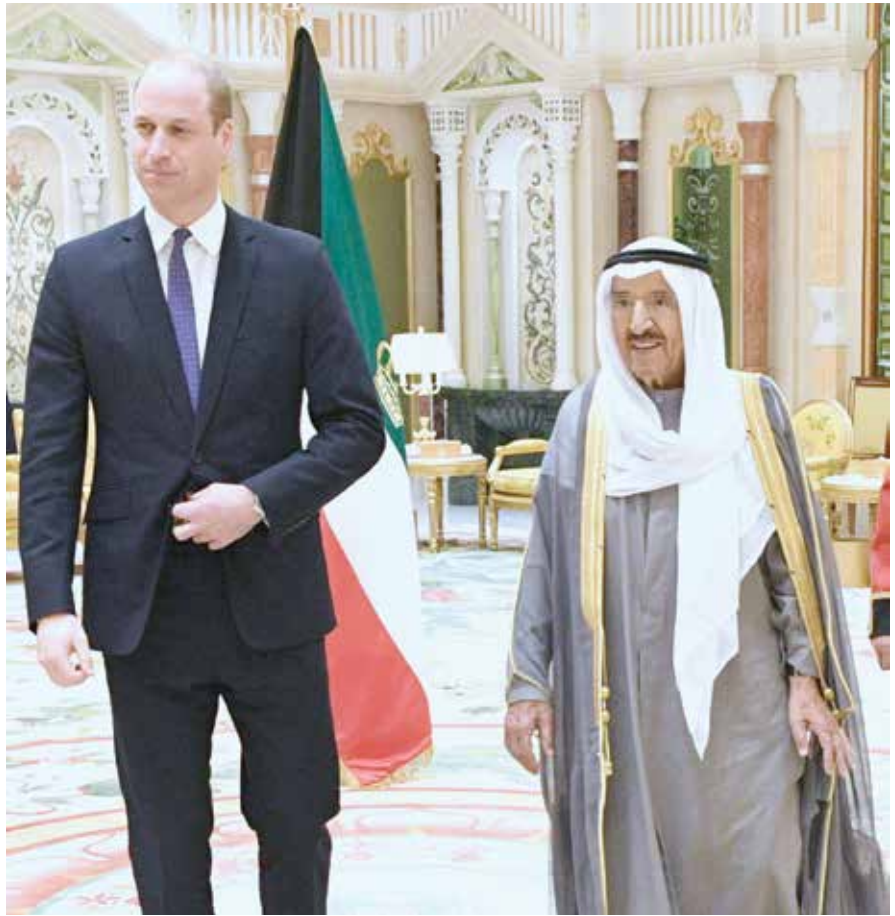
صاحب السمو الأمير الشيخ صباح الأحمد مستقبلاً صاحب السمو الملكي الأمير ويليام

كما اقام صاحب السمو الأمير بقصر بيان مأدبة غداء على شرف صاحب السمو الملكي الأمير ويليام دوق كامبريدج والوفد الرسمي المرافق لسموه، وذلك بمناسبة زيارته الرسمية للبلاد.