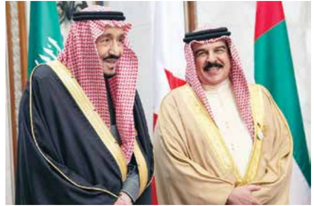
خادم الحرمين الشريفين الملك سلمان بن عبدالعزيز وعاهل البحرين الملك حمد بن عيسى

اعتماده في لقائنا من قرارات وتوصيات ستسهم بلا شك في دعم مسيرتنا وتحقيق طموحنا ولعل لقاءنا المبارك اليوم بأجواء إيجابية مؤشر على عزمنا لتحقيق الوحدة في مواقفنا والتمسك بوحدتنا.