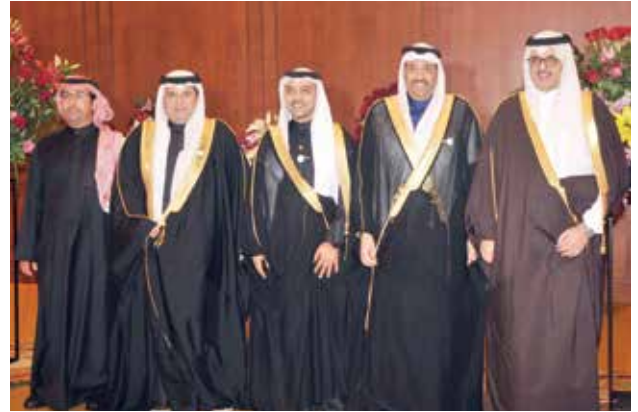
السفير السعودي الأمير سلطان بن سعد مهنتا