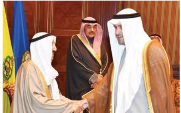
صاحب السمو الأمير الشيخ صباح الأحمد مصافحاً انس الصالح