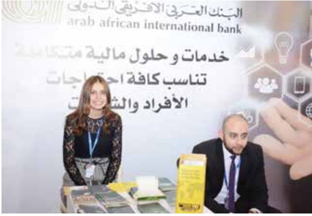
جناح البنك العربي الافريقي الدولي