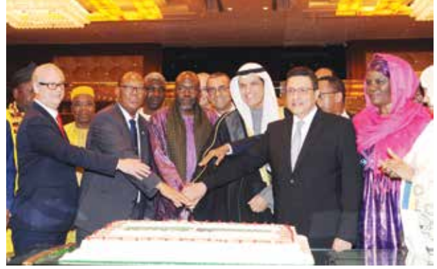
السفير علي السعيد وعميد السلك الدبلوماسي السفير السنغالي عبدالاحد امباكي والسفير المصري طارق القوني وعدد من السفراء والدبلوماسيين يقطعون كيك الاحتفال

ان وجود عدد كبير من السفارات الكويتية لدى افريقيا دليل اهتمام القيادة السياسية بالعلاقات مع جميع دول القارة السمراء، معربا عن فخره للبعثات الواضحة التي تركها الراحل د.عبدالرحمن السميح في القارة الافريقية، مؤكداً انه «كان منارة علم وثقافة وضرب نموذجاً رائعاً في مساعدة الانسان لأخيه الانسان».