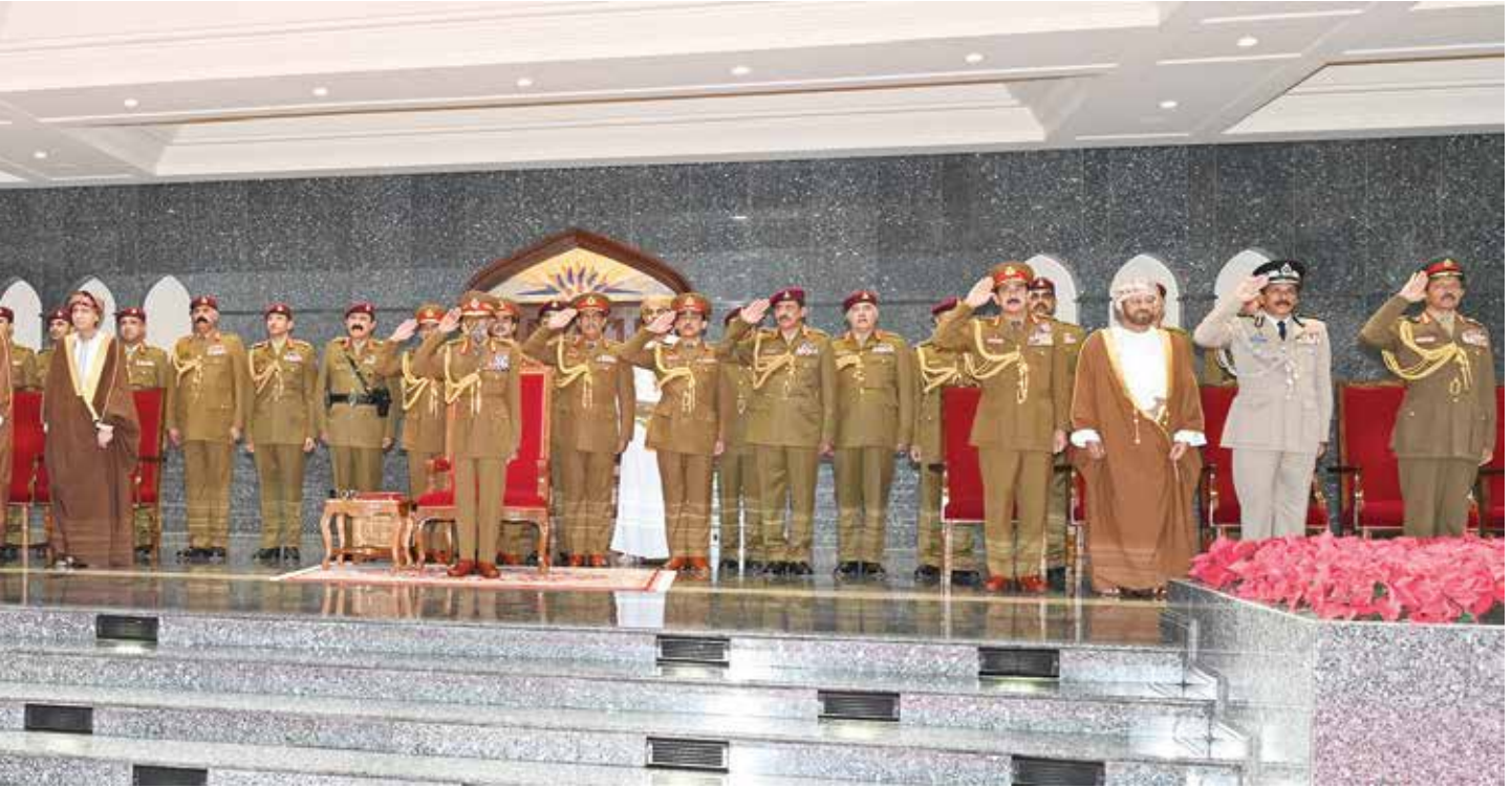
صاحب الجلالة السلطان قابوس بن سعيد يشمل برعايته العرض العسكري الذي أقيم على ميدان الاستعراض العسكري بقاعدة سعيد بن سلطان البحرية