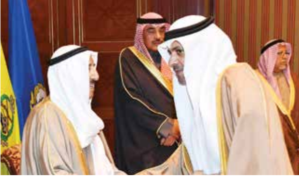
صاحب السمو الأمير الشيخ صباح الأحمد مصافحاً محمد الجبري