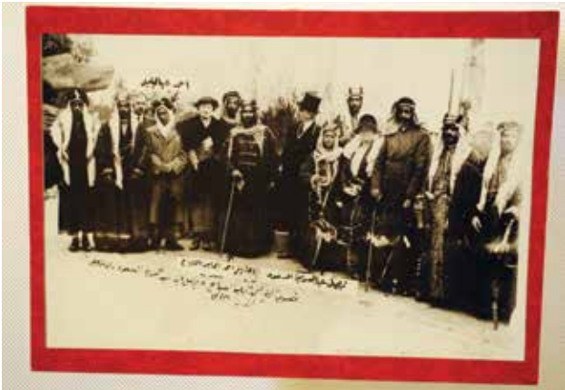
صورة جماعية للوفد الكويتي والسعودي بقصر باكنغهام