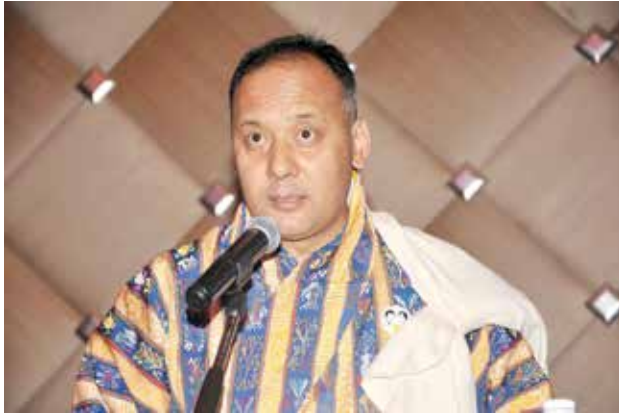
سفير مملكة بوتان تسيرنج جيلتشن بنجور

بحضور سمو الشيخ ناصر المحمد ومساعد وزير الخارجية لشؤون الوطن العربي السفير فهد العوضي ووكيل وزارة الاعلام المساعد لقطاع السياحة يوسف مصطفى ، وعدد كبير من السفراء والشخصيات العامة والجالية البوتانية احتفلت سفارة مملكة بوتان بالعيد الوطني ال 112 .