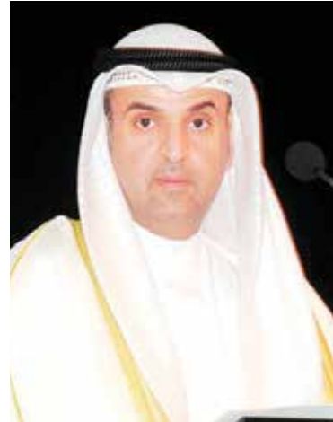
د. نايف الحجرف متحدثا