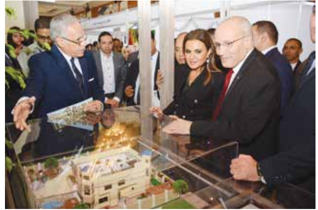
اللواء د. محمد العصار وزير الإنتاج الحربي المصري ود. سحر نصر وزيرة الاستثمار والتعاون الدولي المصري في جناح الشركة المصرية الكويتية للتنمية العقارية