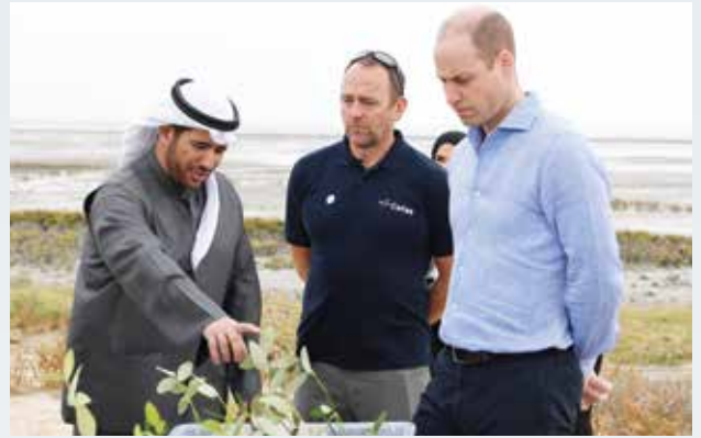
صاحب السمو الملكي الأمير وليام وشرح من الشيخ عبد الله الأحمد عن النباتات بمحمية الجهراء