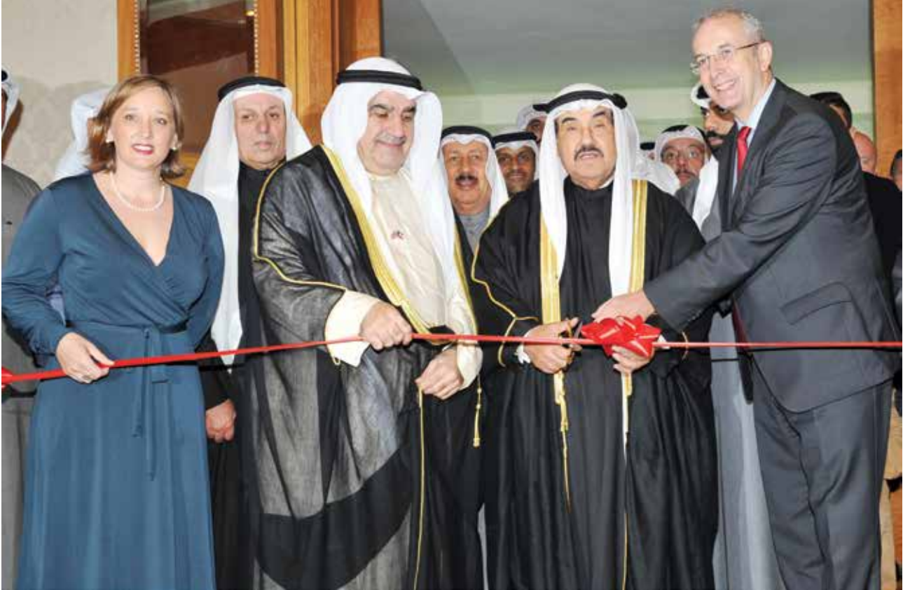
سمو الشيخ ناصر المحمد والسفير البريطاني مايكل دافنبورت وأحمد اسماعيل بهبهاني وإيميلي كونها خلال افتتاح المعرض البريطاني 25 نوفمبر الماضي في فندق الشيراتون، الكويت

برعاية وحضور سمو الشيخ ناصر المحمد، وسفير المملكة المتحدة لدى الكويت السفير مايكل دافنبورت، أقيم الأسبوع البريطاني العاشر في الكويت خلال الفترة من 25 حتى 27 نوفمبر الماضي في فندق الشيراتون، الكويت، بمشاركة 30 شركة بريطانية قامت بعرض علامات وماركات تجارية بريطانية. أقيم الأسبوع البريطاني العاشر في الكويت في ظل احتفال الكويت وبريطانيا هذا العام بمرور 120 عاماً على مسيرة الشراكة والصداقة والعلاقات الراضخة منذ توقيع المغفور له بإذن الله تعالى الشيخ مبارك الصباح على المعاهدة الكويتية - البريطانية في عام 1899.