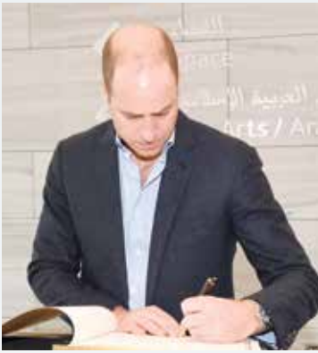
صاحب السمو الملكي الأمير وليام يسجل كلمة بمركز الشيخ عبدالله السالم الثقافي