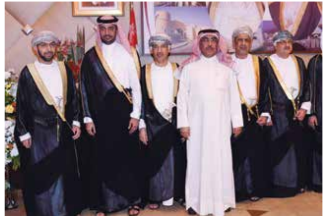
السفير القطري بندر العطية وعدنان الراشد يهنئان