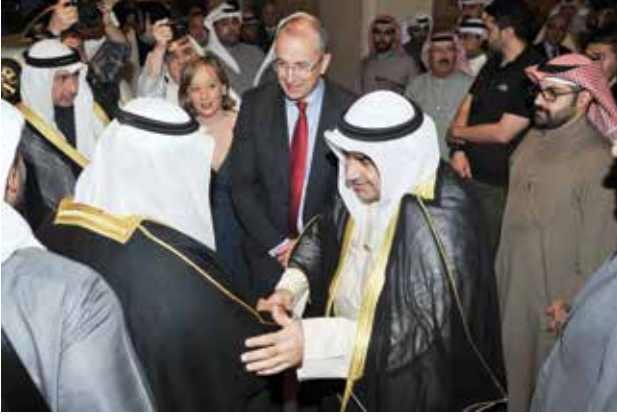
سمو الشيخ ناصر المحمد وترحيب من أحمد اسماعيل بهبهاني بحضور والسفير البريطاني مايكل دافنبورت وايميلي كونها ومحمد ابل واسماعيل أحمد بهبهاني