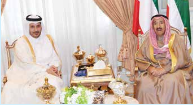
صاحب السمو الأمير الشيخ صباح الأحمد مستقبلاً رئيس الوزراء القطري معالي الشيخ عبدالله بن ناصر بن خليفة آل ثاني

استقبل صاحب السمو الأمير الشيخ صباح الأحمد الشيخ عبدالله بن ناصر بن خليفة آل ثاني رئيس مجلس الوزراء ووزير الداخلية بدولة قطر الشقيقة وذلك بقصر الدرعية في الرياض وذلك اثناء الدورة الـ 40 لقمة قادة مجلس التعاون.