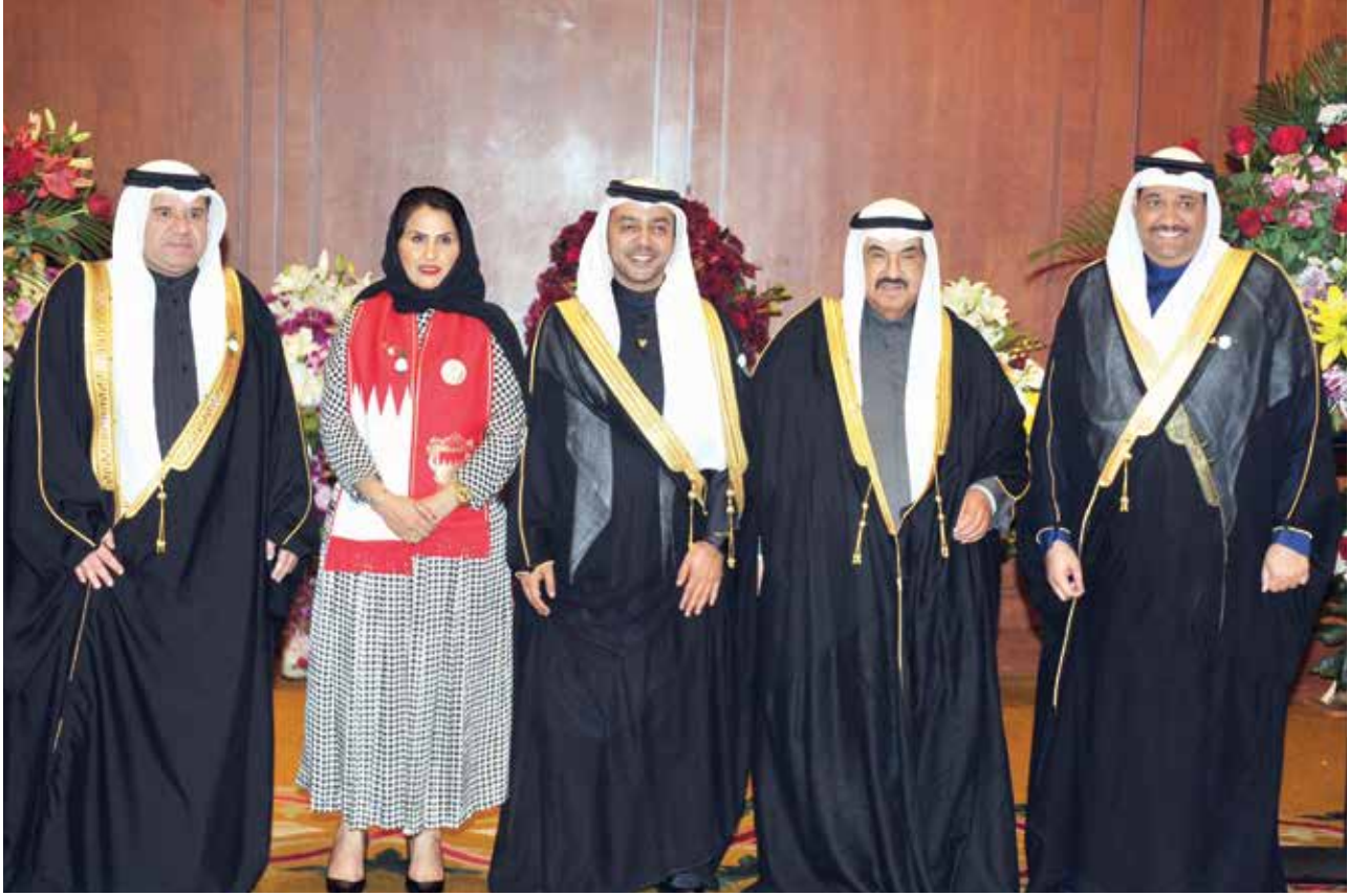
سمو الشيخ ناصر المحمد يقدم التهاني للقائم بالأعمال في البحريني محمد جاسم السبت