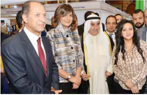
وزير مفوض جيهان اشكناني وأحمد اسماعيل بهبهاني والسفيرة نبيلة مكرم وزيرة الهجرة وشؤون المصريين في الخارج جامعة الدول العربية والسفير بدر الدين العلالي الامين العام المساعد لجامعة الدول العربية رئيس قطاع الاتصال والاعلام المساعد في جناح جامعة الدول العربية