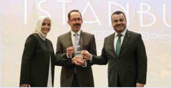
السفيرة التركية عائشة كويتاك وروبير حايك أثناء التكريم

نالت مجموعة بودي للطيران جائزتين مرموقتين من الخطوط الجوية التركية، والخطوط الجوية الألمانية (لوفتهانزا)، وذلك لتصدرها في بيع تذاكر الناقلتين في الكويت.