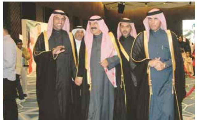
خالد الجارالله والسفير القطري بندر العطية