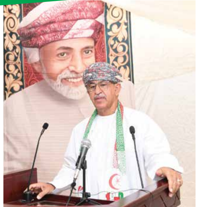
د. احمد السعيد يلقي كلمة

إستهل برنامج الحفل بعزف السلام السلطاني، بعدها القى معالي الدكتور أحمد بن محمد بن عبيد السعدي - وزير الصحة - كلمة عبر فيها عن فرحته وبقيّة موظفي الوزارة بمناسبة ذكرى العيد الوطني المجيد ، واستعرض معاليه من خلال كلمته أبرز إنجازات الوطن التي تحققت في المجال الصحي منذ بداية النهضة المباركة وحتى الآن ، وثمن جهود جميع الموظفين من المواطنين والوافدين الذين يقدمون