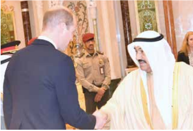
سمو الشيخ ناصر المحمد مصافحا صاحب السمو الملكي الأمير ويليام