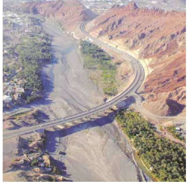
منظر جوي لجسر وادي فنحاء