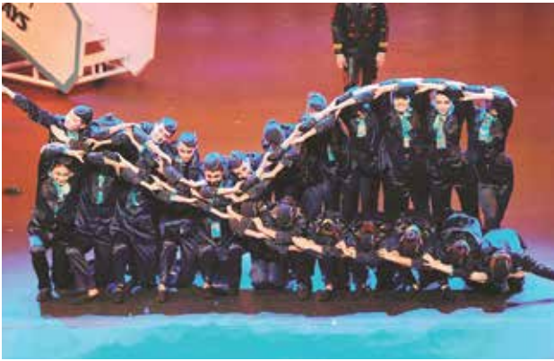
إحدى الفقرات المتميزة ويبدو شعار الكويتية