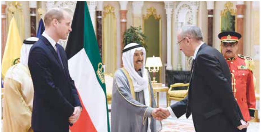
صاحب السمو الأمير الشيخ صباح الأحمد مصافحاً السفير البريطاني مايكل دافنبورت بحضور صاحب السمو الملكي الأمير ويليام