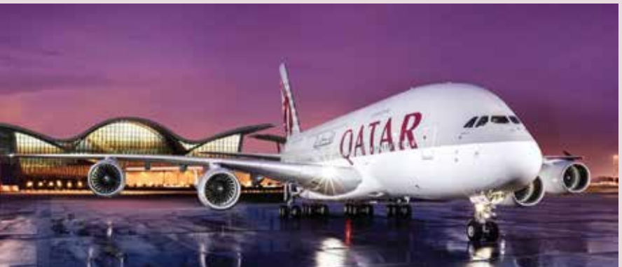
الخطوط الجوية القطرية