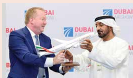
سمو الشيخ أحمد بن سعيد آل مكتوم وستانلي ديل

عبر شبكة خطوطنا العالمية، وتمثل هذه الصفقة استثماراً مستقبلياً كبيراً وإضافة قيمة لأسطولنا في المستقبل". وأضاف: "سوف تعزز طائرات 787 تنوع أسطولنا وتمنحنا مزيداً من المرونة التشغيلية من حيث السعة والمدى والاستخدام لربط مزيد من المدن العالمية عبر دبي، ونؤكد التزامنا نحو برنامج 777X ونتطلع قدماً إلى إدخال هذه الطائرة الخدمة