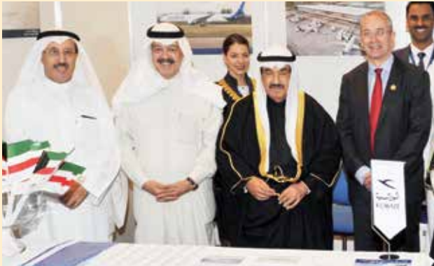
سمو الشيخ ناصر المحمد متوسطاً يوسف الجاسم والسفير البريطاني مايكل دافنبورت وسامي النصف في جناح شركة الخطوط الجوية الكويتية

تقدمه من خدمات متميزة للركاب خصوصا بعد تدشين مبنى الركاب رقم 4 وحصول الشركة على عدة جوائز في انضباط المواعيد وراحة المقاعد وغيرها من الجوائز التي وضعت الخطوط الجوية الكويتية في المقدمة بين كبرى شركات الطيران العالمية.