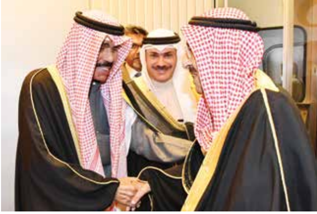
صاحب السمو الأمير الشيخ صباح الأحمد لدى وصوله إلى الكويت وفي استقباله سمو ولي العهد الشيخ نواف الأحمد وبيدو الشيخ خالد العبد الله