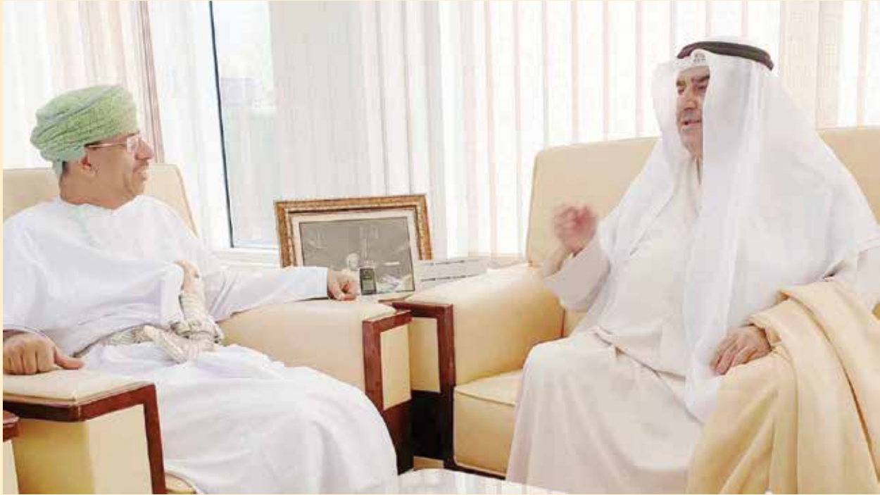
د. عبد المنعم الحسني مستقبلا أحمد اسماعيل بهبهاني

استقبل الدكتور عبد المنعم الحسني وزير الاعلام في سلطنة عمان بمكتبه في وزارة الاعلام أحمد اسماعيل بهبهاني رئيس تحرير جريدة الخليج الكويتية، وذلك بمناسبة زيارته إلى سلطنة عمان حيث قدم بهبهاني التهنة لوزير الاعلام بمناسبة احتفال سلطنة عمان بالعيد الوطني التاسع والاربعين.