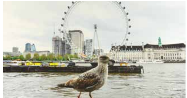
طائر التورس ونهر التايم وعين لندن