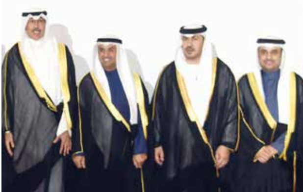
ناصر الحجرف ود. نايف الحجرف والشيخ فواز الخالد بهنتون

اقامت سفارة الامارات العربية المتحدة حفل استقبال بمناسبة اليوم الوطني الإماراتي الـ 48 بحضور سمو الشيخ ناصر المحمد وعدد من الشيوخ والوزراء وأعضاء السلك الدبلوماسي والشخصيات العامة