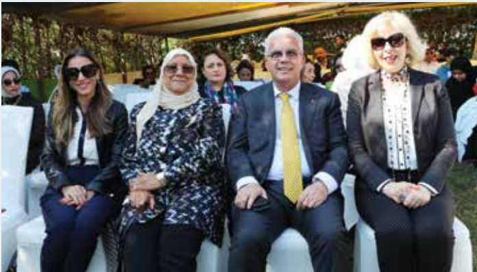
السفير الفلسطيني رامي طهوب وحرمة ريماء الخالدي ود. معصومة المبارك وحرمة سفير المملكة الأردنية الهاشمية منار كريشان

وشهد الحفل عرضاً للأعمال الفنية المخصصة لهذا اليوم وأقاموا أيضاً الكثير من اللوحات التعريفية بدولة فلسطين وأهم خصائصها، إضافة إلى فقرات فنية ودبكة فلسطينية شعبية. وقد تخلل الحفل الكثير من الكلمات التي أشادت بأهمية اللغة العربية كتأكيد لهويتنا الوطنية وقوميتنا العربية الحضارية كما القت زيزي بوشهري قصيدة.