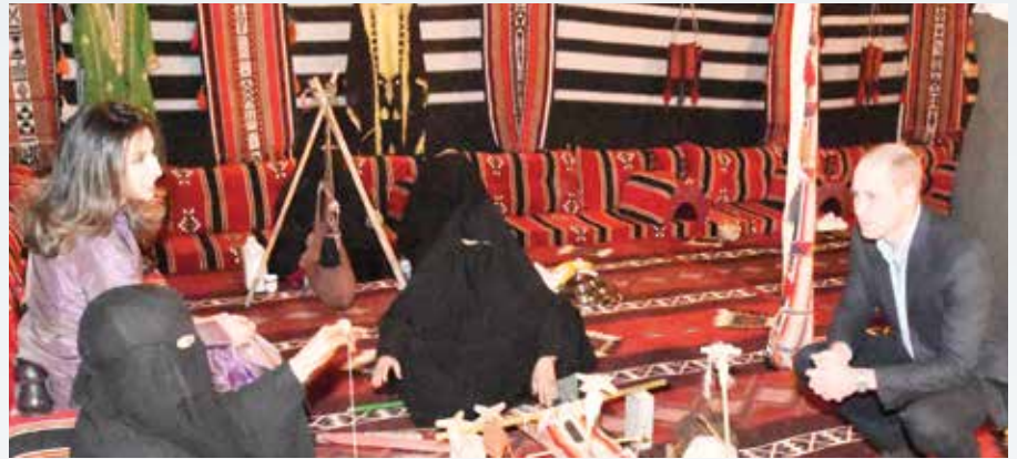
صاحب السمو الملكي الأمير وليام في خيمة بالصحراء