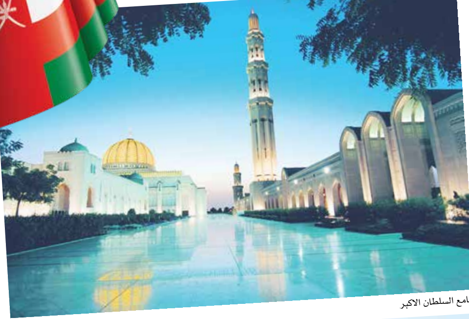
جامع السلطان الاكبر