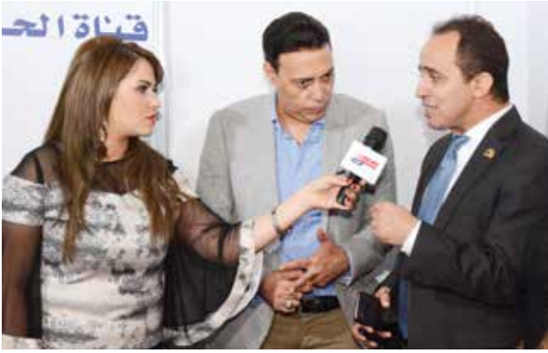
النائب محمد اسماعيل والاعلامي محمد الغيطي والمذيعة فاطمة محفوظ في جناح قناة الحدث الفضائية