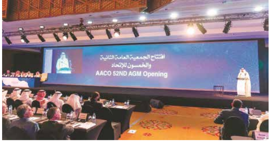
جانب من الحضور خلال حفل الافتتاح