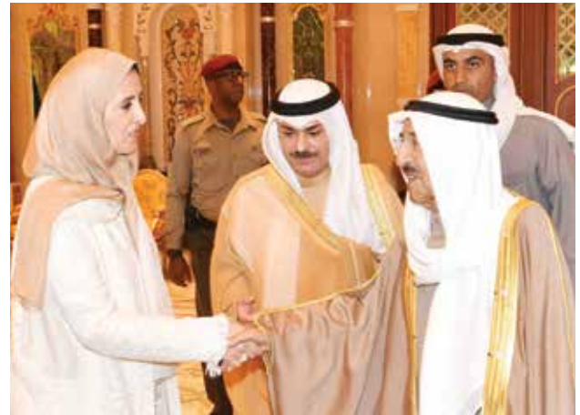
صاحب السمو الأمير الشيخ صباح الأحمد مصافحا الشيخة عايذة سالم العلي ويبدو الشيخ خالد العبد الله