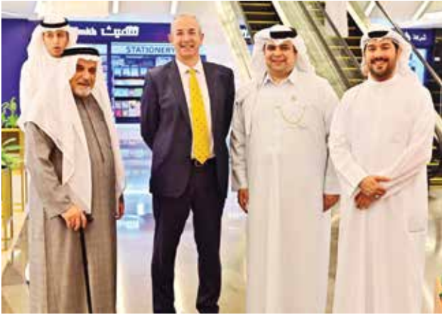
جابر الهندال ود. عيسى دشتي والسفير البريطاني مايكل دافنبورت ويحيى دشتي

اكتوبر 1919 وهو لقاء الشيخ أحمد الجابر والوفد المرافق له بالملك جورج الخامس في قصر باكنغهام وقدم للملك جورج الخامس هدايا باسم حاكم الكويت، عبارة عن سيف