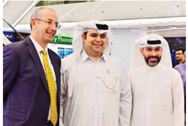
الاعلامي هاشم أسد ود. عيسى دشتي والسفير البريطاني مايكل دافنبورت