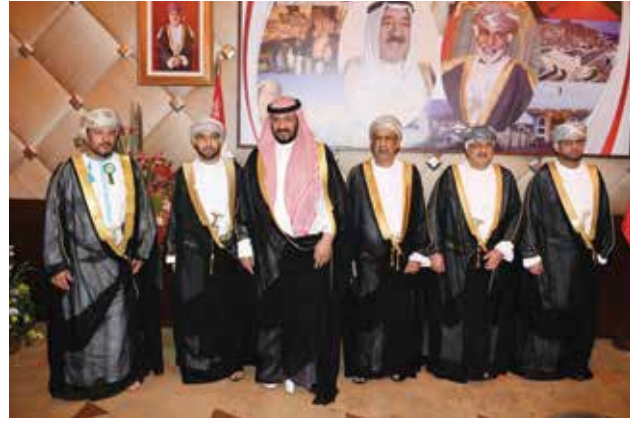
الشيخ طلال الخالد مباركا