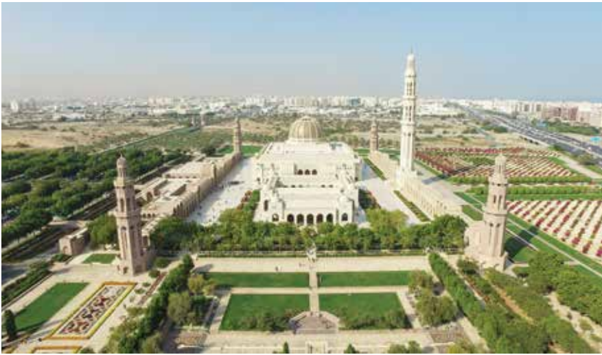
جامع السلطان قابوس الأكبر