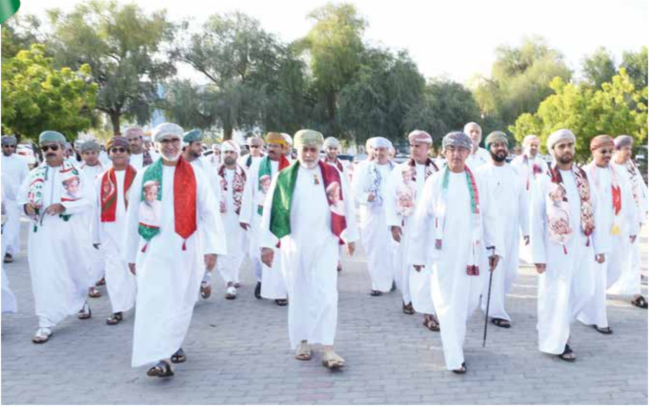
د . احمد السعيد والوكلاء وعدد من المسؤولين بوزارة الصحة العمانية