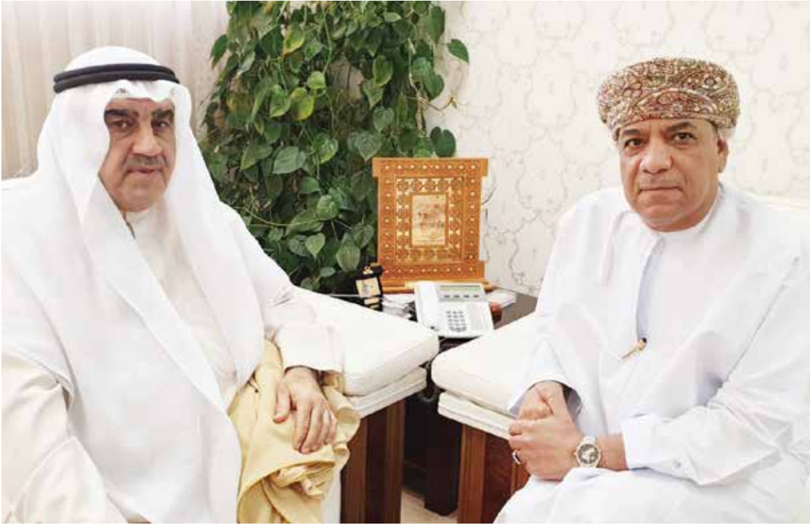
علي الجابري مستقبلا أحمد اسماعيل بهبهاني

استقبل وكيل وزارة الإعلام العمانية علي الجابري رئيس التحرير أحمد اسماعيل بهبهاني في مكتبه بوزارة الإعلام وذلك خلال زيارته إلى سلطنة عمان