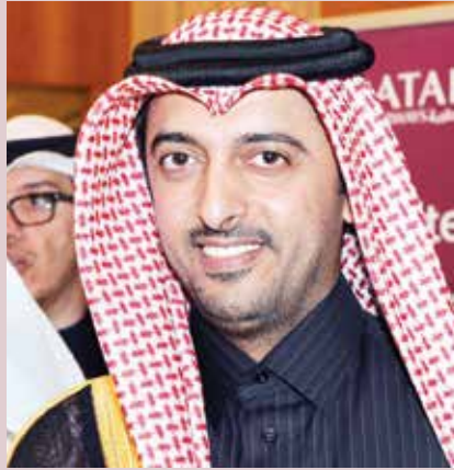
السفير بندر العطية

ولم يقتصر اهتمام دولة قطر على البناء والتنمية ارضا وانسانا بل كان لا بد من التقدم بشأن ارساء دولة العدل والشورى والديموقراطية التي يؤكد عليها الدستور القطري حيث حرصت على تنظيم وتطوير اجهزة العدالة التي تركز على استقلال القضاء وتحقق العدل وترسي دعائم المجتمع الأمن المستقر سواء على مستوى المواطن وتنظيم شؤونه العدلية وقوانين الأحوال الشخصية والأسرة والطفل والشيخوخة او على مستوى العمالة الوافدة بحيث تطورت القوانين لتتيح للعامل كامل حقوقه واستحقاقاته وحرية تنقله واختياراته وسفره وحياته أوراقه الثبوتية وكل التسهيلات التي تكفلها المواثيق الدولية.