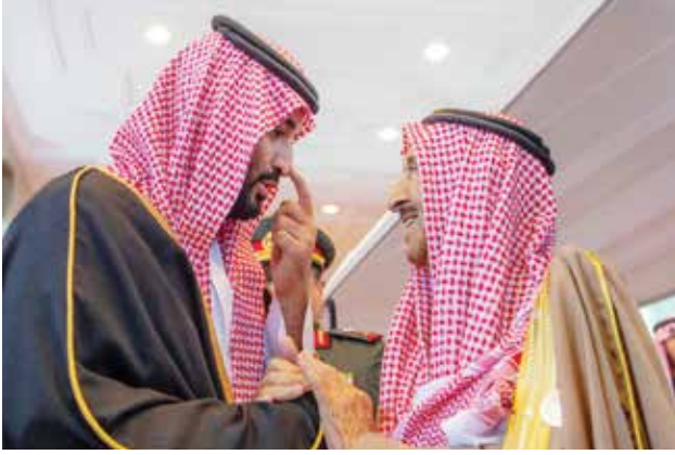
صاحب السمو الأمير الشيخ صباح الأحمد وحديث ودي مع ولي العهد السعودي صاحب السمو الملكي الأمير محمد بن سلمان