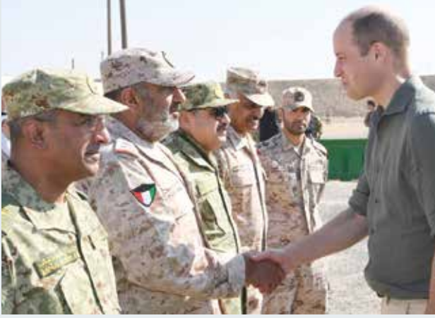
صاحب السمو الملكي الأمير وليام مصافحا الفريق الركن محمد الخضر والفريق الركن المهندس هاشم الرفاعي واللواء الركن الشيخ خالد صالح محمد الصباح واللواء جمال محمد الذياب