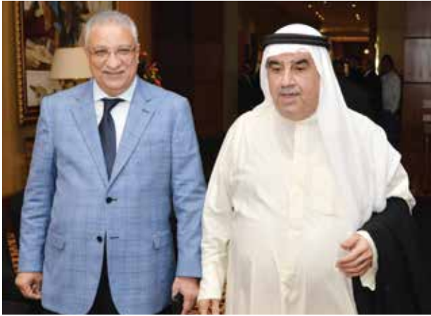
أحمد اسماعيل بهبهاني ود. أحمد ذكي بدر وزير التعليم والتنمية المحلية الأسبق