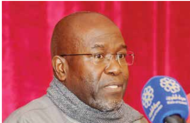
عميد السلك الدبلوماسي السفير السنغالي عبدالاحد امباكي

وأشار الى ان التمثيل الرائع للسفارات الافريقية لدى البلاد يجسد الحرص على تنمية العلاقات التاريخية مع الكويت، مستذكراً بالقول