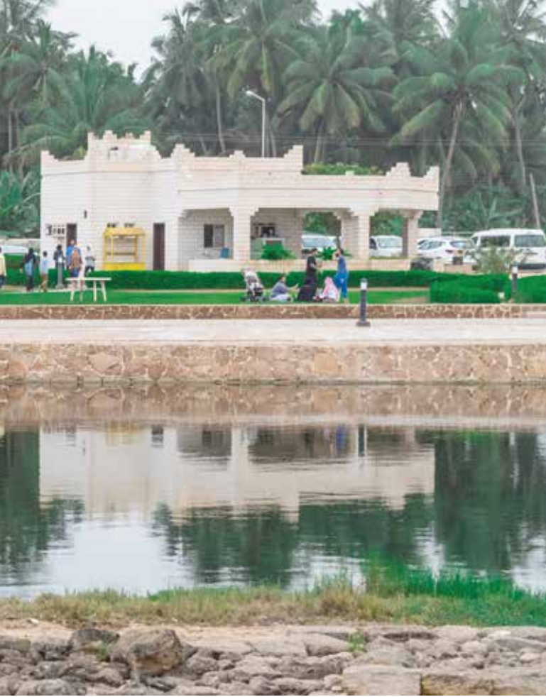
السياحة الاثرية تستقطب زوار محافظة ظفار