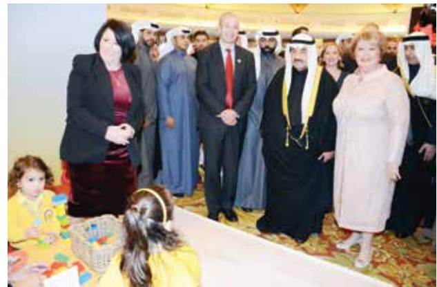
سمو الشيخ ناصر المحمد والسفير البريطاني مايكل دافنبورت وفييرا المطوع في جناح The Sunshine Kindergarten

المحمد الصباح الى هذا المعرض يعطيه أهمية وثقل كبير ورسالة باهتمام دولة الكويت والقيادة السياسية بالعلاقات المميزة مع الجانب البريطاني .