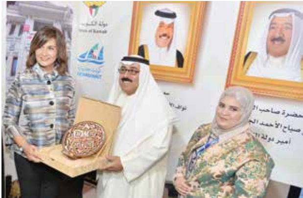
السفيرة نبيلة مكرم وزيرة الهجرة وشؤون المصريين في الخارج تتلقى درعا تذكارية من وائل الشطي وهيا الزيان في جناح الأمانة العامة للأوقاف الكويتية