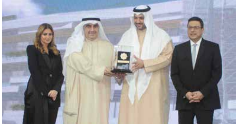
الشيخ مبارك عبدالله مكرما احمد اسماعيل بهباني بحضور السفير المصري طارق القوني ود. هبة السويدي