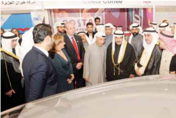
سمو الشيخ ناصر المحمد والسفير البريطاني مايكل دافنبورت ونائل الزياتي واحمد اسماعيل بهبهاني خلال زيارة لجناح احدى شركات السيارات