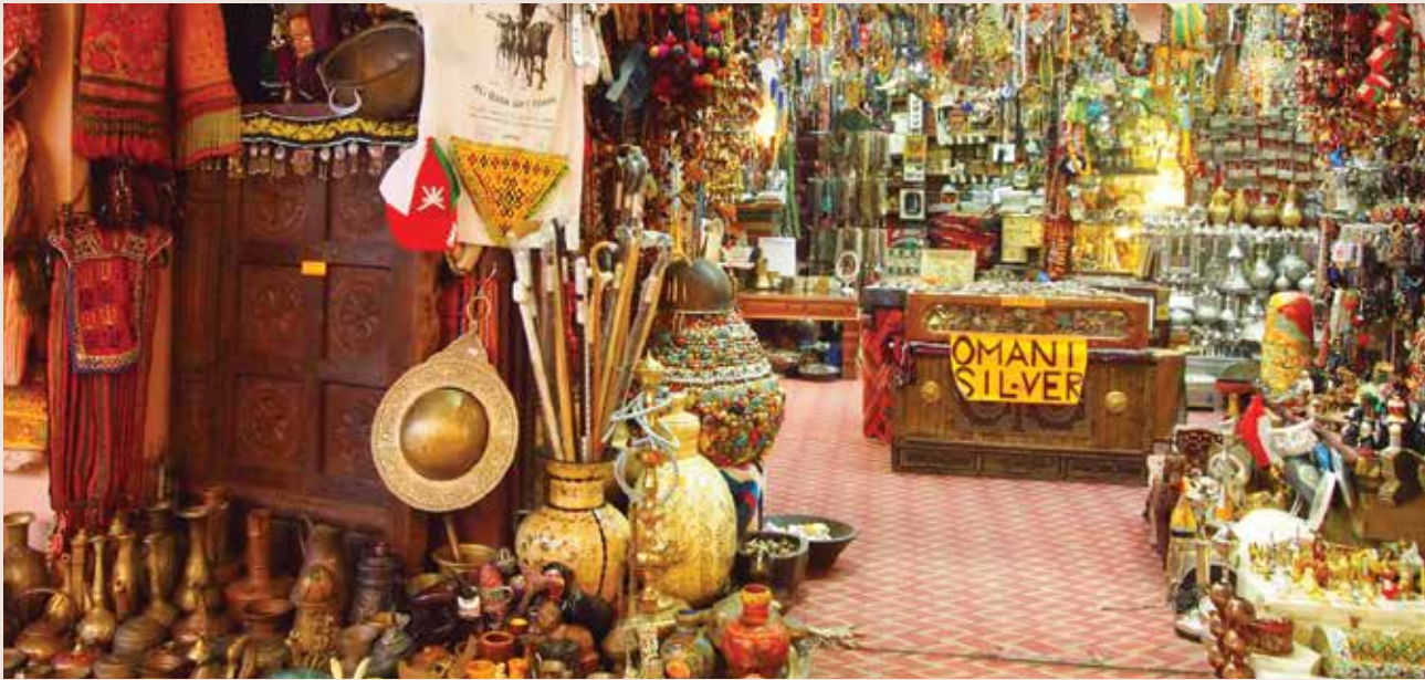
مدينة التحف والهدايا