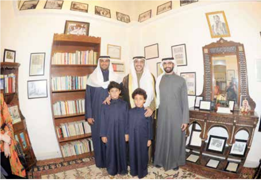
الشيخ محمد العبد الله داخل جناح المغفور له الشيخ عبد الله المبارك الصباح