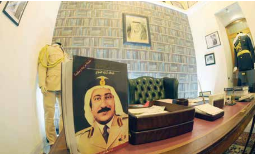
جانب من جناح المغفور له الشيخ مبارك العبد الله الصباح

العثمان معلماً يشاد به على مستوى الكويت ودول الخليج، ومزاراً يؤمه ضيوف الدولة من كافة أنحاء العالم، يتعرف فيه الزائر على تراثنا الجميل بقيمة السمحة، وهذه المكانة ما كانت لتكون، من بعد الله سبحانه وتعالى، لولا الجهود الحثيثة للأخ أنور الرفاعي وفريق الموروث الكويتي وعلى رأسهم الفاضلة الشيخة أمثال الأحمد. كما أشيد هنا بدور الهيئة العامة لشؤون القصر ومديرها العام براك الشيتان، أعضاء لجنة أوصياء ثلث المرحوم عبدالله عبداللطيف العثمان، في تحقيق هذا الإنجاز، فكل الشكر لهم على جهودهم وجهود كل القائمين على بيت العثمان».