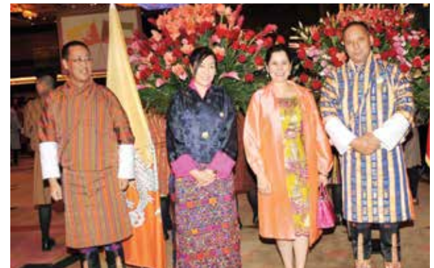
الشيخة انتصار سالم العلي مباركة