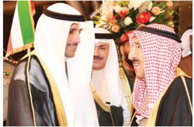
صاحب السمو الأمير الشيخ صباح الأحمد ورئيس مجلس الأمة مرزوق الغانم

ولفت إلى أن «استضافة المملكة لهذه القمة، تأتي استجابة لرغبة الأشقاء في دولة الإمارات العربية المتحدة التي سترأس أعمال الدورة الأربعين، ويطيب لي هنا أن أعرب عن خالص الشكر والامتنان لأخي صاحب الجلالة السلطان قابوس بن سعيد لجهوده التي ساهمت في نجاح أعمال المجلس في دورته السابقة، والشكر موصول للأمين العام د.عبداللطيف الزباني، على الجهود التي بذلها خلال فترة رئاسته، كما أقدم التهنئة للدكتور نايف الحجرف، بمناسبة ترشيحه أميناً عاماً للمجلس، سائلاً المولى عز وجل له التوفيق».