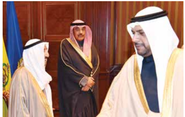
صاحب السمو الأمير الشيخ صباح الأحمد وسمو الشيخ صباح الخالد والشيخ أحمد المنصور