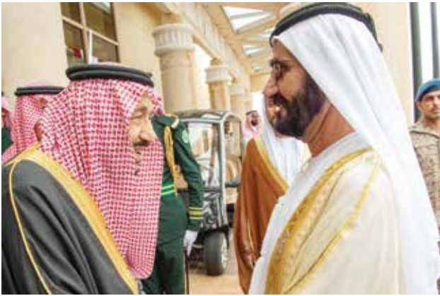
خادم الحرمين الشريفين الملك سلمان بن عبدالعزيز مستقبلاً صاحب السمو الشيخ محمد بن راشد آل مكتوم نائب رئيس الدولة رئيس مجلس الوزراء حاكم دبي