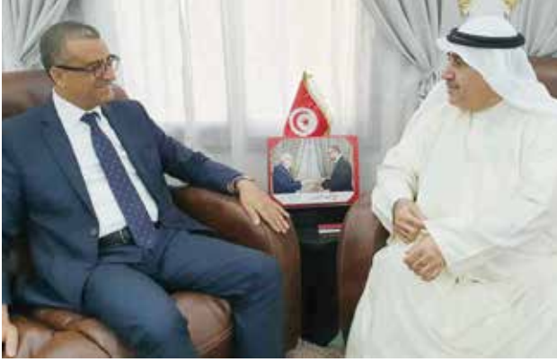
السفير التونسي السفير أحمد بن الصغير مستقبلا أحمد اسماعيل بهباني