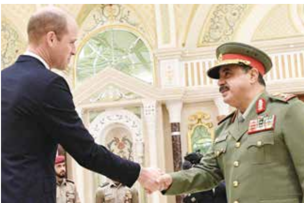
الفريق الركن مهندس هاشم الرفاعي مصافحا صاحب السمو الملكي الأمير ويليام