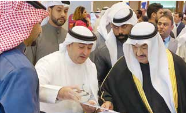
سمو الشيخ ناصر المحمد ومحمد يوسف ملا يعقوب في جناح هيئة تشجيع الاستثمار المباشر