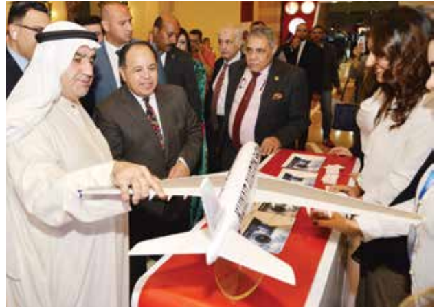
د. محمد معيط وزير المالية المصري وأحمد اسماعيل بهبهاني في جناح معرض الكويت للطيران 2020

الشقيقين في القطاعات المشتركة الحكومية والخاصة، ويعكس حرص دولة الكويت علي تعزيز علاقاتها الاقتصادية والاستثمارية مع مصر.