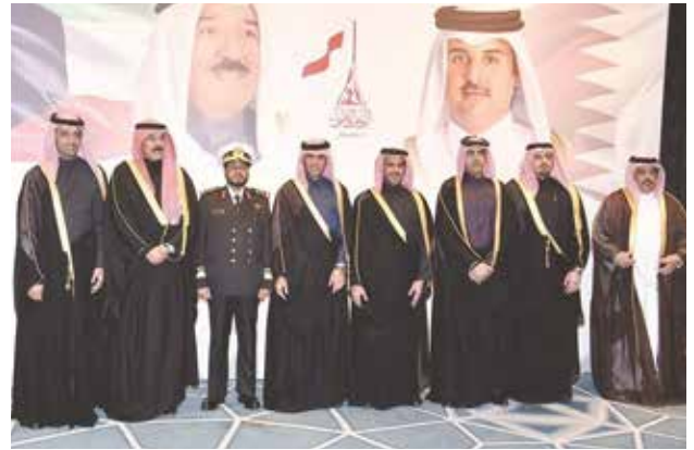
الشيخ محمد الخالد مباركا