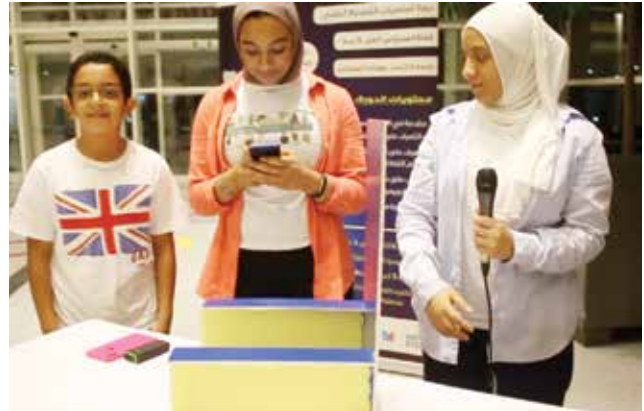
جانبا من الأطفال المشاركين