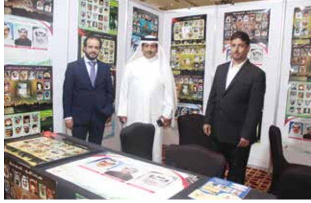
جناح جمعية أهالي الشهداء الأسرى و المفقودين الكويتية