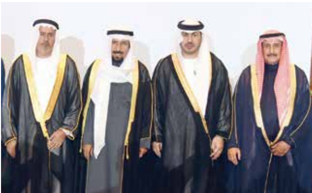
الشيخ د. ابراهيم الدعيج والشيخ علي الجابر بهنتان