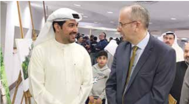
السفير البريطاني مايكل دافنبورت وحديث مع جابر الهندال