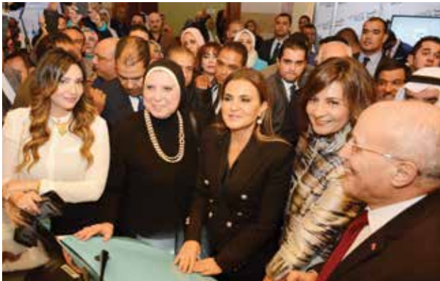
اللواء د. محمد العصار وزير الإنتاج الحربي المصري والسفيرة نبيلة مكرم وزيرة الهجرة وشؤون المصريين ود. سحر نصر وزيرة الاستثمار والتعاون الدولي المصري ود. نيفين جامع الرئيسة التنفيذية لجهاز تنمية المشروعات الصغيرة والمتوسطة في جناح الهيئة القومية للإنتاج الحربي