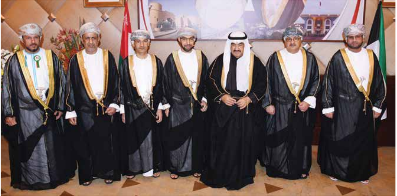
سمو الشيخ ناصر المحمد مهنتاً