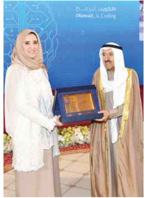
صاحب السمو الأمير الشيخ صباح الأحمد يتسلم درعا تذكارية من الشيخة عايدة سالم العلي

تحت رعاية وحضور صاحب السمو الأمير الشيخ صباح الأحمد أقيم حفل تكريم الفائزين في السنة التاسعة عشرة بجائزة سمو رئيس الحرس الوطني الشيخ سالم العلي، حفظه الله، للمعلوماتية، وذلك بقصر بيان، ووصل سموه إلى مكان الحفل، حيث استقبل بكل حفاوة وترحيب من قبل رئيس مجلس أمناء الجائزة الشيخة عايدة سالم العلي وأعضاء اللجنة المنظمة العليا. وشهد الحفل سمو رئيس مجلس الوزراء الشيخ صباح الخالد ورئيس مجلس الأمة بالإنيابة عيسى الكندري وكبار المسؤولين بالدولة.