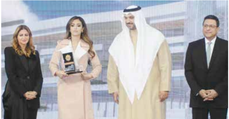
الشيخ مبارك عبدالله مكرما الشيخة شيخة خالد جابر العلي الصباح بحضور السفير طارق القوني ود. هبة السويدي