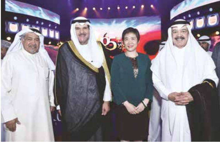
الشيخ سلمان الحمود متوسلاً يوسف الجاسم والدكتورة فانغ ليو والفنان جاسم النبهان

احتفلت شركة الخطوط الجوية الكويتية بذكرى مرور 65 عاماً على تأسيس الشركة، إذ أقامت حفلاً خاصاً بالمناسبة في مركز الشيخ جابر الأحمد الثقافي، وذلك بحضور ضيفة الكويت رئيسة جمهورية استونيا كيرستي كاليولاد، ووزير المالية الدكتور نايف الحجرف، ورئيس الإدارة العامة للطيران المدني الشيخ سلمان الحمود الصباح، والأمين العام لمنظمة الطيران المدني الدولي ICAO الدكتورة فانغ ليو، وعدد من السفراء والمسؤولين في الدولة، ورؤساء شركات الطيران العربية.