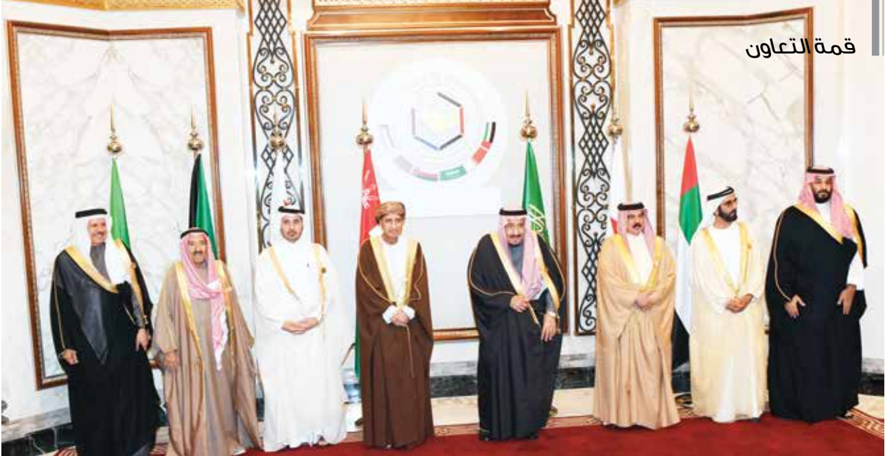
خادم الحرمين الشريفين الملك سلمان بن عبدالعزيز وصاحب السمو الأمير الشيخ صباح الأحمد والملك حمد بن عيسى آل خليفة وصاحب السمو الشيخ محمد بن راشد آل مكتوم ومعالى الشيخ عبدالله بن ناصر بن خليفة آل ثاني وصاحب السمو السيد فهد بن محمود آل سعيد وصاحب السمو الملكي الأمير محمد بن سلمان وعبد اللطيف الزياتي في القمة الخليجية 40 بالرياض

سموه أعرب عن ارتياحه للخطوات الإيجابية التي تحققت لطبي صفحة الماضي