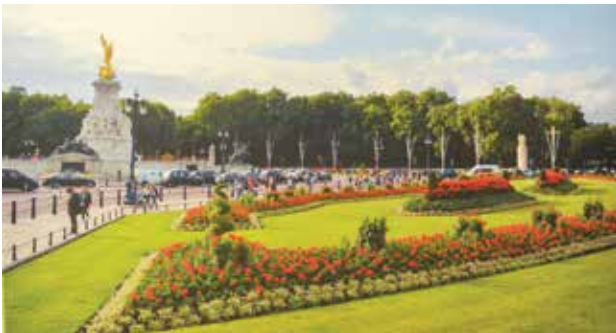
نصب الملكة فيكتوريا التذكاري من امام قصر بكنغهام