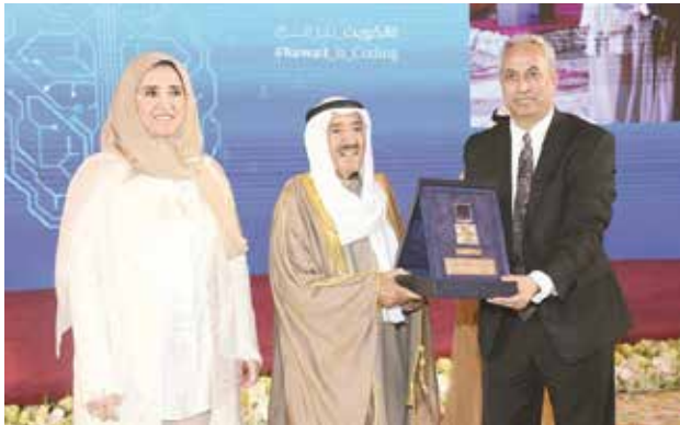
صاحب السمو الأمير الشيخ صباح الأحمد يمنح وسام المعلوماتية إلى العالم العربي د. بلقاسم حبه بحضور الشيخة عايذة سالم العلي

العهد الشيخ نواف الأحمد وسمو الشيخ سالم العلي رئيس الحرس الوطني.