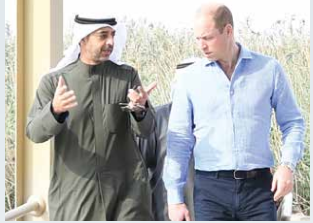
الشيخ محمد عبدالله وصاحب السمو الملكي الأمير وليام خلال زيارته إلى محمية الجهراء