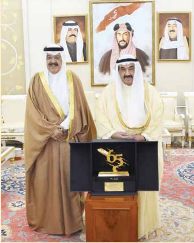
سمو الشيخ ناصر المحمد مستقبلا رئيس مجلس إدارة الخطوط الجوية الكويتية يوسف الجاسم

وتمنى المحمد للخطوط الجوية الكويتية، برئاسة الجاسم، دوام التقدم والنجاح في خدمة قطاع النقل الجوي للكويت، وبما يساهم في تعزيز التوجهات التنموية بالبلاد، وفقا لرؤى القيادة السياسية، وعلى رأسها سمو أمير البلاد الشيخ صباح الاحمد، وسمو ولي عهده الشيخ نواف الأحمد.