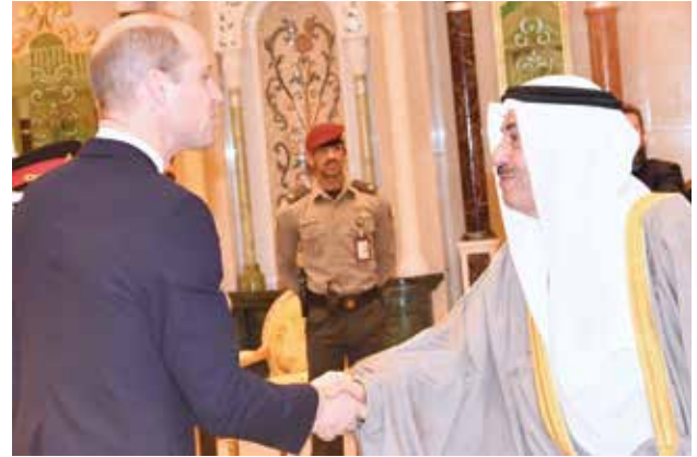
الشيخ أحمد الحمود مصافحا صاحب السمو الملكي الأمير ويليام