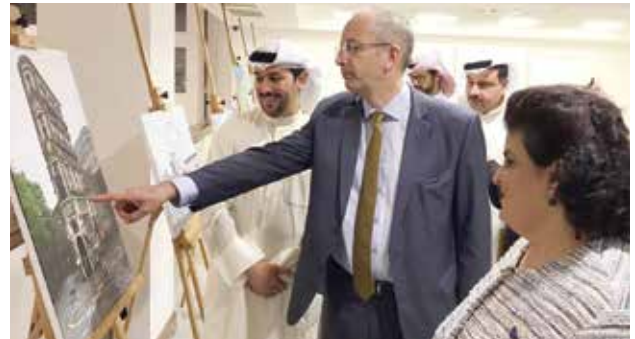
السفير البريطاني مايكل دافنبورت يشاهد إحدى الصور المعروضة بحضور الشيخة هالة بدر المحمد وجابر الهندال بالمعرض