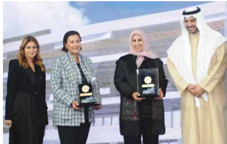
الشيخ مبارك العبدالله مكرما الشيخة نوف مبارك الصباح والشيخة عبير ناصر الصباح بحضور د. هبة السويدي

برعاية الشيخ مبارك العبدالله وحضور السفير المصري طارق القوني وعدد من الشخصيات العامة أقامت مؤسسة أهل مصر للتنمية احتفالية خيرية في فندق الفورسيزون الكويت وذلك للإعلان عن ابرز المشاريع الخاصة التي تعمل بها المؤسسة وتقديم التوعية ضد مخاطر حوادث الحروق.