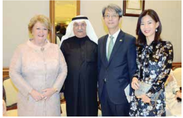
سفير كوريا الجنوبية هونغ يونغ جي وحرمة وصادق المطوع وفيرا المطوع