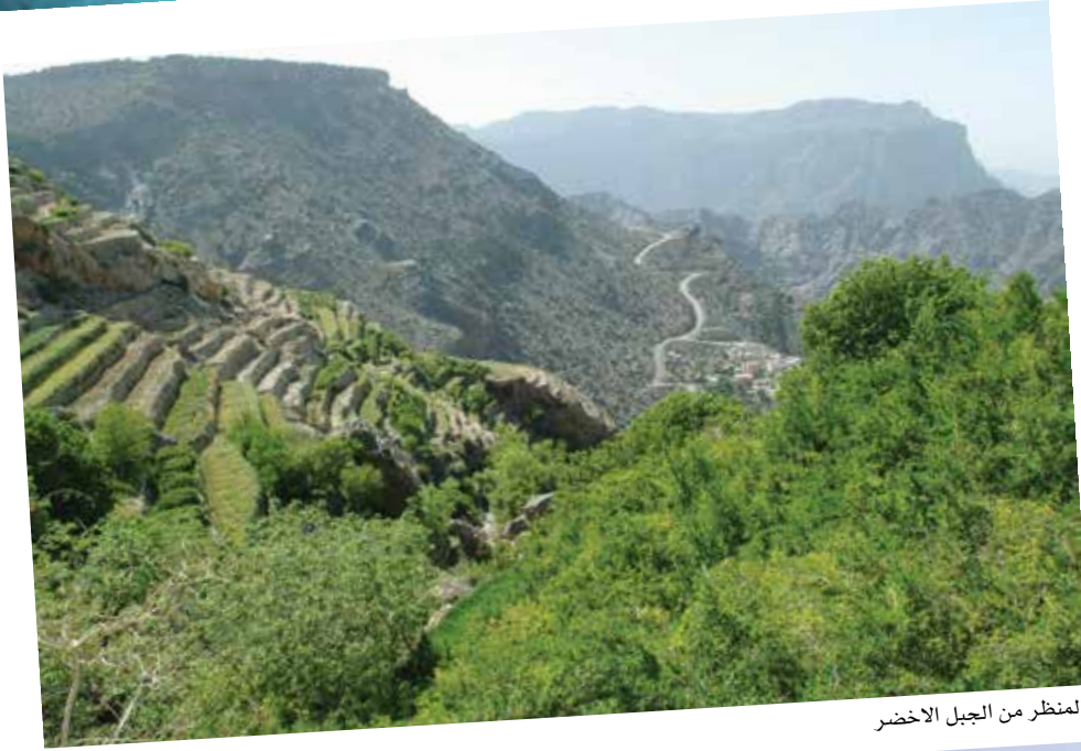
المنظر من الجبل الاخضر

وفي حين أبدى السلطان قابوس بن سعيد ارتياحه لما تبذله الحكومة وسائر مؤسسات الدولة من جهود في مواصلة مسيرة التنمية الشاملة في معدلات نمو إيجابية حافظت على مستوى الخدمات