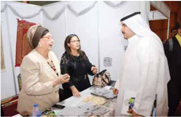
تهاني البرتقالي في جناح جمعية أحياء مصر