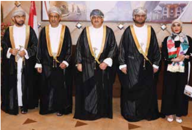
الشيخة انتصار المحمد الصباح مهنئة