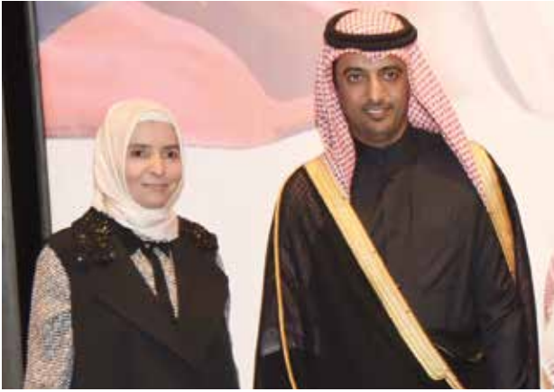
السفيرة التركية عائشة كويترك مهنته