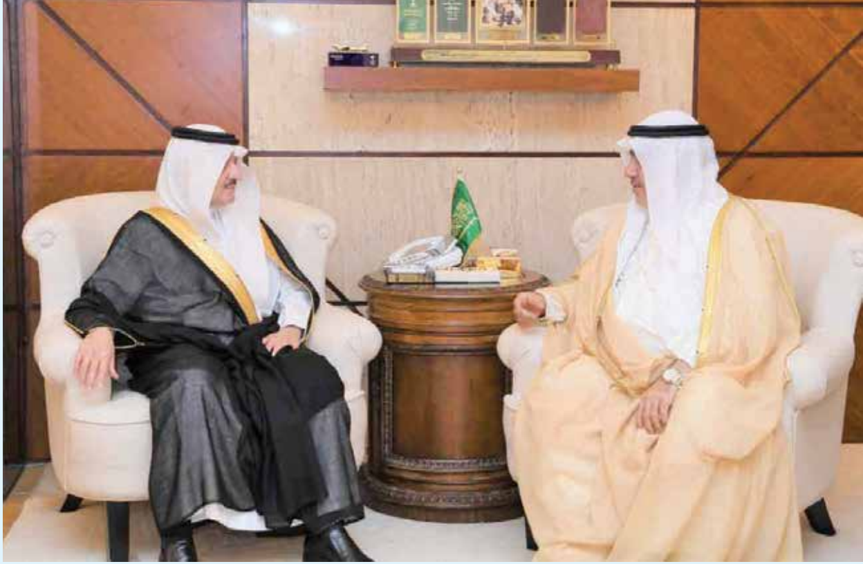
صاحب السمو الملكي الأمير سعود بن نايف بن عبدالعزيز مستقبلاً أحمد اسماعيل بهبهاني

للكويت حكومتاً وشعباً دوام التقدم والازدهار، وللجنة المنظمة للمعرض التوفيق.