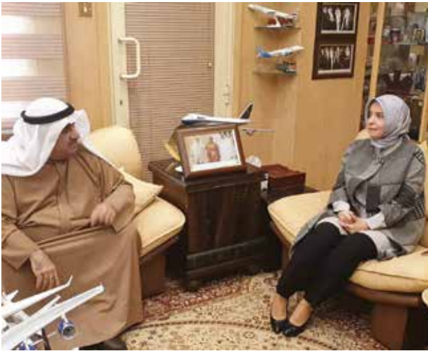
أحمد اسماعيل بهباني مستقبلا السفيرة التركية عائشة كويتك