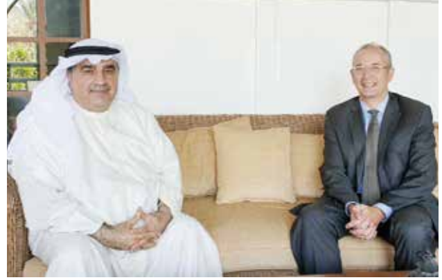
السفير البريطاني مايكل دافنبورت مستقبلا أحمد اسماعيل بهباني