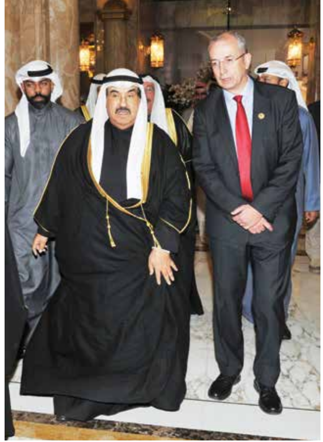
سمو الشيخ ناصر المحمد لدى وصوله وفي استقباله السفير البريطاني مايكل دافنبورت