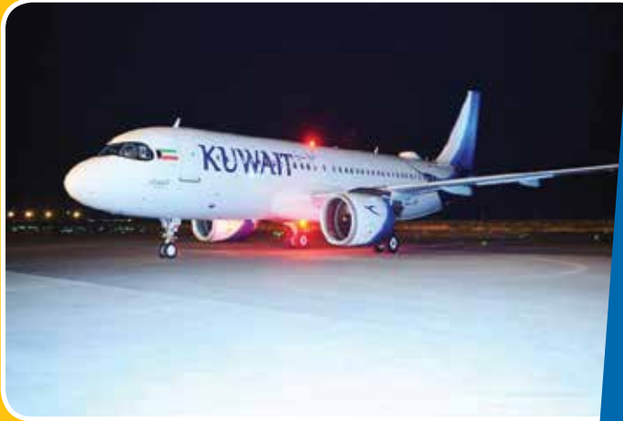
ثاني طائرات إيرباص A320neo، تنضم لأسطول «الكويتية».