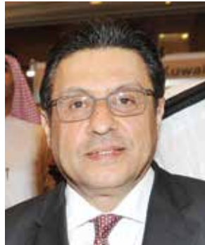
السفير المصري طارق القوني

لدولة الكويت تتسم بمهنية عالية ومصداقية واضحة .