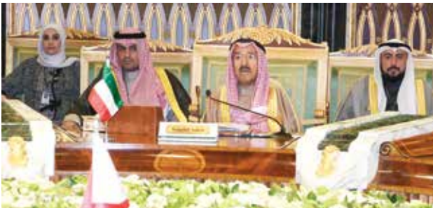
صاحب السمو الأمير الشيخ صباح الأحمد مترئسا وفد الكويت ويبدو أنس الصالح والشيخ د. باسل الصباح ومريم العقيل

أود في البداية أن أتقدم بالشكر والتقدير لأخي العزيز خادم الحرمين الشريفين الملك سلمان بن عبدالعزيز آل سعود وإلى حكومة وشعب المملكة العربية السعودية الشقيقة على رعايتهم لهذا اللقاء المبارك وما حظينا به من حسن استقبال وكرم ضيافة، كما أشكر أخي جلالة السلطان قابوس بن سعيد المعظم وحكومة سلطنة عمان الشقيقة على ما قدموه من جهود مقدرة خلال تولي السلطنة رئاسة المجلس الأعلى في دورته السابقة وأهنئ أخي صاحب السمو الشيخ خليفة بن زايد آل نهيان رئيس دولة الإمارات العربية المتحدة الشقيقة على توليه رئاسة دورتنا الحالية، متمنيا لسموه كل التوفيق والسداد.