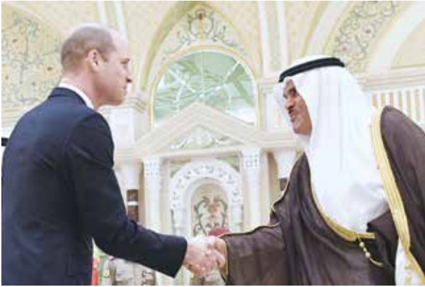
الشيخ سلمان الحمود مصافحا صاحب السمو الملكي الأمير ويليام