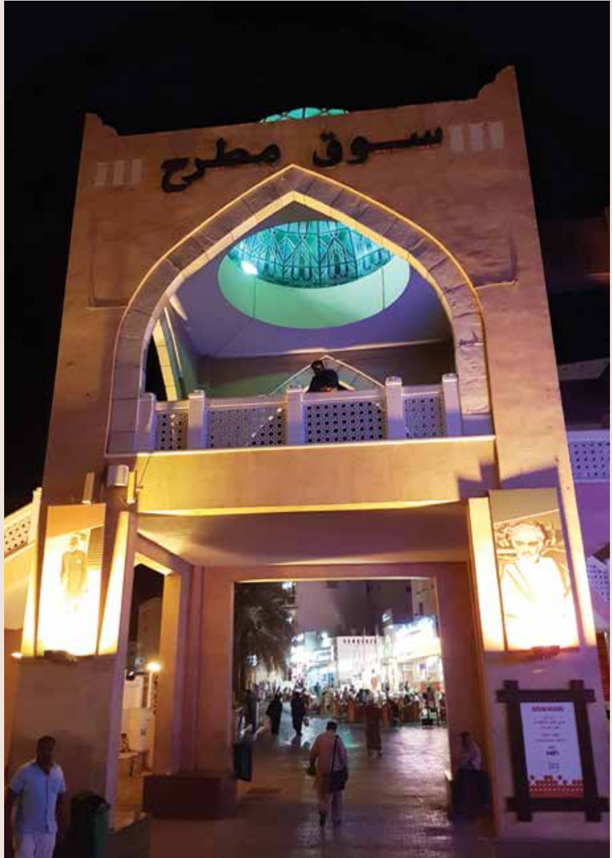
بوابة سوق مطرح

تعرض في أزقته الضيقة تحف وقطع أثرية، وعملات قديمة، إضافة إلى البخور، وبعض الزينة، وإليه يتوجه عشرات الآلاف من العمانيين والسياح، بحثا عن تذكارات أثري، أو بعض البخور لتعطير البيت والثياب أيضا. في سوق مطرح كل شيء موجود.. الملابس التقليدية والحلي، مرورا باللبان أو المرة والبن والمباخر والحنة العمانية والأنتيك والتحف والأحجار شبه الكريمة واللوحات والحلوى العمانية الشهيرة وحتى الخناجر! تتوزع محلات التحف في سوق مطرح بأدواتها الجميلة المزخرفة والقطع الفنية، وتستقبل كثيرا من الزبائن، خاصة الأجانب، حيث يرى البعض أن القطع التراثية الجميلة تعتبر رخيصة الثمن بالنسبة له. وللسوق تصميم معماري مميز، حيث الأسقف الخشبية تزدان بزخارف ونقوش إسلامية ملونة، بالإضافة إلى القبة الرئيسية التي تتميز بالزجاج الملون والمرسوم عليه بعض الرسوم الدالة على الثقافة العمانية، كالحلي والخناجر والمباخر وغيرها من رموز محلية. وللسوق مطرح مدخلان رئيسيان: