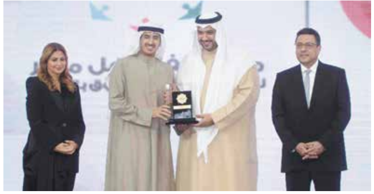
الشيخ مبارك عبدالله مكرما الشيخ احمد دعيح الصباح بحضور السفير المصري طارق القوني ود. هبة السويدي

وقالت السويدي: إن قضية الحروق تعدت هونها، حادثة قضاء وقدر فقط، ليدخل فيها جرم ضد الإنسانية، ففي كل التقارير نجد أن العنف الجسدي ضد المرأة والطفل، والذي يشمل، العقاب والتعذيب بالحرق، تصل نسبته، إلى 93% في الأطفال، و36% في السيدات ونحن في مؤسسة أهل مصر شاهد عيان على فداحة الجريمة.