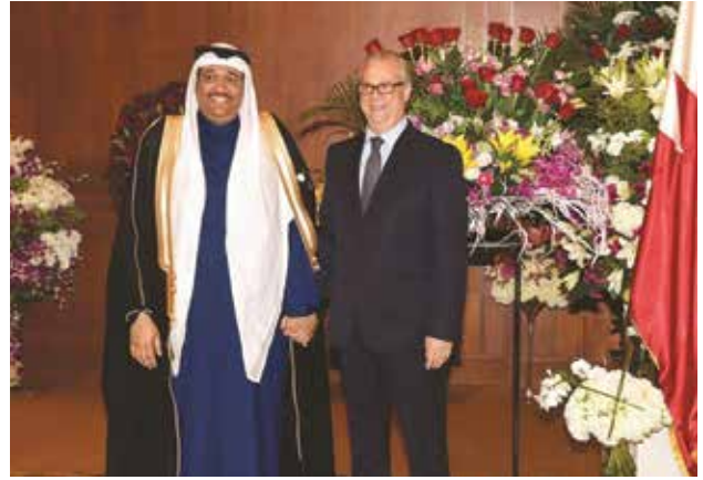
السفير المغربي جعفر حكيم مباركا