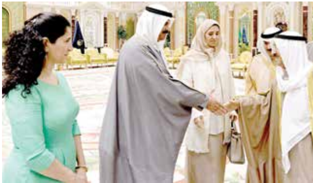
صاحب السمو الأمير الشيخ صباح الأحمد مصافحا الشيخ فهد سالم العلي بحضور الشيخة عايذة والشيخة انتصار سالم العلي