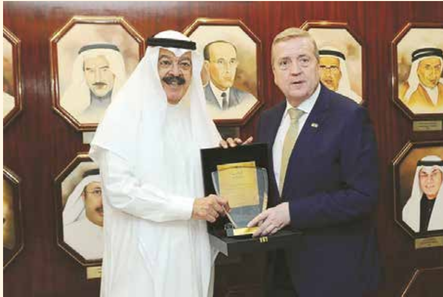
يوسف الجاسم يكرم الوزير بات برين

استقبلت شركة الخطوط الجوية الكويتية وفداً أيرلندياً رفيع المستوى يتقدمه وزير الدولة للتجارة والأعمال في جمهورية أيرلندا بات برين، وسفير جمهورية أيرلندا في دولة الإمارات العربية المتحدة إيدان كرونين، وعدد من المسؤولين الأيرلنديين والشركات الأيرلندية، وكان في استقبال الوفد رئيس مجلس إدارة الخطوط الجوية الكويتية يوسف عبدالحميد الجاسم، والرئيس التنفيذي بالتكليف عبدالحميد زيدان، والإدارة التنفيذية وعددًا من المسؤولين في "الكويتية"