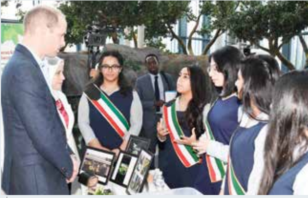
صاحب السمو الملكي الأمير وليام وحديث مع عدد من الفتيات بمركز الشيخ عبدالله السالم الثقافي