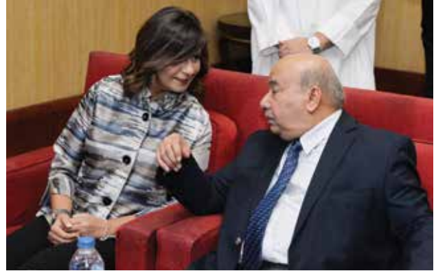
السفير الكويتي محمد صالح الذويخ وحديث مع السفيرة نبيلة مكرم وزيرة الهجرة وشؤون المصريين في الخارج