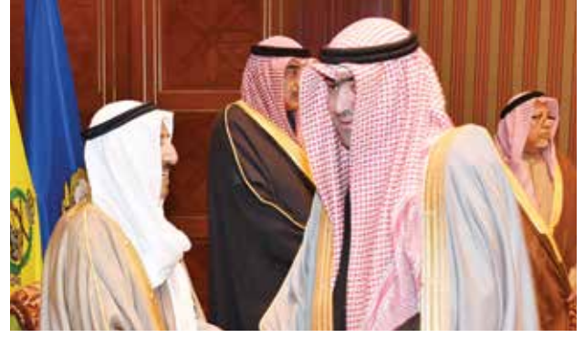
صاحب السمو الأمير الشيخ صباح الأحمد مصافحاً خالد الروضان