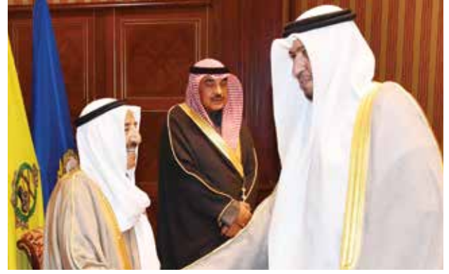
صاحب السمو الأمير الشيخ صباح الأحمد مصافحاً المستشار د. فهد العفاسي