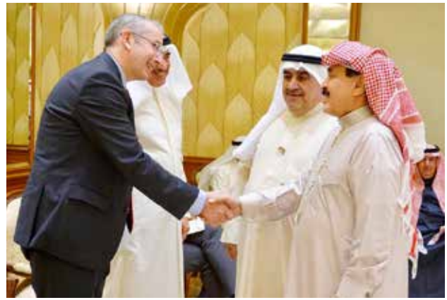
العميد أحمد الجار الله مصافحا السفير مايكل دافنبورت بحضور أحمد اسماعيل بهباني وعيد الرشيد