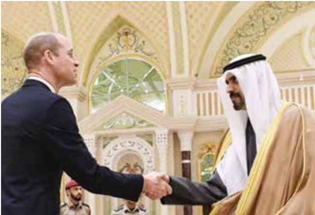
الشيخ د. مشعل جابر الأحمد مصافحا صاحب السمو الملكي الأمير ويليام