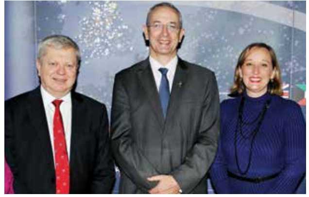
إيميلي كونها والسفير البريطاني مايكل دافنبورت وروجر وينفلد