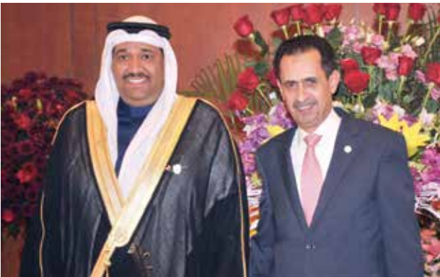
السفير الاردني صقر ابو شتال مهنتا