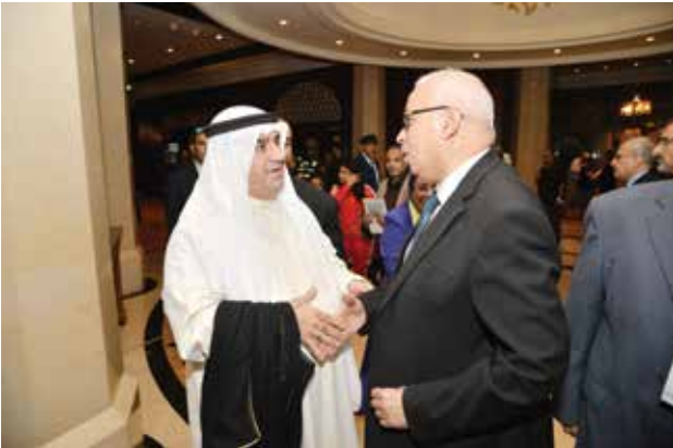
علي حسن رئيس مجلس إدارة ورئيس تحرير وكالة انباء الشرق الأوسط مصافحا أحمد اسماعيل بهبهاني