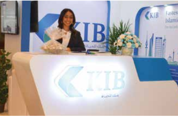
جناح بنك الكويت الدولي «KIB»