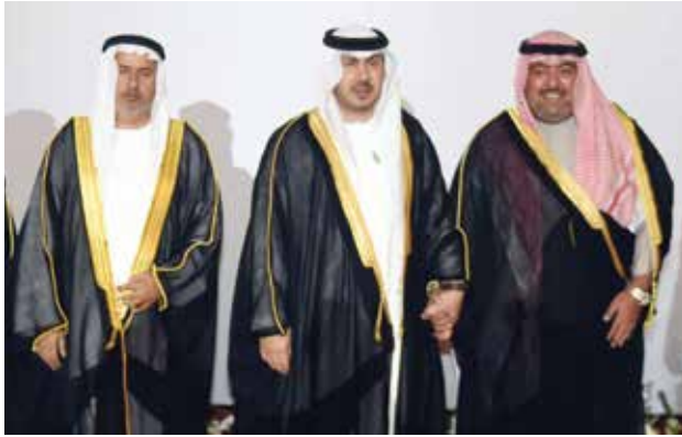
الشيخ ثامر العلي مباركا