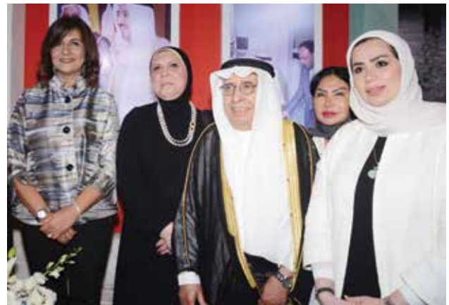
نادية الشطي وابراهيم طاهر البغلي ود. نيفين جامع الرئيسة التنفيذية لجهاز تنمية المشروعات الصغيرة والمتوسطة والسفيرة نبيلة مكرم وزيرة الهجرة وشؤون المصريين في الخارج في جناح مبرة ابراهيم طاهر البغلي للابن البار

التقدم والازدهار للعلاقة بين البلدين والشعبين الشقيقين.