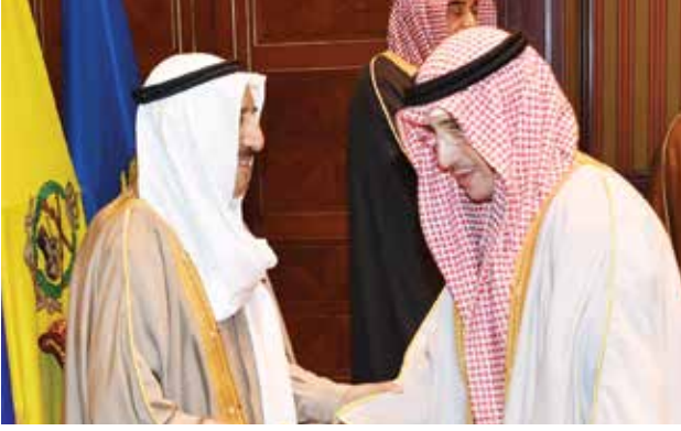
صاحب السمو الأمير الشيخ صباح الأحمد مصافحاً الشيخ د. أحمد ناصر المحمد