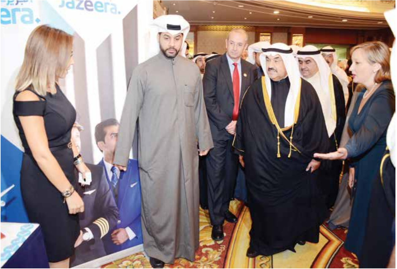
سمو الشيخ ناصر المحمد والسفير البريطاني مايكل دافنبورت واحمد اسماعيل بهبهاني وايميلي كونها ومادونا هويك في جناح شركة طيران الجزيرة