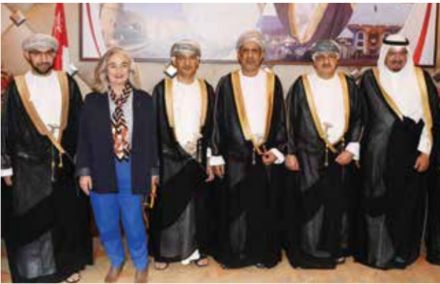
الشيخ أحمد العبدالله والسفيرة الفرنسية ماري ماسدويوي يقدمان التهاني