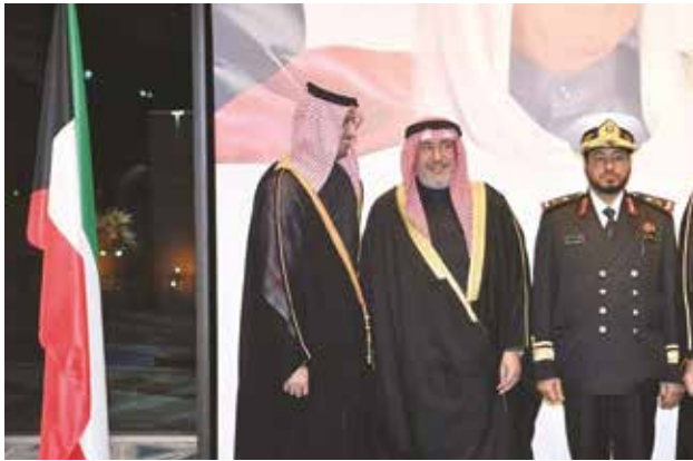
الشيخ فهد جابر الأحمد مهنتا