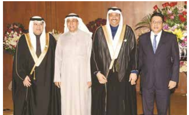
السفير المصري طارق القوني يقدم التهاني