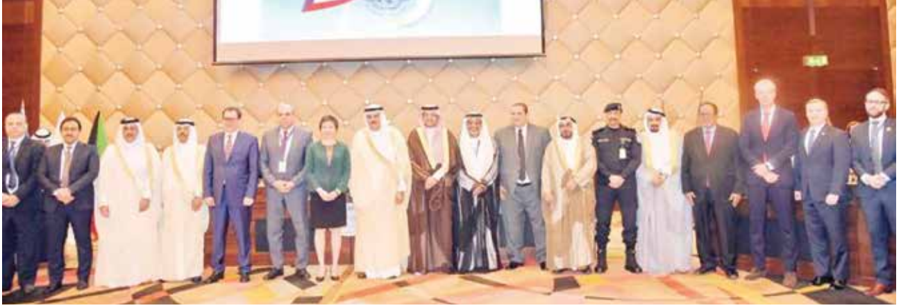
الشيخ سلمان الحمود متوسلاً رؤساء الطيران المدني