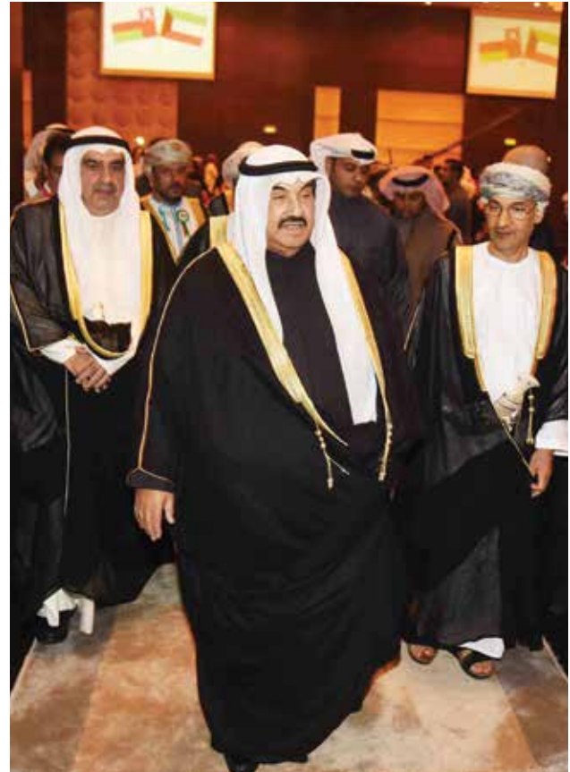
سمو الشيخ ناصر المحمد لدى وصوله وفي الخلف القائم بالاعمال العماني هلال الشنفرى وأحمد اسماعيل بهبهاني

وتابع الجارالله: لقد بات هذا الإنجاز الذي حققته السلطنة محل تقدير وإعجاب ليس من قبل أبناء المنطقة فقط بل من العالم أجمع، مضيفاً: حينما نتحدث عن السلطنة لا بد أن نشير باعتزاز