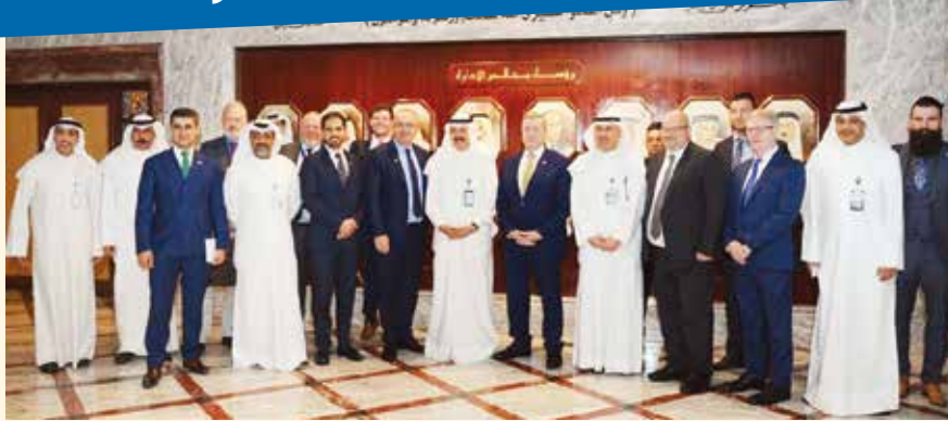
صورة جماعية لمسؤولي الكويتية مع الوفد الأيرلندي