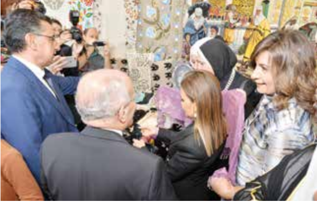
د. سحر نصر وزيرة الاستثمار والتعاون الدولي المصري واللواء د. محمد العصار وزير الإنتاج الحربي المصري والسفيرة نبيلة مكرم وزيرة الهجرة وشؤون المصريين في جناح جهاز تنمية المشروعات الصغيرة والمتوسطة