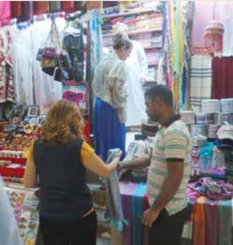
الطرح والهدايا العُمانية تجذب السياح

الكثير من التفاصيل الجميلة والتي تروي تاريخ وثقافة سلطنة عمان، لذلك نجد فيه تراثاً يختلف عن الأسواق الأخرى، يحمل الهوية العمانية ويحكي أدق التفاصيل عن التاريخ والثقافة العمانية، ولذلك يشهد سوق مطرح طوال أيام السنة حركة نشطة من قبل الزوار والسياح سواء من داخل أو خارج السلطنة.