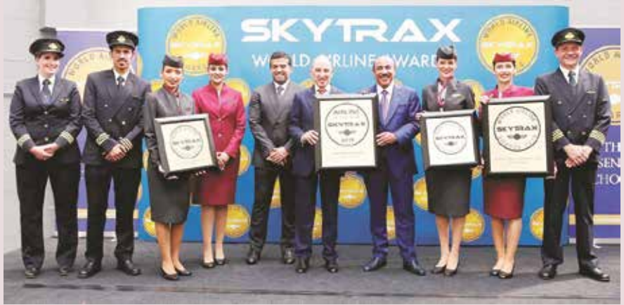
إدارة الناقل تحتفل بالألقاب مع موظفيها

وتعليقاً على هذا الإنجاز التاريخي للناقل القطرية، قال أكبر الباكر الرئيس التنفيذي لمجموعة الخطوط الجوية القطرية، الذي رافقه م. بدر محمد المير، الرئيس