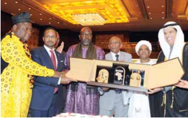
تكريم السفير علي السعيد