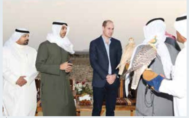
الشيخ محمد عبدالله وصاحب السمو الملكي الأمير وليام والشيخ يوسف العبد الله خلال الرحلة البرية