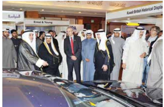
سمو الشيخ ناصر المحمد والسفير البريطاني مايكل دافنبورت واحمد اسماعيل بهبهاني ويوسف الجاسم ومحمد أبل في جناح احدى شركات السيارات

** المتلقم : المعرض البريطاني يأتيه انسجاما للعلاقات المميزة بين بريطانيا والكويت