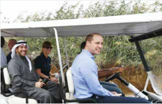
صاحب السمو الملكي الأمير وليام خلال زيارته إلى محمية الجهراء بحضور الشيخ عبد الله الأحمد