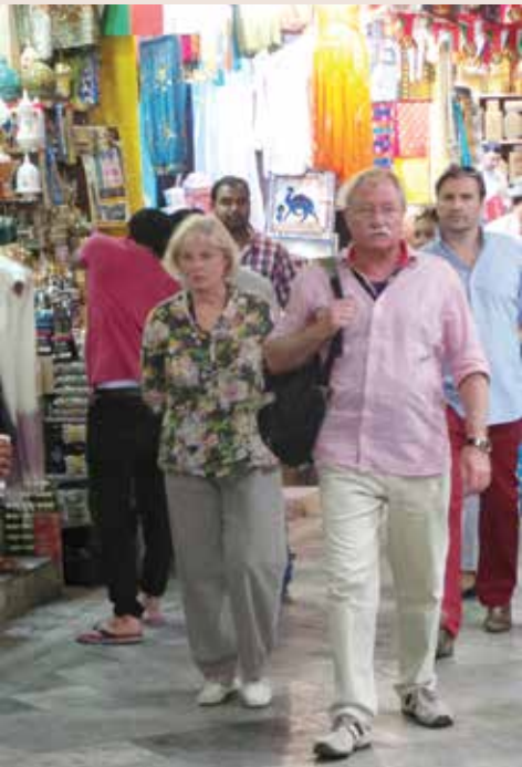
إقبال من السياح على سوق مطرح