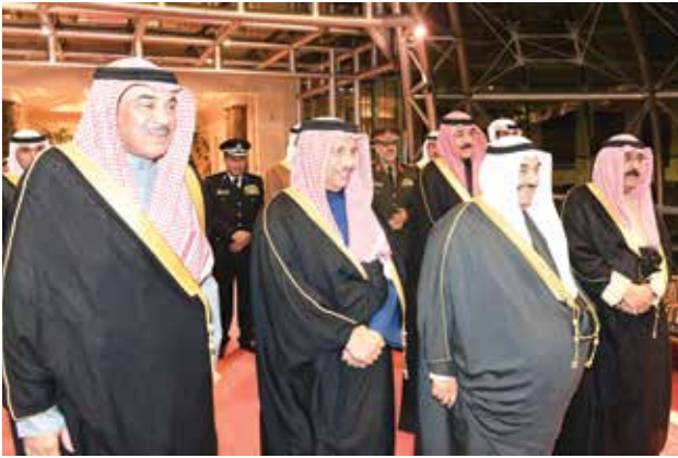
الشيخ مشعل الأحمد وسمو الشيخ ناصر المحمد وسمو الشيخ جابر المبارك وسمو الشيخ صباح الخالد وبيدو الشيخ محمد الخالد