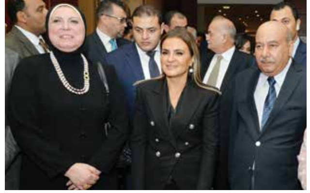
السفير الكويتي محمد صالح الذويخ ود. سحر نصر وزيرة الاستثمار والتعاون الدولي المصري ود. نيفين جامع الرئيسة التنفيذية لجهاز تنمية المشروعات الصغيرة والمتوسطة