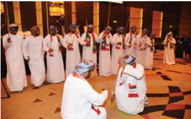
فكرة من الفلكلور العماني