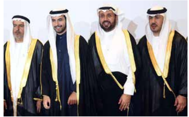
الشيخ حمد جابر العلي مهنتا