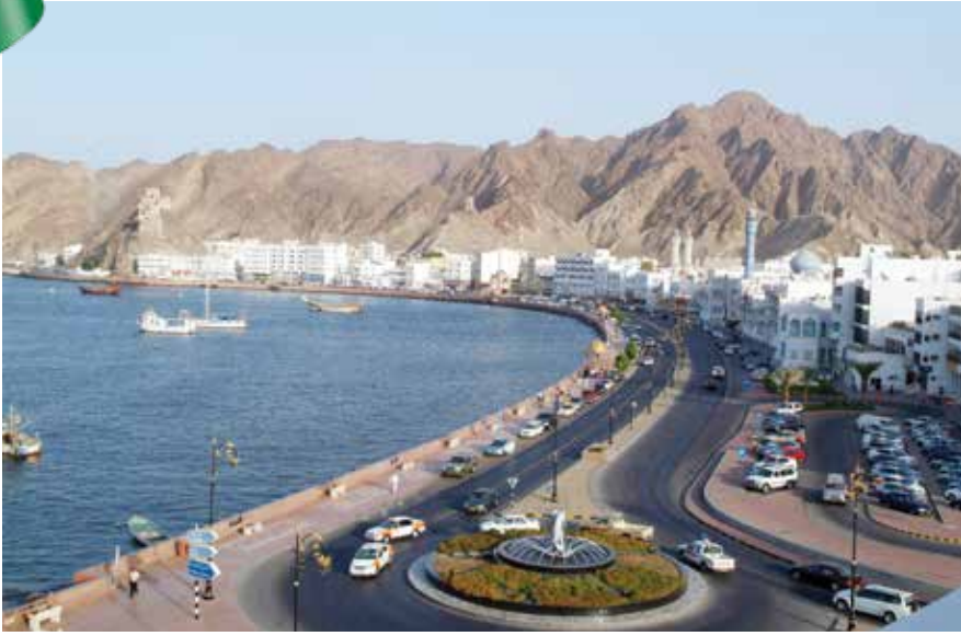
الشارع البحري بمطرح