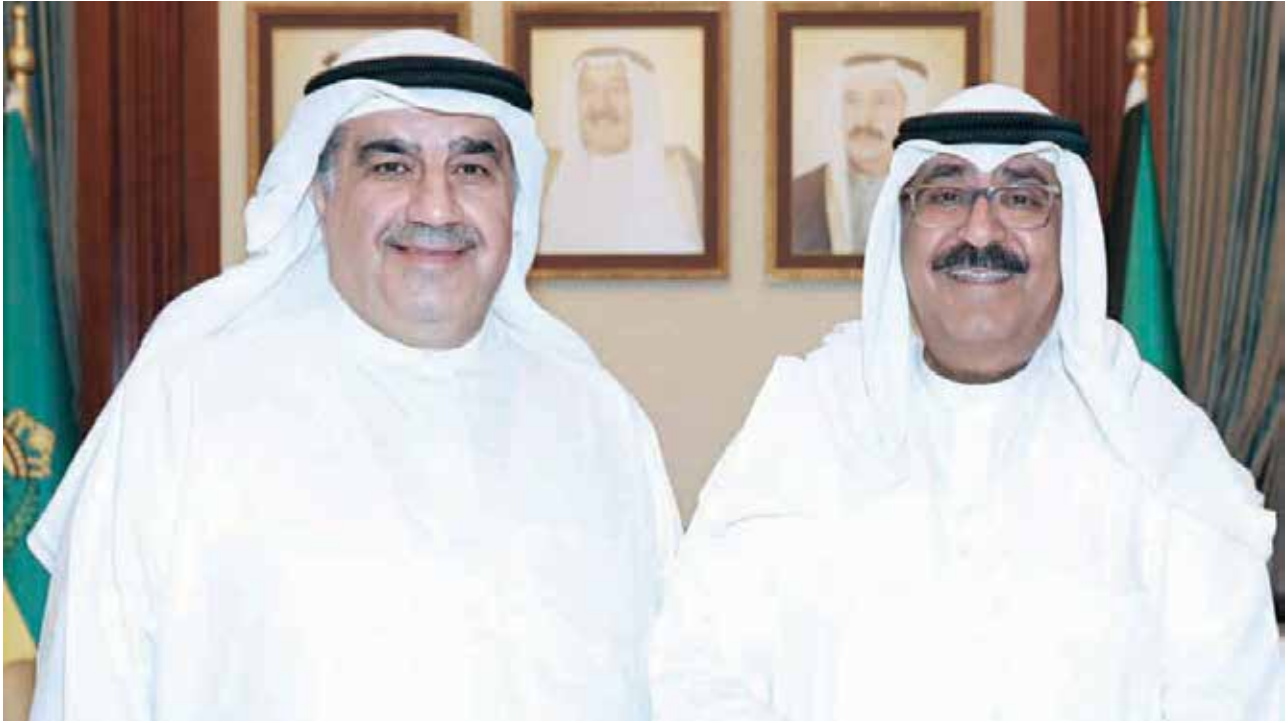
الشيخ مشعل الأحمد مستقبلاً أحمد اسماعيل بهبهاني

سيقام في الفترة من 15-18 يناير 2020 بمطار الكويت الدولي. وتمنى الشيخ مشعل الأحمد التوفيق والنجاح لفعاليات المعرض في نسخته الثانية ليواصل مسيرته في دعم المسيرة التتموية بالكويت.