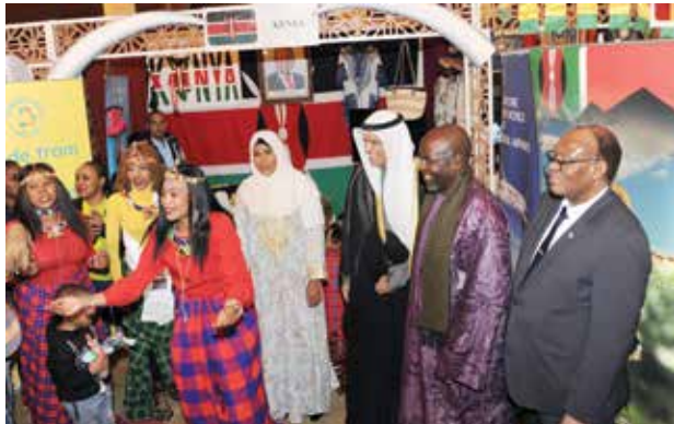
السفير علي السعيد و عميد السلك الدبلوماسي السفير السنغالي عبدالاحد امباكي وسفير بتسوانا مانيبديزا باتريك ليسيندي في جولة بالمعرض