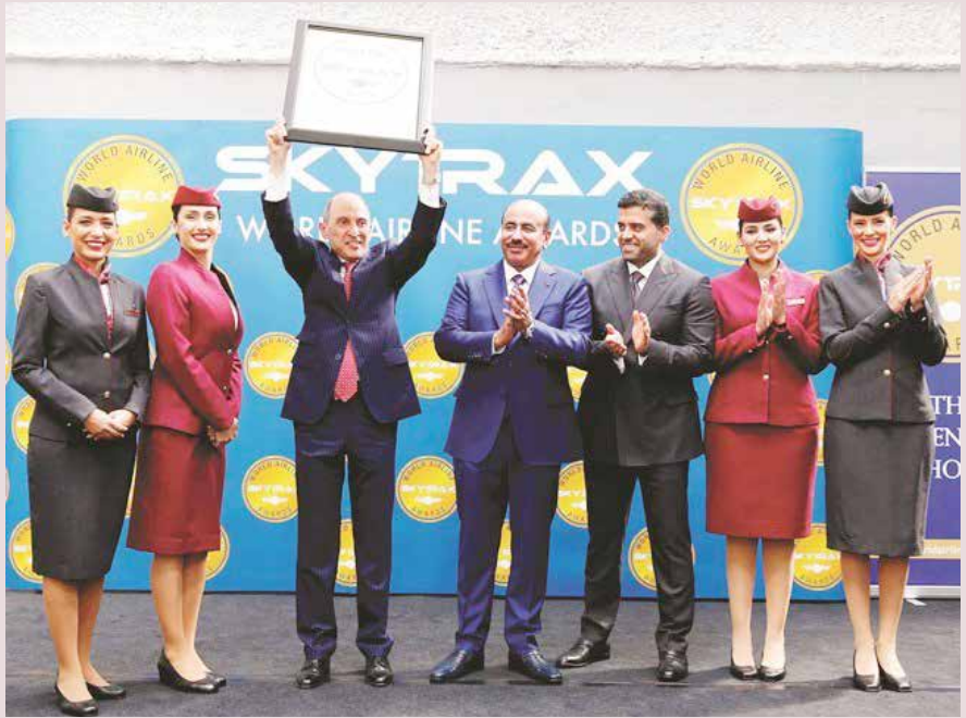
أكبر الباكر محققاً بإنجاز الناقل الوطنية القطرية