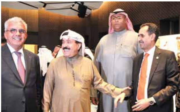
السفير الأردني صقر ابو شتال والعميد أحمد الجارالله والسفير الفلسطيني رامي طهوب