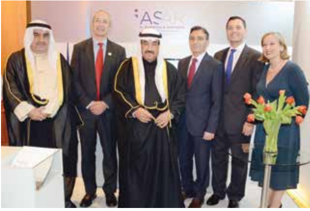
سمو الشيخ ناصر المحمد والسفير مايكل دافنبورت وأحمد اسماعيل بهبهاني وايميلي كونها في جناح ASAR Legal - Al Ruwayeh & Partners