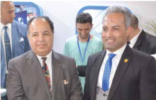
د. محمد معيط وزير المالية المصري في جناح مؤسسة الموانئ الكويتية