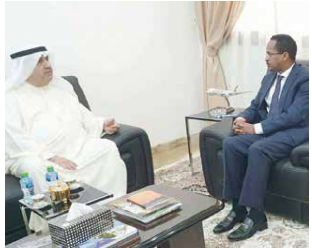
السفير الإثيوبي عبدالفتاح عبدالله حسن مستقبلا أحمد اسماعيل بهباني

واستقبل سفير جمهورية إثيوبيا الفيدرالية الديمقراطية لدى الكويت عبدالفتاح عبدالله حسن بمكتبه بالسفارة رئيس اللجنة المنظمة لمعرض الكويت للطيران 2020 أحمد اسماعيل بهباني والذي سلمه دعوة جمهورية إثيوبيا الفيدرالية الديمقراطية للمشاركة في معرض الكويت للطيران والذي سيقام في الفترة من 15-18 يناير 2020 بمطار الكويت الدولي.