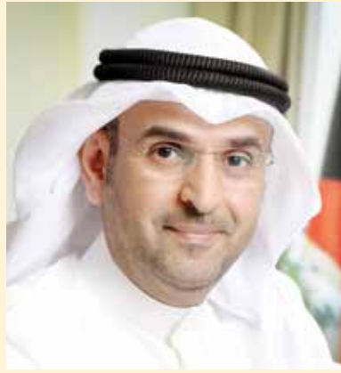
د. نايف الحجرف

– عبداللطيف الزياتي – بحريني عين أميناً عاماً لمجلس التعاون في ابريل عام 2011.