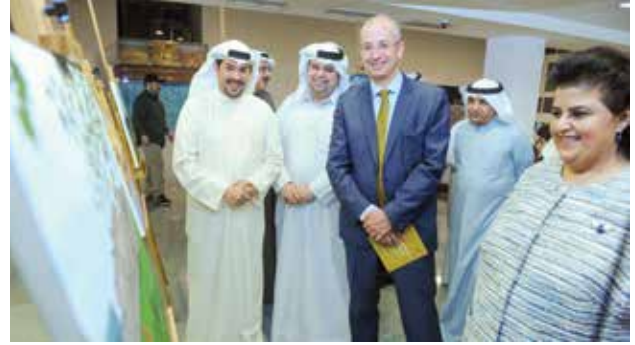
الشيخة هالة بدر المحمد والسفير البريطاني مايكل دافنبورت وجابر الهندال ود. عيسى دشتي خلال جولة في المعرض