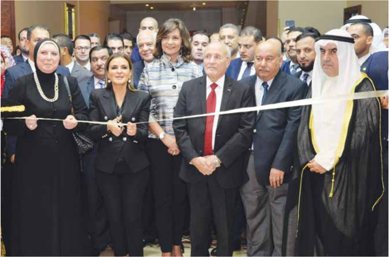
د. سحر نصر وزيرة الاستثمار والتعاون الدولي المصري واللواء د. محمد العصار وزير الإنتاج الحربي المصري والسفيرة نبيلة مكرم وزيرة الهجرة وشؤون المصريين في الخارج والسفير الكويتي محمد صالح الذويخ وأحمد إسماعيل بهبهاني و د. نيفين جامع الرئيسة التنفيذية لجهاز تنمية المشروعات الصغيرة والمتوسطة اثناء افتتاح الأسبوع الكويتي الـ12 في مصر 5 نوفمبر 2019 بفندق النيل ريتز كارلتون - القاهرة

أقيم برعاية رئيس الوزراء المصري وبحضور وزراء الاستثمار والتعاون الدولي والإنتاج الحربي والهجرة وشؤون المصريين في الخارج والمالية ولغيف من النواب والشخصيات العامة