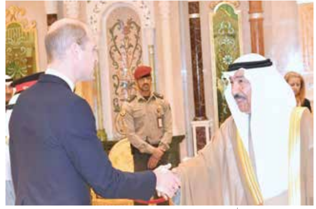
الشيخ جابر العبد الله مصافحا صاحب السمو الملكي الأمير ويليام