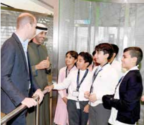
الشيخ محمد عبدالله وصاحب السمو الملكي الأمير وليام وحديث مع الأطفال بمركز الشيخ عبدالله السالم الثقافي

وقام صاحب السمو الملكي الأمير وليام، دوق كامبريدج، بزيارة إلى معسكر الشيخ سالم العلي الصباح في منطقة الصبية.