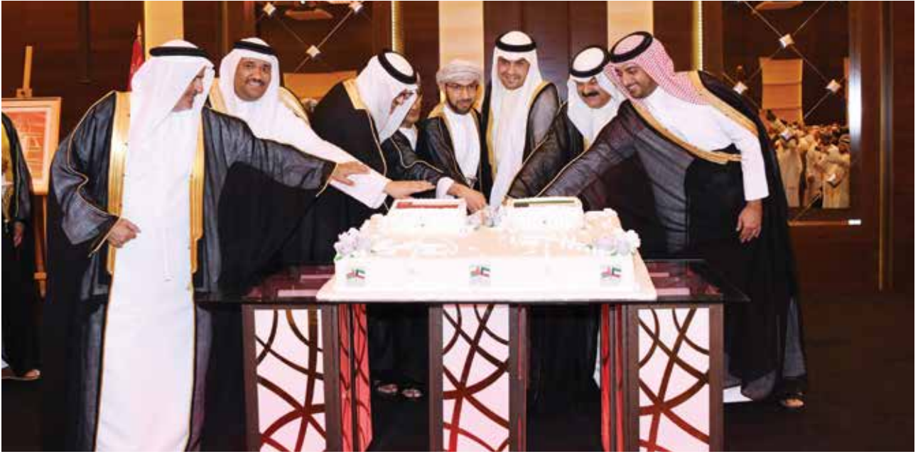
أنس الصالح وخالد الجارالله و السفير السعودي الأمير سلطان بن سعد والسفير القطري بندر العطية والقائم بالأعمال البحريني محمد جاسم السبت ود.صالح الخروصي والقائم بالأعمال العماني هلال الشنفرى أثناء قطع كعكة الاحتفال