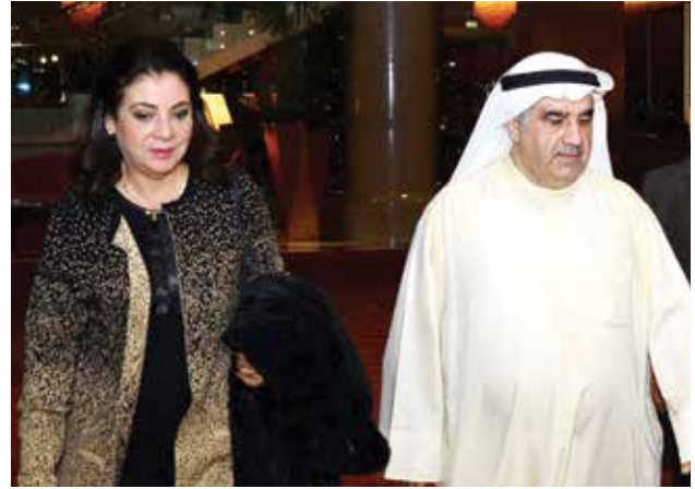
أحمد اسماعيل بهبهاني ود. درية شرف الدين وزير الاعلام المصرية السابقة