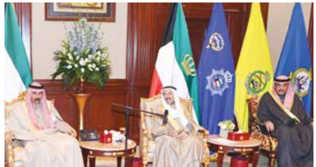
صاحب السمو الأمير الشيخ صباح الأحمد ملقياً كلمته بحضور سمو ولي العهد الشيخ نواف الأحمد وسمو رئيس مجلس الوزراء الشيخ صباح الخالد

سيدي سمو الأمير، لقد سمعنا باهتمام لما تفضلتم به سموكم من توجيهات سامية، وأعاهد الله ثم أعاهد سموكم بأن تكون منهجاً للعمل الوزاري يقوم على مبدأ التضامن والتعاون، وتنفيذ هذه التوجيهات السامية، كما أشار سموكم في التوجيه السامي هذه المرحلة فيها الكثير من التحديات وكثير من العمل لخدمة الوطن والمواطنين تتطلب جهداً مضاعفاً، نعاهد الله ثم نعاهد سموكم أن يكون