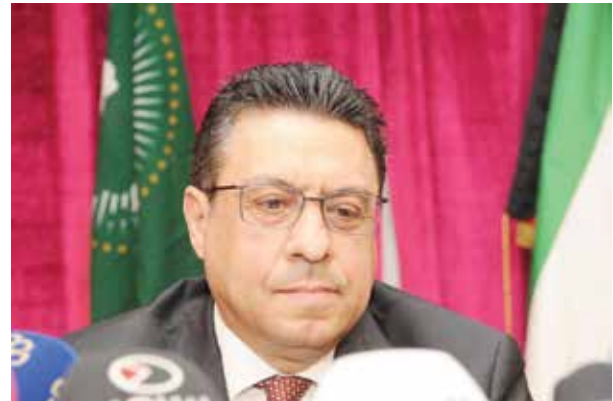
السفير المصري طارق القوني