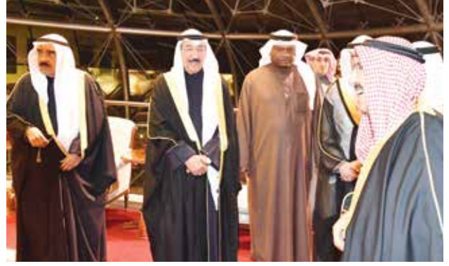
صاحب السمو الأمير الشيخ صباح الأحمد والشيخ جابر العبد الله والشيخ فيصل السعود

وأكدت الدول الأعضاء في اتفاقية الدفاع المشترك لمجلس التعاون، التزامها بالنظام الأساسي لمجلس التعاون، واحترامها لميثاق جامعة الدول العربية وهيئة الأمم المتحدة، وعزمها على الدفاع عن نفسها بصورة جماعية، انطلاقاً من أن أي اعتداء على أي منها هو اعتداء عليها مجتمعة، وأن أي خطر يهدد إحداها إنما يهددها جميعاً.