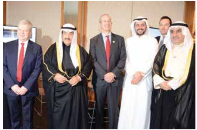
سمو الشيخ ناصر المحمد والسفير مايكل دافنبورت وأحمد اسماعيل بهبهاني وروجر وينفيلد في جناح HSBC Bank