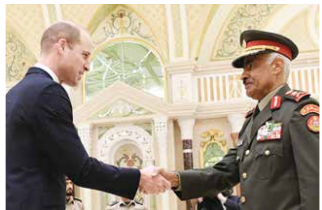
الفريق الركن محمد الخضسر صاحب السمو الملكي الأمير ويليام