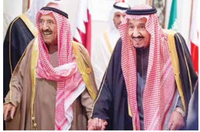
خادم الحرمين الشريفين الملك سلمان بن عبدالعزيز وصاحب السمو الأمير الشيخ صباح الأحمد