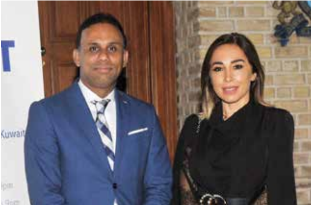
مادونا هويك و علي فيروز