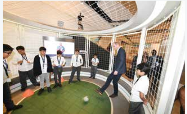
صاحب السمو الملكي الأمير وليام مشاركا عددا من الأطفال لعب كرة القدم بمركز الشيخ عبدالله السالم الثقافي