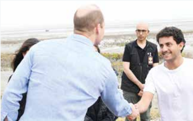
صاحب السمو الملكي الأمير وليام مصافحاً عمر عبد العزيز اسحق