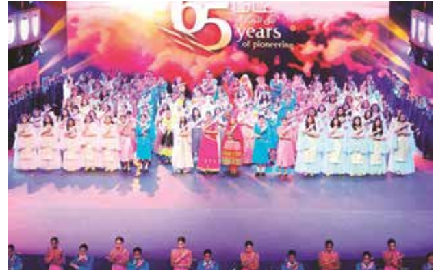
الخطوط الجوية الكويتية 65 عاما من الريادة