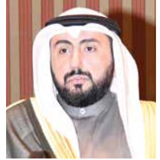
الشيخ د. باسل الصباح