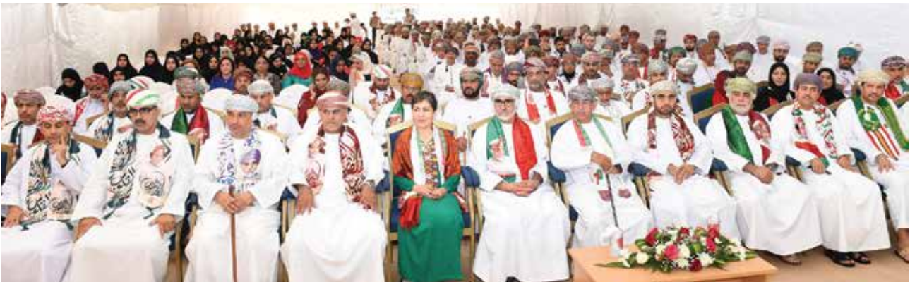
د . احمد السعيد والوكلاء ود . اكيجمال ماجتيموفا ممثلة منظمة الصحة العالمية بالسلطنة وعدد من المسؤولين بوزارة الصحة العمانية

في الختام قام معالي الدكتور أحمد بن محمد السعدي - وزير الصحة - بتكريم المؤسسات والجهات الخاصة المساهمة في اقامة الحفل.