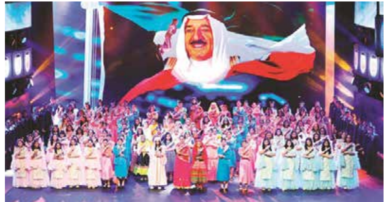
إحدى فقرات الاحتفالية

** فيلم وثائقي وأوبريت وأغنية خاصة وعروض فنية... وفقرات أخرى متنوعة