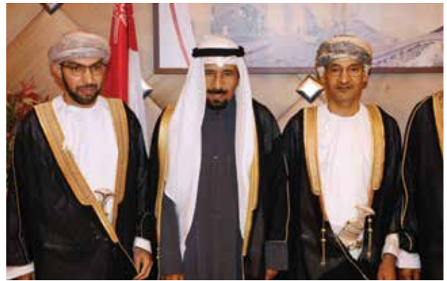
الشيخ علي الجابر يقدم التهاني

وتابع: ان الاحتفال بالعيد الوطني الـ 49 يعتبر من الأيام المجيدة في تاريخ السلطنة، رافعا أسمى آيات التهاني والتبريكات إلى السلطان قابوس بن سعيد وللشعب العماني بهذه المناسبة السعيدة.