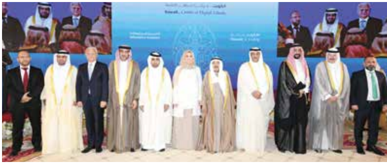
صاحب السمو الأمير الشيخ صباح الأحمد والشيخة عايدة سالم مع أعضاء اللجنة المنظمة العليا