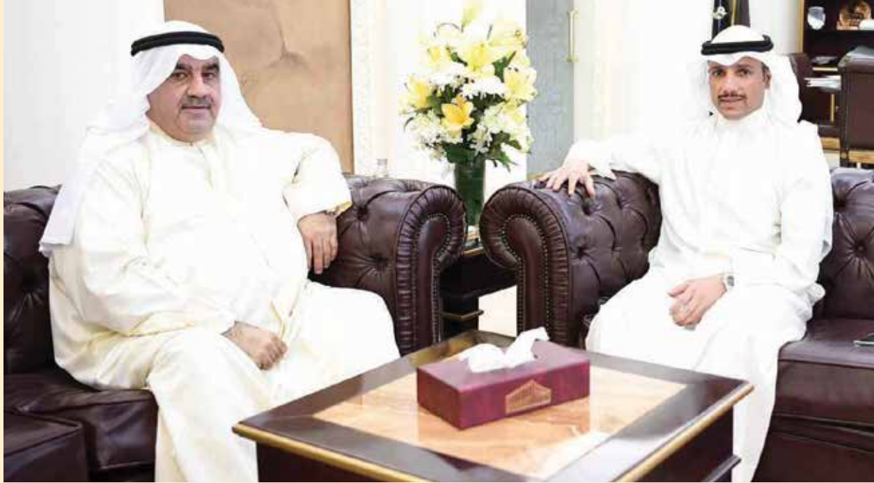
مرزوق الغانم مستقبلا احمد اسماعيل بهبهاني

خارطة معارض الطيران العالمية ، كما انه يدعم رؤية كويت جديدة 2035 ، مشيرا إلي أن هذا الحدث العالمي يعكس الثقة التي اكتسبتها دولة الكويت عالميا في ظل الدعم والتطورات التي يشهدها قطاع النقل ، مشيرا إلي أن معرض الكويت للطيران 2020 سيساهم في تعزيز مكانة دولة الكويت الاقتصادية والاستثمارية .