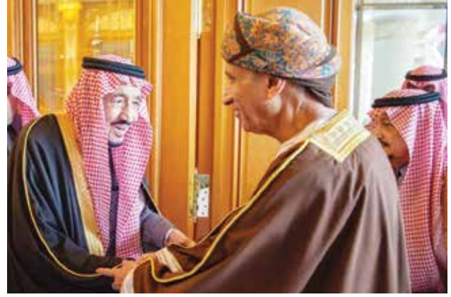
خادم الحرمين الشريفين الملك سلمان بن عبدالعزيز مستقبلا صاحب السمو السيد فهد بن محمود آل سعيد نائب رئيس الوزراء لشؤون مجلس الوزراء العماني