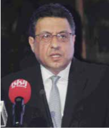
السفير طارق القوني يلقي كلمته