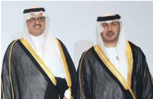
السفير السعودي الأمير سلطان بن سعد مباركا