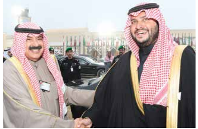
صاحب السمو الملكي الأمير تركي بن محمد بن فهد آل سعود مضافاً نائب وزير الخارجية خالد الجار الله