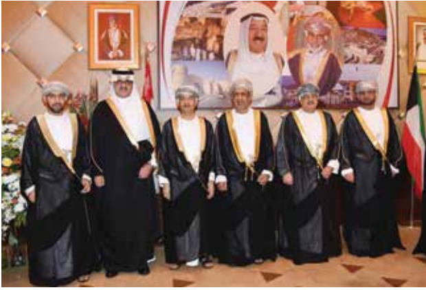
السفير السعودي الأمير سلطان بن سعد مباركا