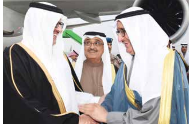
السفير السعودي الأمير سلطان بن سعد بن خالد آل سعود مضافاً يوسف الرومي وماجد الماجد

وعلى رأسهم الحكومة اليمنية في التوصل إلى اتفاق الرياض، ونؤكد على استمرار التحالف في دعمه للشعب اليمني وحكومته، وعلى أهمية الحل السياسي في اليمن وفق المرجعيات الثلاث».