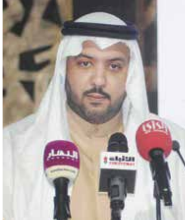
الشيخ مبارك العبدالله يلقي كلمته