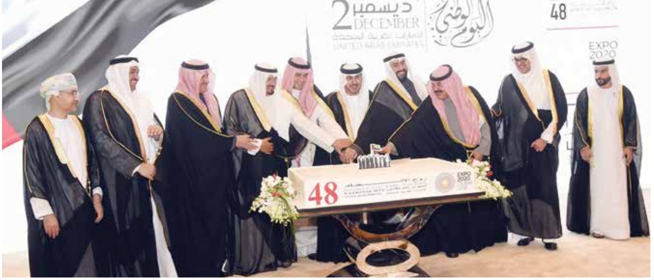
الشيخ أحمد العبد الله وأنس الصالح والشيخ د. باسل الصباح وخالد الجارالله والسفير الاماراتي صقر الرئيسي والسفير ضاري العجران والسفير السعودي الأمير سلطان بن سعد والقائم بالأعمال البحريني محمد جاسم السيت والقائم بالأعمال العماني هلال الشنفرى أثناء قطع كيكة الاحتفال