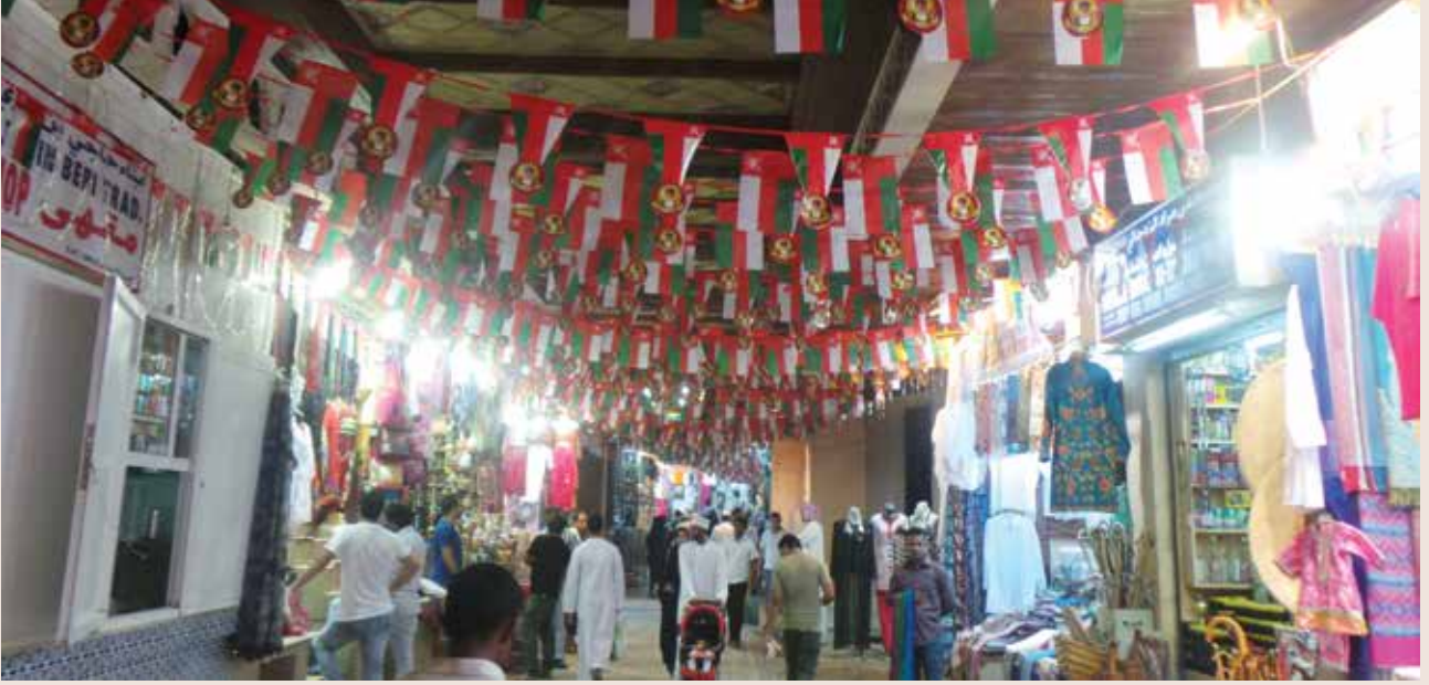
سوق مطرح يحكي أدق التفاصيل عن التاريخ والثقافة العمانية