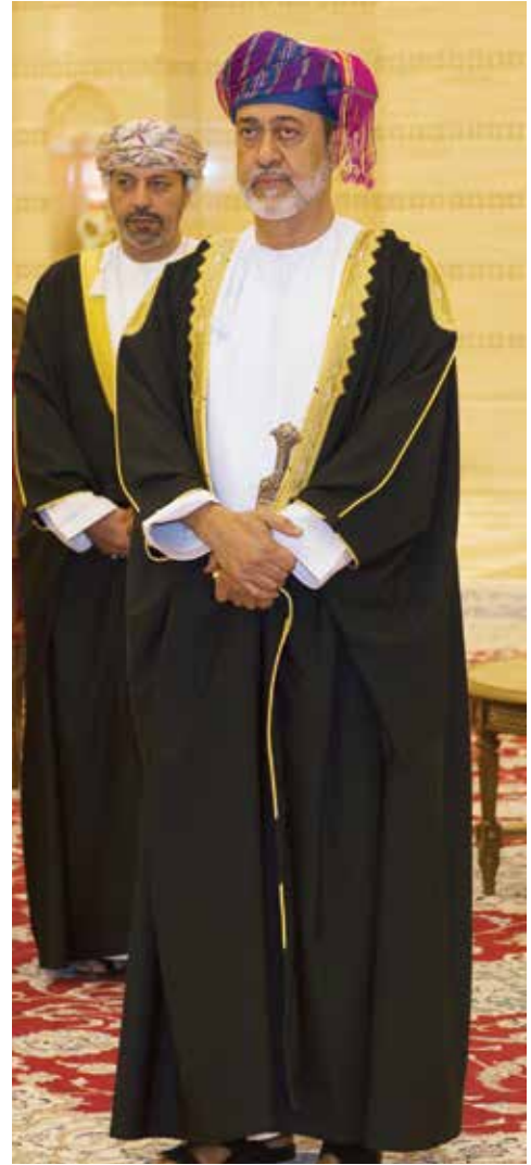
صاحب الجلالة السلطان هيثم بن طارق

وسيتم خلال هذه المرحلة صرف المنفعة للعُمانيين المنهية خدماتهم في حين تبدأ المرحلة الثانية بعد 3 سنوات