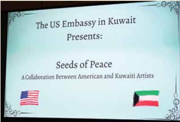
بذور السلام بين فناني الكويت وأميركا

” التمثال هدية من شعب الولايات المتحدة الأميركية إلى صاحب السمو أمير الكويت الشيخ نواف الأحمد والشعب الكويتي “