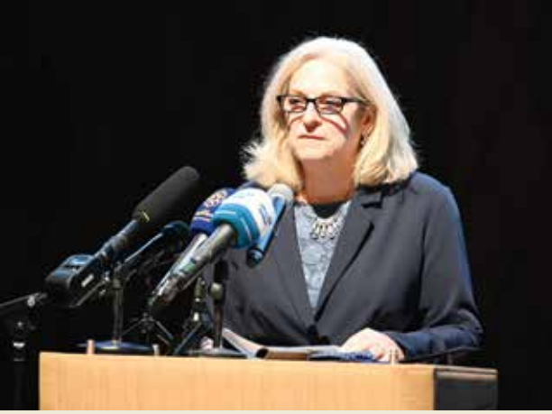
السفيرة ألينا رومانوسكي تلقي كلمتها