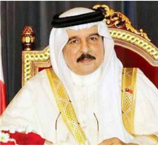
صاحب الجلالة الملك حمد بن عيسى آل خليفة