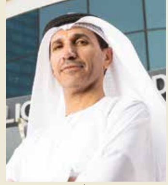
د.م. محمد ناصر الأحبابي

هنأ أحمد اسماعيل بهبهاني رئيس اللجنة المنظمة لمعرض الكويت للطيران 2022 ورئيس تحرير «الخليج» الكويتية في اتصال هاتفي سعادة الدكتور المهندس محمد ناصر الأحبابي المدير العام لوكالة الفضاء الإماراتية بنجاح مهمة مسبار الأمل الإماراتي في الوصول إلى مداره حول كوكب المريخ، كأول دولة عربية والخامسة على مستوى العالم، مشيداً بهذا الإنجاز التاريخي والعلمي في مجال الفضاء والذي يعد محل فخر واعتزاز للإمارات والشعوب العربية، ويضاف إلى الإنجازات التي حققتها الإمارات وما وصلت إليه من تقدم في المجالات العلمية والفضاء وفي كافة المجالات بقيادة صاحب السمو الشيخ خليفة بن زايد آل نهيان رئيس دولة الإمارات العربية المتحدة و صاحب السمو الشيخ محمد بن راشد آل مكتوم نائب رئيس دولة الإمارات رئيس مجلس الوزراء حاكم دبي وصاحب السمو الشيخ محمد بن زايد آل نهيان ولي عهد أبوظبي نائب القائد الأعلى للقوات المسلحة متمنياً لسعادته دوام الصحة والعافية ولدولة الإمارات العربية المتحدة الشقيقة المزيد من التقدم والازدهار والرخاء.