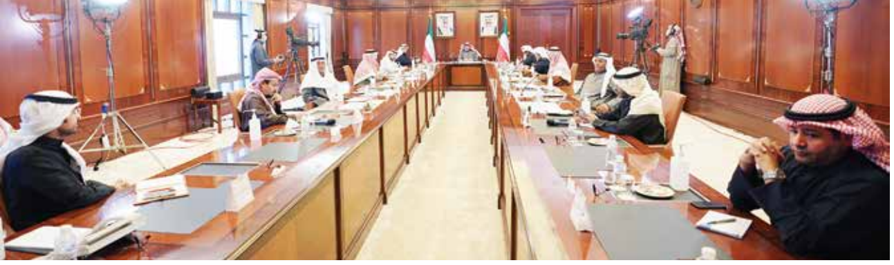
سمو رئيس مجلس الوزراء الشيخ صباح الخالد خلال لقائه بروؤساء تحرير الصحف المحلية

هذا تم خلال سنة، ويجب أن نأخذ المؤشرات ونركز على الأمر ونكافح الفساد ونحافظ على المال العام». وفي ما يتعلق بخلل الميزانية، قال «الخلل كله في المصروفات، فمن أين تأتي المصروفات؟ إما من قرارات حكومية وإما قوانين برلمانية. ومن الخطر أن يستمر الوضع الحالي من دون الإصلاح المطلوب. فأكبر اقتصاديات العالم تأثرت، ولكن علينا نحن أن نخوض التحدي ولا نضع الأعذار، فالعمل موجود والمساءلة أمام ربي وأميري والشعب، ولا بد من إجراءات سواء في الاقتصاد أو التعليم، وهي أهم التحديات التي نركز عليها».