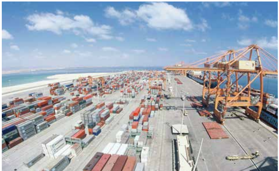
ميناء صلالة بمحافظة ظفار