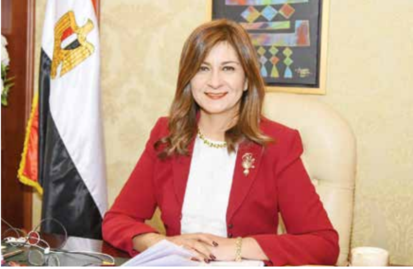
السفيرة نبيلة مكرم وزيرة الدولة للهجرة وشؤون المصريين في الخارج

أعرب السفيرة نبيلة مكرم وزيرة الدولة للهجرة وشؤون المصريين في الخارج، عن شعورها بالفخر لدعم القيادة السياسية للمرأة مؤكدة أن الوزيرات يتحملن مسئولية حقايب وزارة ثقيلة، وقالت خلال استضافتها في حوار خاص في برنامج «من مصر»، على فضائية «cbc» إن ملف المصريين بالخارج مرتبط بعدة وزارات وأزمة العالقين كانت مليئة بالقصص الإنسانية المؤثرة