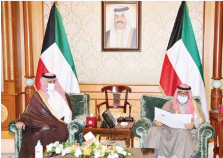
سمو ولي العهد الشيخ مشعل الأحمد مستقبلا السفير القطري بندر العطية