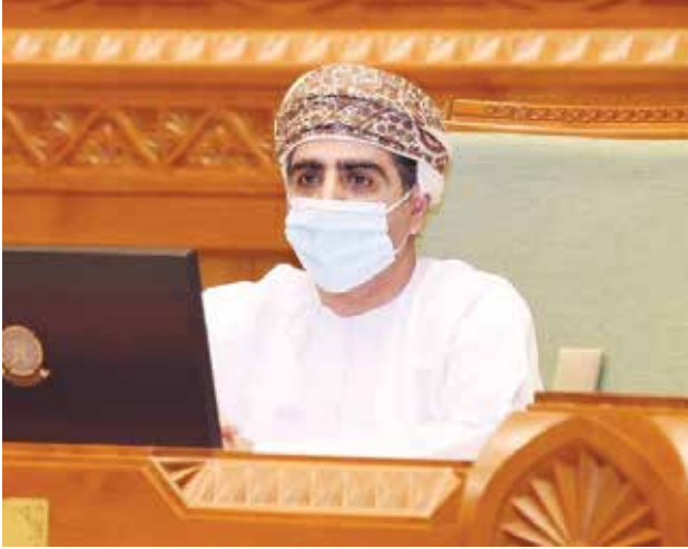
الشيخ أحمد بن محمد الندابي أمين عام المجلس

يقارب أربعة أخماس إجمالي النفقات الصحية. وأظهر تحليل إنفاق وزارة الصحة- باعتبارها القائم على تقديم الرعاية الصحية بشكل رئيسي الثبات في النفقات المتكررة خلال الفترة 2015-2019- أن الرواتب والبدايات وحدها تستحوذ على ما يقارب 1, 82% من النفقات المتكررة في وزارة الصحة، كما يوضح التحليل أن الزيادة السنوية في النفقات المتكررة على مدى السنوات الأربع الماضية لا تغطي سوى الزيادة السنوية في الرواتب، ولا تغطي الزيادة في عدد السكان، كما لا تغطي الزيادة الحقيقية اللازمة لتعزيز وتطوير النظام الصحي.