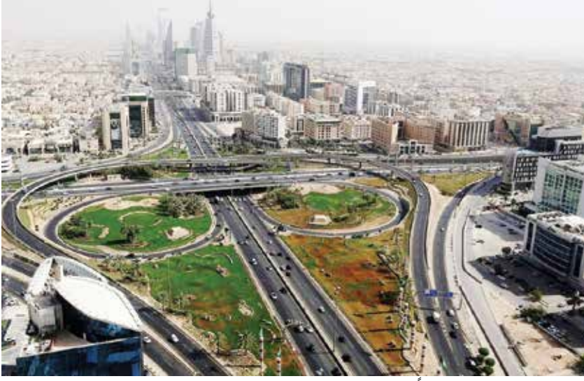
الرياض لها ميزات خاصة جداً.. وتشكل 50% من الاقتصاد غير النفطي للمملكة