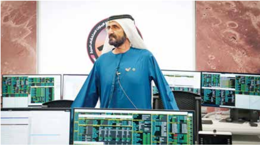
صاحب السمو الشيخ محمد بن راشد آل مكتوم

دخلت، الإمارات التاريخ كأول دولة عربية تصل إلى المريخ، وخامس دولة في العالم، تحقق هذا الإنجاز بعدما نجح مسبار الأمل، ضمن مشروع الإمارات لاستكشاف المريخ، في الوصول إلى الكوكب الأحمر، متوجةً بذلك الخمسين عاما الأولى منذ تأسيسها عام 1971 بحدث تاريخي وعلمي غير مسبوق على مستوى المهمات المريخية السابقة، حيث تستهدف المهمة المريخية الاستكشافية الإماراتية إلى تقديم بيانات علمية لم يتوصل إليها الإنسان من قبل عن الكوكب الأحمر.