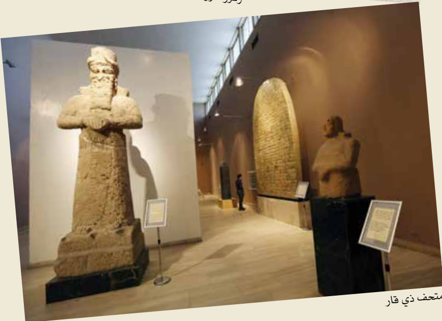
متحف ذي قار

وأوضح، لذلك ستكون الزيارة بداية لمواسم حج عملاقة وكبيرة لكل العالم من الشرق والغرب إلى الناصرية ومدينة أور، داعيا إلى أن تستثمر السياحة الأثرية والدينية استثمارا حقيقيا من قبل الدولة العراقية وأن تجعل منه انطلاقة لعراق جديد يكون على رأس القائمة الاقتصادية في العالم.