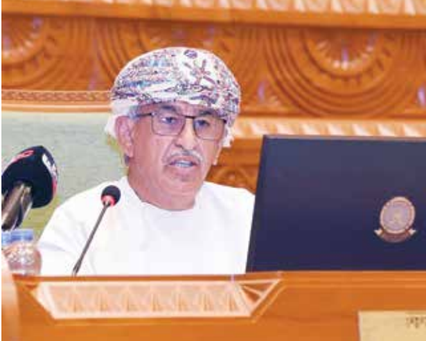
د. أحمد السعيدى وزير الصحة العماني

أكد الدكتور أحمد بن محمد السعيدى وزير الصحة العماني أن وزارة الصحة تعكف حالياً على إعداد الخطة الخمسية العاشرة التي ستشتمل على مقترحات لمشاريع جديدة وتوسعات في ضوء الإمكانيات المالية التي ستعتمد لوزارة الصحة من أجل تنفيذها على مدار سنوات الخطة وذكر أن عدد العاملين في الوزارة بنهاية عام 2019 بلغ 39413 موظفاً بنسبة تعمين 72٪.