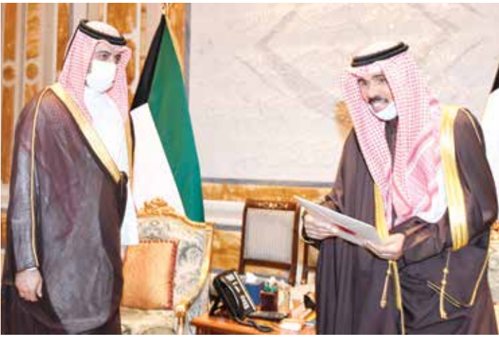
سمو الأمير الشيخ نواف الأحمد يتسلم الرسالة الخطية الموجهة لسموه من أمير قطر من السفير القطري بندر العطية