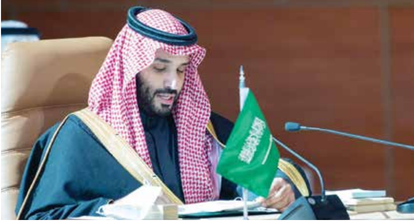
صاحب السمو الأمير محمد بن سلمان

” سياسة المملكة الثابتة والمستمرة تضع فيه مقدمة أولوياتها مجلس تعاون خليجي موحد وقوي