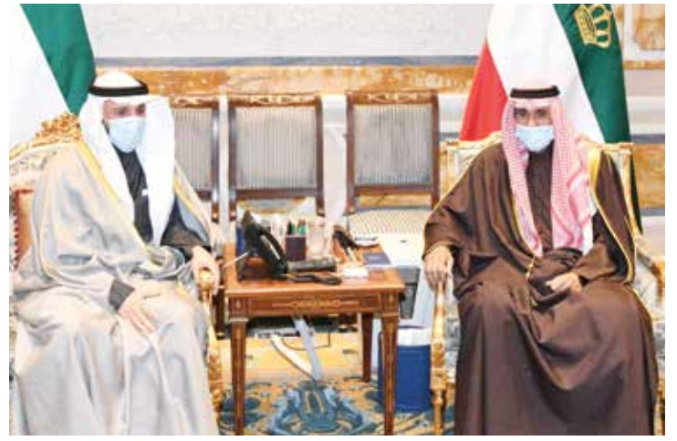
سمو الأمير الشيخ نواف الأحمد مستقبلا مرزوق الغانم