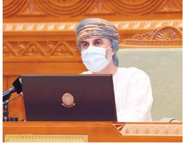
خالد بن هلال المعولي رئيس مجلس الشورى

الاقتصاد الوطني. وأبرز السعدي ارتفاع عدد مستشفيات القطاع الخاص من 19 مستشفى في عام 2016 بعدد 667 سريراً، إلى 27 مستشفى في عام 2019 بعدد 985 سريراً، وارتفع إجمالي عيادات ومراكز التشخيص بالقطاع الخاص لعام 2016 من 1105 إلى 1254 لعام 2019، وتمثل العيادات التخصصية من إجمالي العيادات ومراكز التشخيص في عام 2019 نسبة 36%، وبلغ إجمالي القوى العاملة في القطاع الصحي الخاص خلال عام 2019 نحو 13414 عاملاً.