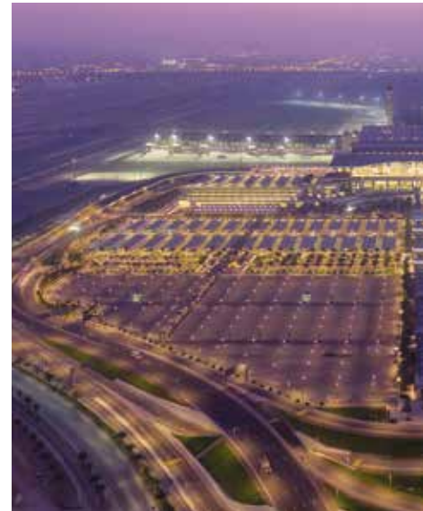
شبكة طرق متميزة