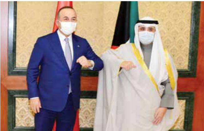
الشيخ د. أحمد الناصر خلال استقباله وزير الخارجية التركي مولود تشاوش أوغلو

الجمهورية التركية الصديقة مولود تشاوش أوغلو والوفد المرافق له وذلك بمناسبة زيارته للبلاد .