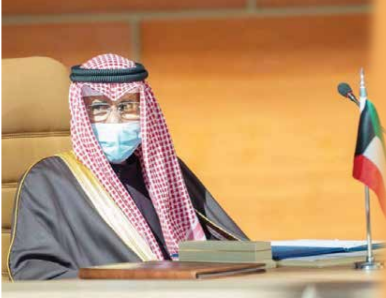
صاحب السمو الأمير الشيخ نواف الأحمد