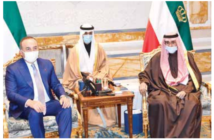
سمو الأمير الشيخ نواف الأحمد مستقبلاً وزير الخارجية التركي مولود تشاوش أوغلو