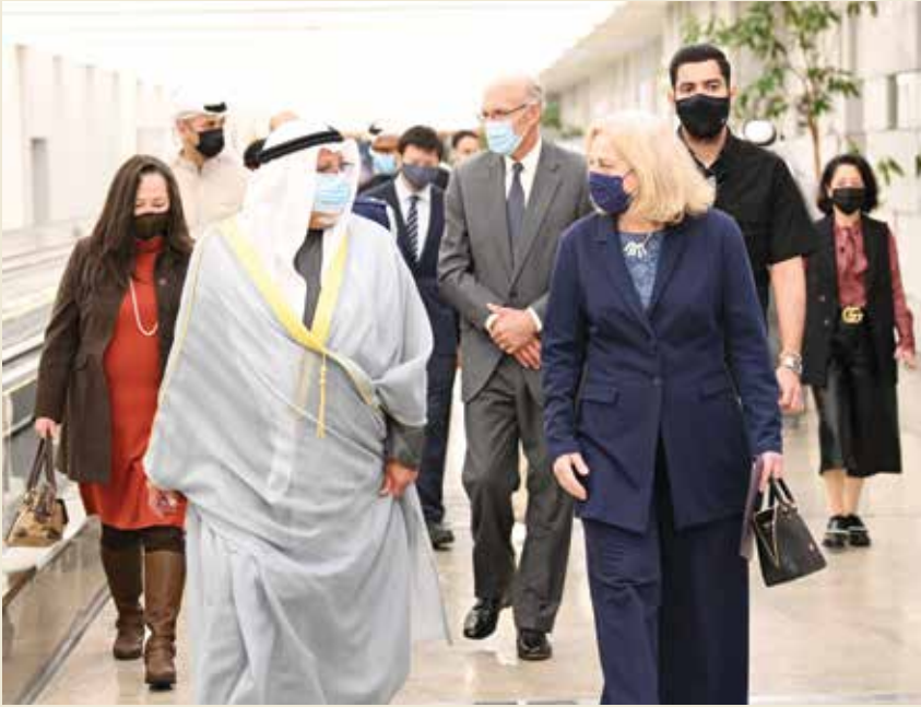
الشيخ علي الجراح والسفيرة ألينا رومانوسكي خلال جولة في مركز الشيخ جابر الأحمد الثقافي

” التمثال هدية من شعب الولايات المتحدة الأميركية إلى صاحب السمو أمير الكويت الشيخ نواف الأحمد والشعب الكويتي “