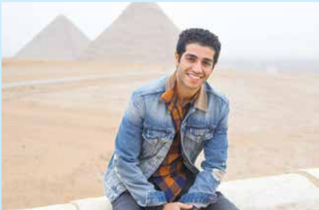
النجم المصري العالمي مينا مسعود

وأعربت عن فخرها وسعادتها بما وصل إليه في مشواره الفني، فضلاً عن تمسكه باللغة العربية والمصرية لغة وطنه الأم، مشيرة إلى أن الفن هو أحد عناصر القوى الناعمة لمصر في الخارج لما له من قوة تأثير، وبالتالي فإن نجاحه يعتبر نجاحاً لمصر بالخارج.