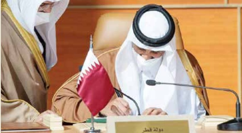
صاحب السمو الشيخ تميم بن حمد آل ثاني أمير دولة قطر

رحبت دولة قطر ببيان العلاء، الذي أعلن على هامش اجتماع الدورة الحادية والأربعين للمجلس الأعلى لمجلس التعاون لدول الخليج العربية، الذي عقد يوم الثلاثاء الموافق 5 يناير 2021 بمحافظة العلاء في المملكة العربية السعودية الشقيقة. وأكدت دولة قطر، في بيان، أن هذا اللقاء يأتي في هذه اللحظة الحاسمة امتداداً لمسيرة العمل المشترك في إطاره الخليجي والعربي والإسلامي، وتغليباً للمصلحة العليا بما يعزز أواصر الود والتآخي بين الشعوب ومرسخاً لمبادئ حسن الجوار والاحترام المتبادل. وقالت «إن هذا البيان يعد مكماً للجهود الرامية والصادقة التي قادها حضرة صاحب السمو الشيخ صباح الأحمد الجابر الصباح، رحمه الله، والتي استكملها حضرة صاحب السمو الشيخ