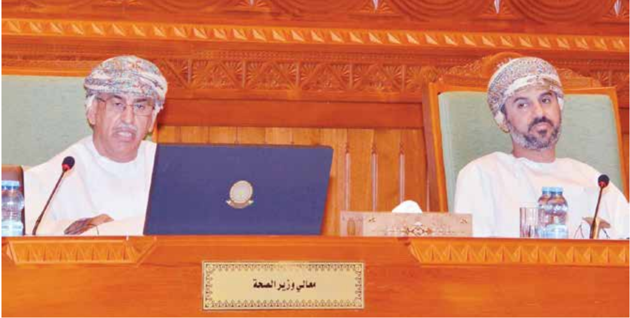
د. أحمد السعيد وزير الصحة العماني متحدثاً في مجلس الشورى وبجانبه خالد بن هلال المعولي رئيس المجلس

وأكد الأعضاء ضرورة بناء شراكة صحية، منوهين إلى أهمية إنشاء شركة وطنية للمستلزمات الطبية بدعم من جهاز الاستثمار العماني. وحول التأمين الصحي، استفسر الأعضاء عن الآلية المعتمدة لتنفيذ التأمين الصحي والأعباء المترتبة على المواطن حال تنفيذه. وأشار معالي الوزير بأن الحديث عن موضوع التأمين الصحي سابق لأوانه وأن تطبيقه مبدئياً سيكون على القطاع الخاص، كما إن المواطن لن يتأثر سلبياً، ولن يتحمل أعباء مالية.