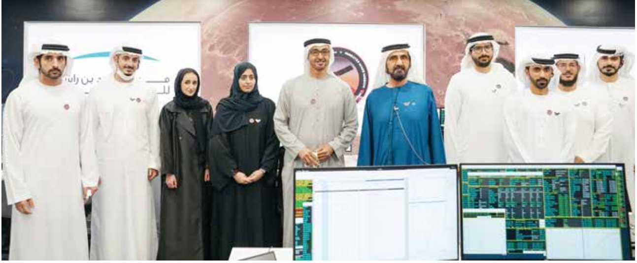
صاحب السمو الشيخ محمد بن راشد وصاحب السمو الشيخ محمد بن زايد وسمو الشيخ حمدان بن محمد بن راشد في غرفة التحكم