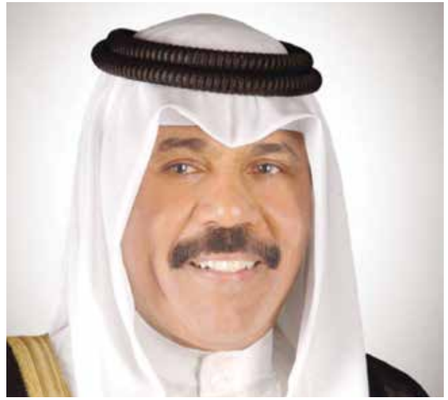
صاحب السمو الأمير الشيخ نواف الأحمد