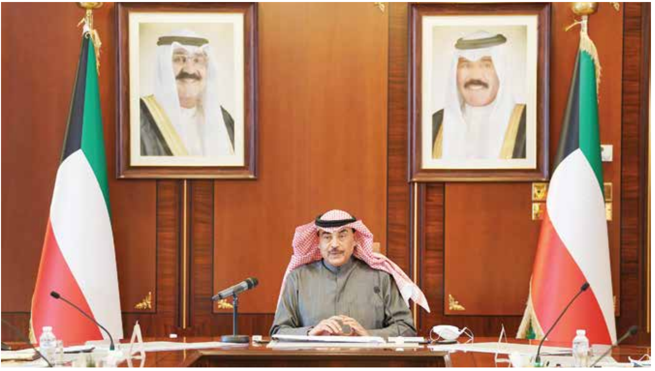
سمو رئيس مجلس الوزراء الشيخ صباح الخالد