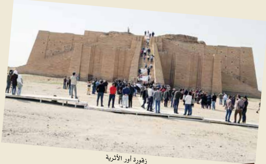
زقورة أور الأثرية

ويرى أن هذه الزيارة تشهد فتح باب جديد للاقتصاد العراقي وهو باب السياحة الأثرية والدينية في هذه المنطقة خاصة وأن السياحة في العالم أصبحت صناعة حسب آخر إحصائية لليونسكو ما يقارب 120 دولة تعتمد في اقتصادها على السياحة والآثار ونحن اقتصادنا مرعب وميزانينا تعتمد 96% منها على النفط وهذا شيء مرعب جدا يجب أن تكون هناك حلول بديلة وهي بالاعتماد على الاقتصاد السياحي والآثاري.