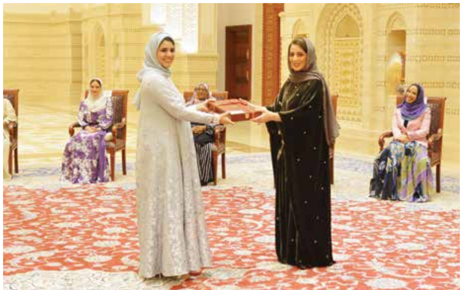
السيدة الجليلة حرم جلالة السلطان تكرم احدى الشخصيات العمانية

وستمكن هذه المنظومة الإلكترونية مُستخدمي البيانات من الحصول على بيانات تفصيلية عالية الدقة ومحدثة بشكل أن لمختلف المعلومات الخاصة بالتركيبة السكانية... وغيرها