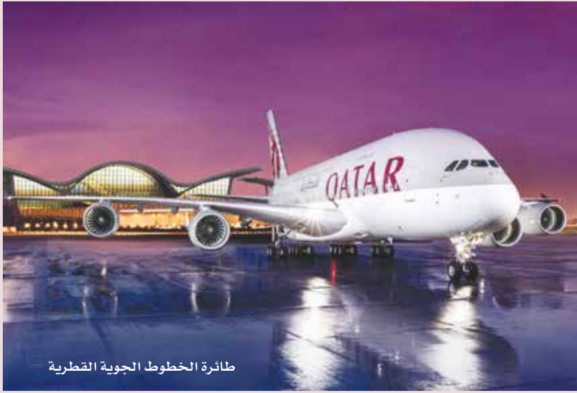
طائرة الخطوط الجوية القطرية

وتابع: «بصراحة، أعتقد أنه سيتعين على الجميع إبراز شهادة تثبت حصولهم على لقاح حتى يتسنى لهم الصعود إلى الطائرة، ولن يقتصر الأمر على هذا فحسب، وإنما