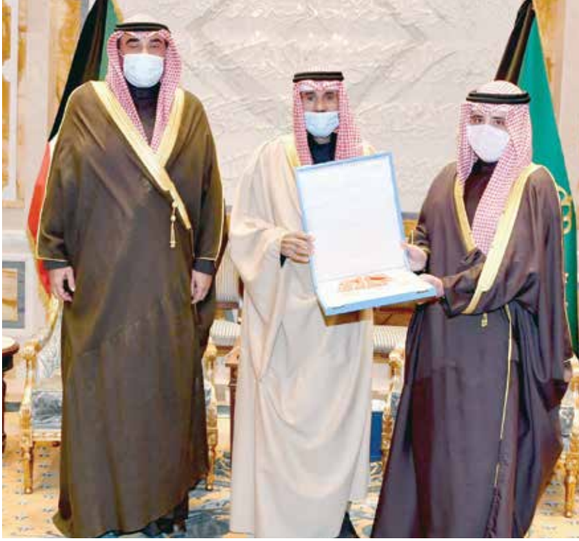
سمو الأمير الشيخ نواف الأحمد مستقبلاً بحضور سمو الشيخ صباح الخالد الشيخ د. أحمد الناصر

وزير الخارجية لسمو الأمير: هذا كله تحت قيادتكم واجب.. وخدمة البلد وخدمة الكويت وخدمتكم هذا أكبر شرف لي