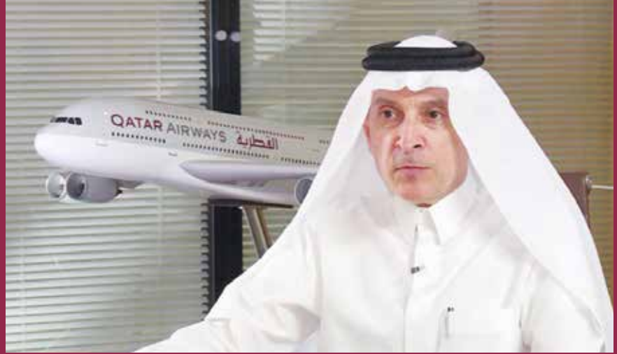
أكبر الباكر الرئيس التنفيذي للخطوط الجوية القطرية

قال الرئيس التنفيذي للخطوط الجوية القطرية أكبر الباكر أن «القطرية» أكبر شركة طيران دولية حول العالم والشركة الأولى عالمياً فيما يتعلق بالشحن الجوي، وأضاف في مقابلة مع تليفزيون قطر أن جواز السفر الرقمي عبر «إياتا» يعطي الإرشادات الصحيحة للمسافرين لضمان تحركهم من جهة إلى أخرى، وأشار إلى أن مطار حمد الدولي يشهد حالياً عمليات التوسعة ليتصل إلى قرابة 70 مليون مسافر، وأكد الباكر في مقابلة أخرى أجراها مع قناة بي بي سي وورلد البريطانية: أن الناقل القطرية ستحرص على استلام جميع الطائرات التي طلبتها من بوينغ وإيرباص وقال لا أعتقد بأن السفر سوف يعود إلى المستويات التي كان عليها في 2019 في المستقبل القريب واليكم التفاصيل.