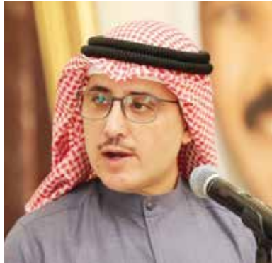
الشيخ د. أحمد ناصر المحمد

وختم الشيخ د. أحمد الناصر كلمته بتوجيه جزيل الشكر للقائمين على هذه اللفتة الجميلة معاهداً الله وولادة الأمر وأهل الكويت بأن هذا التكريم ليس إلا محفز لمزيد من الجهد والعطاء خدمة للكويت وأميرها وشعبها.