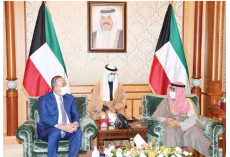
سمو ولي العهد الشيخ مشعل الأحمد مستقبلا وزير الخارجية التركي مولود تشاوش أوغلو

الشقيقة وأثمرت بنتائجها الإيجابية الخيرة على لُحمة الشعوب الخليجية الشقيقة، كما تضمنت الرسالة العلاقات الأخوية الطيبة التي تربط البلدين والشعبين الشقيقين وسبل تعزيزها وتمييزها في مختلف المجالات.