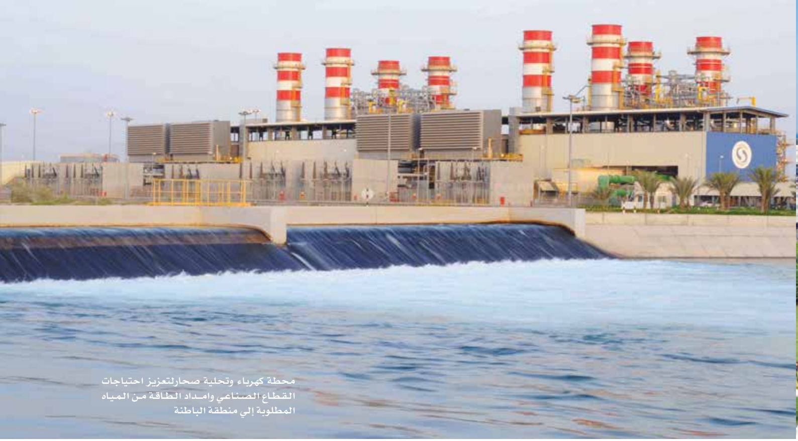
محطة كهرباء وتحلية صحار لتعزيز احتياجات القطاع الصناعي وامداد الطاقة من المياه المطلوبة إلى منطقة الباطنة

” الرؤية المستقبلية «عُمان 2040» تشمل مجتمع إنسانه مبدع واقتصاد بيئته تنافسية وبيئة مواردها مستدامة ودولة أجهزتها مسؤولة