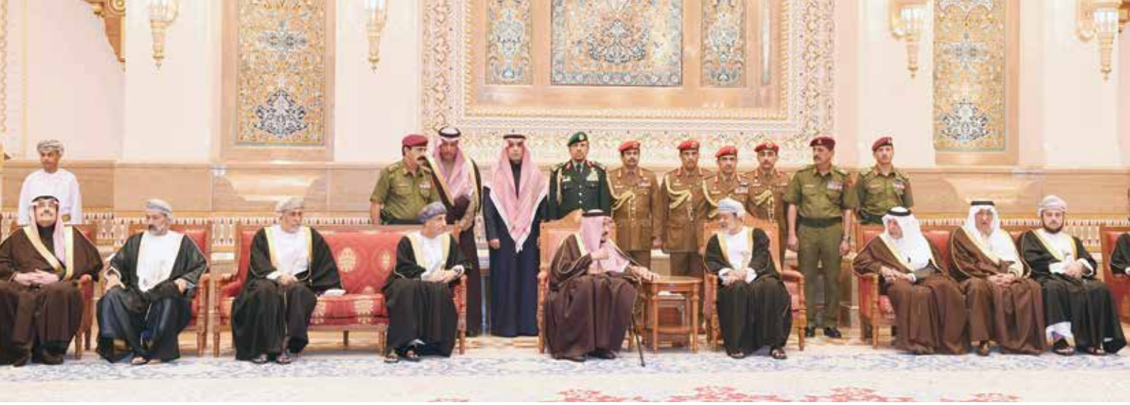
صاحب الجلالة السلطان هيثم بن طارق خلال استقباله خادم الحرمين الشريفين الملك سلمان بن عبد العزيز اثناء تقديم واجب العزاء بوفاة المغفور له بإذن الله السلطان قابوس بن سعيد