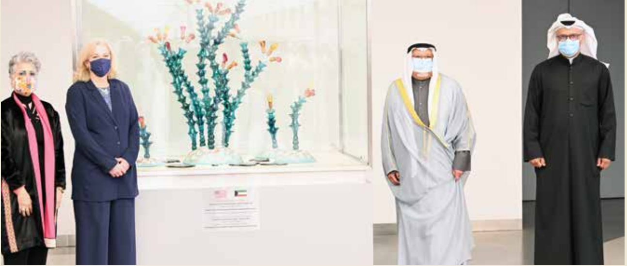
الشيخ علي الجراح والسفيرة ألينا رومانوسكي خلال إزاحة الستار عن التمثال الزجاجي المقدم من السفارة الأمريكية