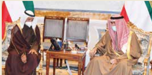
سمو الأمير الشيخ نواف الأحمد مستقبلا محمد عبدالرحمن الشارخ

استقبل صاحب السمو الأمير الشيخ نواف الأحمد بقصر بيان رئيس مجلس إدارة شركة صخر لبرامج الحاسب محمد عبدالرحمن الشارخ، وذلك بمناسبة فوزه بجائزة الملك فيصل فرع خدمة الإسلام لعام 2021م التي تمنحها مؤسسة الملك فيصل الخيرية لجهوده في تعريب وإنتاج برامج الحاسوب ومساهماته في إثراء الساحة الإسلامية والثقافة العربية، متمنيا سموه له دوام التوفيق والنجاح لمواصلة عطائه المشهود ورفع راية الوطن الغالي في المحافل الإقليمية والدولية. وحضر المقابلة رئيس الديوان الأميري الشيخ مبارك الفيصل.