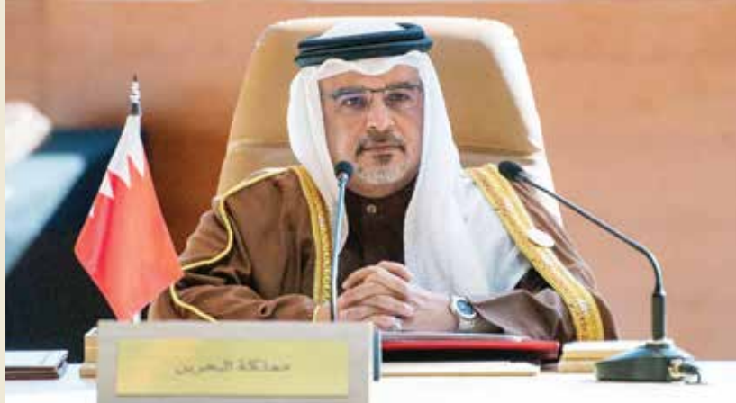
صاحب السمو الملكي الأمير سلمان بن حمد آل خليفة

أعرب صاحب السمو الملكي الأمير سلمان بن حمد آل خليفة ولي العهد رئيس مجلس الوزراء في مملكة البحرين عن شكره لخادم الحرمين الشريفين الملك سلمان بن عبد العزيز آل سعود - حفظه الله - على ما يوليه من حرصٍ على تعزيز التعاون المشترك.