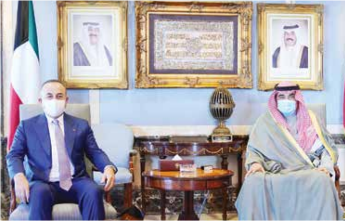
سمو الشيخ صباح الخالد مستقبلاً وزير الخارجية التركي مولود تشاوش أوغلو