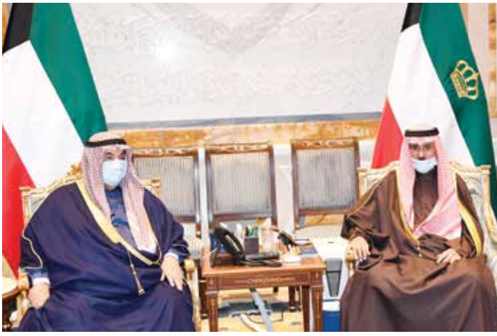
سمو الأمير الشيخ نواف الأحمد مستقبلا سمو الشيخ ناصر المحمد