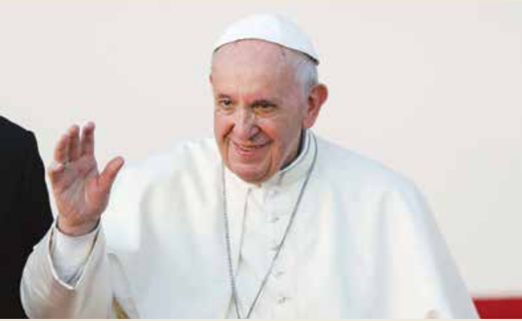
بابا الفاتيكان «البابا فرنسيس»

عندما افتتح مسلحون الكنيسة أثناء أداء مراسم القداس وقتل المواطنين، وانتهت الحادثة بتفجير الإرهابيين لأنفسهم وقتل وجرح المئات ممن كانوا داخل الكنيسة.