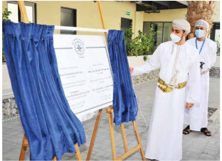
صاحب السمو السيد ذي يزن آل سعيد يفتتح مركز التدريب الوطني لأوتورد باوند عُمان بالخوض

وتعميقاً للتواصل الدائم بين حضرة صاحب الجلالة السلطان هيثم بن طارق المعظم - حفظه الله ورعاه - وأبناء الوطن على امتداد هذه الأرض الطيبة تفضل جلالته - حفظه الله ورعاه - فالتقى في سبتمبر من العام الماضي بقاعة الحصن بحي الشاطئ بولاية صلالة بعدد من شيوخ ولايات محافظة ظفار تعبيراً عن حرص جلالته الدائم على الالتقاء بالمواطنين وليطلع على احتياجاتهم ومتطلبات ولاياتهم عن قرب ويستمع إلى ملاحظاتهم ومقترحاتهم بشأن الخدمات التنموية وتطويرها وتعزيز دور الجهات الحكومية في إيصالها لمختلف أرجاء البلاد في إطار الخطط التنموية الشاملة والمستدامة.