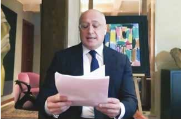
الإعلامي اللبناني مارسيل غانم

أسرى في بيوتهم، كانت وسيلة تواصلهم الوحيدة مع العالم الخارجي هي شاشات التلفزيون ومواقع التواصل الاجتماعي. لقد لعب الإعلام - التقليدي والرقمي - دورا مهما جدا جدا في التأثير في النفوس وتوجيه المشاهدين وتصوراتهم عن المستقبل. فوجدنا في كثير من الحالات أن الإعلام الغربي يثير الخوف والرعب في نفوس المشاهدين، مركزا على السلبات فقط. ما أصاب الغرب بحالة من الهلع والشلل.