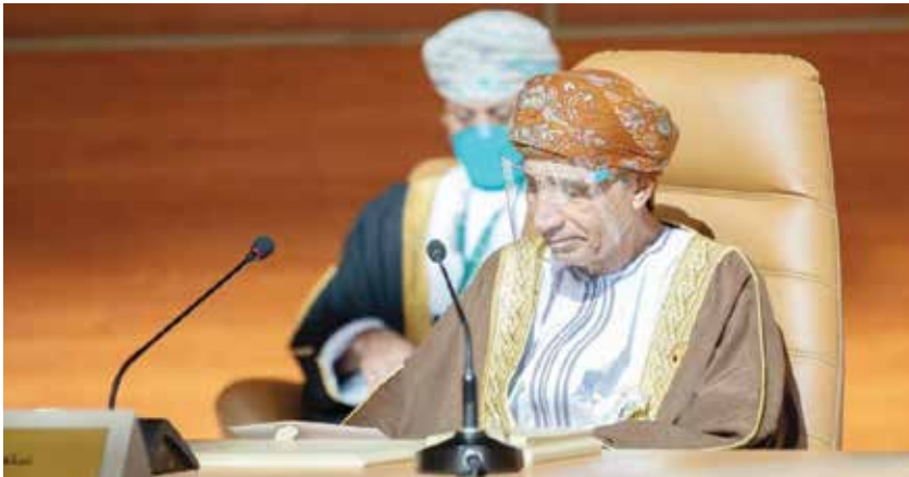
صاحب السمو السيد فهد بن محمود آل سعيد

أكد صاحب السمو السيد فهد بن محمود آل سعيد نائب رئيس الوزراء لشؤون مجلس الوزراء بسلطنة عُمان، رئيس وفد السلطنة المشارك في مؤتمر القمة الحادي والأربعين لقادة دول مجلس التعاون الخليجي، أنه يتشرف برئاسة وفد بلاده نيابة عن جلالة السلطان هيثم بن طارق سلطان عُمان، ونقل التحيات إلى إخوانه القادة مقرونة بالتمنيات الطيبة للمؤتمر بالتوفيق في تحقيق الأهداف المرجوة.