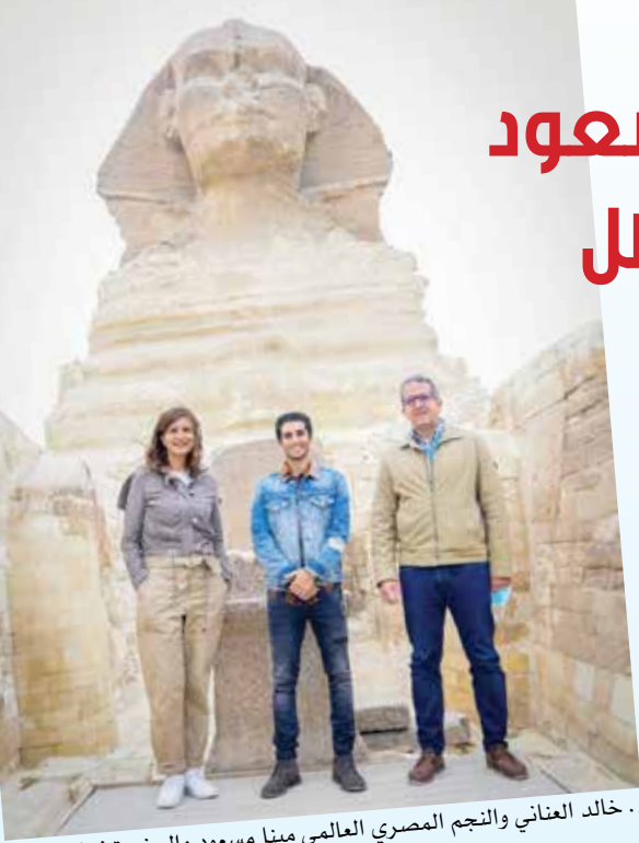
د. خالد العناني والنجم المصري العالمي مينا مسعود والسفيرة نبيلة مكرم

ورحبت السفيرة نبيلة مكرم وزيرة الدولة للهجرة وشؤون المصريين بالخارج بالنجم المصري مينا مسعود لزيارته مصر خلال تلك الفترة،