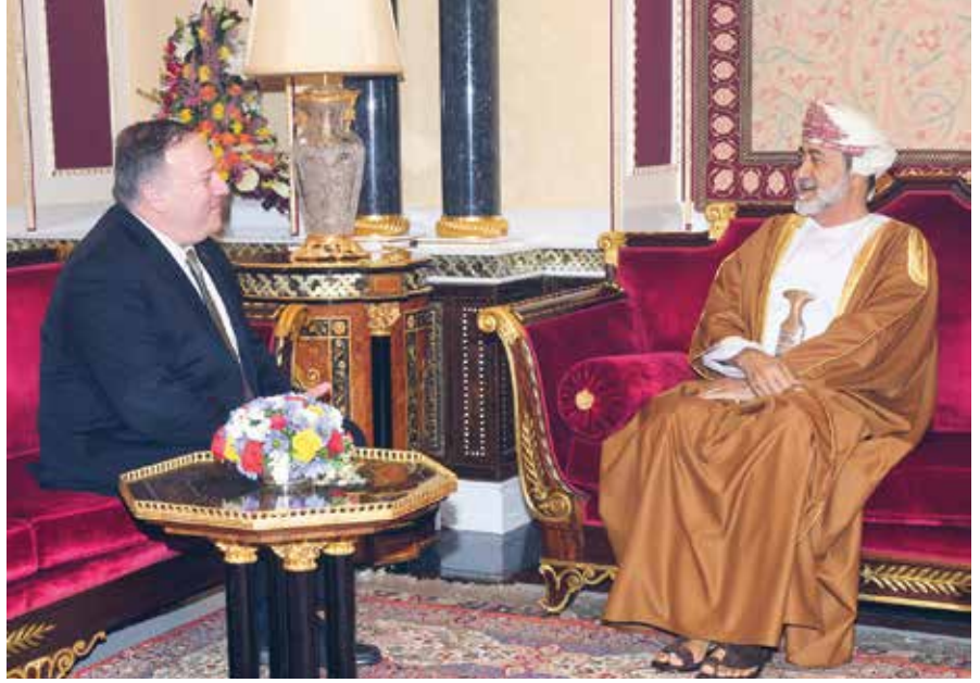
صاحب الجلالة السلطان هيثم بن طارق يستقبل وزير الخارجية الأمريكي السابق

إرساء بنية إدارية لامركزية لأداء الخدمي والتنموي في المحافظات.