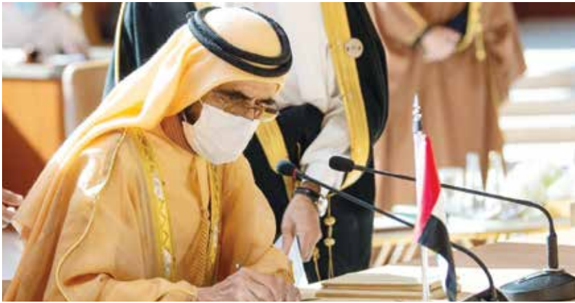
صاحب السمو الشيخ محمد بن راشد آل مكتوم

أكد صاحب السمو الشيخ محمد بن راشد آل مكتوم، نائب رئيس الدولة، رئيس مجلس الوزراء، حاكم دبي، رعاه الله، أن قمة العلاء إيجابية موحدة للصف، مشيداً بدور السعودية في رعايتها.