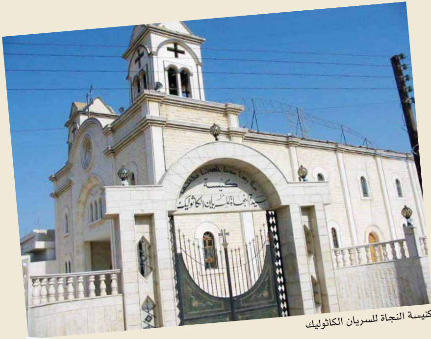
كنيسة النجاة للسريان الكاثوليك

الأثرية ويخطب من عليها خطاب السلام والتآخي بين كل الأديان ويزور بيت النبي إبراهيم وموطنه ومهد رسالته في مدينة أور.