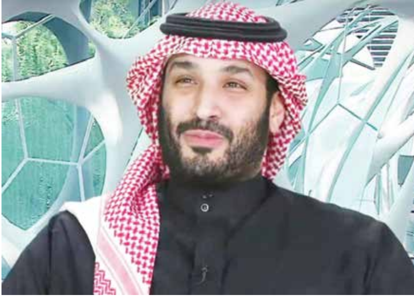
صاحب السمو الملكي الأمير محمد بن سلمان بن عبدالعزيز

كشف صاحب السمو الملكي الأمير محمد بن سلمان بن عبدالعزيز، ولي العهد نائب رئيس مجلس الوزراء وزير الدفاع السعودي، عن إطلاق استراتيجية مدينة الرياض، والعمل على استراتيجيات لمدينة أخرى، كما كشف عن طروحات جديدة لأسهم أرامكو خلال السنوات المقبلة كجزء من خطتها لتحويل الأموال لصندوق الاستثمارات العامة، ليعاد ضخه داخل وخارج المملكة لمصلحة المواطنين، لافتاً إلى العمل على رفع أصول صندوق الاستثمارات العامة إلى 4 تريليونات ريال عبر عدة مصادر، وأنها إعادة التقييم الدفترى لأصول المشاريع الكبرى مثل أمالا والبحر الأحمر والقدية فضلاً عن الطروحات العامة التي تحول عائداتها إلى الصندوق والنمو الطبيعي للأصول والأرباح.