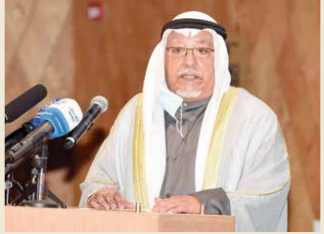
الشيخ علي الجراح يلقي كلمته