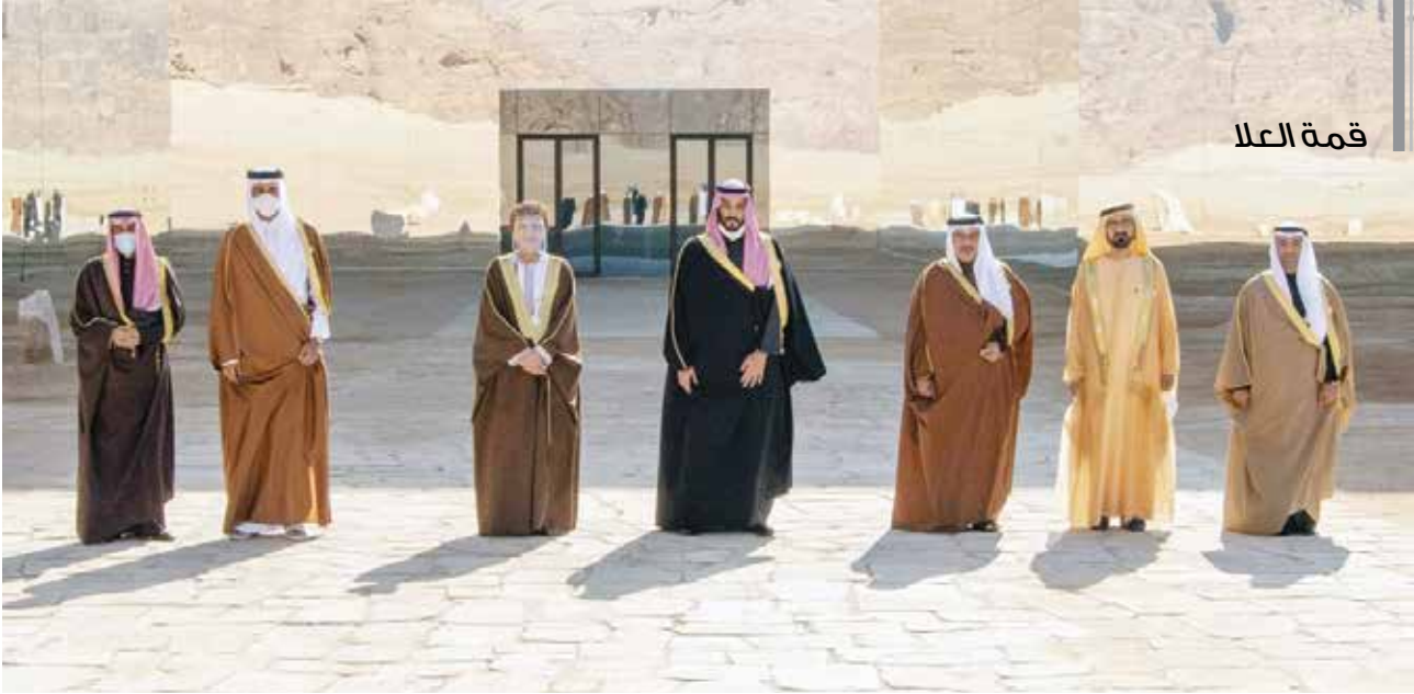
قادة ورؤساء وفود دول مجلس التعاون الخليجي والامين العام للمجلس في مدينة العلا السعودية

” نستذكر بالتقدير الجهود الخيرة لسمو الأمير الراحل الشيخ صباح الأحمد