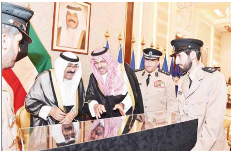
■ ممثل سمو الأمير سمو ولي العهد الشيخ مشعل الأحمد يتلقى هدية تذكارية من الفريق أول متقاعد الشيخ أحمد النواف