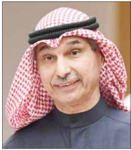
■ السفير مجدي الظفيري