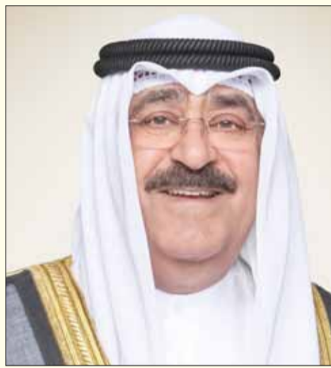
سمو ولي العهد الشيخ مشعل الأحمد الجابر الصباح

ثالثاً: الكويت دولة قانون تحترم الحقوق والحريات، وترفض التخلي عن نهجها الديموقراطي، حتى في أشد الظروف الإقليمية والدولية دقة وحساسية واضطراباً. لقد كرست كلمة صاحب السمو نهجاً استقر في حياتنا بالفعل، وبات يشكل تعاقداً بين الحاكم والمحكوم، وهو نهج المكاشفة والوضوح الذي هو بالتاكيد «حائط صد» ضد كل الشرور والأزمات والتحديات، وطوق نجاة نحصن به كويتنا ونعزز وحدتها الوطنية.