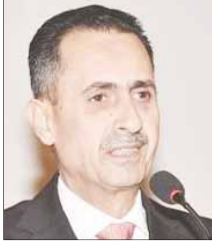
■ السفير الأردني صقر ابو شتال