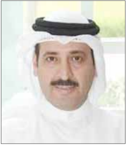
■ القنصل ذياب الرشيد