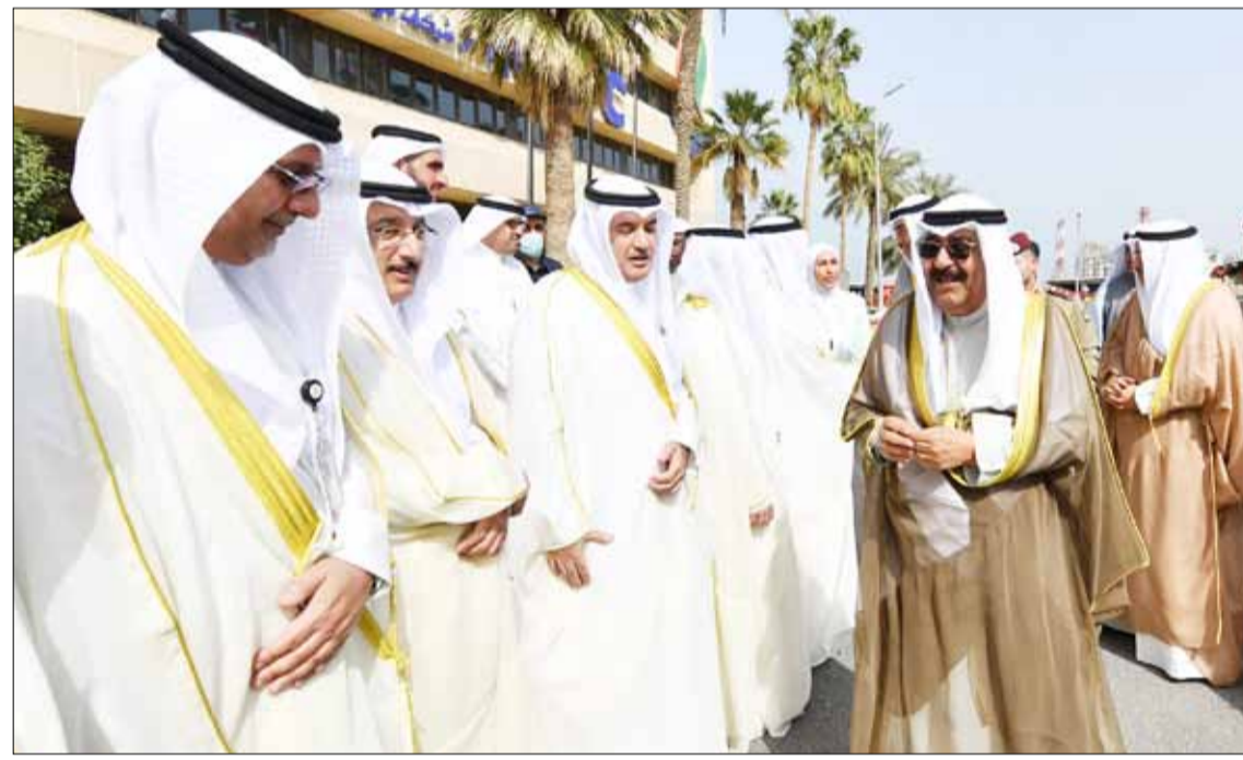
■ سمو ولي العهد الشيخ مشعل الأحمد محييا مسؤولي شركة البترول الوطنية الكويتية

المشروع، إيماناً منها بدور هذا القطاع، بحيث بلغت حصته نحو 1.1 مليار دينار من التكلفة الإجمالية للمشروع البالغة 4.680 مليارات دينار. وقال ان التصيب الأكبر من العقود لقطاع المقاولات الإنشائية، حيث التزم المقاولون العالميون المتعاقدون مع الشركة من جانبهم بترسية عقود الباطن مع شركات كويتية زادت قيمتها على 643 مليون ديناراً، كما تمت كذلك ترسية عقود مشتريات بقيمة زادت على 300 مليون دينار على مصنعين وموردين كويتيين.