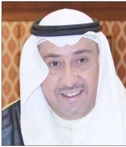
■ الشيخ فيصل الحمود