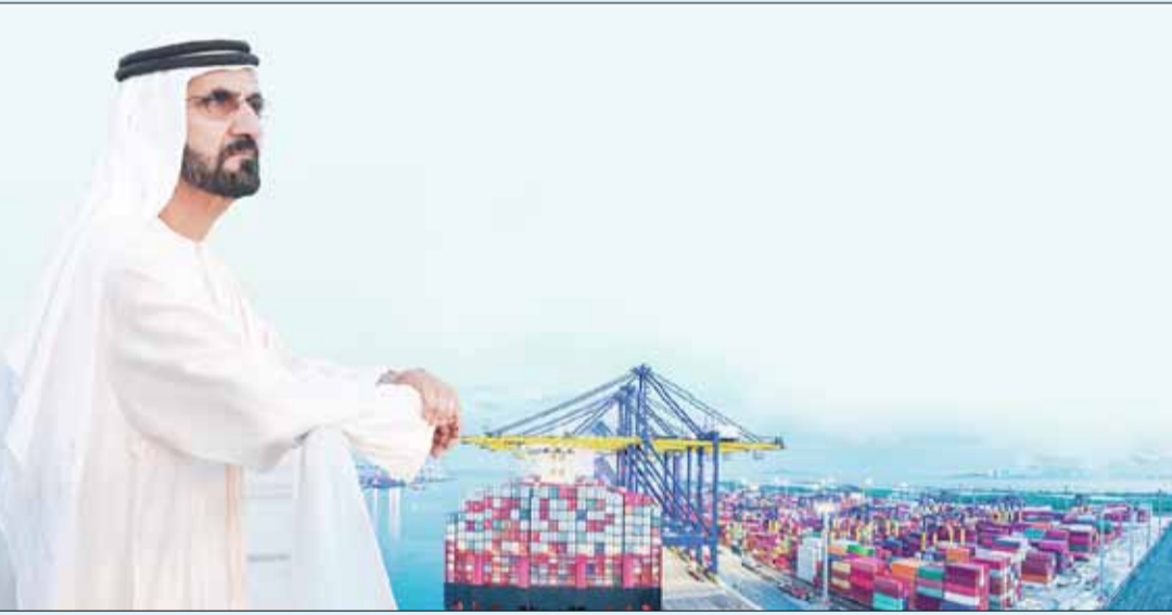
صاحب السمو الشيخ محمد بن راشد آل مكتوم