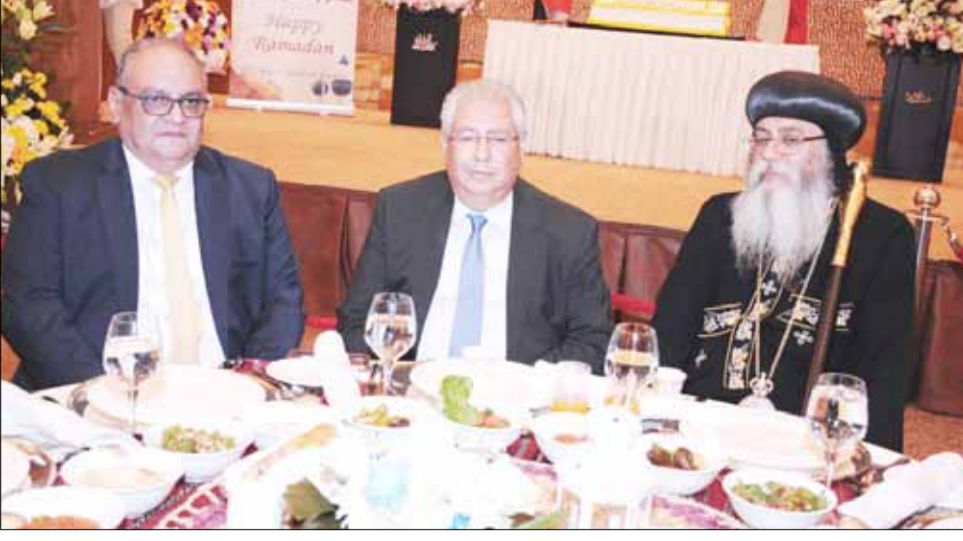
■ الأنا أنطونيوس والسفير المصري أسامة شلتوت والسفير هشام عسران