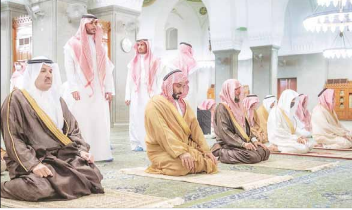
صاحب السمو الملكي الأمير محمد بن سلمان يؤدي ركعتي تحية المسجد