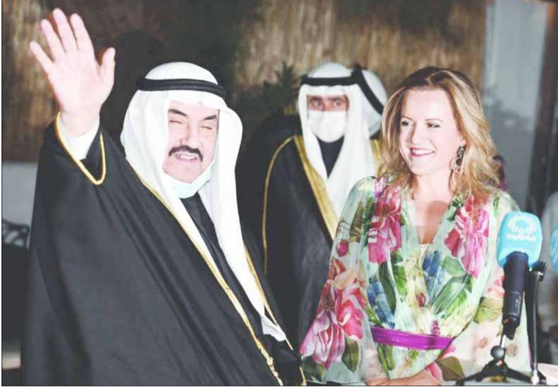
سمو الشيخ ناصر محمد يلقي كلمة ويحياها السفير الفرنسي في الكويت