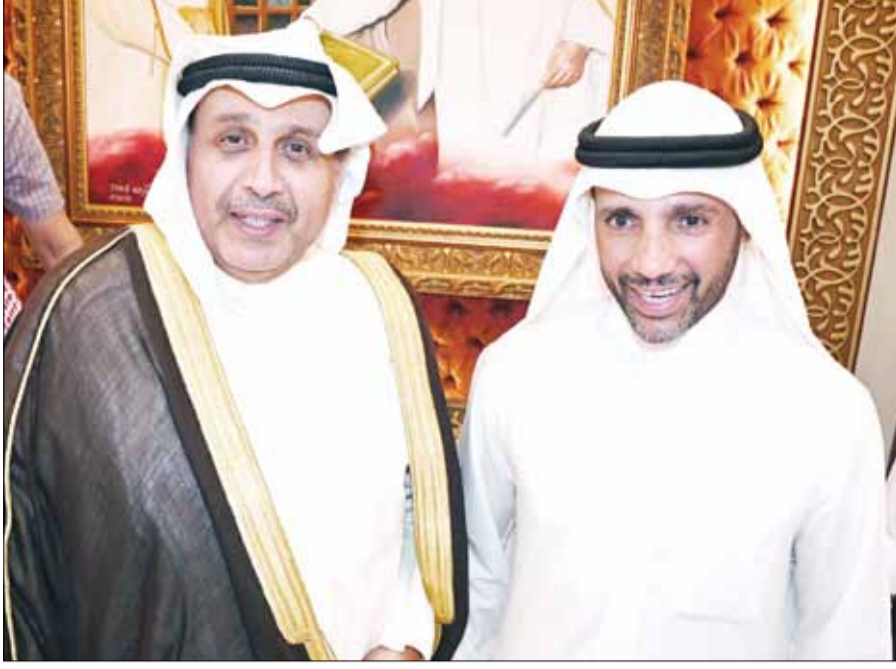
■ الشيخ حمد جابر العلي مهنتا مرزوق الغانم