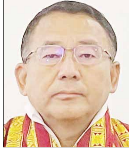
■ السفير شيتيم تنزن