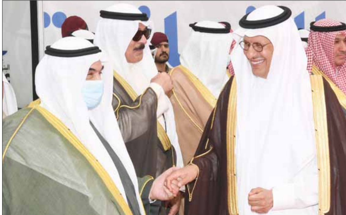
■ سمو الشيخ ناصر المحمد وصاحب السمو الملكي الأمير عبدالعزيز بن سلمان

وتابع سموه قائلا «على بركة الله، وبمباركة سيدي حضرة صاحب السمو أمير البلاد المفدى الشيخ نواف الأحمد وشعب الكويت الكريم الوفي، نطلق مشروع الوقود البيئي بتشغيله الكامل، مترجمين أولوياتنا، متسلحين بالإخلاص والوفاء لكويت جديدة، سلاحها «الجد والعمل والتعاون والتطلع، وشعارها «مستقبل أخضر» لأهم نعمة أنعمها الله على الإنسان في الأرض وأهم موارد الحياة، متضرعين إليه سبحانه وتعالى أن يتوج مساعي دولة الكويت قيادة