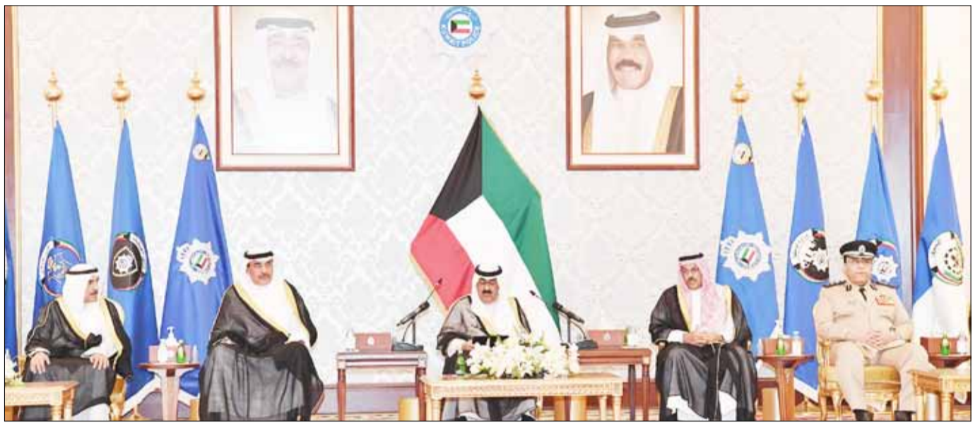
■ ممثل سمو الأمير سمو ولي العهد الشيخ مشعل الأحمد وسمو رئيس مجلس الوزراء الشيخ صباح الخالد والفريق أول متقاعد الشيخ أحمد النواف والشيخ مبارك الفيصل والفريق أنور البرجس

ألقى المقدم يوسف محمد العتيبي قصيدة شعرية لاقب استحسان الحضور وتم خلال هذه الزيارة إهداء ممثل حضرة صاحب السمو أمير البلاد حفظه الله ورعاه سمو ولي العهد حفظه الله هدية تذكارية بهذه المناسبة. وقد تفضل ممثل حضرة صاحب السمو أمير البلاد حفظه الله ورعاه سمو ولي العهد بالتوقيع على سجل الشرف.