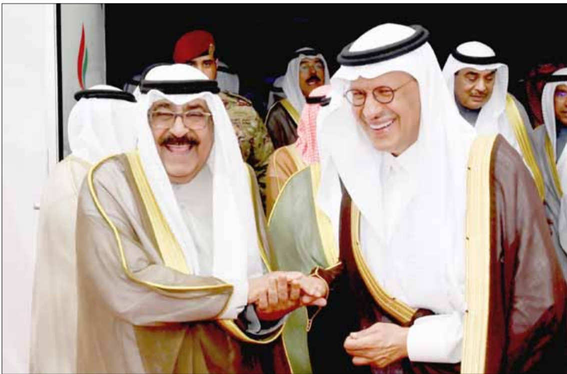
■ سمو ولي العهد الشيخ مشعل الأحمد وصاحب السمو الملكي الأمير عبدالعزيز بن سلمان