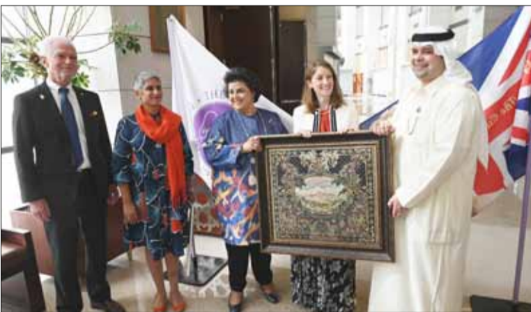
السفيرة البريطانية بيلندا لويس والشيخة هالة البدر والسفيرة الكندية عليا مواني والسفير الألماني ستيفان موبس وعيسى دشتي