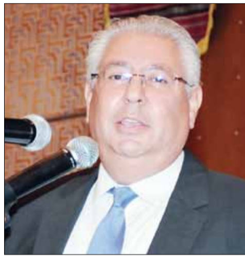
■ السفير المصري أسامة شلتوت يلقي كلمته