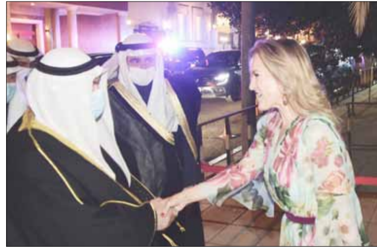
سمو الشيخ ناصر محمد مصافحا السفير الفرنسي في الكويت