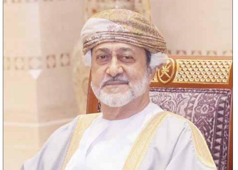
■ السلطان هيثم بن طارق