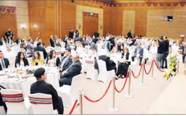
■ حضور غفير في غبطة الكنيسة المصرية