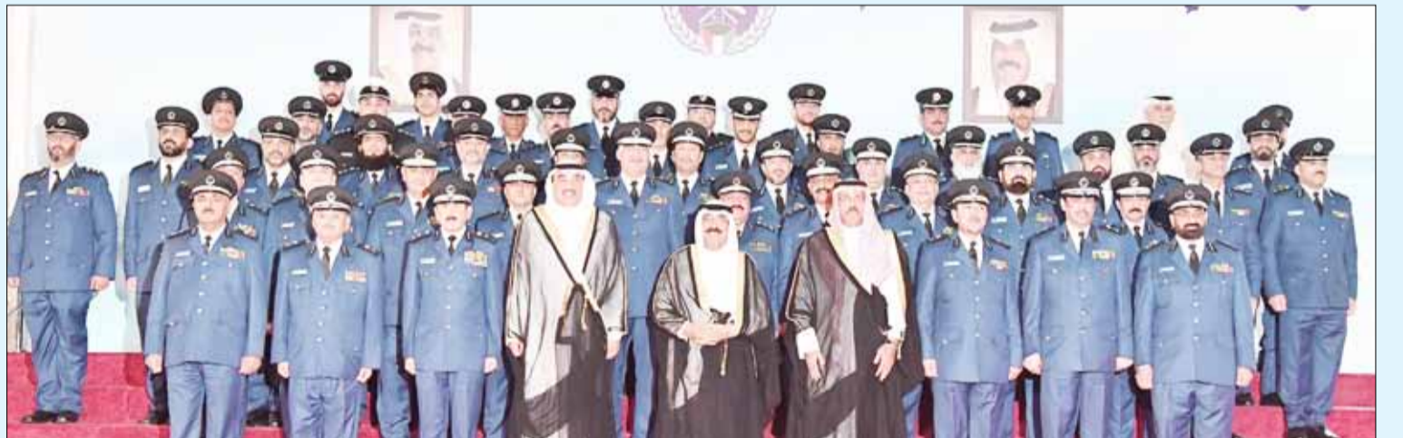
■ ممثل سمو الأمير سمو ولي العهد الشيخ مشعل الأحمد وسمو رئيس مجلس الوزراء الشيخ صباح الخالد والفريق اول متقاعد الشيخ أحمد النواف والشيخ طلال الخالد