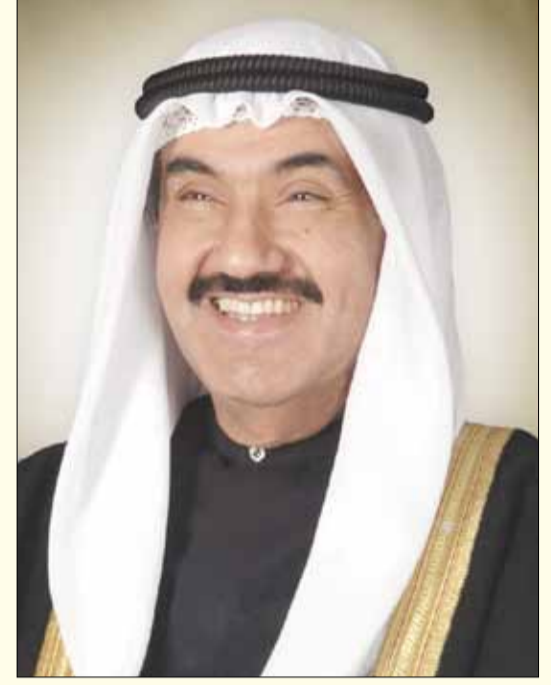
■ سمو الشيخ ناصر المحمد أحمد الصباح

ورعاه) وسدد بالتوفيق على دروب الخير خطاه. مع أطيب التمنيات، ويبحث سمو الشيخ ناصر المحمد أحمد الصباح برسالة تهنئة إلى رئيس التحرير أحمد إسماعيل بهبهاني، بمناسبة مناسبة العيد الثالث عشر لـ «الخليج» جاء فيها: يسرنا أن نبعث لكم بخالص التهاني وأطيب التمنيات بمناسبة حلول الذكرى الثالثة عشر لصدور العدد الأول من «الخليج».