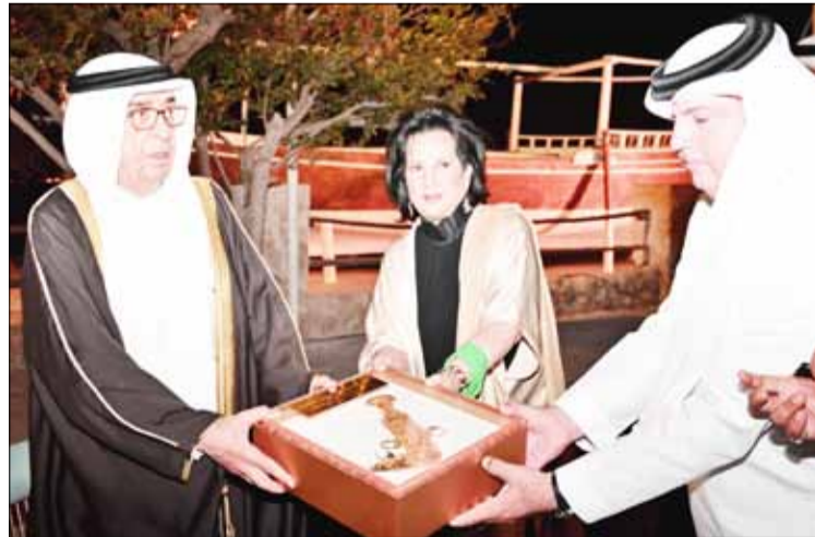
سمو الشيخ محمد بن مبارك آل خليفة يتلقى هدية تذكارية من الشقيقة مي بنت محمد آل خليفة