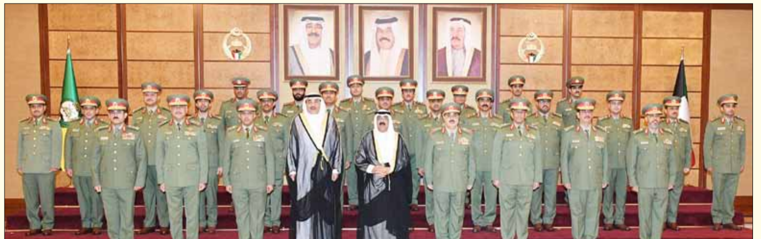
■ ممثل سمو الأمير سمو ولي العهد الشيخ مشعل الأحمد وسمو رئيس مجلس الوزراء الشيخ صباح الخالد والفريق الركن م. هاشم الرفاعي وكبار قيادات الحرس الوطني

نتيجة للتخطيط والاستعداد المسبق لذا استحق الحرس الوطني ومنتسبوه منا التقدير والإشادة. كما تؤكد أنه ما زالت هناك تحديات أمام الحرس الوطني أهمها حاجته إلى استقطاب الطاقات البشرية من الشباب الكويتي وذلك لاستكمال قدراته العسكرية والأمنية ولتحقيق التوازن بين الحماية والإسناد. وختاماً .. فإننا ندعو الله تعالى أن يحفظ وطننا الحبيب وأن يديم عليه الرخاء والازدهار في ظل القيادة الحكيمة لسيدتي حضرة صاحب السمو أمير البلاد المفدى القائد الأعلى للقوات المسلحة (حفظه الله ورعاه) وسدد بالتوفيق على دروب الخير خطاه، والسلام عليكم ورحمة الله وبركاته».