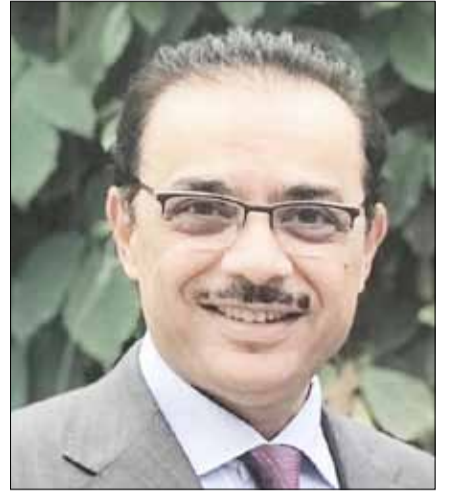
السفير بدر التيب