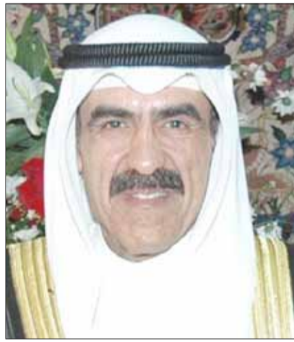
■ الشيخ مبارك الفيصل