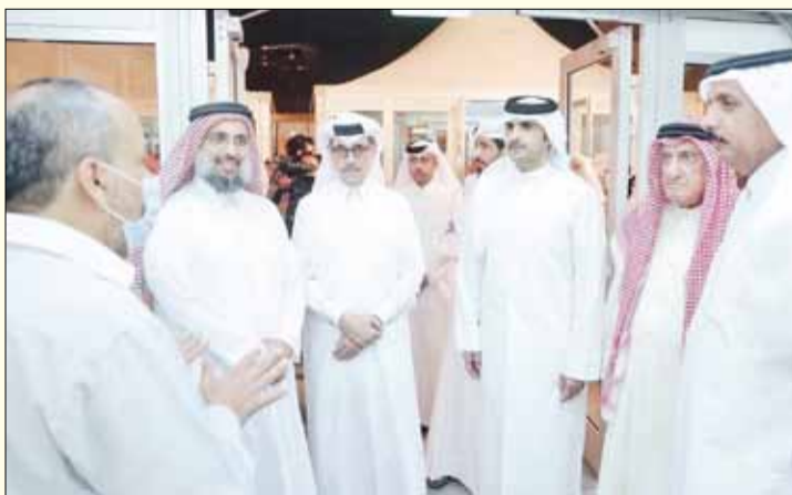
■ وزير الثقافة القطري الشيخ عبد الرحمن بن حمد آل ثاني وحديث مع أحد المشاركين