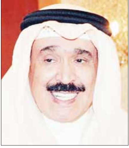
■ العميد أحمد الجارالله