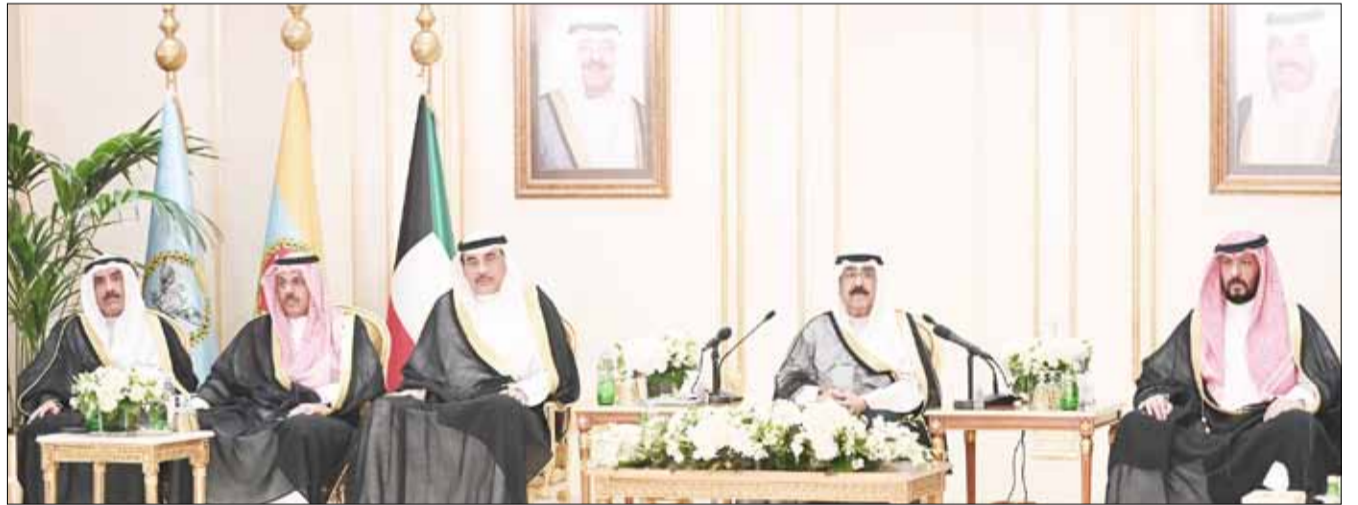
■ الشيخ أحمد العبد الله والشيخ محمد العبد الله والسفير أحمد الفهد والفريق متقاعد جمال الذياب