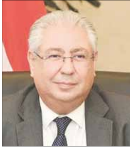
السفير المصري أسامة شلتوت