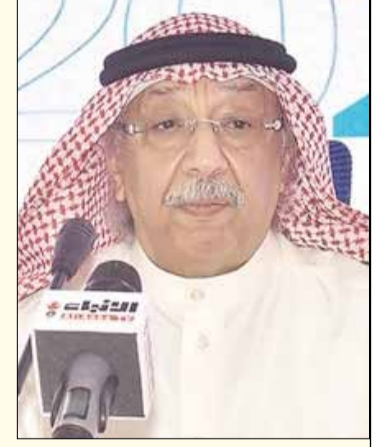
الشيخ محمد الجراح