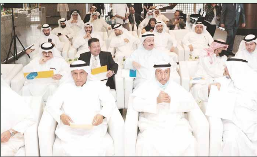
كبار المساهمين في مقدمة الحضور خلال الجمعية العمومية