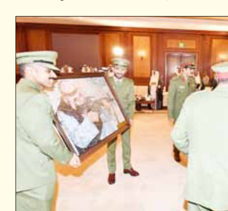
■ ممثل سمو الأمير سمو ولي العهد الشيخ مشعل الأحمد يتلقى هدية تذكارية بحضور سمو رئيس مجلس الوزراء الشيخ صباح الخالد من الفريق الركن م. هاشم الرفاعي

الدولة وفقاً ل3 خطط استراتيجية انتقلت فيها الحرس الوطني بالتزام ووفاء من اهتمامه ب(الأمن أساس التنمية) إلى (الأمن أولاً) وصولاً إلى أن يكون لمؤسسات الدولة (حماية وسند). وإننا لنقدر للحرس الوطني تسخير كافة إمكاناته البشرية والمادية لدعم وإسناد أجهزة الدولة ولعل ما قدمه منتسبو الحرس الوطني أثناء جائحة كورونا خير شاهد على بصمته الحقيقية في التعامل مع الأزمات من خلال إنشاء مستشفيات ميدانيين وفتح مركز لتطعيم إضافة إلى دوره التوعوي وجاء ذلك