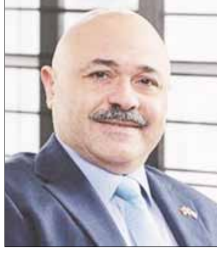
■ القنصل مشعل الشمالي