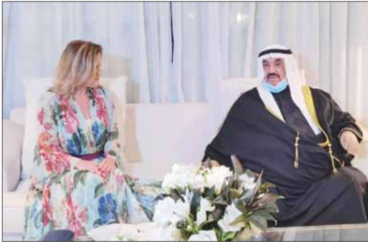
سمو الشيخ ناصر محمد وحديث مع السفارة الفرنسية في الكويت

من هذا المنطلق، منذ عامين، نحتفل باليوم العالمي لمعلمي اللغة الفرنسية في الكويت، والذي تم الاحتفال به هنا في 24 نوفمبر. وأوضح: فرنسا ليست وحدها، في دعم الفرانكوفونية، كما يتضح من مجلس تعزيز الفرانكوفونية في الكويت، والذي جمع منذ العام الماضي 44 سفيرا من الناطقين بالفرنسية في الكويت. إنهم كثيرون جدا هذا المساء وأود أن أشكرهم مرة أخرى: لقد أنشأنا معا هذا العام برنامجا لشهر الفرانكوفونية، غنيا ومكثفا. شكرا لكم!