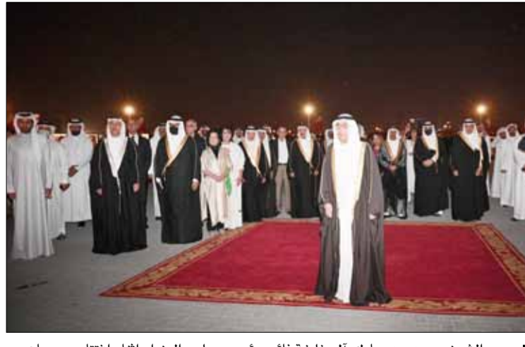
سمو الشيخ محمد بن مبارك آل خليفة نائب رئيس مجلس الوزراء أثناء افتتاح مهرجان البحرين السنوي للتراث 28 بعنوان «تراثا ذهبي»

ويشتمل مهرجان البحرين السنوي للتراث على عدة أقسام: الحرف والصناعات اليدوية أما القسم الآخر فيتضمن ورش تعليمية وأنشطة مسلية مختصة بفئة الأطفال والناشئة من عمر 6 حتى 15 سنة، وتستعرض القرية التراثية طوال فترة إقامة المهرجان التنوع الغذائي للمطبخ البحريني عبر تقديم الأطباق الشعبية والمشروبات المحلية، كما ويحتوي سوق القرية على مشاركة محلات الذهب البحريني التي تعرض تصاميمها المستوحاة من التراث البحريني للبيع والشراء، وتشارك الفرق الموسيقية الشعبية البحرينية في المهرجان بتقديم الفنون الغنائية التقليدية. وأوضحت تميز الشعوب بتاريخها وتراثها، الأمر الذي يبرز المسؤولية الوطنية في المحافظة على التراث البحريني وضمان إيصاله للأجيال القادمة، فمملكة البحرين تتميز بالحرف العريقة والتاريخ الذي يجب الاهتمام به عبر تعاقب الأجيال، ويجهود تضمن عدم ضياع الهوية وسط تحديات العولمة. وتتمحور الفكرة الرئيسية للمهرجان هذا العام حول عنصر الذهب في التراث البحريني، حيث يسلط المهرجان الضوء على القيمة التراثية للذهب وما يمثله من قيم الجاه والجمال إضافة إلى دوره التاريخي في التجارة والاستثمار.