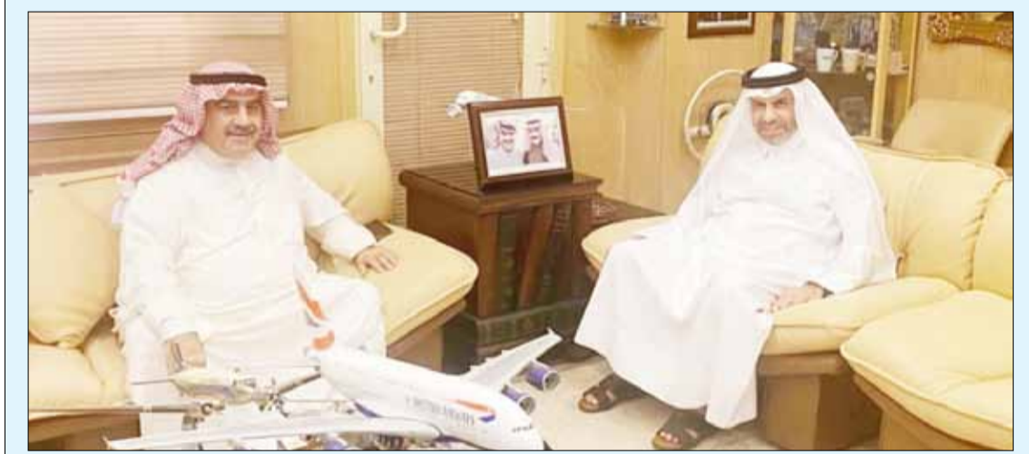
السفير القطري علي بن عبد الله آل محمود وأحمد اسماعيل بهبهاني

استقبل الدكتور محمد معيط، وزير المالية في جمهورية مصر العربية، بمكتبه في القاهرة، أحمد اسماعيل بهبهاني رئيس اللجنة المنظمة لمعرض الكويت للطيران، ورئيس تحرير "الخليج" الكويتية بمناسبة زيارته إلى جمهورية مصر العربية. تناول اللقاء العلاقات المصرية الكويتية التاريخية الراسخة، وما يجمع الدولتين الشقيقتين من روابط أخوية وعلاقات تعاون متشعبة على جميع الأصعدة، وعددا من الموضوعات ذات الاهتمام المشترك. وفي نهاية اللقاء تقدم بهبهاني بالشكر لوزير المالية المصري على حفاوة الاستقبال، متمنيا له دوام الصحة والعافية ولجمهورية مصر العربية الشقيقة كل التقدم والازدهار.