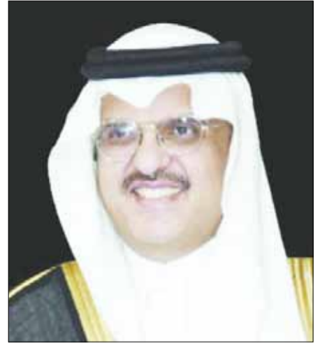
سمو الأمير سلطان بن سعد بن خالد آل سعود