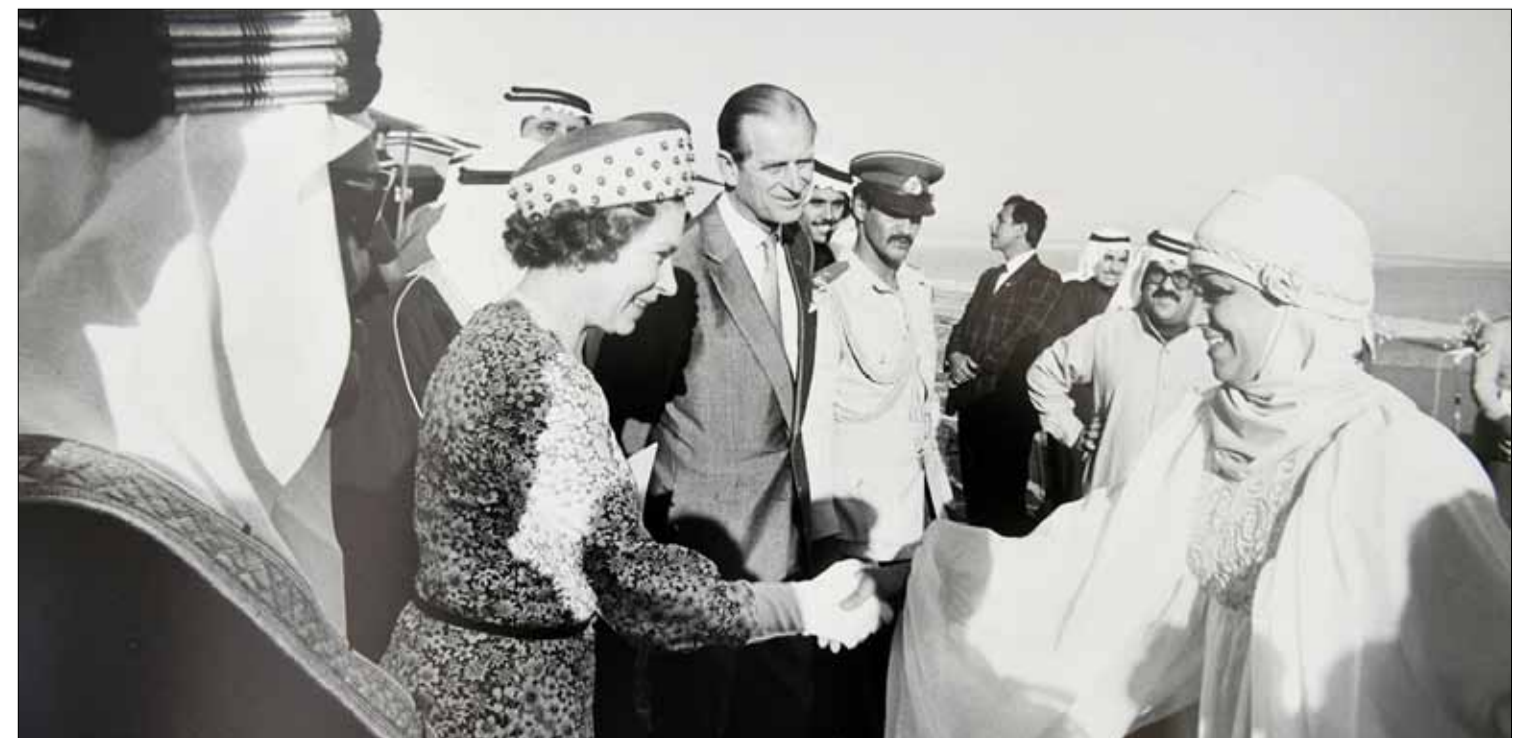
الملكة إليزابيث الثانية وزوجها الأمير فيليب في الكويت