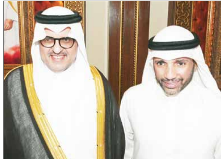
■ سفير خادم الحرمين الشريفين سمو الأمير سلطان بن سعد آل سعود مهنتا مرزوق الغانم