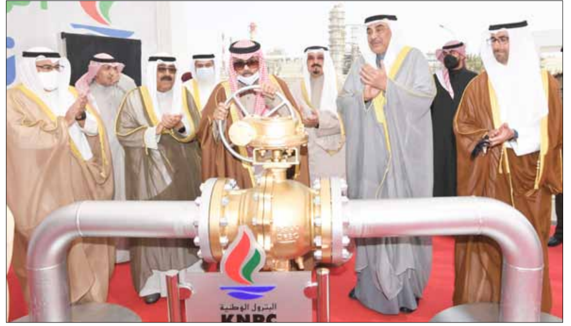
■ سمو الأمير الشيخ نواف الأحمد يطلق مشروع الوقود البيئي بحضور سمو ولي العهد الشيخ مشعل الأحمد وسمو رئيس الوزراء الشيخ صباح الخالد ود. محمد الفارس والشيخ نواف سعود الناصر الصباح