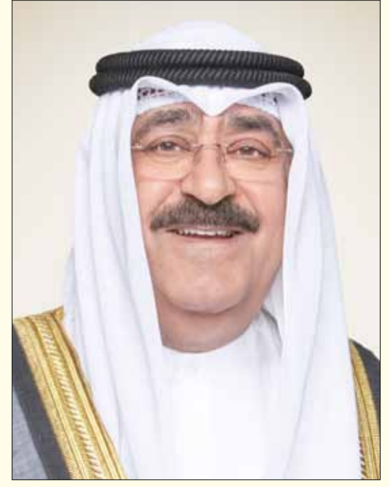
■ سمو ولي العهد الشيخ مشعل أحمد الجابر الصباح