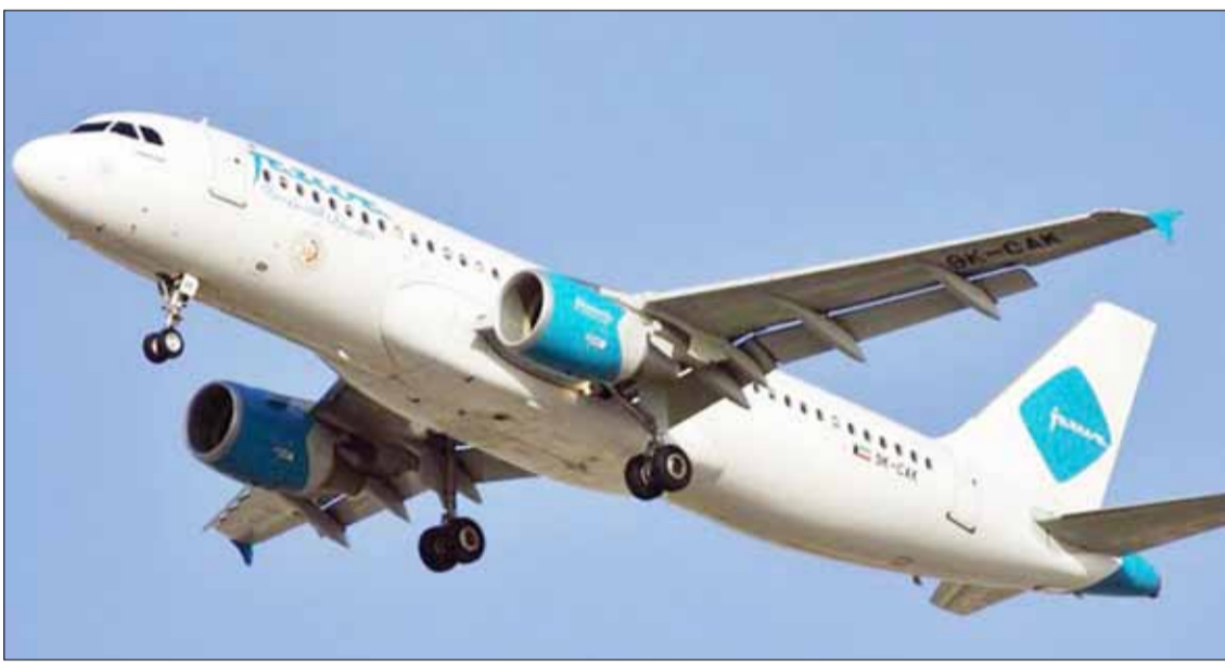
طائرة طيران الجزيرة

«طيران الجزيرة» نموذج يُحتذى به في الطيران.. إقليمياً وعالمياً