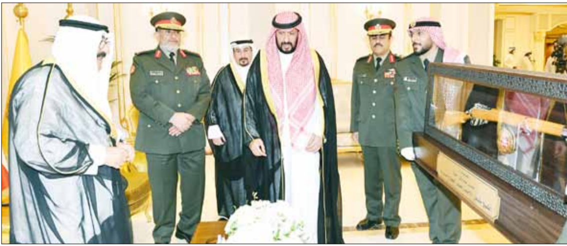
■ ممثل سمو الأمير سمو ولي العهد الشيخ مشعل الأحمد يتلقى هدية تذكارية من الشيخ طلال الخالد

ولي العهد حفظه الله بالتوقيع على سجل هذا وقد رافق ممثل حضرة صاحب السمو أمير البلاد حفظه الله ورعاه وسدد بالتوقيع على دروب الخير خطاه. كما ألقى رئيس الأركان العامة للجيش الفريق الركن خالد صالح الصباح كلمة بهذه المناسبة، وبعدها ألقى النقيب ضاريا مشعل البوقان قصيدة شعرية لاقت استحسان الحضور. وتم خلال هذه الزيارة إهداء ممثل حضرة صاحب السمو أمير البلاد، سمو ولي العهد حفظه الله هدية تذكارية بهذه المناسبة. وقد تفضل ممثل حضرة صاحب السمو، سمو