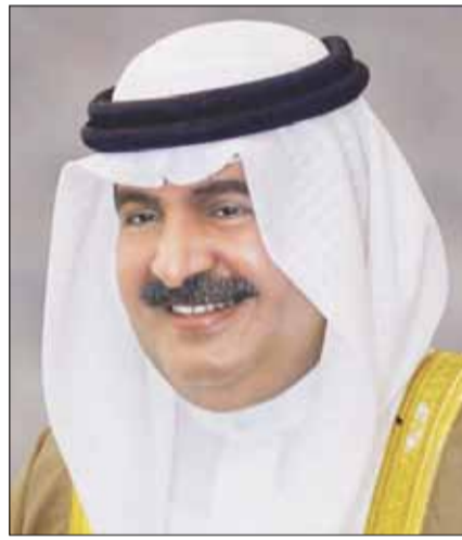
■ سمو الشيخ علي بن خليفة آل خليفة

علي بن خليفة: د. حمد روح الدين: مبارك الفيصل: فيصل الحمود: السفير الظفيري: تمنياتنا لـ «الخليج» نثمن جهودها متمنين مواصلة دورها الثقافي والأعلامي متمنين في عيدها الـ 13 بالتقدم والازدهار