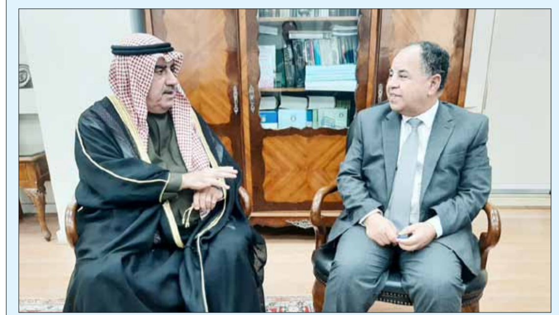
د. محمد معيط وحديث مع أحمد اسماعيل بهبهاني

استقبلت السفيرة نبيلة مكرم وزيرة الدولة للهجرة وشؤون المصريين بالخارج بمكتبها في القاهرة، أحمد اسماعيل بهبهاني رئيس اللجنة المنظمة لمعرض الكويت للطيران، ورئيس تحرير "الخليج" الكويتية بمناسبة زيارته إلى جمهورية مصر العربية. تناول اللقاء العلاقات المصرية الكويتية الراسخة وما تتميز به من تقاهم واتفاق لمعظم القضايا المطروحة على الساحتين الإقليمية والدولية، وعددا من الموضوعات ذات الاهتمام المشترك. وفي نهاية اللقاء تقدم بهبهاني بالشكر لوزيرة الدولة للهجرة وشؤون المصريين بالخارج على حفاوة الاستقبال، متمنيا لها دوام الصحة والعافية ولجمهورية مصر العربية المزيد من التقدم والازدهار.