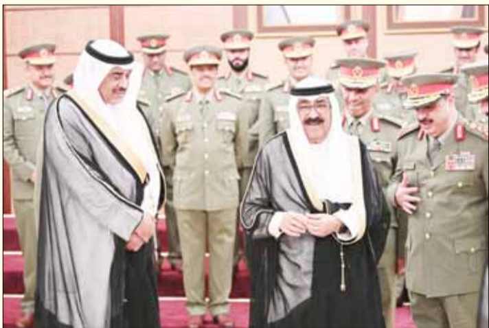
■ ممثل سمو الأمير سمو ولي العهد الشيخ مشعل الأحمد وسمو رئيس مجلس الوزراء الشيخ صباح الخالد والفريق الركن م. هاشم الرفاعي