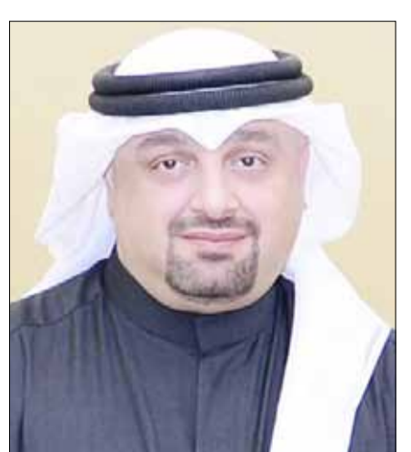
جمال النصر الله