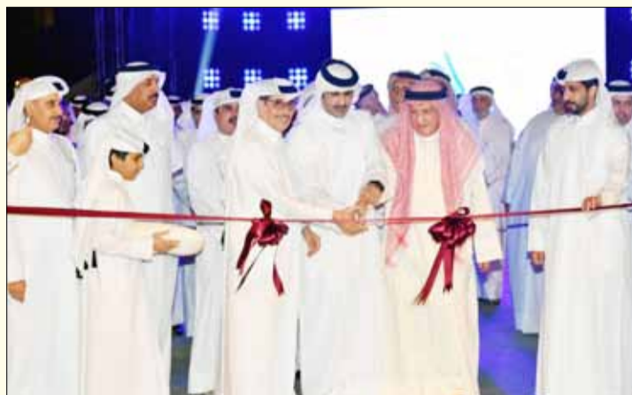
■ وزير الثقافة القطري الشيخ عبد الرحمن بن حمد آل ثاني يفتتح معرض رمضان للكتاب في سوق واقف

عام، منوها بأن اختيار سوق واقف لإقامة المعرض كان الهدف منه الوصول إلى شريحة أكبر من الجمهور باعتبار أن السوق يستقبل أعداداً كبيرة من الزوار بشكل يومي والوصول بالكتاب إلى القارئ في مكانه.