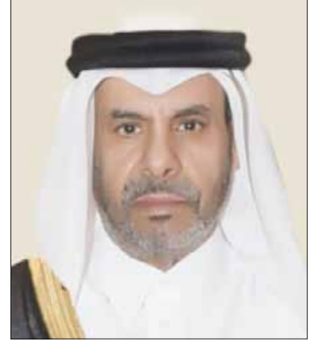
■ السفير القطري علي بن عبد الله آل محمود

العميد الجارالله: رؤية ثابتة وخط متوازن في الطرح والتزام بالثوابت المهنية