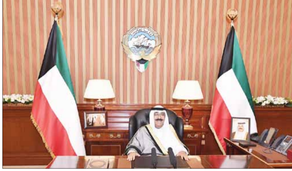
سمو ولي العهد الشيخ مشعل الأحمد الجابر الصباح يلقي كلمة سمو أمير البلاد بمناسبة العشر الأواخر من شهر رمضان المبارك

الكويت تتطلع دائماً إلى مزيد من النهضة والتقدم قائمة بدورها الخليجي والدولي مع الأشقاء والأصدقاء