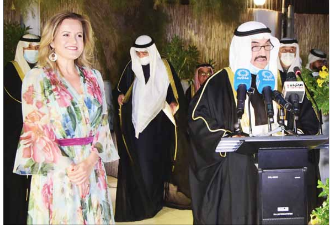
سمو الشيخ ناصر محمد يلقي كلمة ويحياها السفير الفرنسي في الكويت