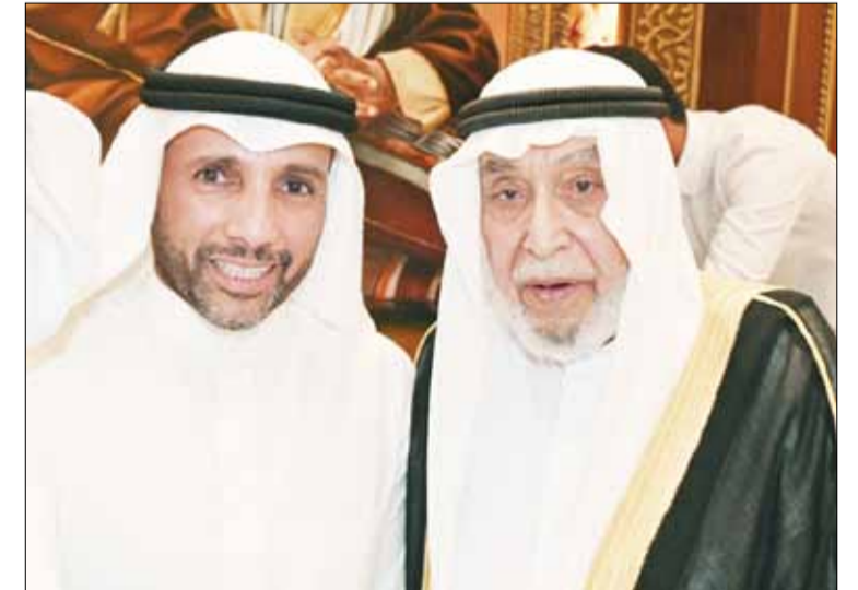
■ د. خالد المذكور مهنتا مرزوق الغانم