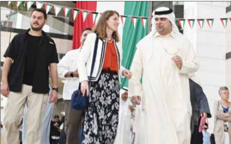
السفيرة البريطانية بيلندا لويس وعيسى دشتي