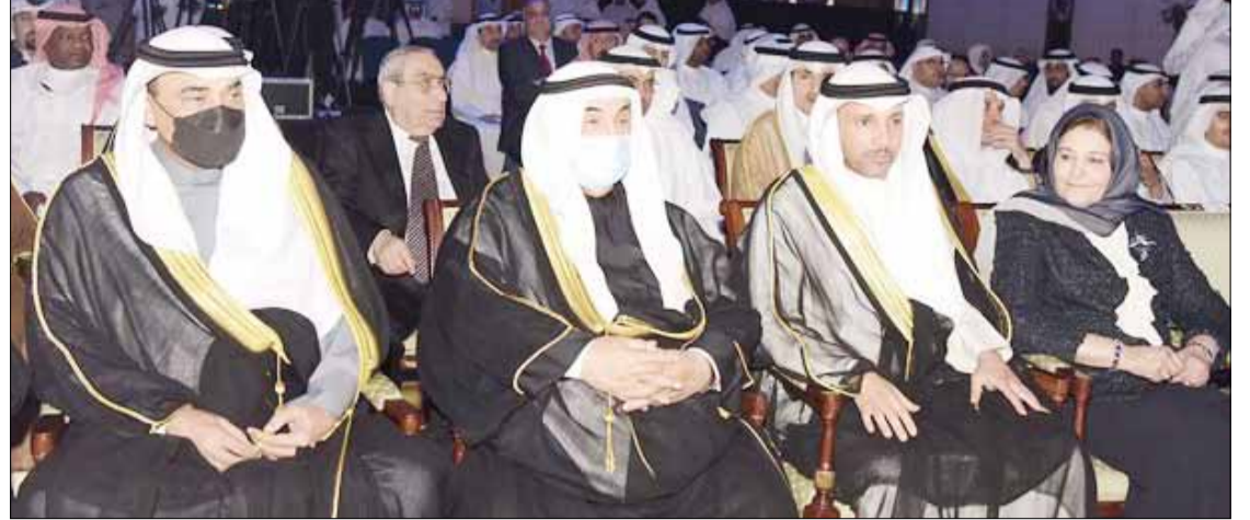
■ مرزوق الغانم وسمو الشيخ ناصر المحمد يتوسطان سمو الشيخ صباح الخالد ود. فايزة الخرافي