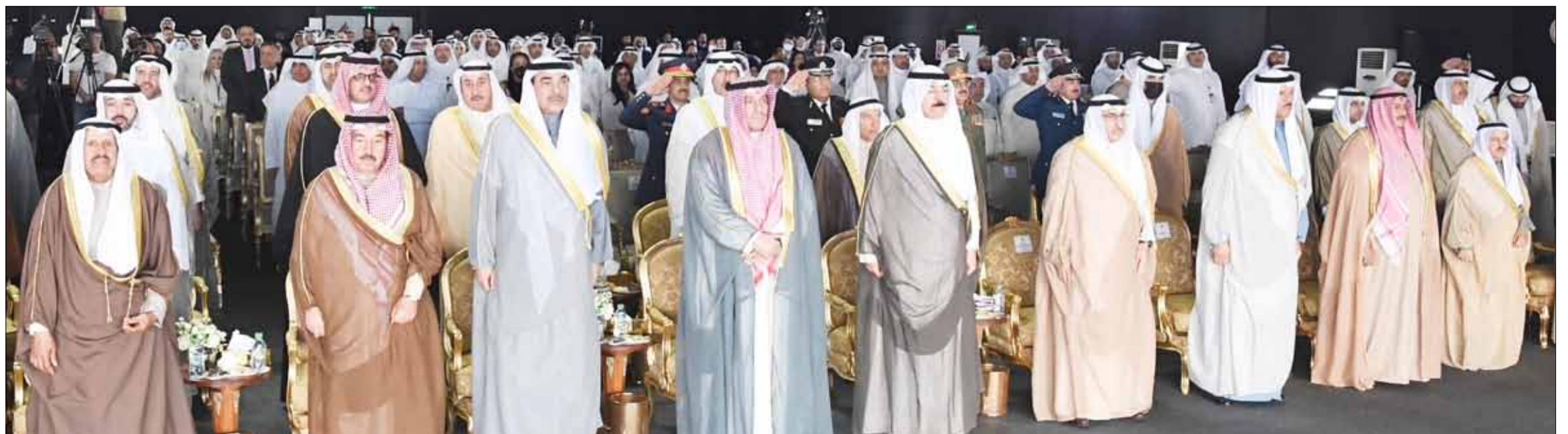
■ سمو الشيخ صباح الخالد ورئيس مجلس الأمة بالإنيابة أحمد الشحومي وصاحب السمو الملكي الأمير عبدالعزيز بن سلمان والشيخ د. سالم الجابر والشيخ محمد الخالد د. محمد الفارس والشيخ سلمان الحمد والشيخ فهد السعد والمستشار محمد شرار