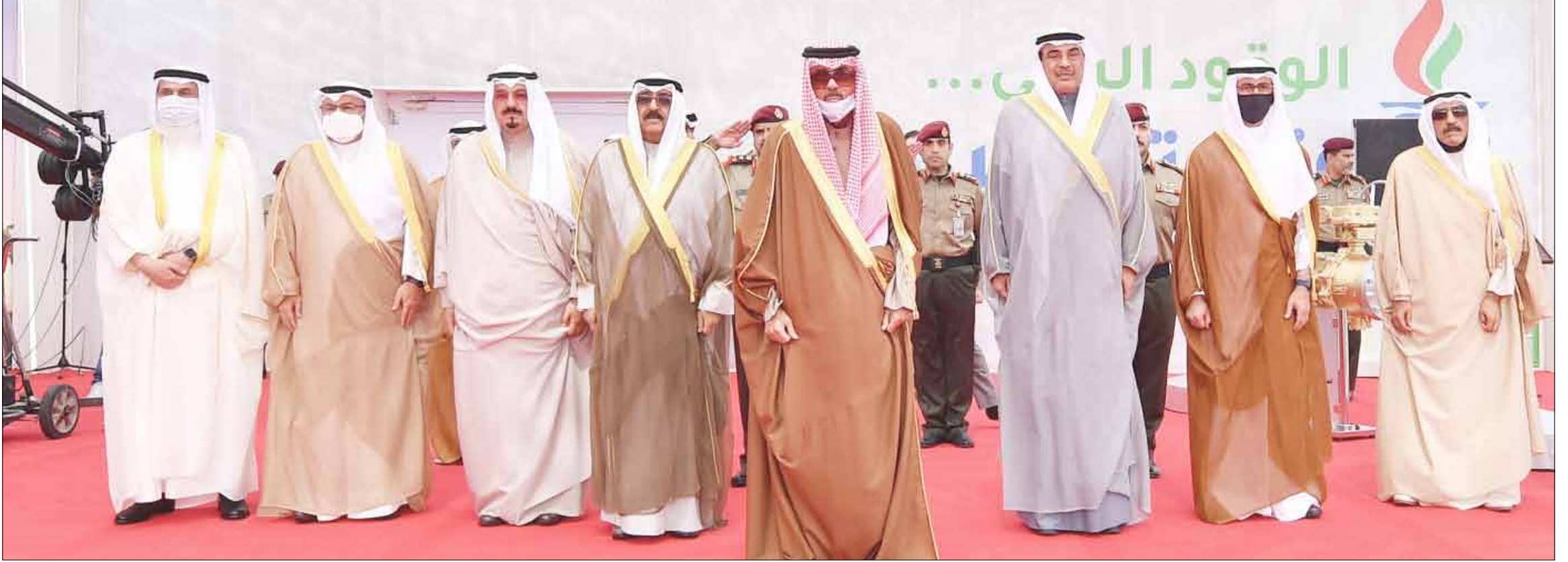
■ سمو الأمير الشيخ نواف الأحمد وسمو ولي العهد الشيخ مشعل الأحمد وسمو الشيخ صباح الخالد والشيخ أحمد العبد الله ود. محمد الفارس والشيخ نواف سعود الناصر والشيخ مبارك الفيصل وم. وليد البدر