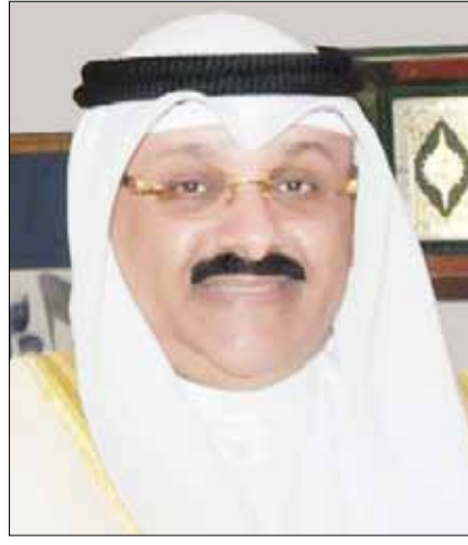
السفير سميح جوهر حيات