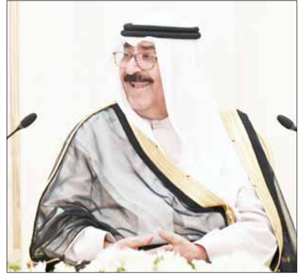
■ ممثل سمو الأمير سمو ولي العهد الشيخ مشعل الأحمد وسمو رئيس الوزراء الشيخ صباح الخالد والشيخ طلال الخالد والفريق الركن الشيخ خالد الصالح الصباح والشيخ فهد جابر العلي وكبار القادة