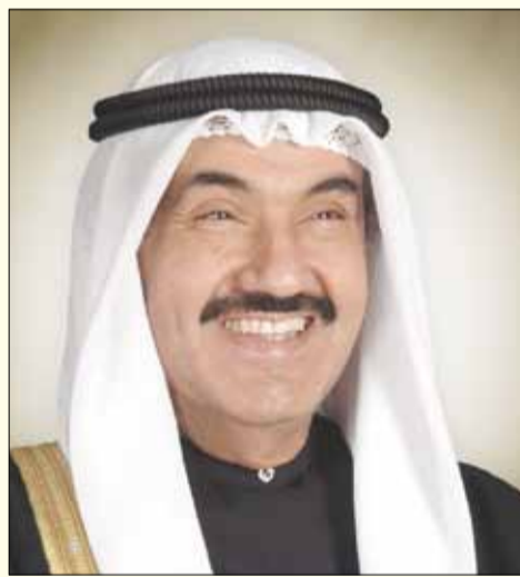
سمو الشيخ ناصر المحمد الأحمد الصباح