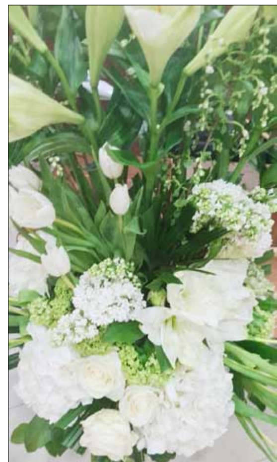
■ باقة ورد مهداة من وزير الإعلام والثقافة د. حمد روح الدين

علي بن خليفة: د. حمد روح الدين: مبارك الفيصل: فيصل الحمود: السفير الظفيري: تمنياتنا لـ «الخليج» نثمن جهودها متمنين مواصلة دورها الثقافي والأعلامي متمنين في عيدها الـ 13 بالتقدم والازدهار