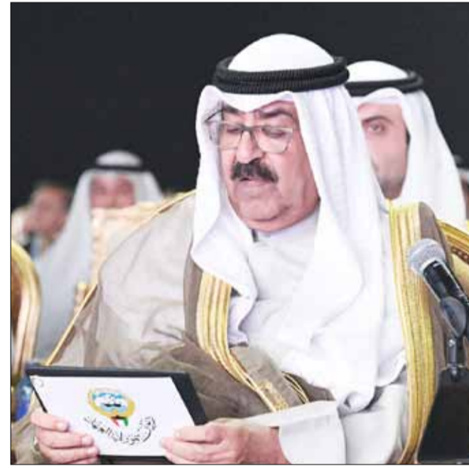
■ سمو ولي العهد الشيخ مشعل الأحمد يلقي كلمته خلال الحفل

وحكومة وشعبا إلى ما فيه خيرها وخير العالم أجمع».