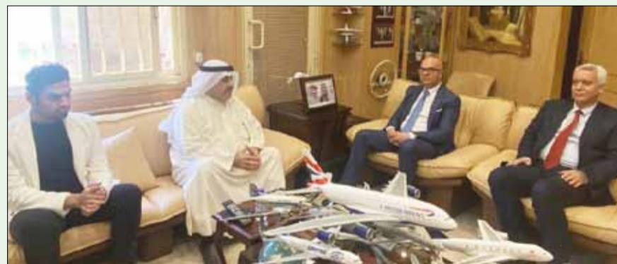
■ السفير التونسي الهاشمي عجيلي وأحمد إسماعيل بهبھاني والمستشار عبدالله عميدي وجابر بهبھاني

استقبل أحمد إسماعيل بهبھاني رئيس اللجنة المنظمة لمعرض الكويت للطيران ورئيس تحرير "الخليج" الكويتية بمكتبه السفير الهاشمي عجيلي سفير الجمهورية التونسية لدى الكويت والمستشار عبد الله عميدي نائب السفير بحضور جابر بهبھاني. تناول اللقاء العلاقات الكويتية التونسية المتميزة، وتبادل الأحاديث، لا سيما ما يتعلق بالقضايا الإعلامية ذات الاهتمام المشترك، وعن معرض الكويت للطيران 2024. وفي نهاية اللقاء تقدم بهبھاني بالشكر إلى السفير الهاشمي عجيلي على الزيارة متمنيا له دوام الصحة والعافية وللجمهورية التونسية كل التقدم والازدهار.