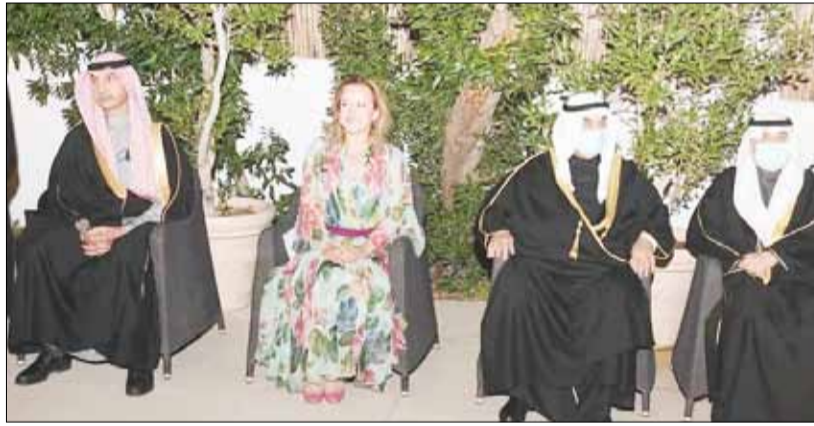
سمو الشيخ ناصر محمد والسفير مجدي الخلفيري والسفيرة الفرنسية في الكويت

لفرنسا والفرنسية، خاصة بفضل عملكم جميعا وقبل كل شيء، عمل سمو الشيخ ناصر محمد، الذي يشرفنا بحضوره بيننا هذا المساء، وهو والد الفرانكوفونية في الكويت، الذي بدأ أول الإجراءات لصالحها، منذ الثمانينيات، ولهذا السبب اختاره بالإجماع مجلس تعزيز الفرانكوفونية في الكويت رئيسا شرفيا. وأيضا، أولا وقبل كل شيء، أود أن أشكره على استنائه الثابت في خدمة الفرانكوفونية، موضحة أن كلمة سموه خلال الحفل أكدت التزامه بالفرانكوفونية.