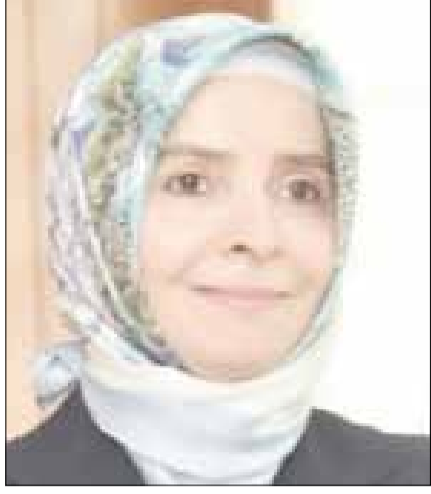
■ السفيرة التركية عائشة هلال سايان كويتاك