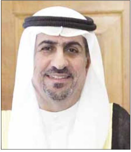
السفير وليد الكندري