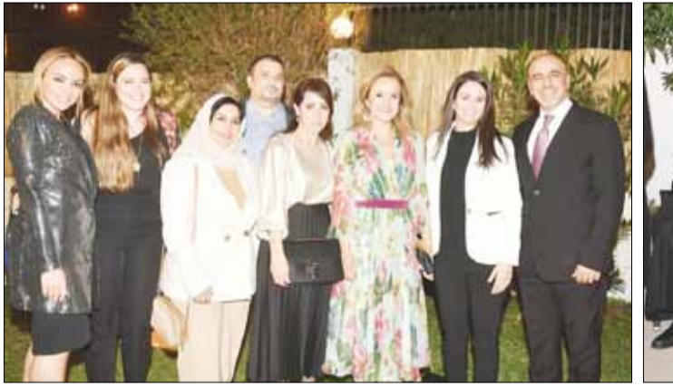
السفيرة الفرنسية في الكويت مع وفد من الحضور