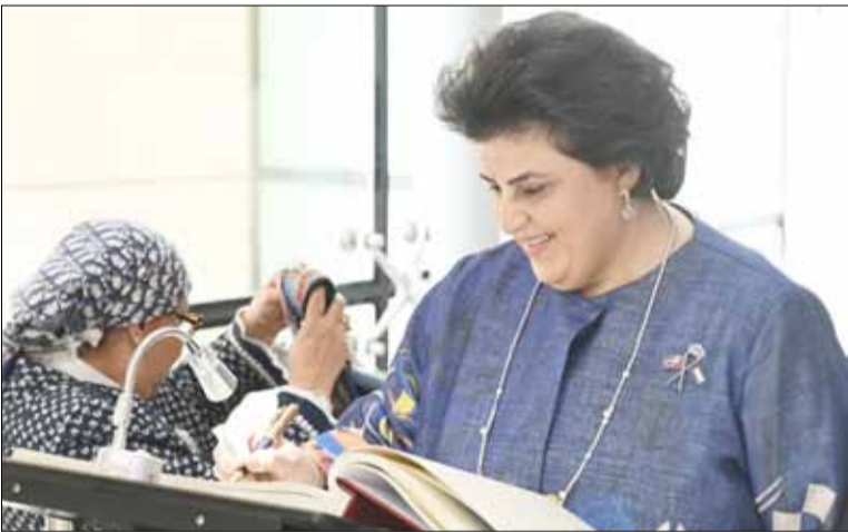
الشيخة هالة البدر تدون كلمة