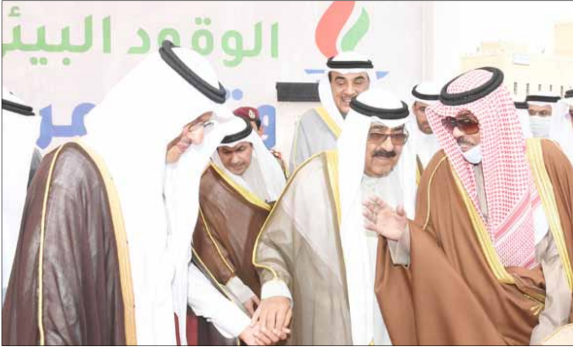
■ سمو الأمير الشيخ نواف الأحمد وسمو ولي العهد الشيخ مشعل الأحمد وصاحب السمو الملكي الأمير عبد العزيز بن سلمان