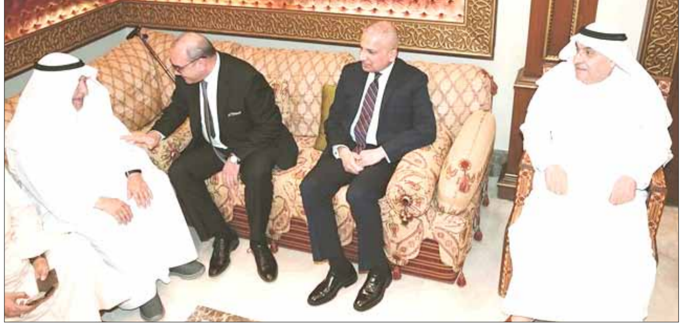
■ العم علي الغانم ومحمد الصقر والسفير العراقي المنهل الصافي والوزير المفوض محمد رضا الحسيني أثناء حفل الاستقبال