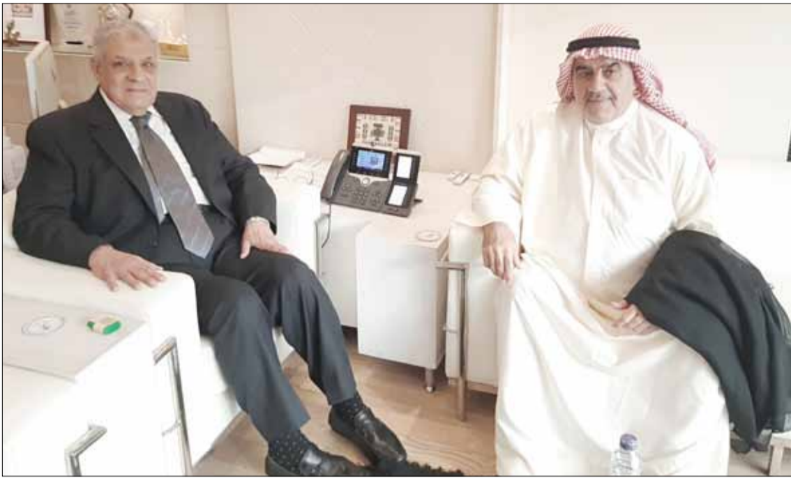
م. إبراهيم محلب أثناء استقباله أحمد اسماعيل بهبهاني

والاعتزاز، ويفتح آفاقاً جديدة في الشقيقتين. والتعاون الاقتصادي المشترك بين بين وفي نهاية اللقاء، تقدم بهبهاني بالشكر دولة الكويت وجمهورية مصر العربية للمهندس إبراهيم محلب على حفاوة