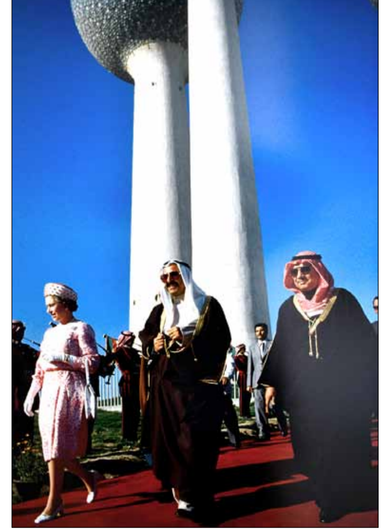
صورة تاريخية لزيارة الملكة إليزابيث الثانية لأبراج الكويت

وقالت على هامش حضورها افتتاح معرض زيارة الملكة إليزابيث الثانية أبراج الكويت في فبراير