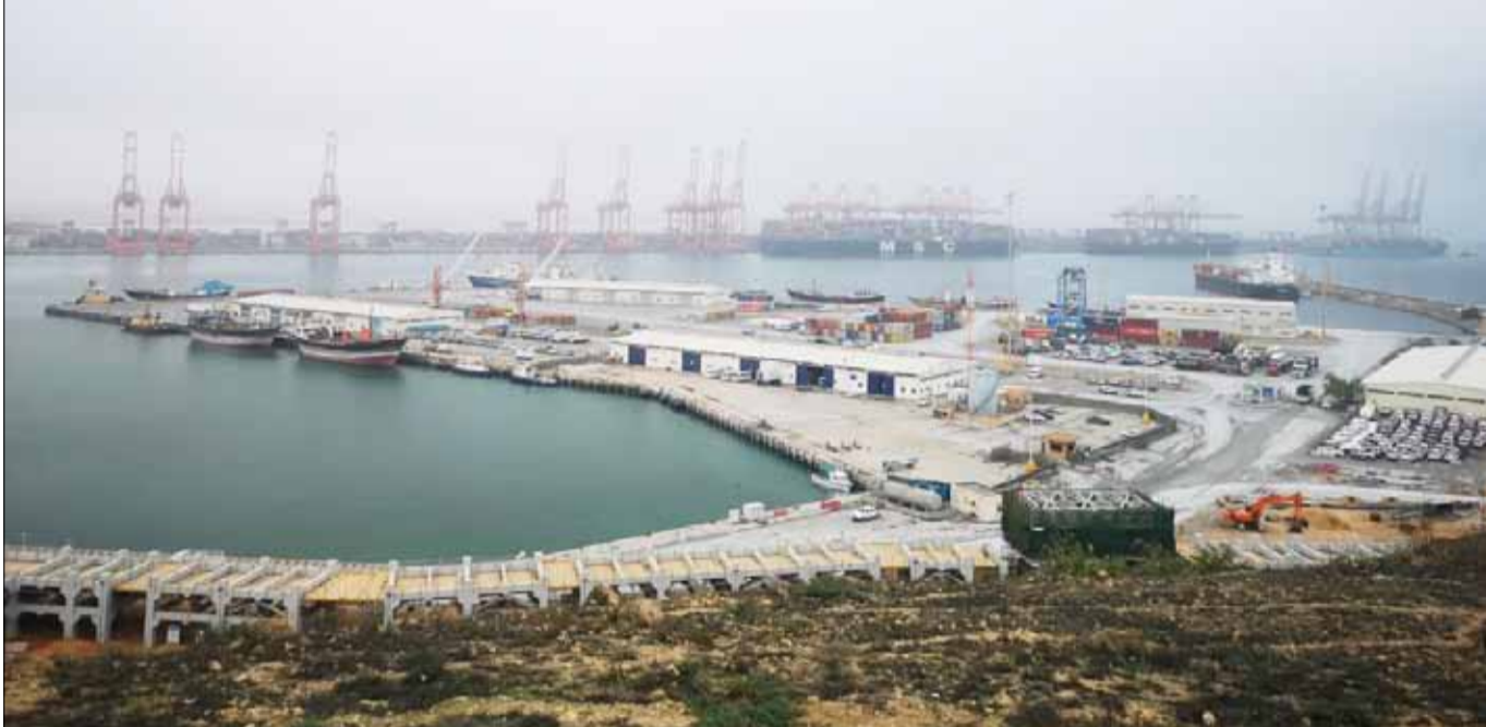
■ مشروعات وفرص واعدة في سلطنة عمان في الموانئ والمناطق الحرة