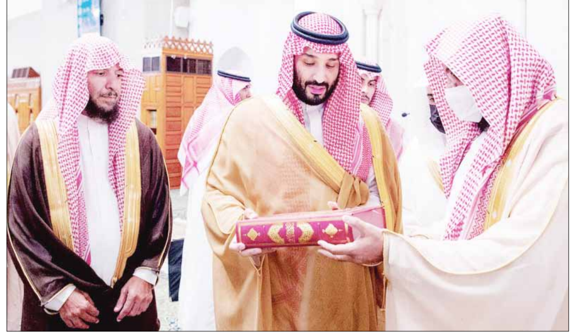
صاحب السمو الملكي الأمير محمد بن سلمان يتلقى هدية تذكارية من أئمة ومشايخ مسجد قباء