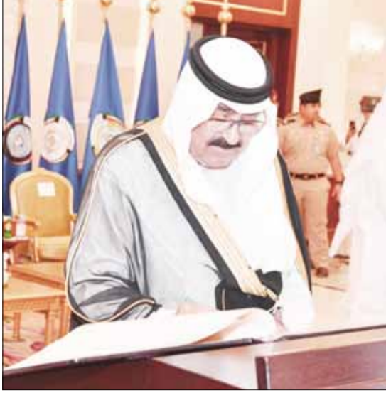
■ ممثل سمو الأمير سمو ولي العهد الشيخ مشعل الأحمد يدون كلمة في سجل الزيارات