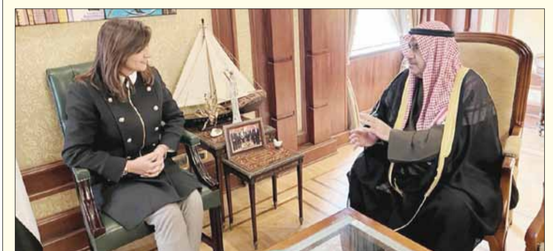
السفيرة نبيلة مكرم وحديث مع أحمد اسماعيل بهبهاني

استقبل المهندس إبراهيم محلب رئيس مجلس الوزراء المصري الأسبق ومساعد رئيس الجمهورية للمشروعات القومية سابقاً، والرئيس التنفيذي لمجموعة بيت الخبرة بمكتبه في القاهرة أحمد اسماعيل بهبهاني رئيس اللجنة المنظمة لمعرض الكويت للطيران ورئيس تحرير "الخليج" الكويتية بمناسبة زيارته إلى القاهرة. تناول اللقاء العلاقات الكويتية المصرية الوطيدة الراسخة والتي تضرب بجذورها في أعماق التاريخ وعددا من الموضوعات ذات الاهتمام المشترك وأكد بهبهاني على خصوصية العلاقات الكويتية المصرية مضيفاً أنها تعتبر نموذجاً يحتذى به في العلاقات بين الدول من حيث التعاون المثمر والقواسم المشتركة والتوافق في وجهات النظر والرؤى تجاه قضايا المنطقة المختلفة، والدعم المتبادل لمواقف دولة الكويت وجمهورية مصر العربية في المحافل