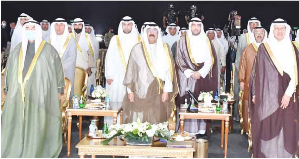
■ سمو ولي العهد الشيخ مشعل الأحمد وسمو الشيخ ناصر المحمد وصاحب السمو الملكي الأمير عبدالعزيز بن سلمان