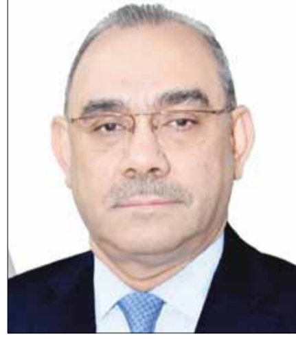
■ السفير العراقي المنهل الصافي