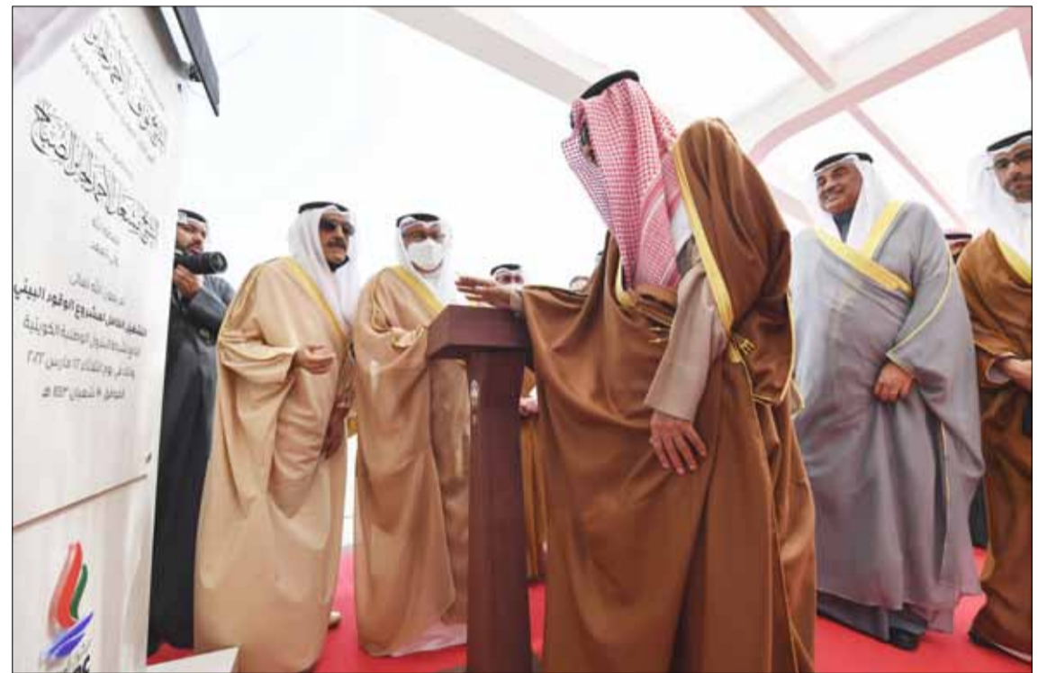
■ سمو الأمير الشيخ نواف الأحمد خلال إزاحة الستار عن اللوحة التذكارية لمشروع الوقود البيئي

الانبعاثات، وأكثر التزاما بمعايير الجودة والسلامة العالمية. وأوضح سمو ولي العهد «أن الكويت تترجم اليوم لشعبها الكريم ولدول العالم وشعوبها تطلعتنا الطموح إلى تحقيق استراتيجية تنموية واضحة الخطى، تعزز مكانة دولة الكويت ووضعها في مصاف الدول المتقدمة في صناعة تكرير النفط العالمية، ونؤكد اليوم توجهنا الواضح وأولويتنا القصوى لخلق فرص عمل جديدة لأبناء الكويت، وتمكينهم من العمل في أهم قطاع حيوي ومورد أساسي في بلدهم وليكونوا شركاء في تحقيق عوائد ربحية تحقق لدولة الكويت والعالم أجمع الرخاء والتطور في كافة أوجه الحياة واقتصاداتها».