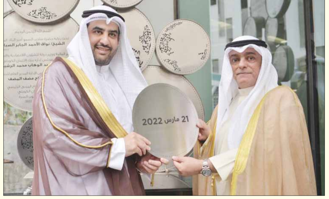
■ وزير المالية عبد الوهاب الرشيد يتلقى درعاً تذكارية من مدير عام بنك الائتمان صلاح المصنف

وتابع أن رأسمال «السفن» صغير ويسمح بزيادته مستقبلاً لاستغلال أي خطط، ولكن وفقاً للمعايير وحسب الإجراءات الرقابية المتبعة