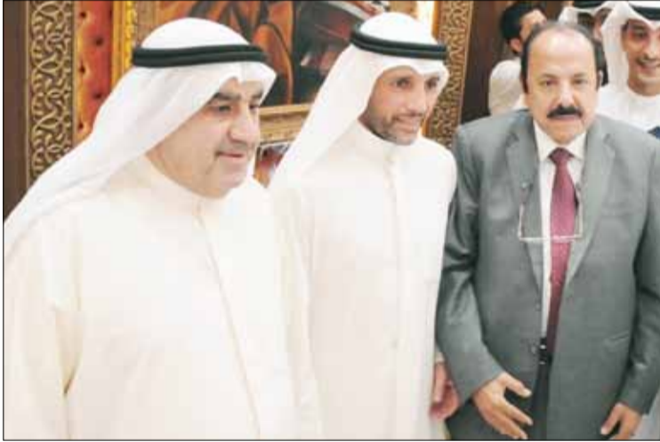
■ أحمد إسماعيل بههاني ويسام القصاص بهنتان مرزوق الغانم

أكد رئيس مجلس الأمة مرزوق علي الغانم على أنه سيكُون عند حسن ظن الشعب الكويتي وسيبقى ممثلاً لإرادتهم وسوراً صامداً من أجل حفظ أمن واستقرار دولة الكويت. وأعرب الغانم عن شكره وتقديره الكبيرين لكل من حضر ومن لم يستطع الحضور للغبقة الرمضانية التي أقامها في ديوان علي الغانم بضاحية عيد الله السالم. وقال الغانم في تصريح صحافي عقب الغبقة «لا أجد من الكلمات ما يعبر عن تقديري واحترامي وامتناني للكرم الذي كرمني به الشعب الكويتي في