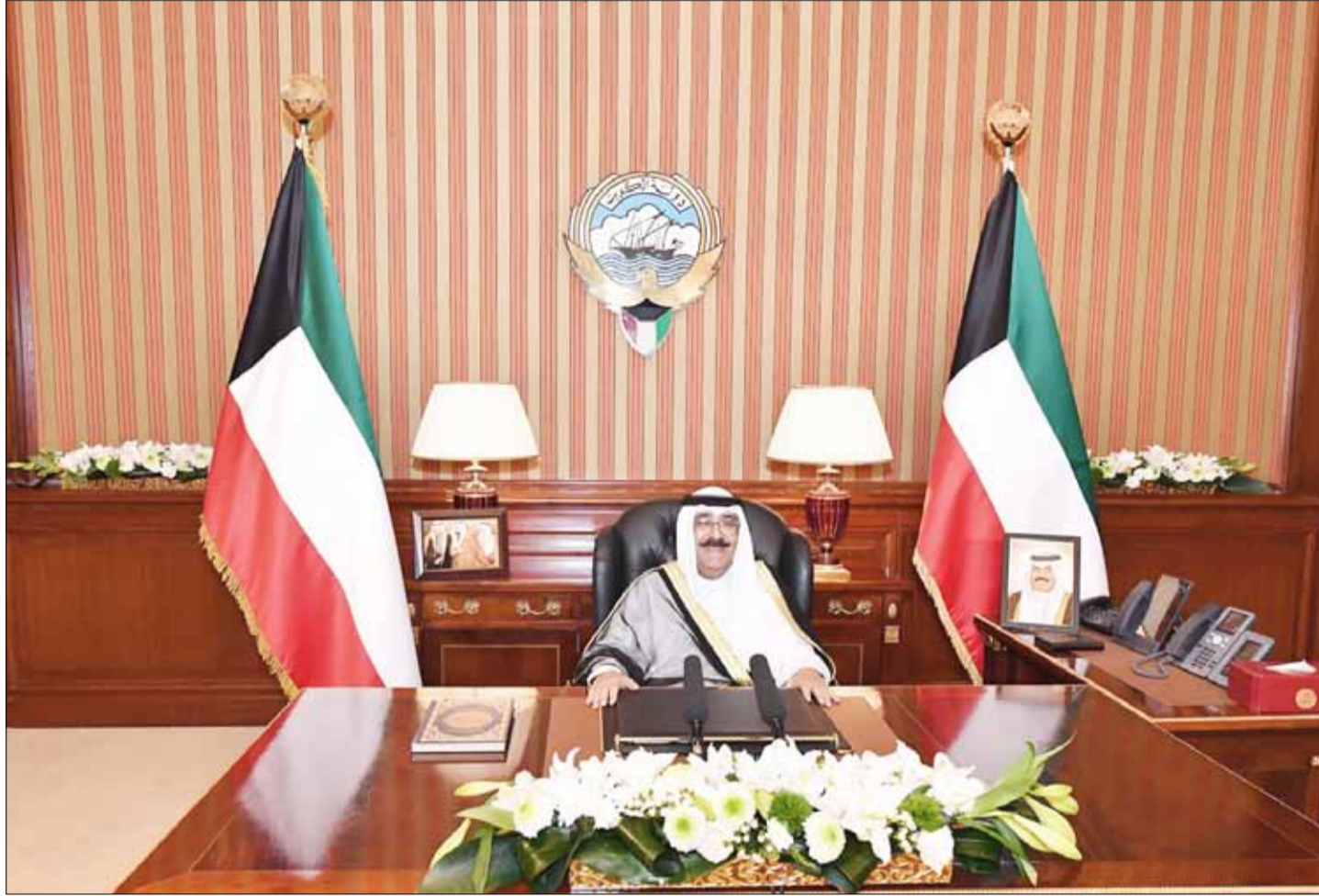
■ سمو ولي العهد الشيخ مشعل الأحمد الجابر الصباح يلقي كلمة سمو أمير البلاد بمناسبة العشر الأواخر من شهر رمضان المبارك

الكويت تتطلع دائماً إلى مزيد من النهضة والتقدم قائمة بدورها الخليجي والدولي مع الأشقاء والأصدقاء