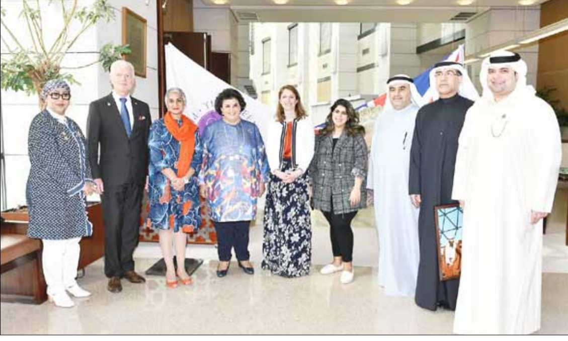
السفيرة البريطانية بيلندا لويس والشيخة هالة البدر وأحمد إسماعيل بهبهاني ود. عيسى الأنصاري وعيسى دشتي والسفيرة الكندية عليا مواني والسفير الألماني ستيفان موبس