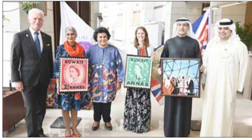
السفيرة البريطانية بيلندا لويس والشيخة هالة البدر والسفيرة الكندية عليا مواني والسفير الألماني ستيفان موبس ود. عيسى الأنصاري وعيسى دشتي