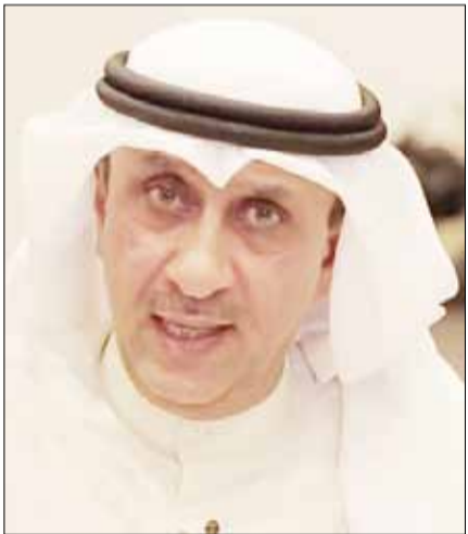
■ اللواء م. فيصل الجزار

فيصل الغريب: إسهامات مميزة في تعزيز المسيرة الإعلامية