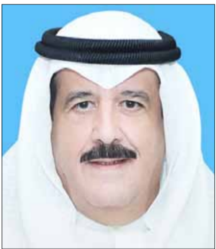
■ المستشار فيصل الغريب

السفير القطري: التزمت بقواعد الحرية المسؤولة ومبادئ العمل الإعلامي الراقي