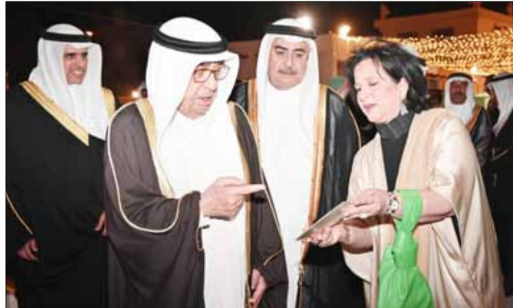
سمو الشيخ محمد بن مبارك آل خليفة والشيخ خالد بن أحمد آل خليفة والشقيقة مي بنت محمد آل خليفة وزير الإعلام على الريميحي