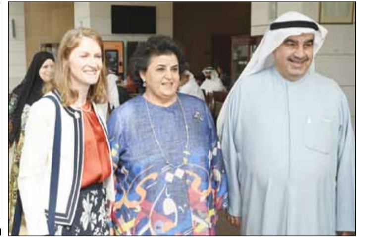
أحمد إسماعيل بهبهاني والشيخة هالة البدر والسفيرة البريطانية بيلندا لويس