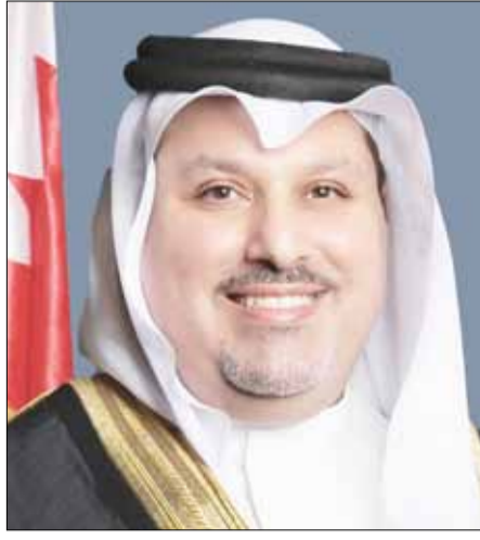
السفير البحريني صلاح المالكي