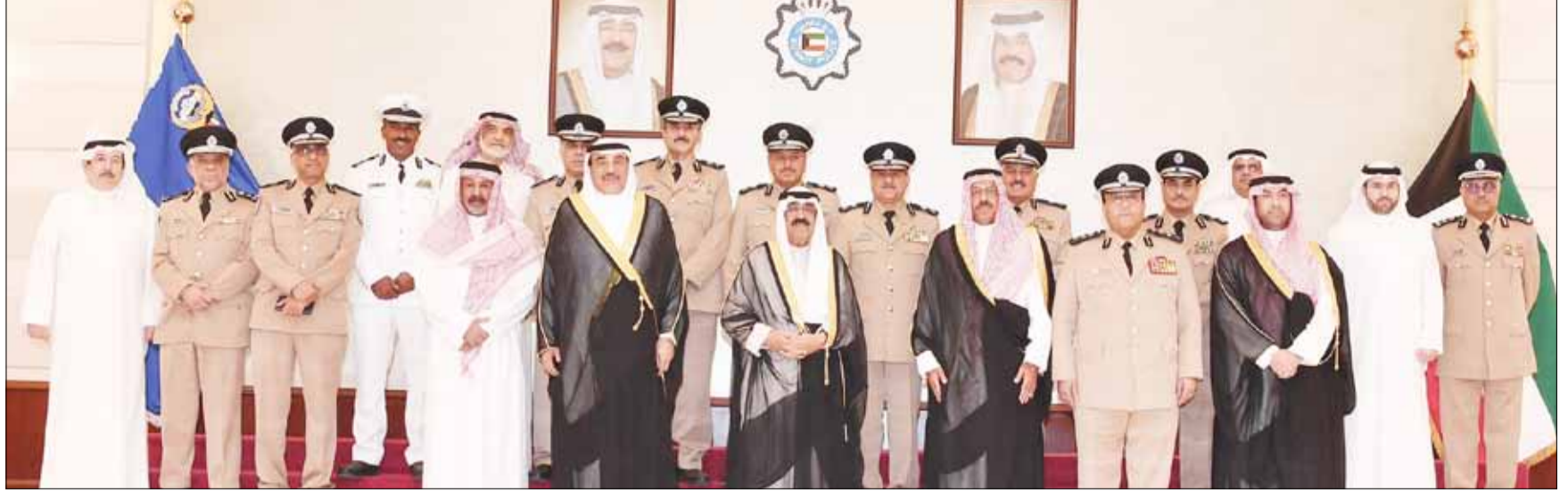
■ ممثل سمو الأمير سمو ولي العهد الشيخ مشعل الأحمد وسمو رئيس مجلس الوزراء الشيخ صباح الخالد والفريق أول متقاعد الشيخ أحمد النواف والفريق سالم النواف والفريق أنور البرجس والشيخ مبارك سالم العلي ووكلاء وزارة الداخلية المساعدون وعدد من كبار قيادات الداخلية